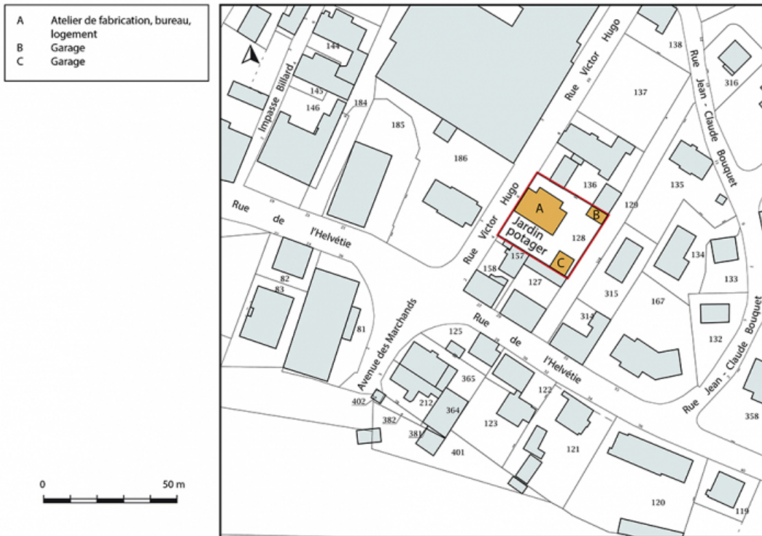
Plan-masse et de situation. Extrait du plan cadastral, 2018, section AF, 1/1 000. 25, Morteau, 6 rue Victor Hugo