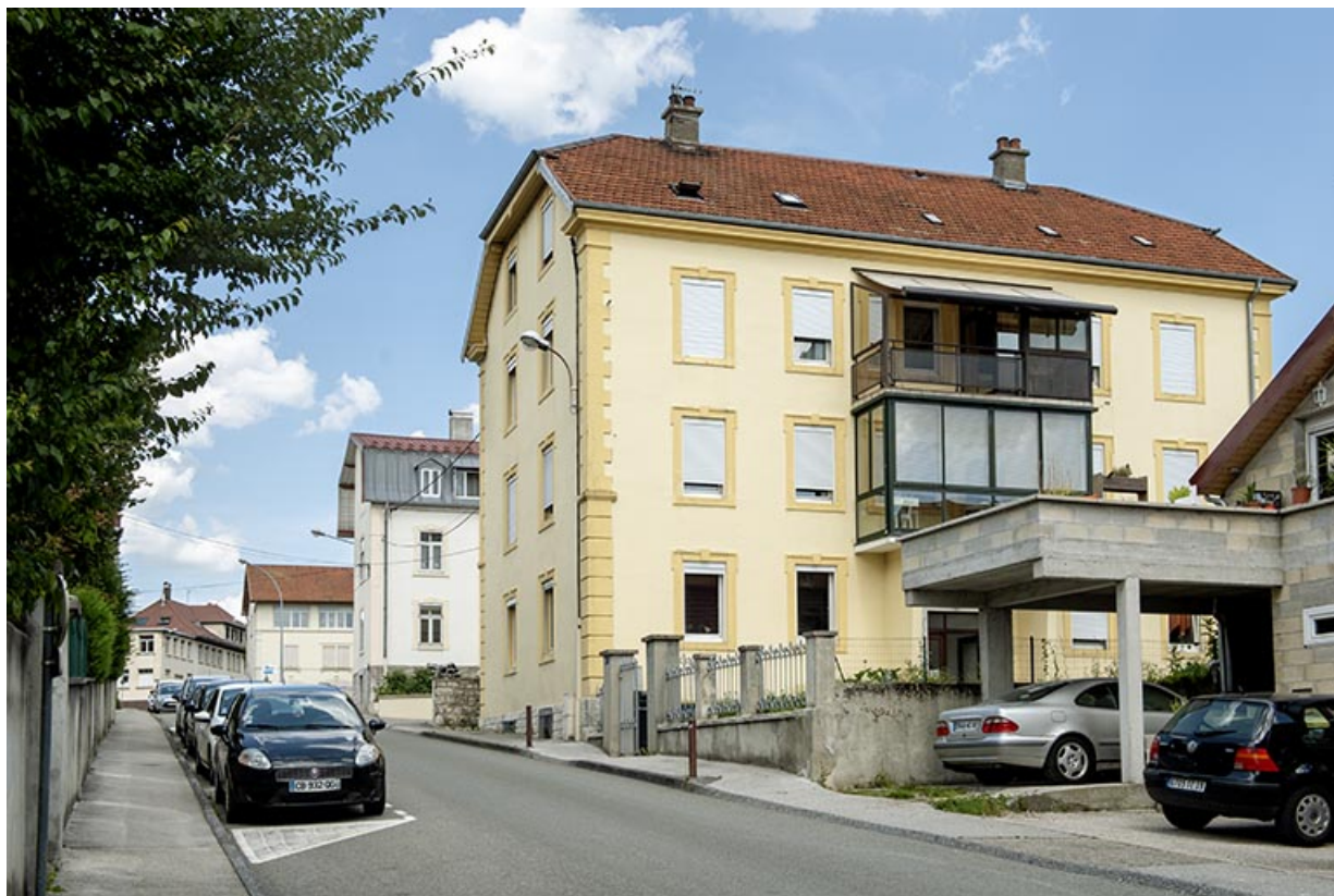
Vue d'ensemble de la rue Victor Hugo, avec l'immeuble au premier plan. 25, Morteau, 6 rue Victor Hugo