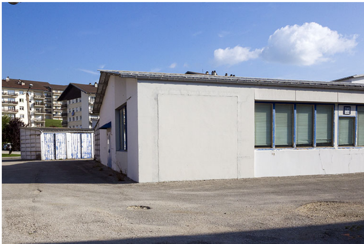
Bâtiment en rez-de-chaussée : extrémité occidentale.