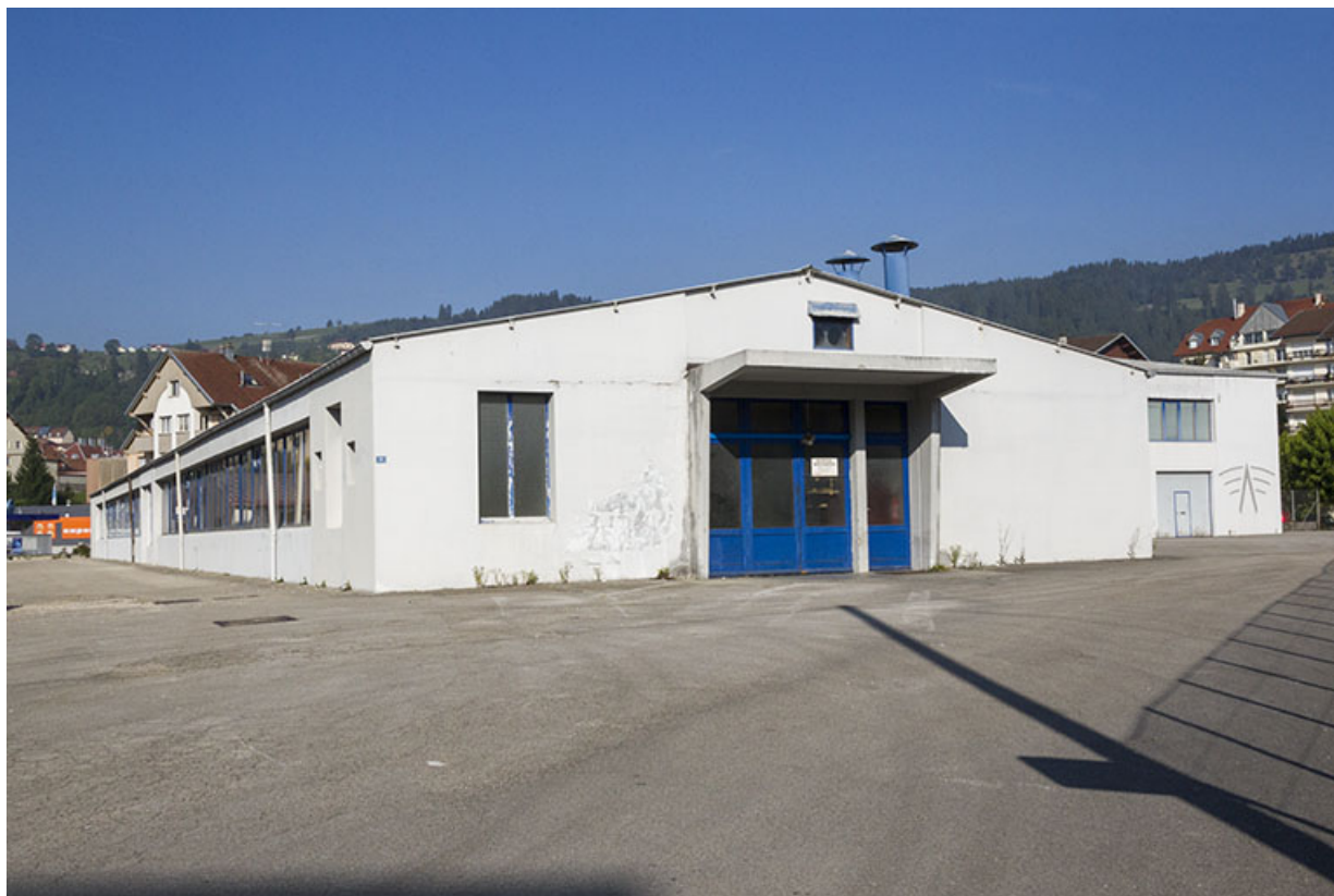
Bâtiment en rez-de-chaussée : extrémité orientale.