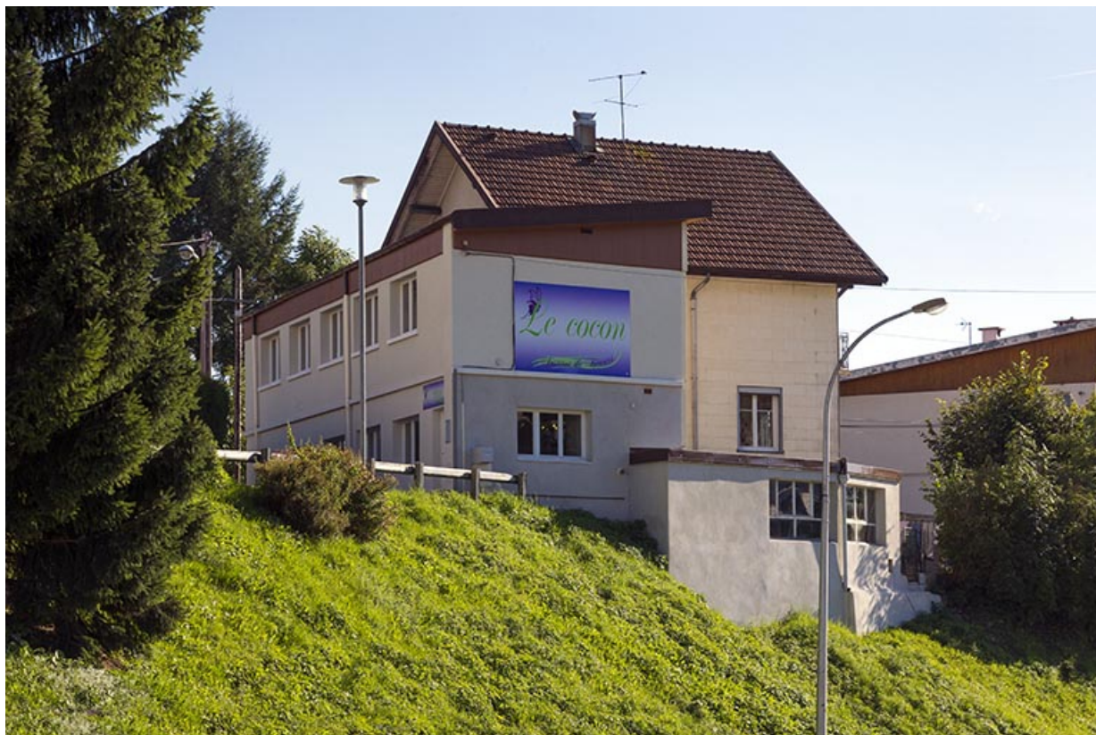
Atelier, garage et maison : élévation nord. 25, Morteau, 19 rue Jean-Claude Bouquet