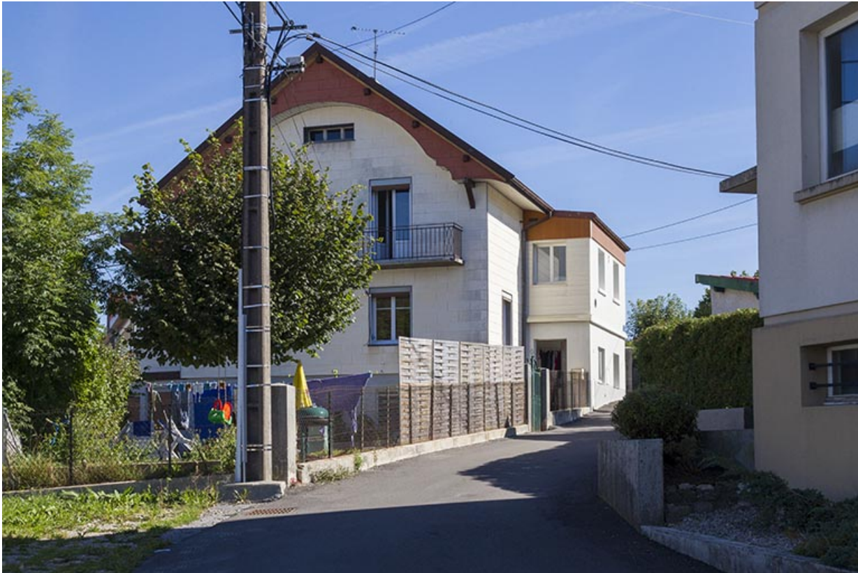
Maison : élévation ouest.