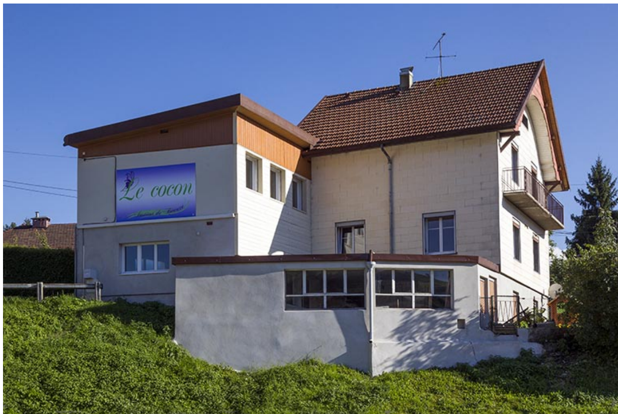
Atelier, garage et maison : élévations nord et ouest.