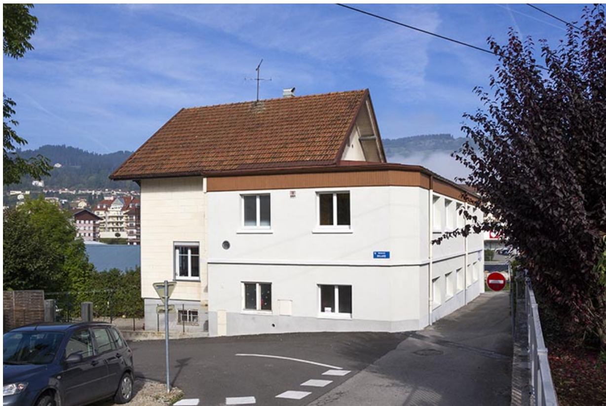
Atelier et maison : élévation sud.