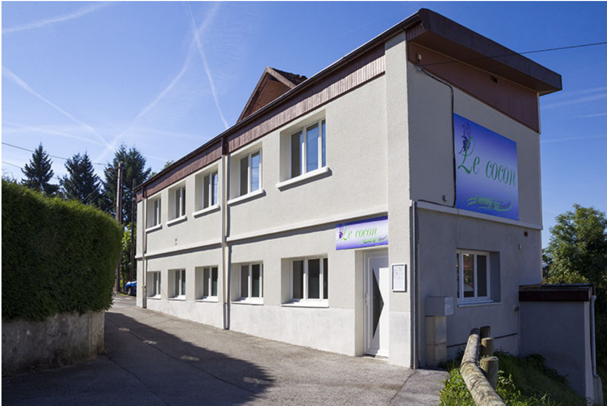
Atelier : élévations nord et est.