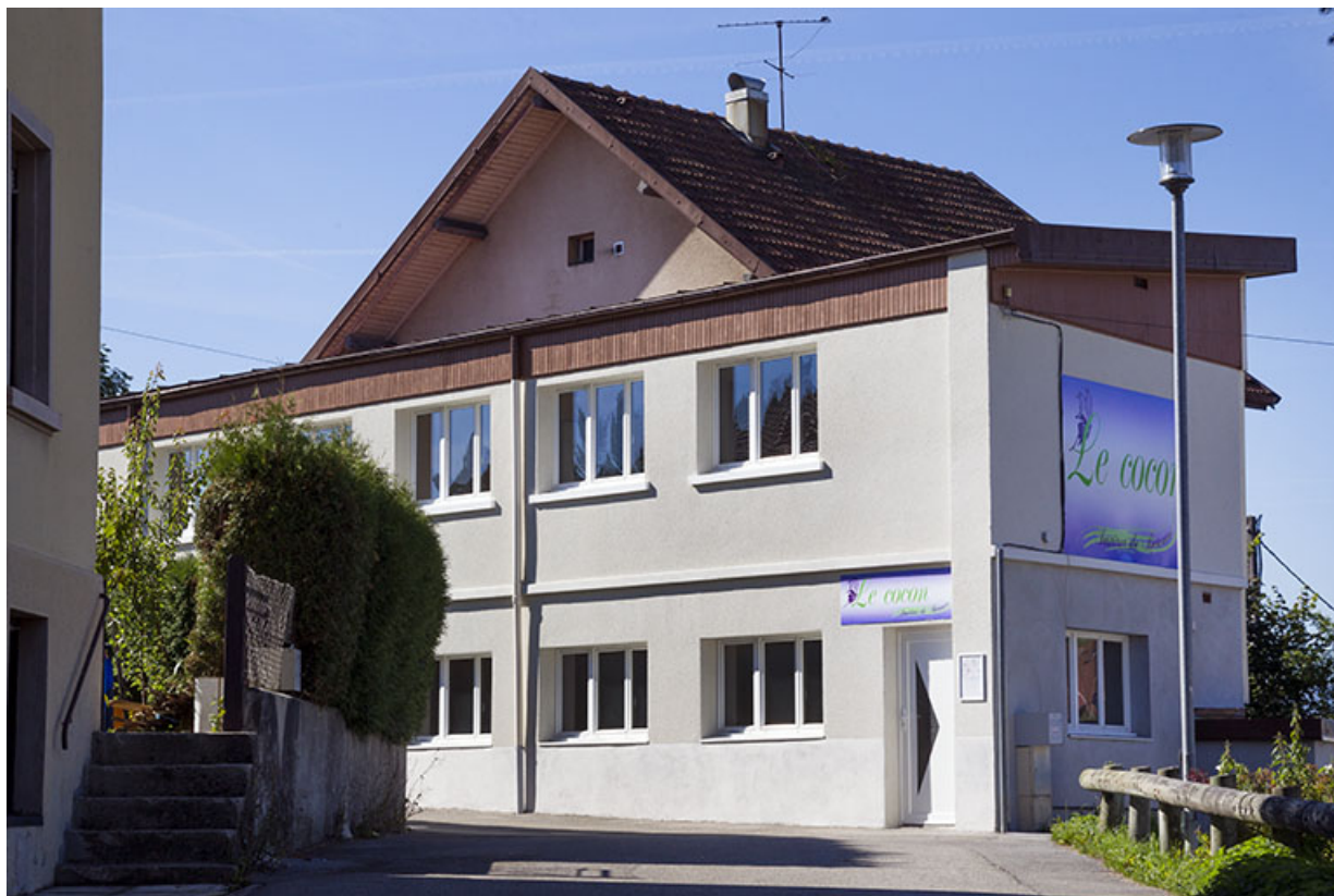
Atelier : élévations nord (partielle) et est. 25, Morteau, 19 rue Jean-Claude Bouquet