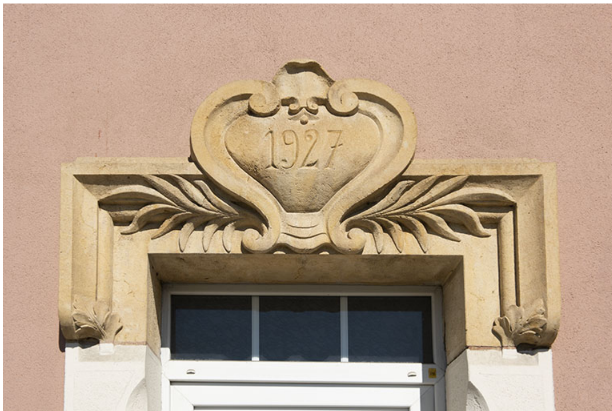
Façade antérieure : linteau daté 1927.