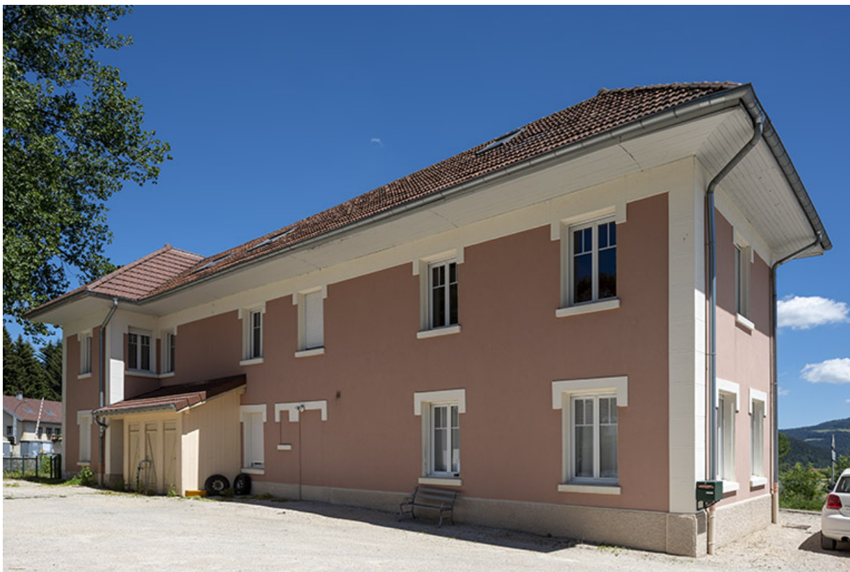
Façade postérieure, de trois quarts droite.