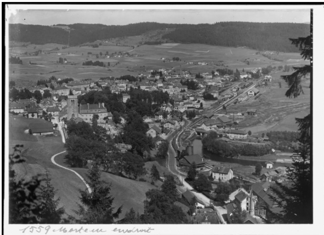
[Vue d'ensemble de Morteau, depuis la Table du Roi à l'ouest], milieu 20e siècle. 25, Morteau, 1-4 rue de la Brasserie