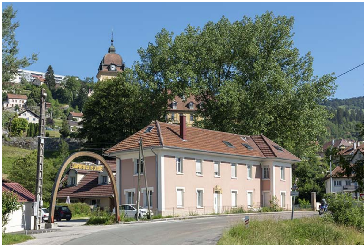
Vue d'ensemble, depuis le sud. 25, Morteau, 4 rue du Pont rouge