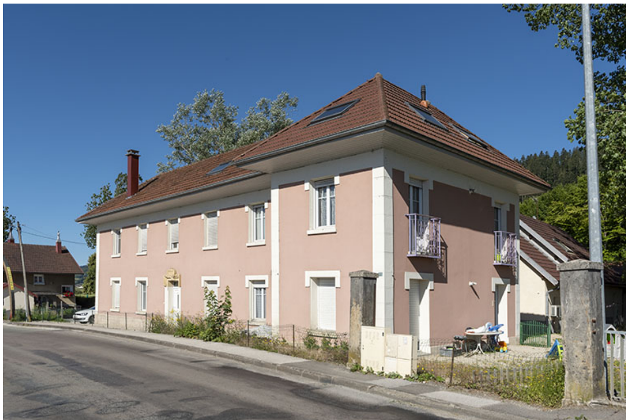
Façade antérieure, de trois quarts droite.