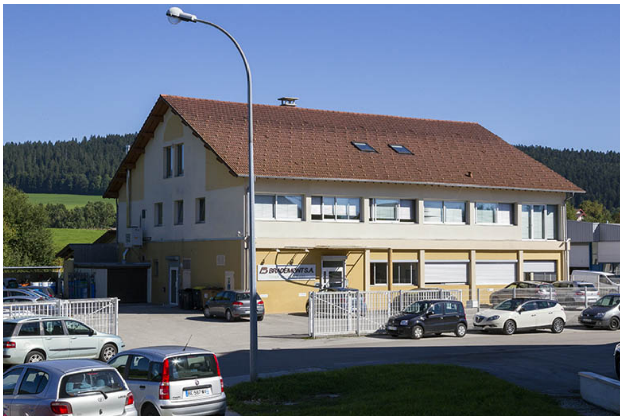
Façades antérieure et latérale gauche.