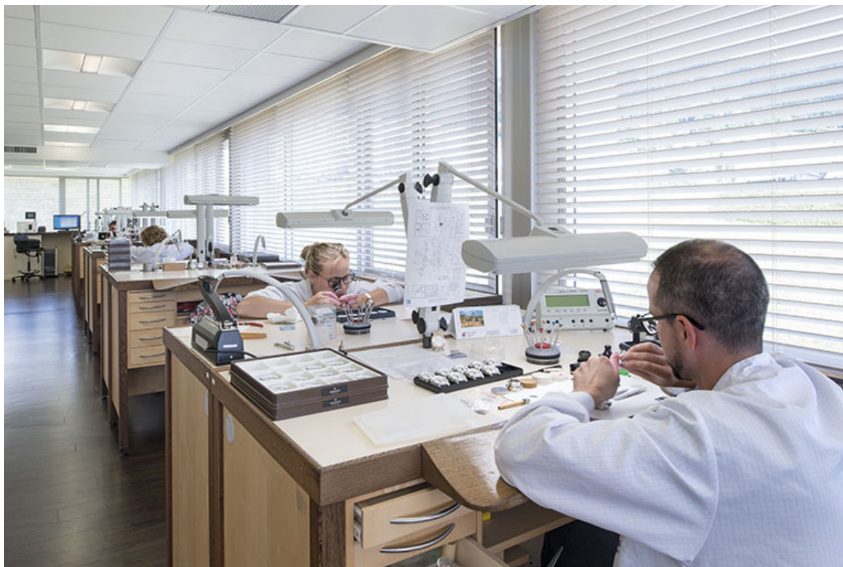
Horlogers à l'établi. 25, Morteau