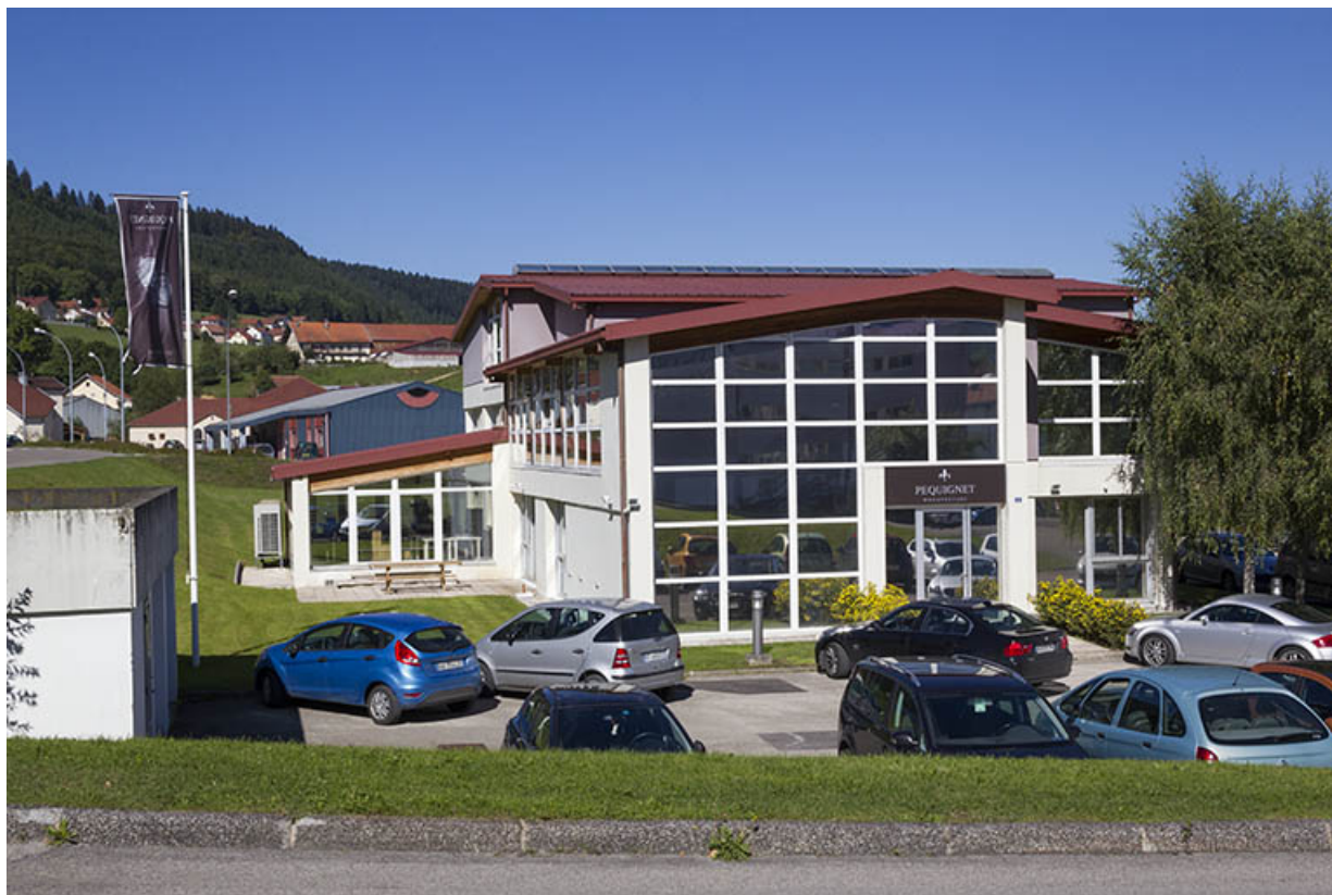
Vue d'ensemble, depuis le sud (façade antérieure).