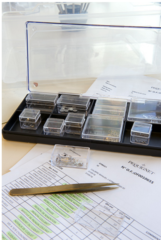
Kit de production (composants nécessaires au montage de 10 mouvements). 25, Morteau, 1 rue du Bief