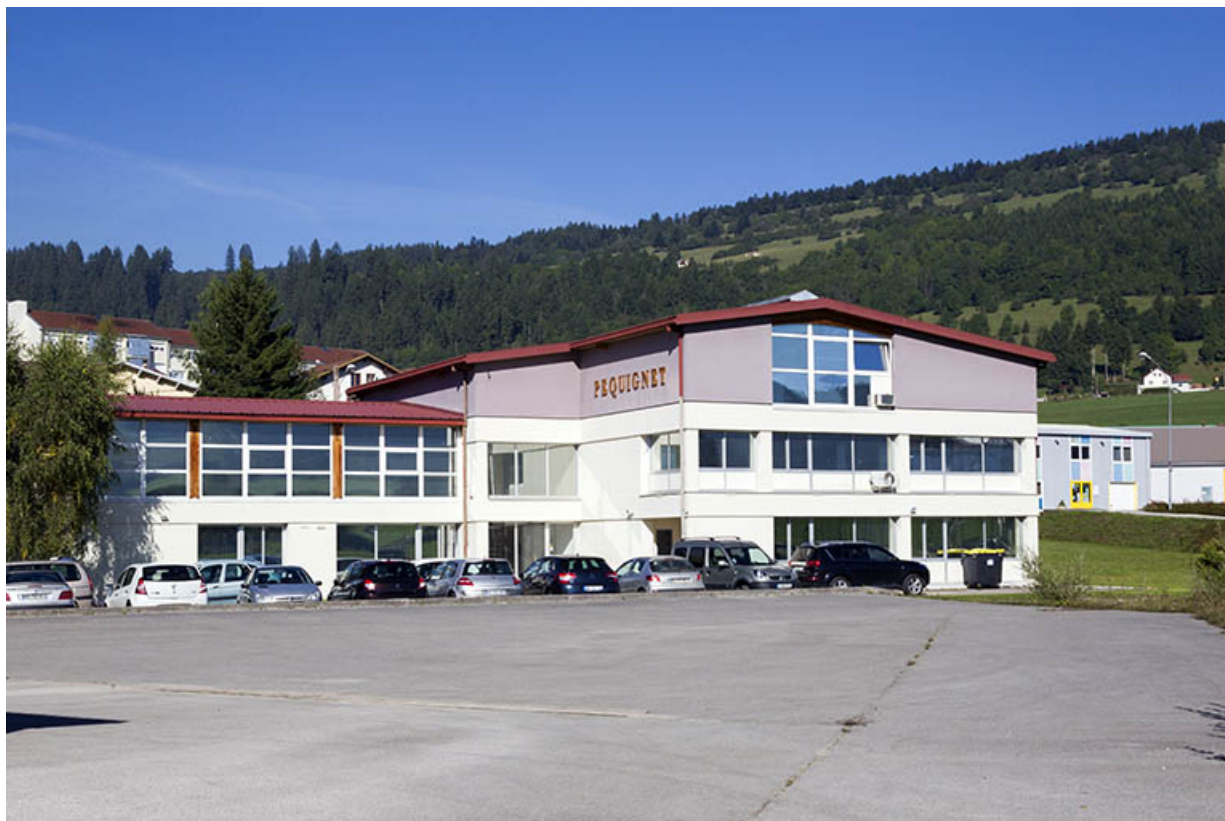
Façade latérale droite, de trois quarts gauche.