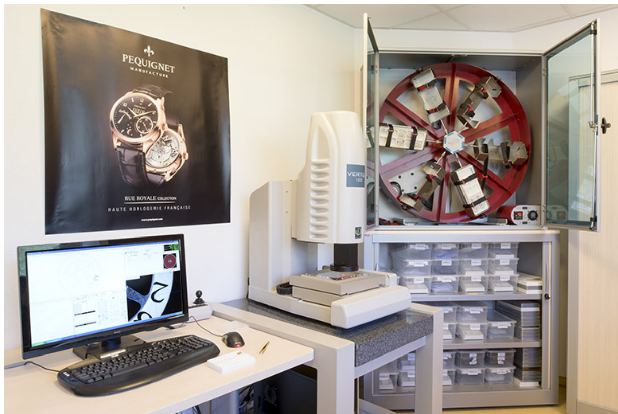
Laboratoire : machine de contrôle optique Micro.Vu (Vertex 120) et simulateur de mouvements VOH (Twistest). 25, Morteau, 1 rue du Bief