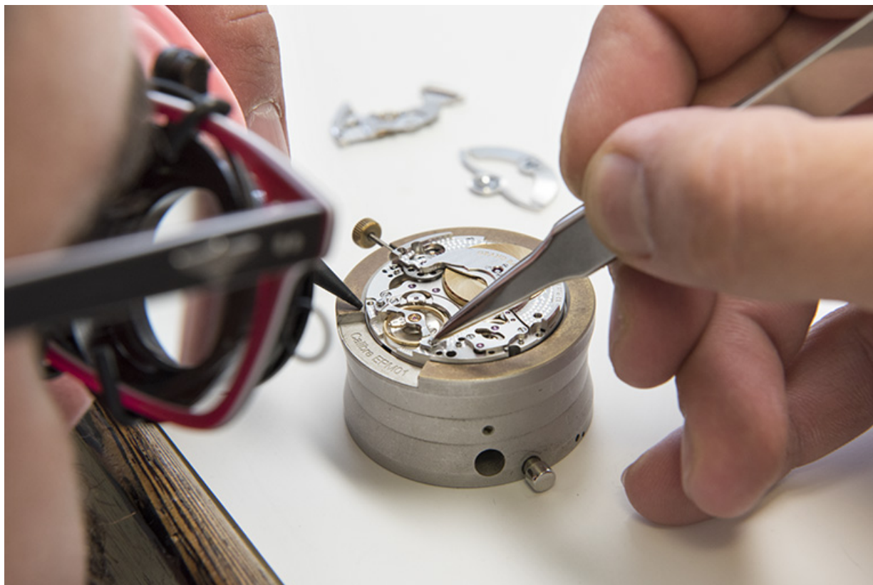
Usine de montres Péquignet, à Morteau.