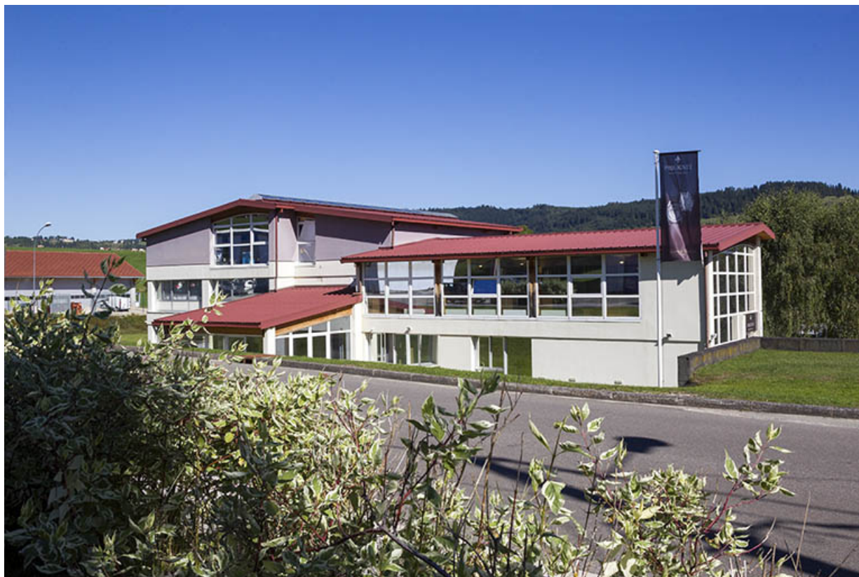
Façade latérale gauche, de trois quarts droite. 25, Morteau