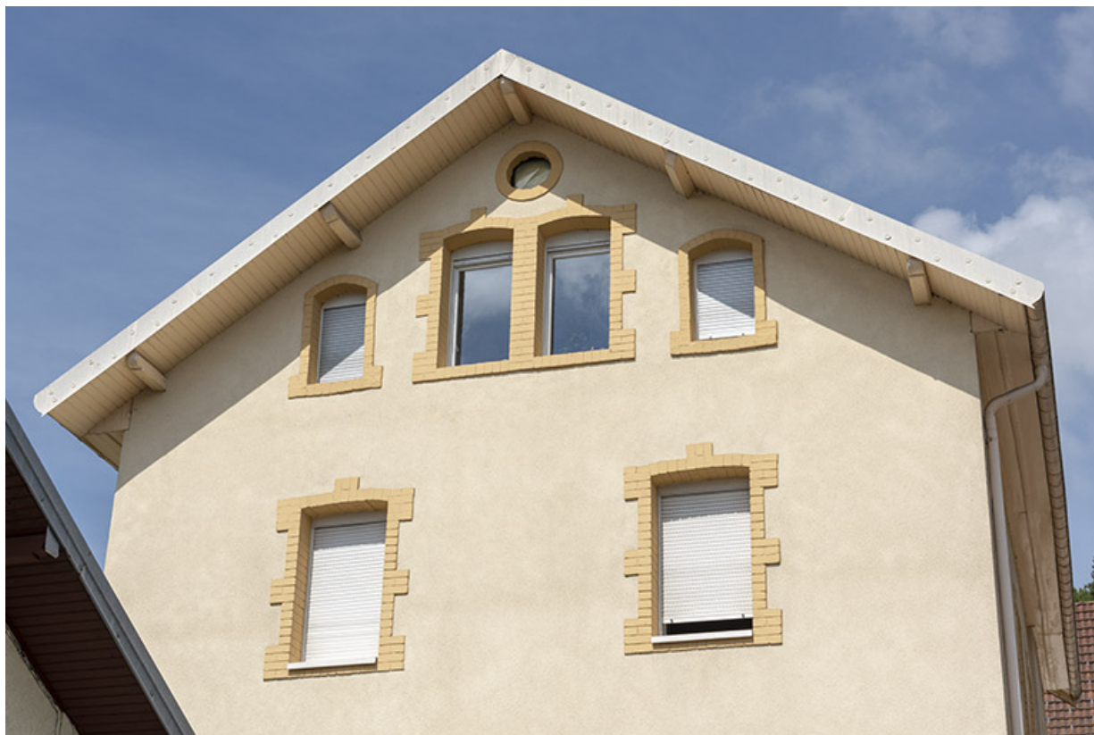
Façade latérale gauche : pignon avec fenêtre horlogère. 25, Morteau, 31 rue Neuve