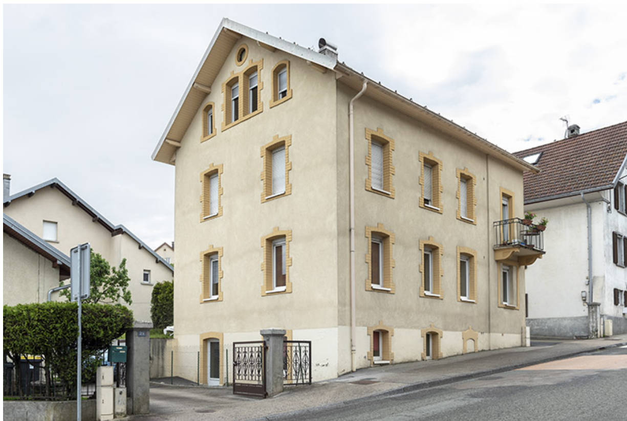
Façades antérieure et latérale gauche.