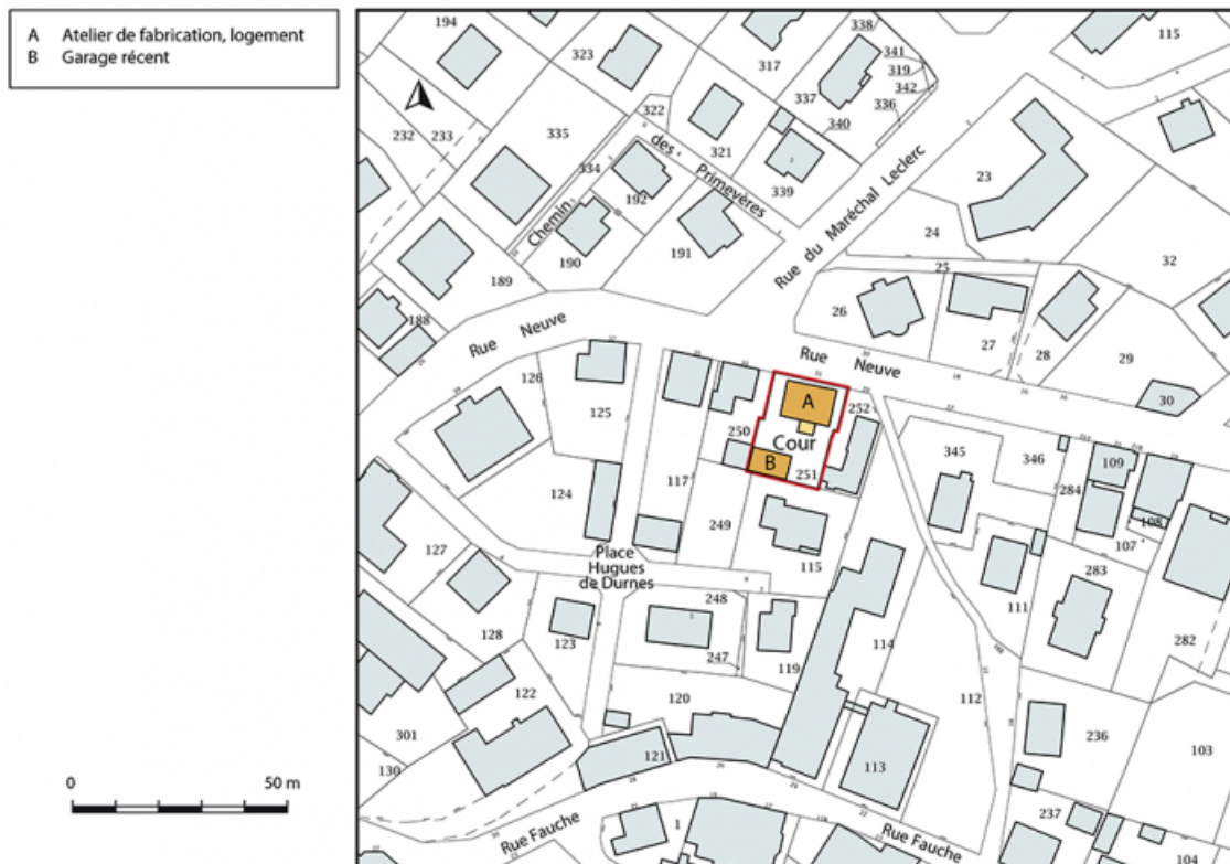
Plan-masse et de situation. Extrait du plan cadastral, 2018, section AC, 1/1 000. 25, Morteau, 31 rue Neuve