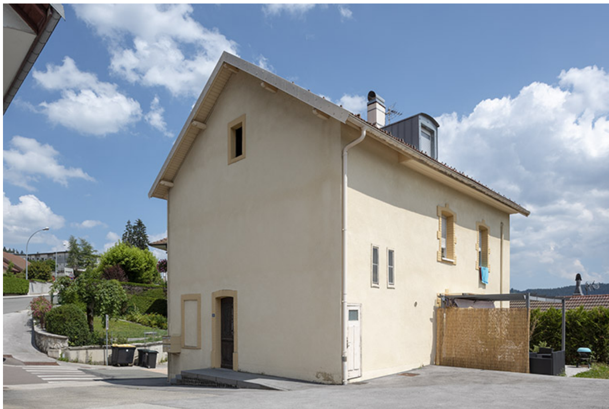
Façades postérieure et latérale droite.