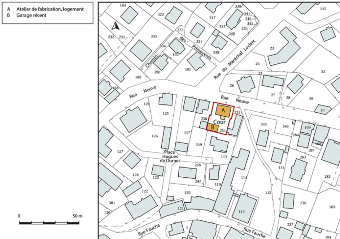
Plan-masse et de situation. Extrait du plan cadastral, 2018, section AC, 1/1 000. 25, Morteau, 31 rue Neuve