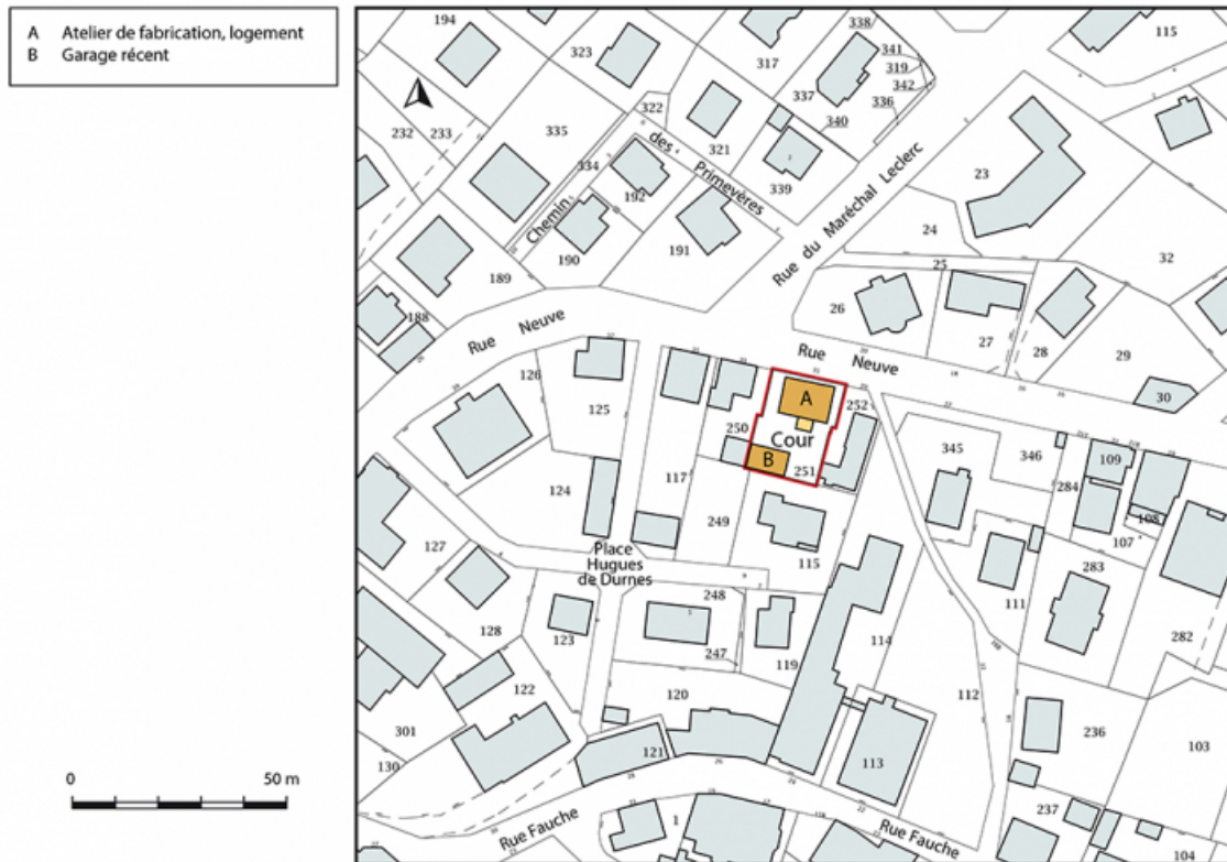
Plan-masse et de situation. Extrait du plan cadastral, 2018, section AC, 1/1 000. 25, Morteau, 31 rue Neuve