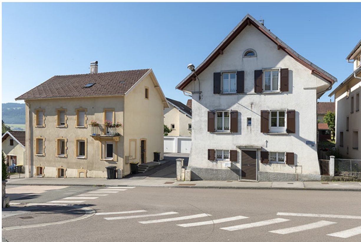
Vue d'ensemble, depuis le nord.