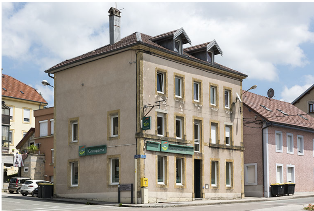
Vue d'ensemble, de trois quarts gauche. 25, Morteau, 27 rue de l' Helvétie