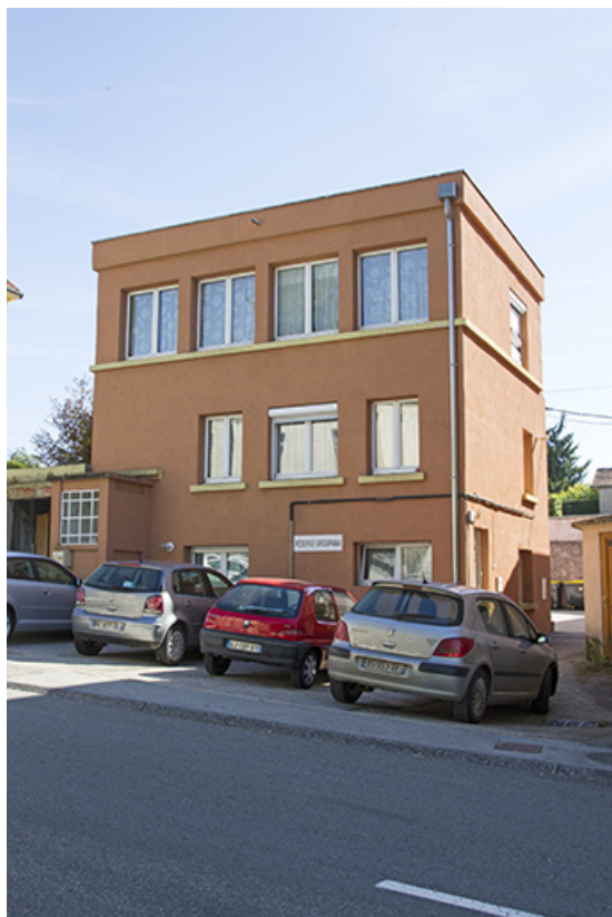
Atelier, de trois quarts droite. 25, Morteau, 27 rue de l' Helvétie