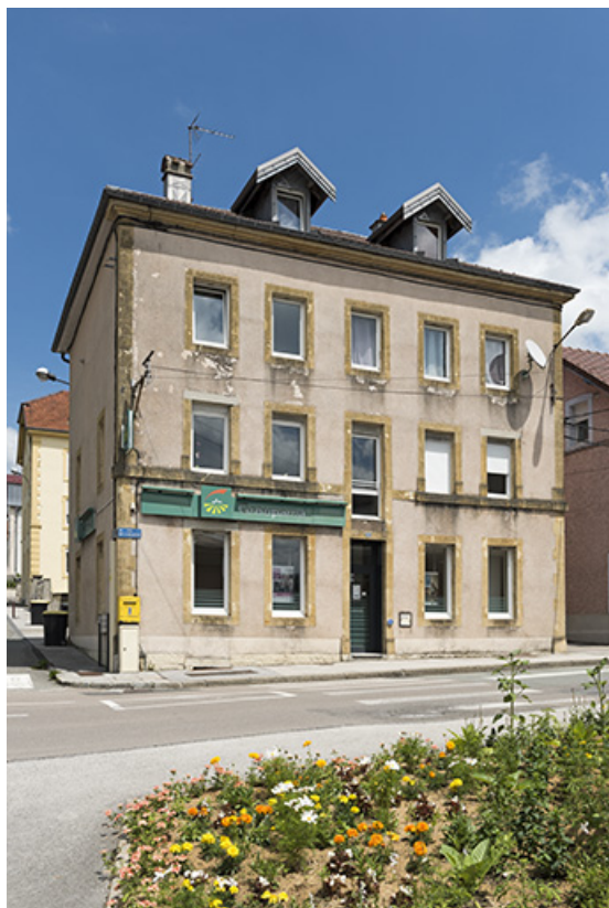
Immeuble : façade antérieure, de trois quarts gauche. 25, Morteau, 27 rue de l' Helvétie