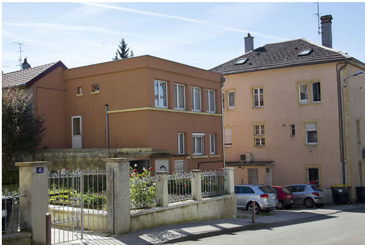
Vue d'ensemble, depuis la rue Victor Hugo. 25, Morteau