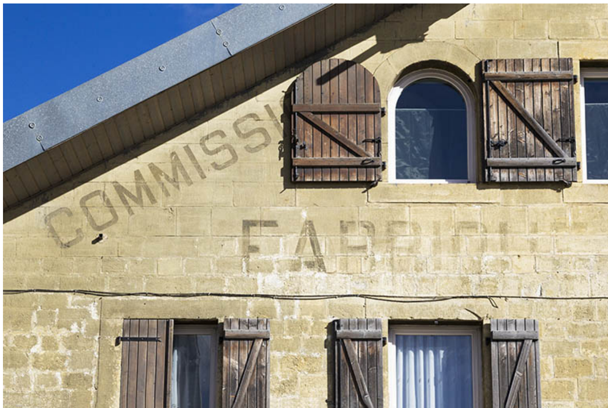
Façade antérieure : vestiges de l'inscription sous le rampant à gauche. 25, Morteau, 21 rue de l' Helvétie