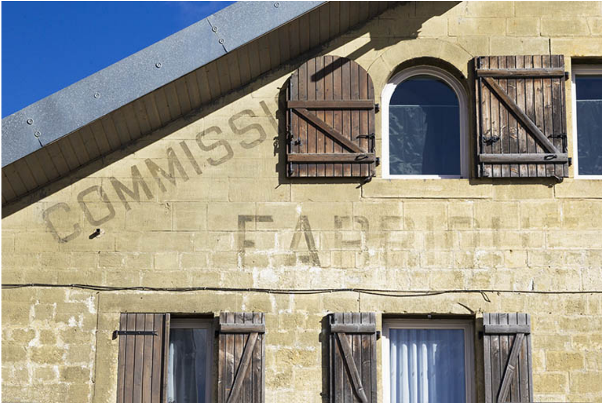
Façade antérieure : vestiges de l'inscription sous le rampant à gauche. 25, Morteau, 21 rue de l' Helvétie