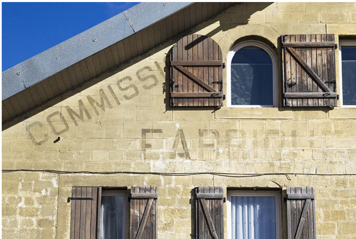
Façade antérieure : vestiges de l'inscription sous le rampant à gauche. 25, Morteau, 21 rue de l' Helvétie