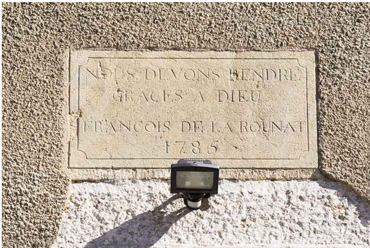
Façade latérale gauche : inscription et date 1785. 25, Morteau, 21 rue de l' Helvétie