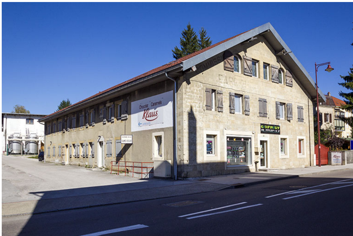
Façades antérieure et latérale gauche. 25, Morteau