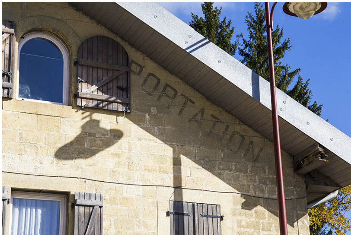
Façade antérieure : vestiges de l'inscription sous le rampant à droite. 25, Morteau, 21 rue de l' Helvétie