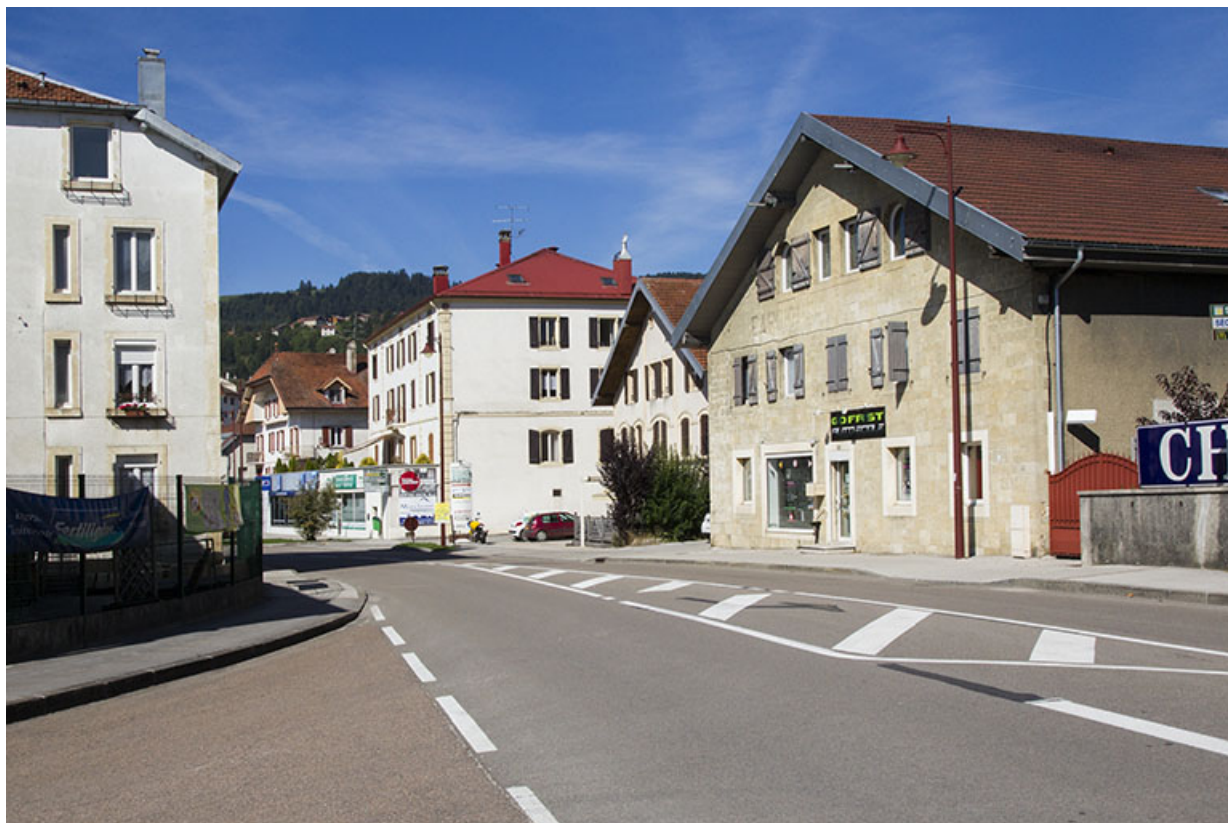
Vue d'ensemble, depuis l'est.