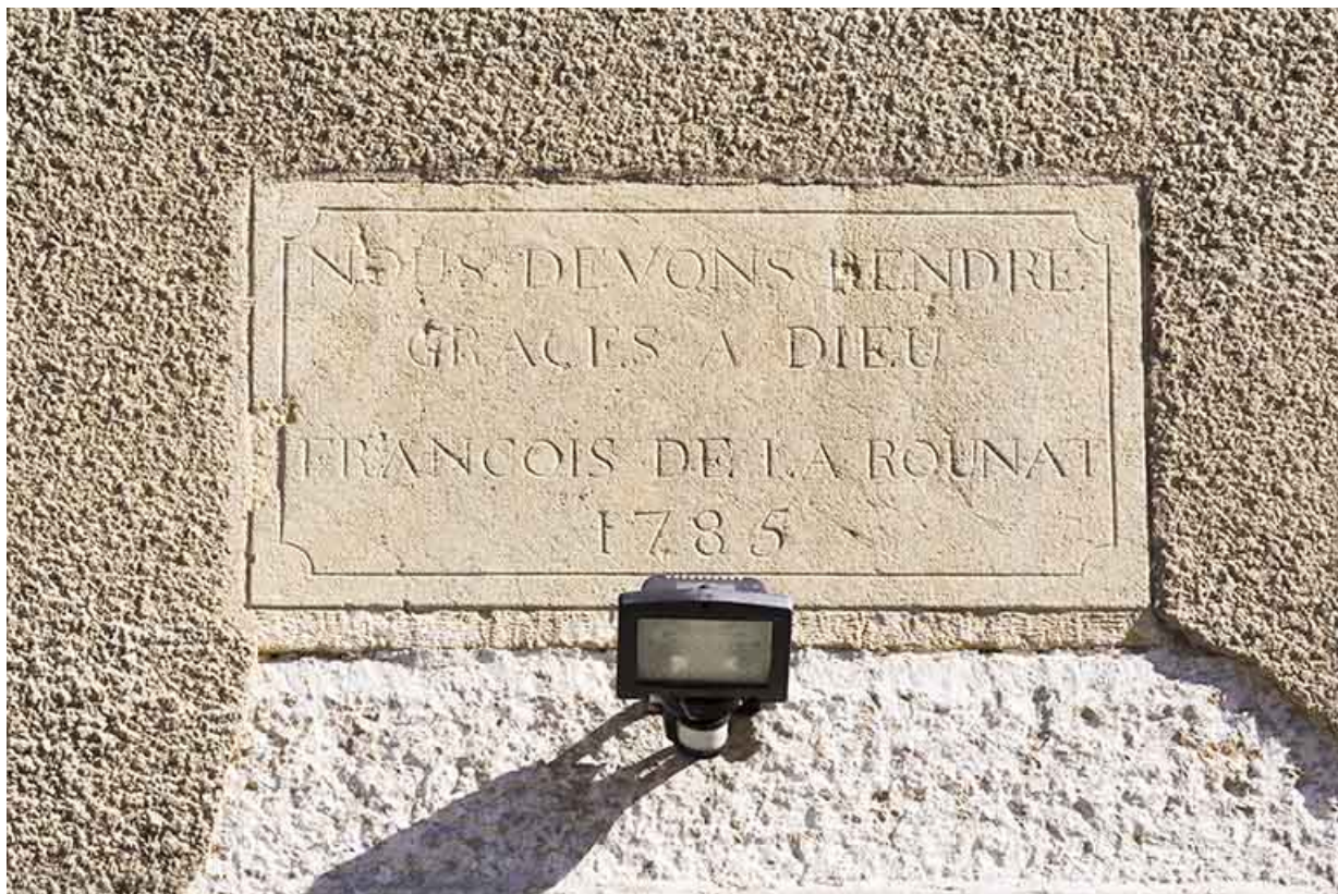
Façade latérale gauche : inscription et date 1785.