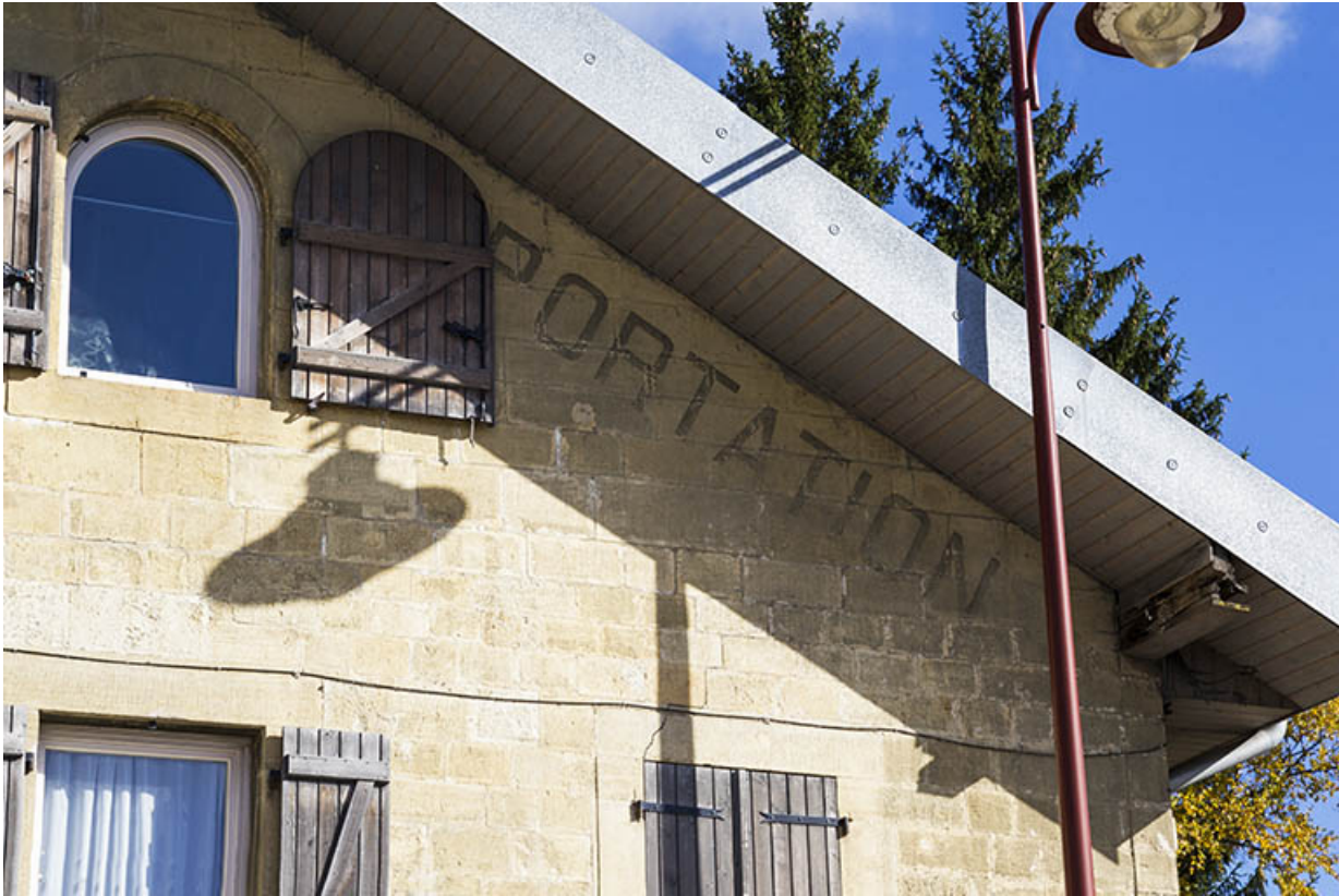
Façade antérieure : vestiges de l'inscription sous le rampant à droite.