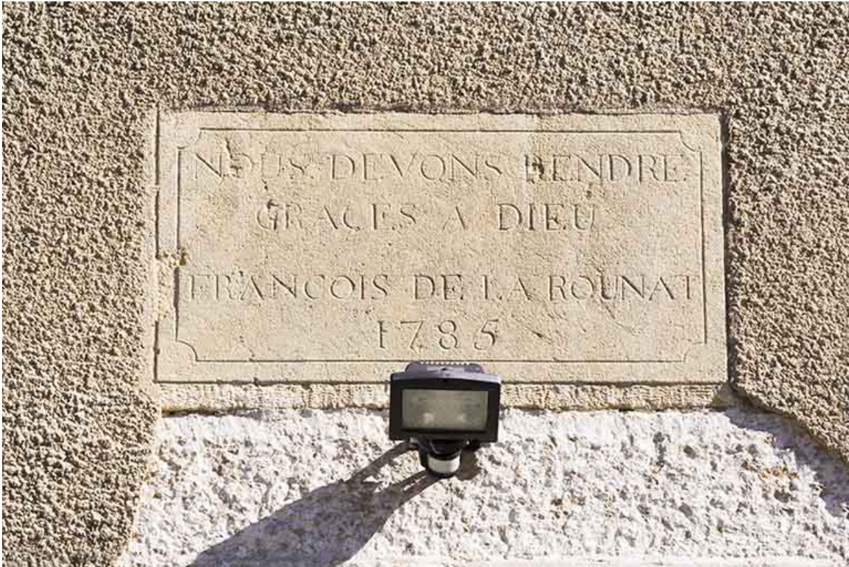
Façade latérale gauche : inscription et date 1785. 25, Morteau, 21 rue de l' Helvétie