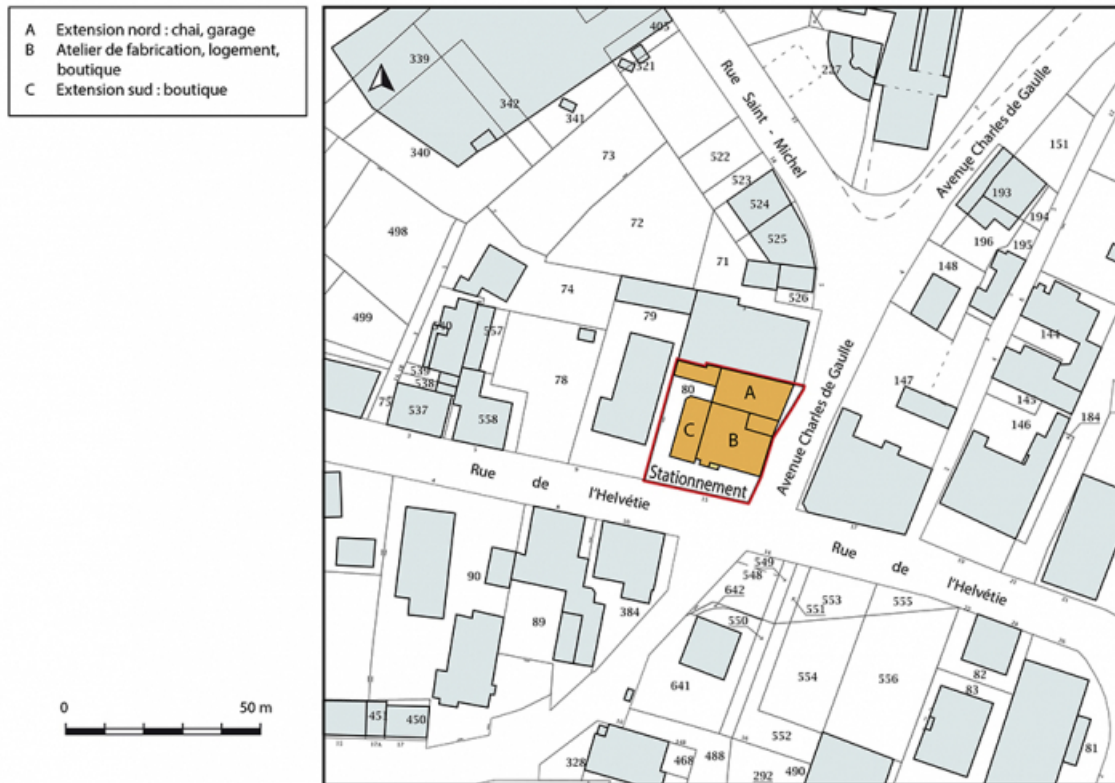
Plan-masse et de situation. Extrait du plan cadastral, 2018, section AA, 1/1 000. 25, Morteau, 15 rue de l' Helvétie