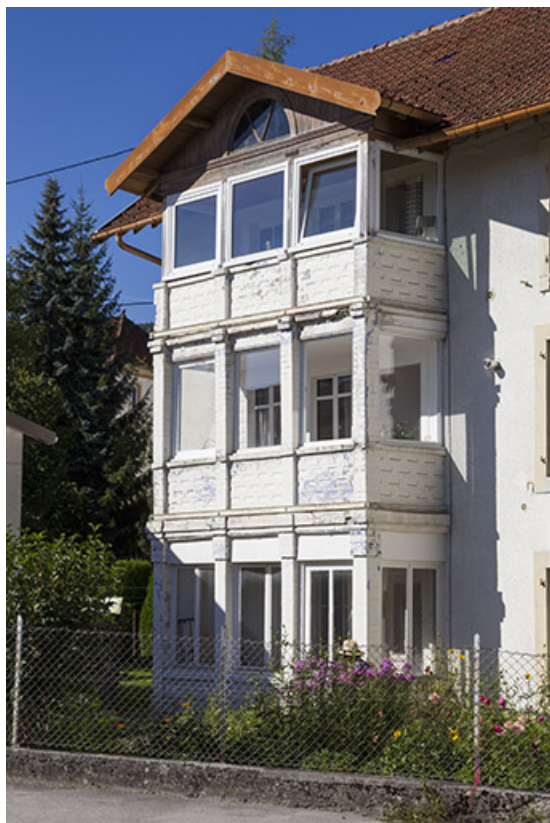
Corps de bâtiment en fond de cour : oriel montant de fond sur la façade sud. 25, Morteau, 4 rue de l' Helvétie