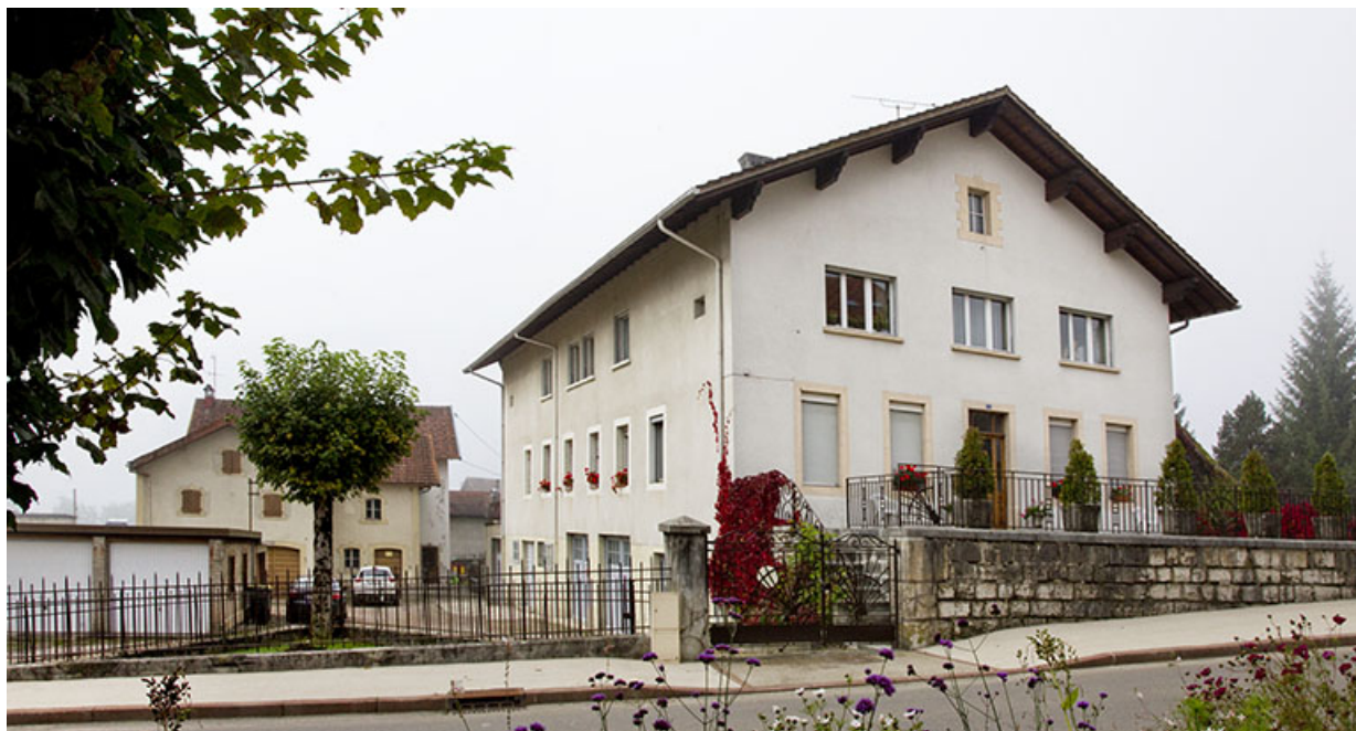
Vue d'ensemble, depuis le nord.