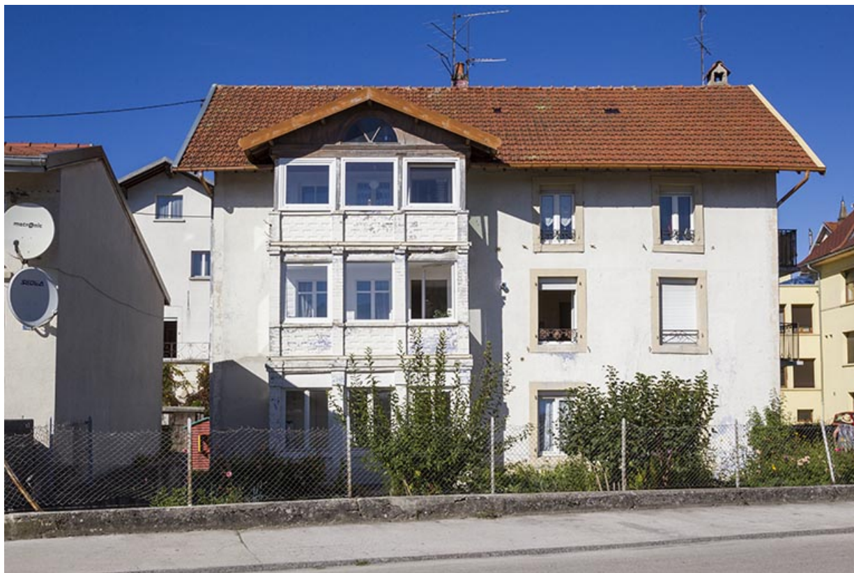
Corps de bâtiment en fond de cour : façade sud.