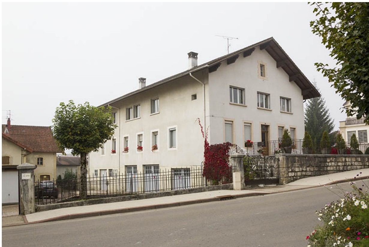
Maison, de trois quarts gauche.