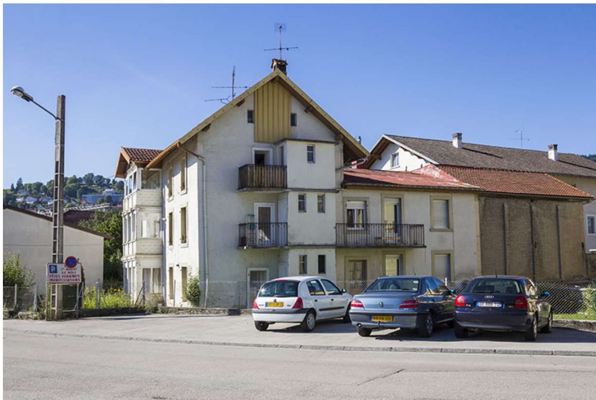
Corps de bâtiment en fond de cour, depuis l'est. 25, Morteau, 4 rue de l' Helvétie