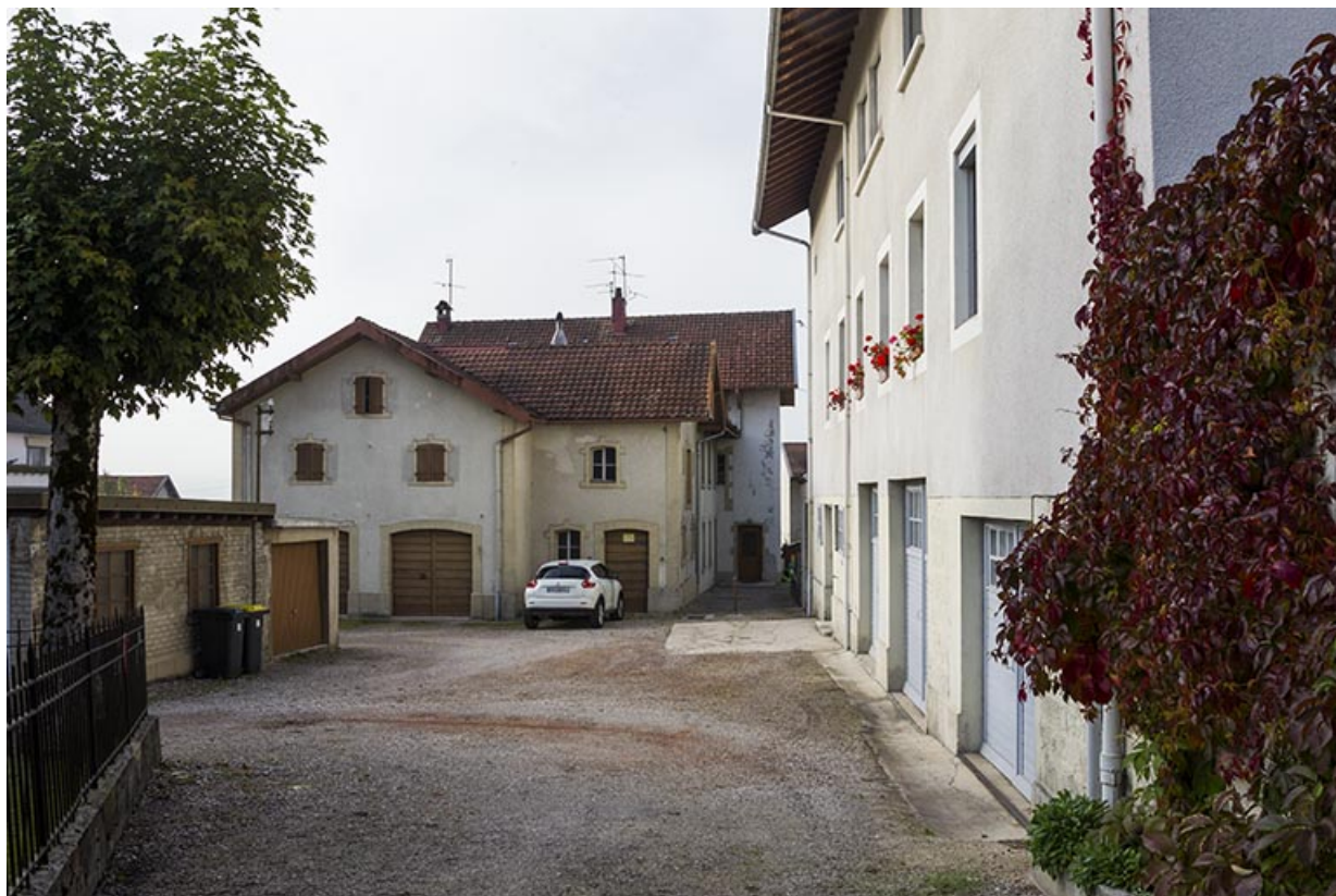
Corps de bâtiment en fond de cour, depuis le nord.