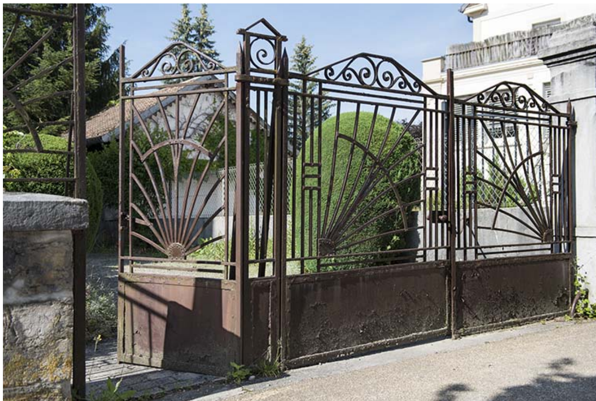
Portail sur la rue de l'Helvétie.