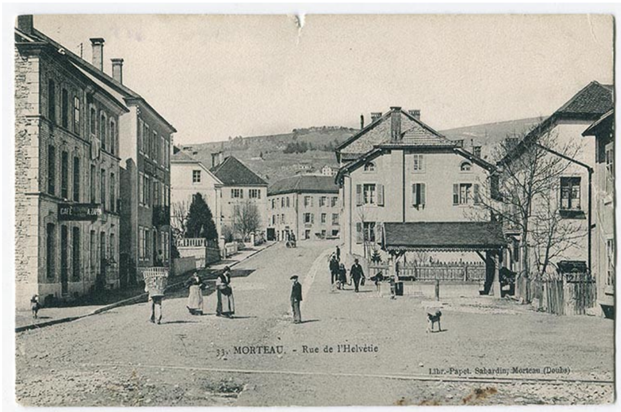
33. Morteau - Rue de l'Helvétie, 1er quart 20e siècle [avant 1910]. L'immeuble est le deuxième bâtiment à gauche. 25, Morteau

33. Morteau - Rue de l'Helvétie, carte postale, s.n., [1er quart 20e siècle, avant 1910], librairie-papeterie Sabardin éd. à Morteau