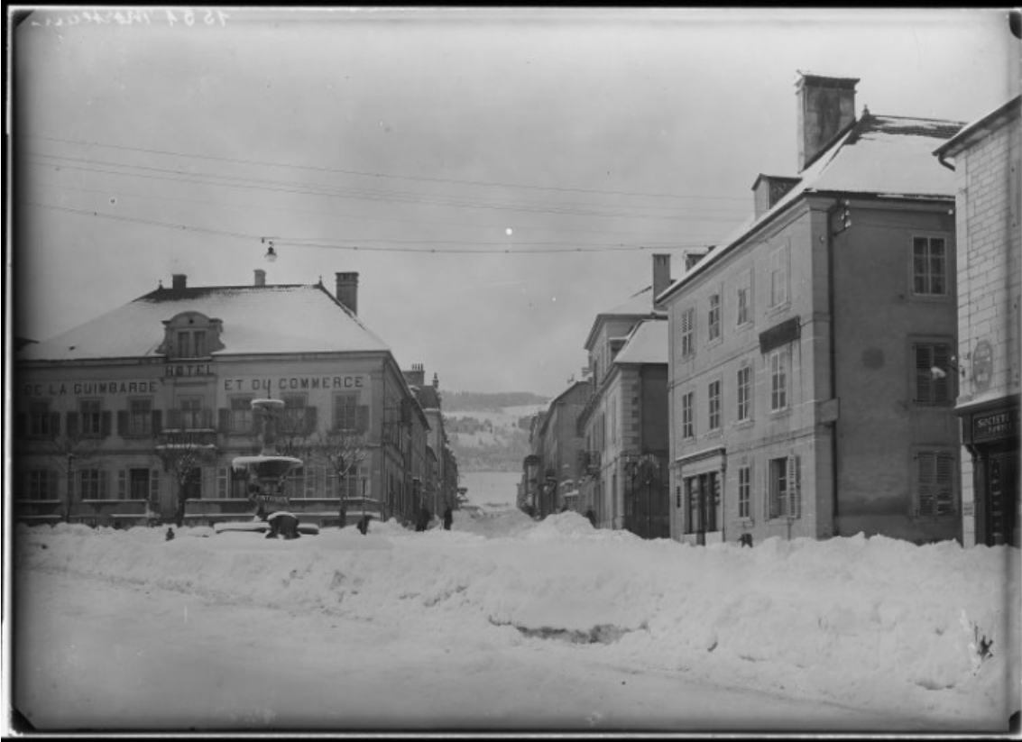
[La place Carnot et la Grande Rue sous la neige], milieu 20e siècle. 25, Morteau, 4 place Carnot