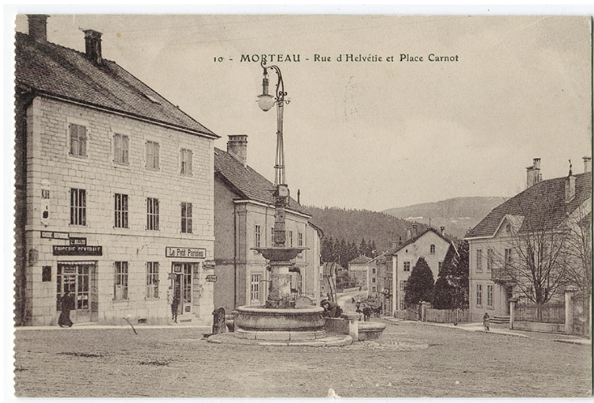
10 - Morteau - Rue d'Helvétie et place Carnot, 1er quart 20e siècle [avant 1912]. 25, Morteau