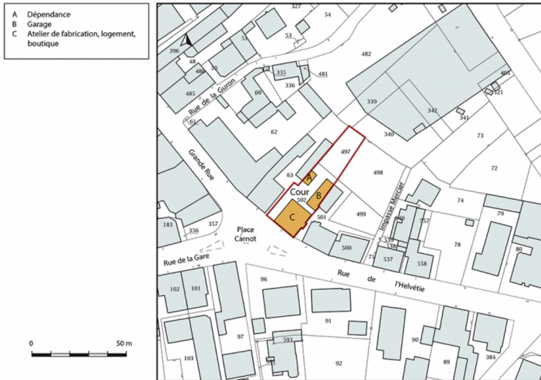
Plan-masse et de situation. Extrait du plan cadastral, 2018, section AA, 1/1 000. 25, Morteau, 4 place Carnot