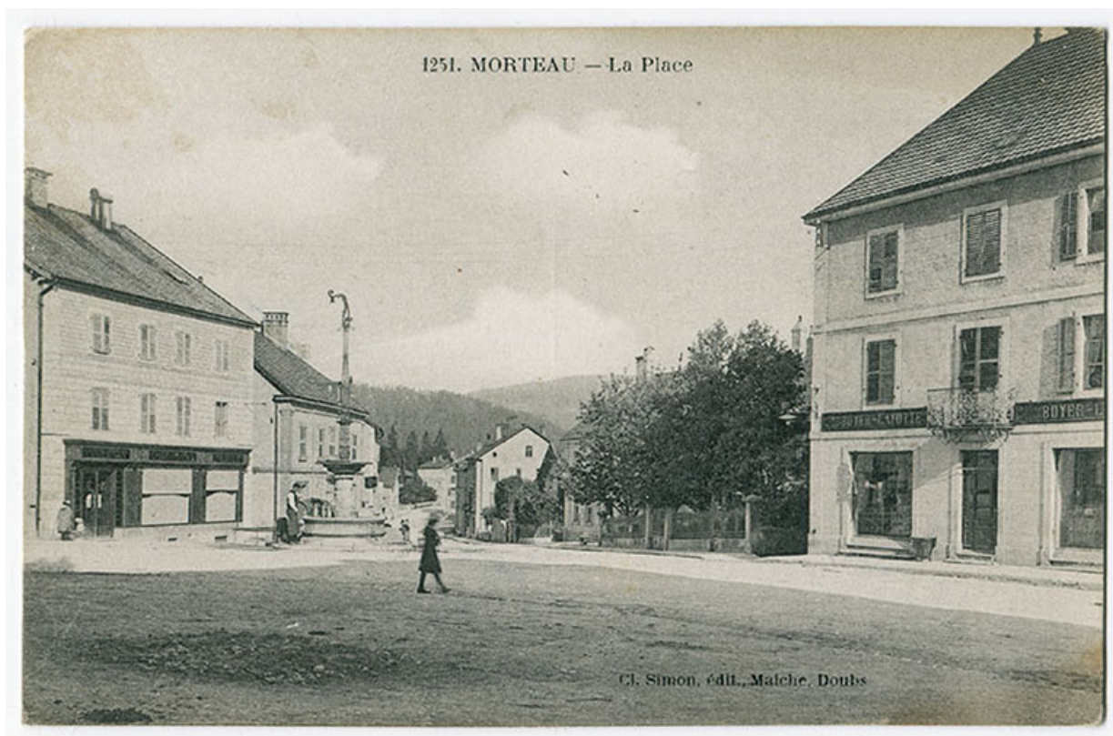
1251. Morteau - La place [Carnot], 1er quart 20e siècle.