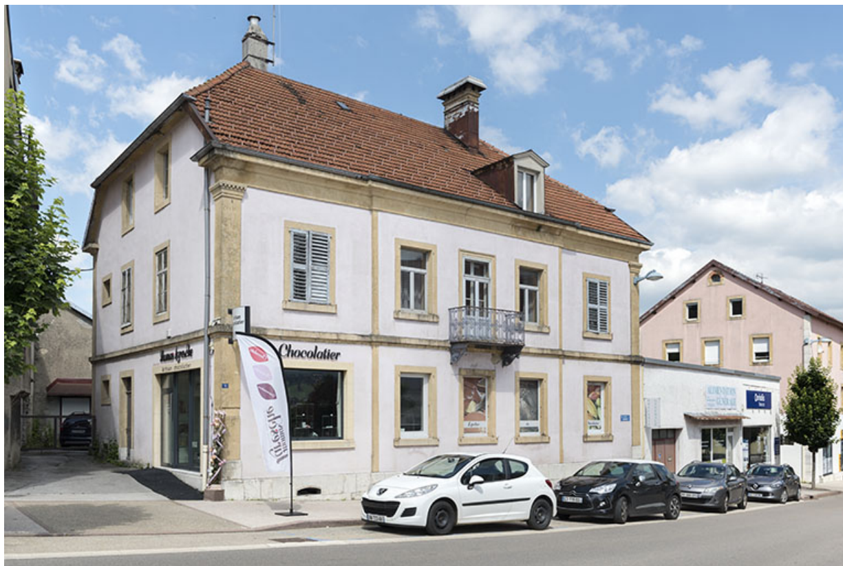
Vue d'ensemble, de trois quarts gauche. 25, Morteau, 2 place Carnot