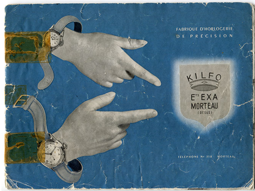
Catalogue de la Fabrique d'horlogerie de précision Kilfo. Ets Exa, Morteau (Doubs), années 1950-1960 : page de couverture. 25, Morteau, 2 place Carnot