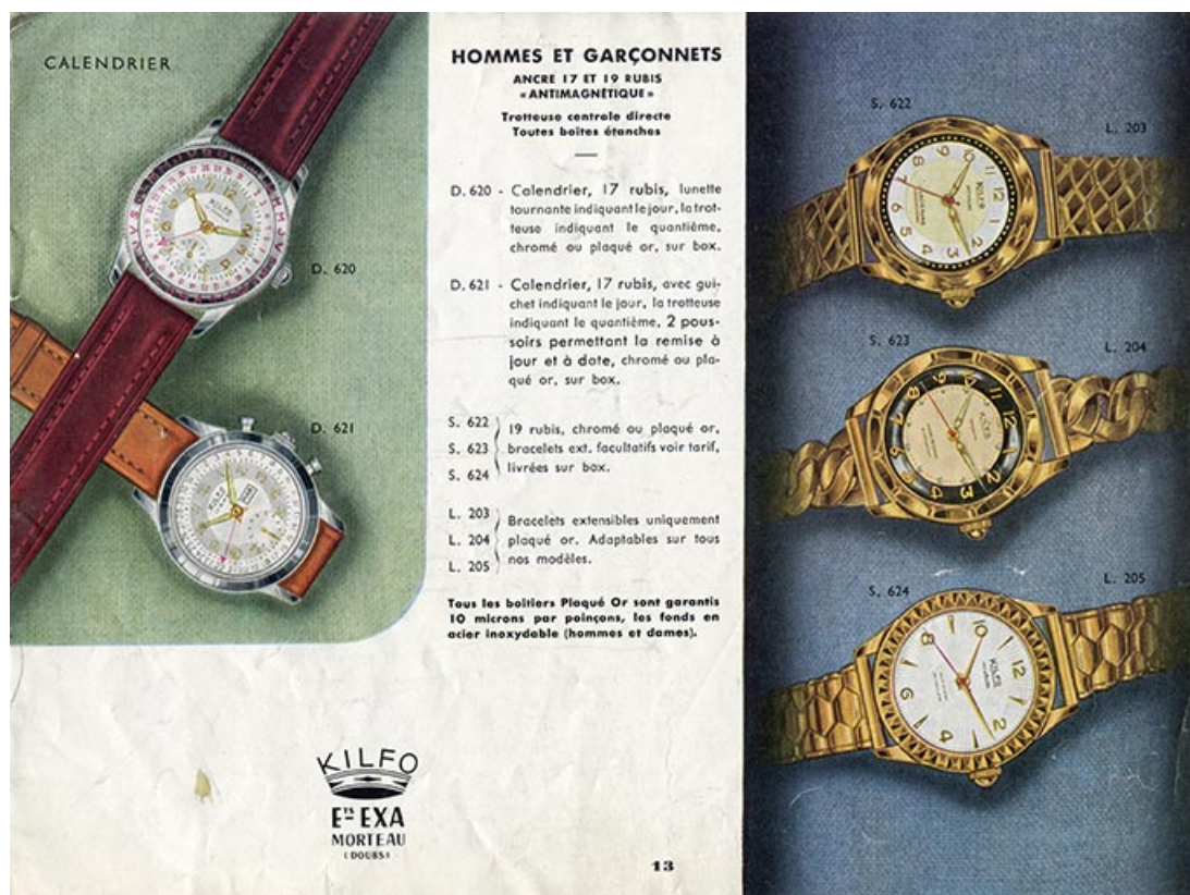
Catalogue de la Fabrique d'horlogerie de précision Kilfo. Ets Exa, Morteau (Doubs), années 1950-1960 : p. 13. 25, Morteau, 2 place Carnot