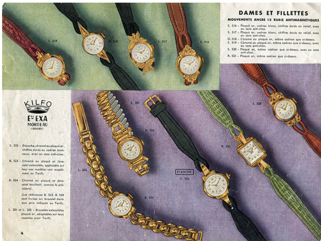
Catalogue de la Fabrique d'horlogerie de précision Kilfo. Ets Exa, Morteau (Doubs), années 1950-1960 : p. 4. 25, Morteau, 2 place Carnot