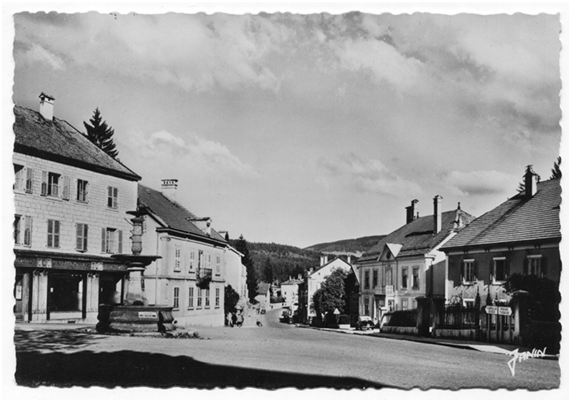
Morteau (Doubs). 157 - La fontaine et la rue de l'Helvétie, milieu 20e siècle. 25, Morteau, 2 place Carnot