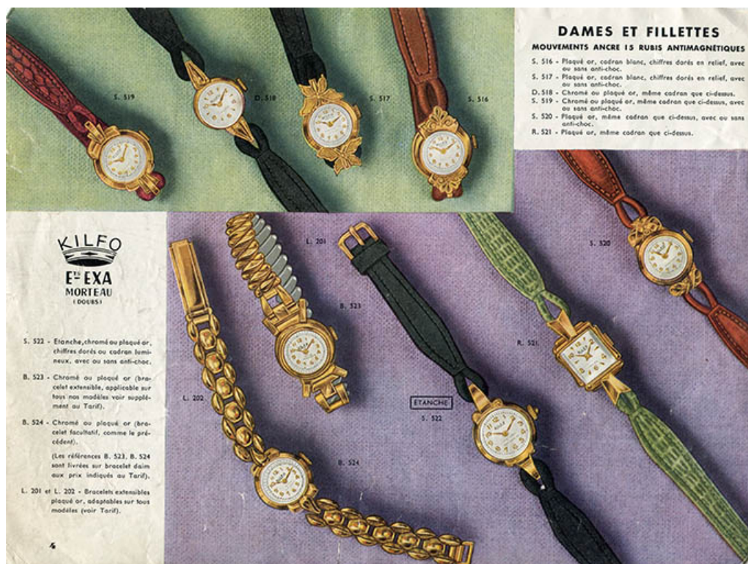
Catalogue de la Fabrique d'horlogerie de précision Kilfo. Ets Exa, Morteau (Doubs), années 1950-1960 : p. 4. 25, Morteau, 2 place Carnot