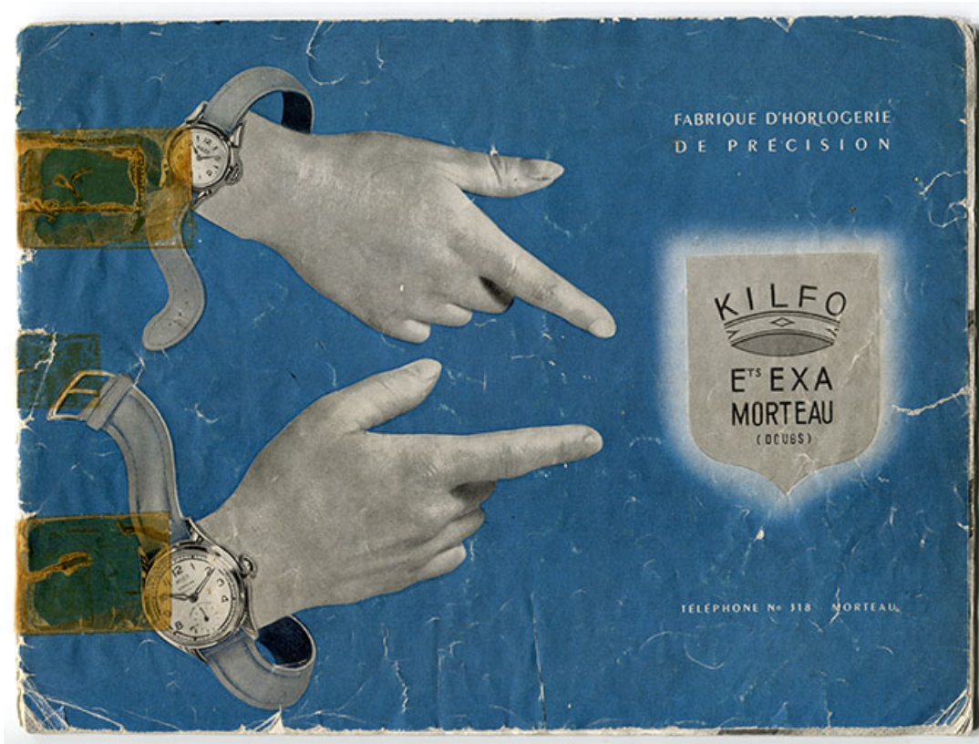
Catalogue de la Fabrique d'horlogerie de précision Kilfo. Ets Exa, Morteau (Doubs), années 1950-1960 : page de couverture. 25, Morteau, 2 place Carnot

Fabrique d'horlogerie de précision Kilfo. Ets Exa, Morteau (Doubs) [catalogue]. - S.l. [Morteau] : s.n. [Ets Exa], s.d. [années 1950-1960]. 15 p. : tout en ill. ; 18 x 24 cm.