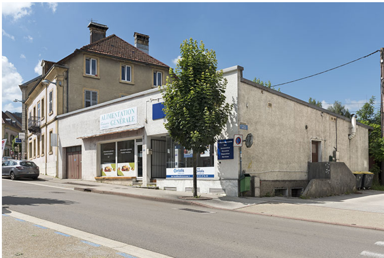
Vue d'ensemble, de trois quarts droite.