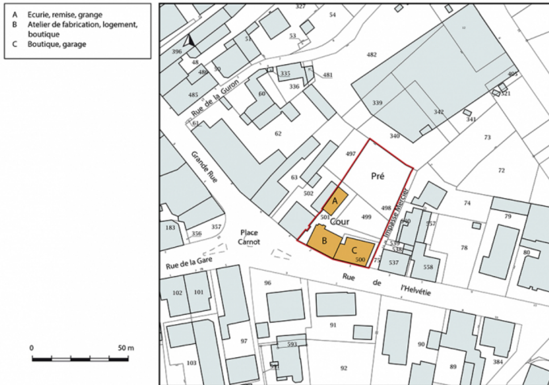
Plan-masse et de situation. Extrait du plan cadastral, 2018, section AA, 1/1 000. 25, Morteau, 2 place Carnot