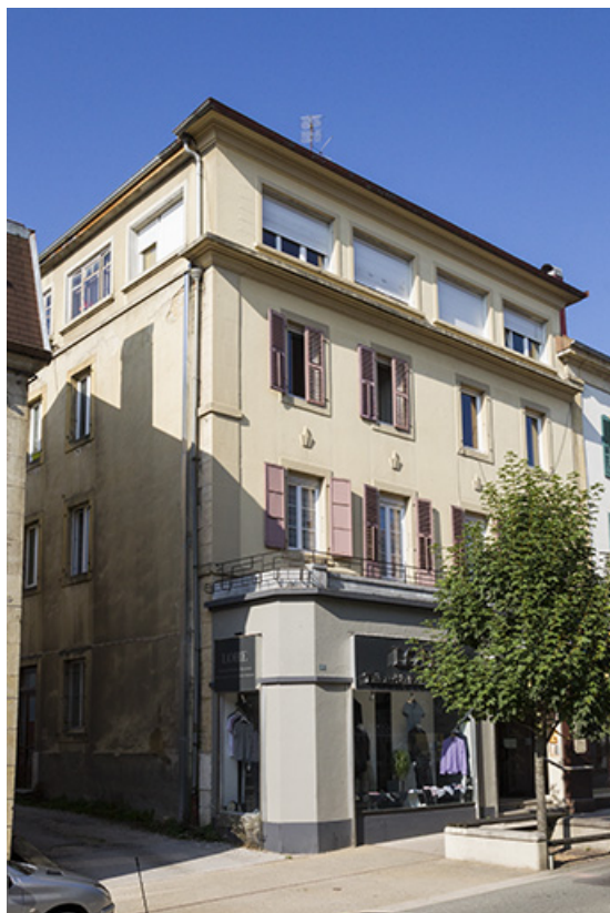
Façade antérieure, de trois quarts gauche. 25, Morteau, 19 Grande Rue