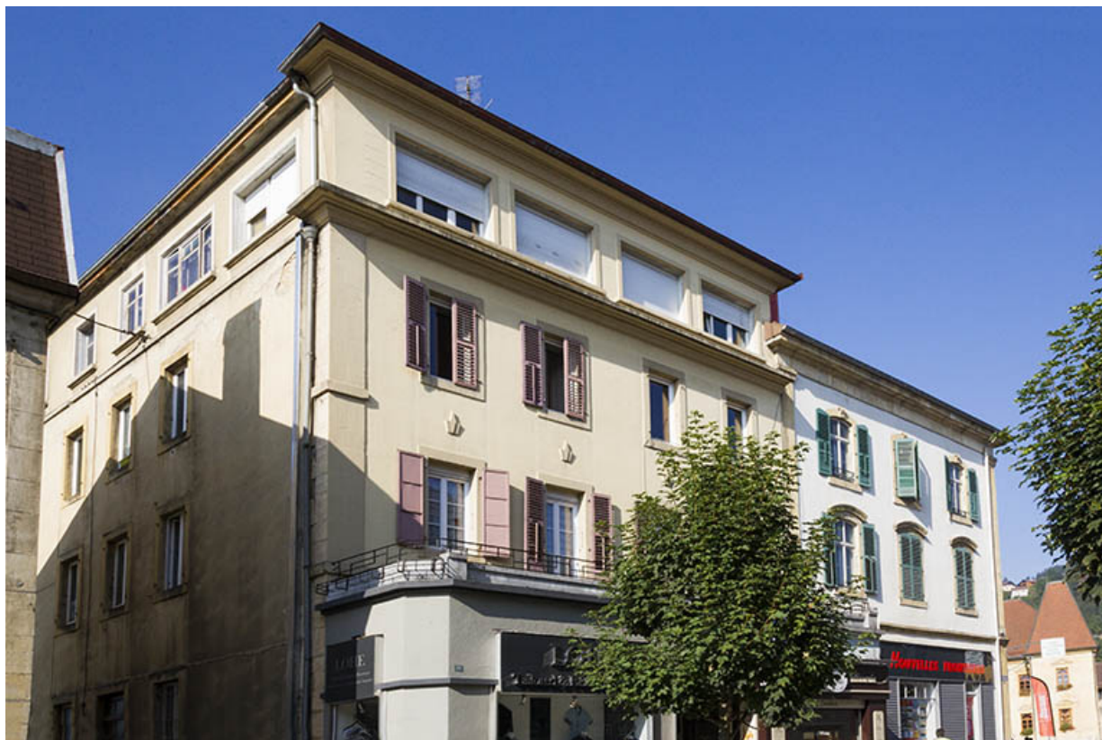
Partie supérieure de la façade antérieure, de trois quarts gauche.