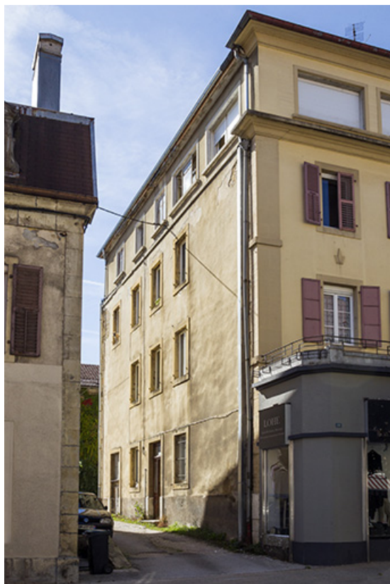
Façade latérale gauche, vue en enfilade.