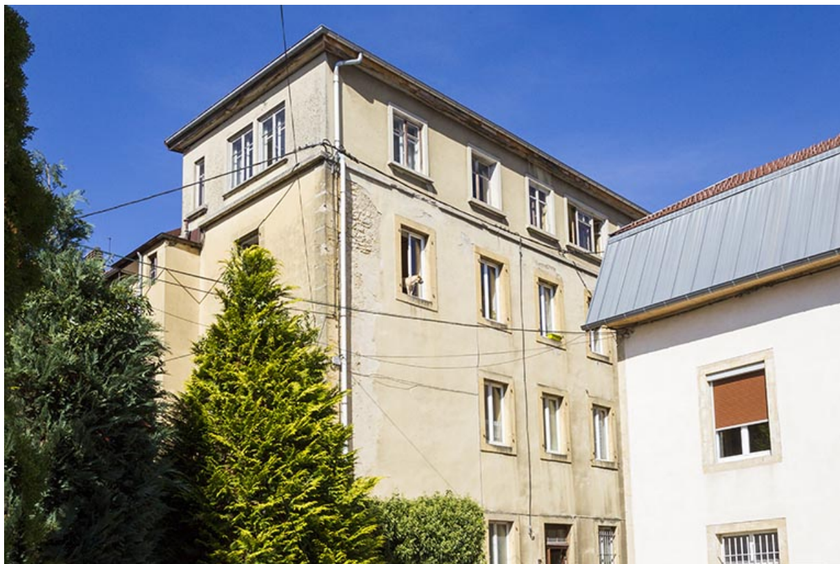
Façades latérale gauche et postérieure, vues en contre-plongée.