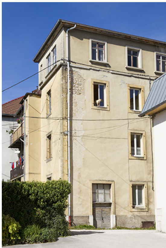
Façades latérale gauche et postérieure.