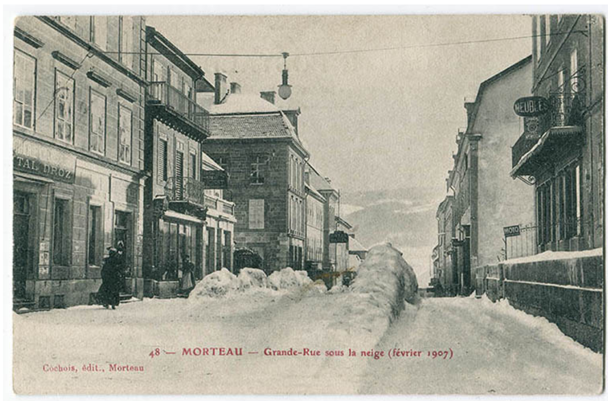
48 - Morteau - Grande Rue sous la neige (février 1907). La boutique au long de la rue est bâtie. 25, Morteau