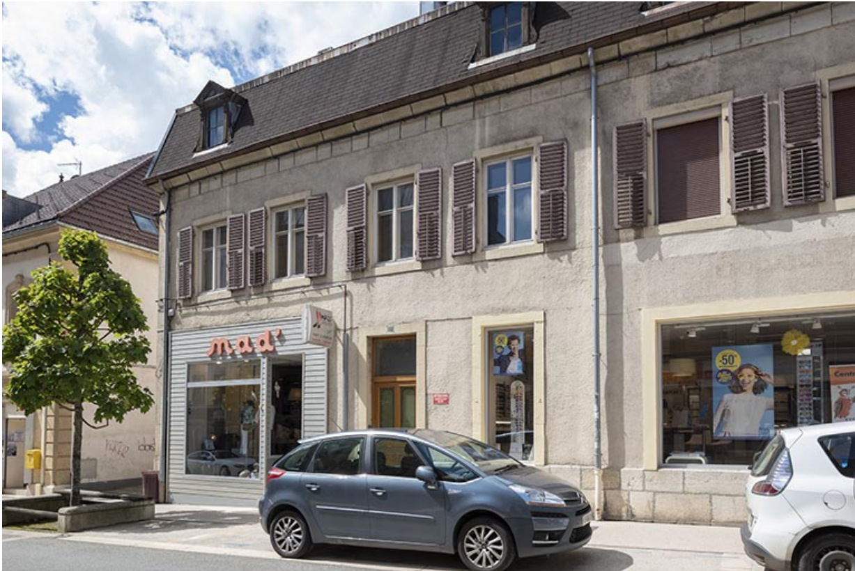
Façade antérieure : partie gauche.