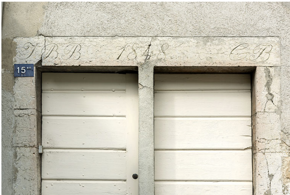
Maison côté cour : linteau daté 1848.