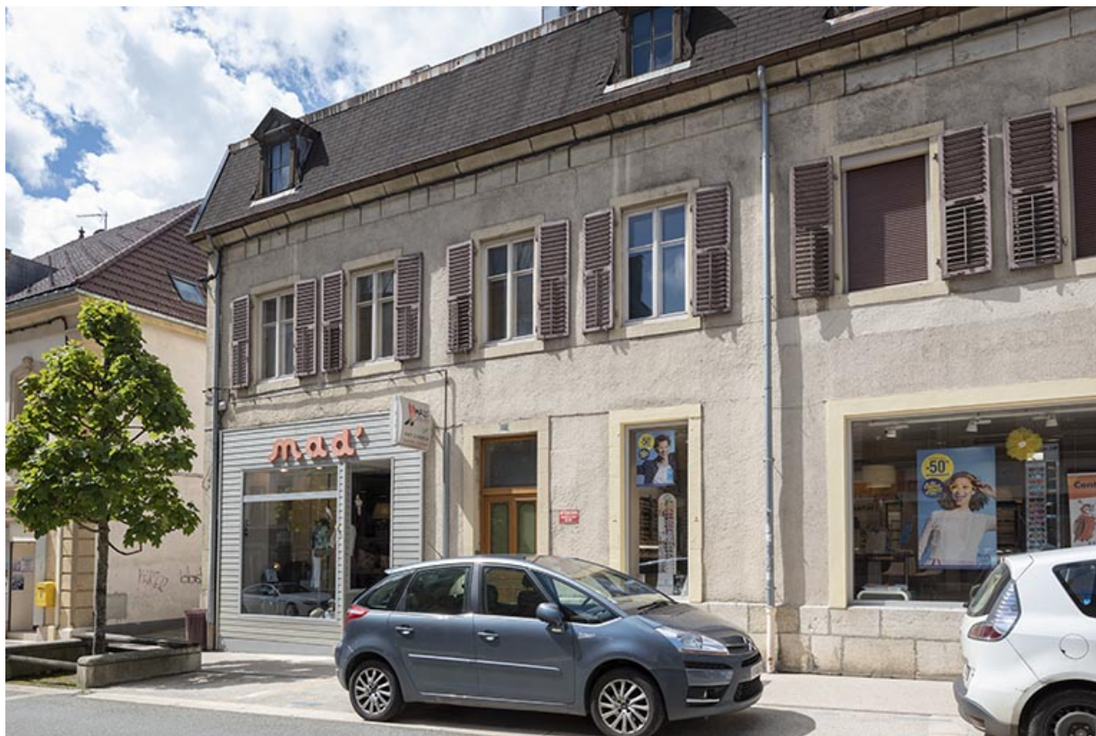
Façade antérieure : partie gauche.