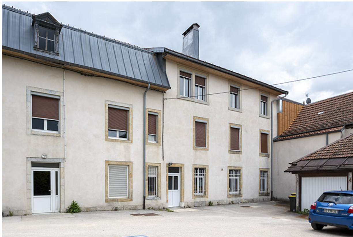
Façade postérieure, de trois quarts gauche. 25, Morteau, 13 Grande Rue