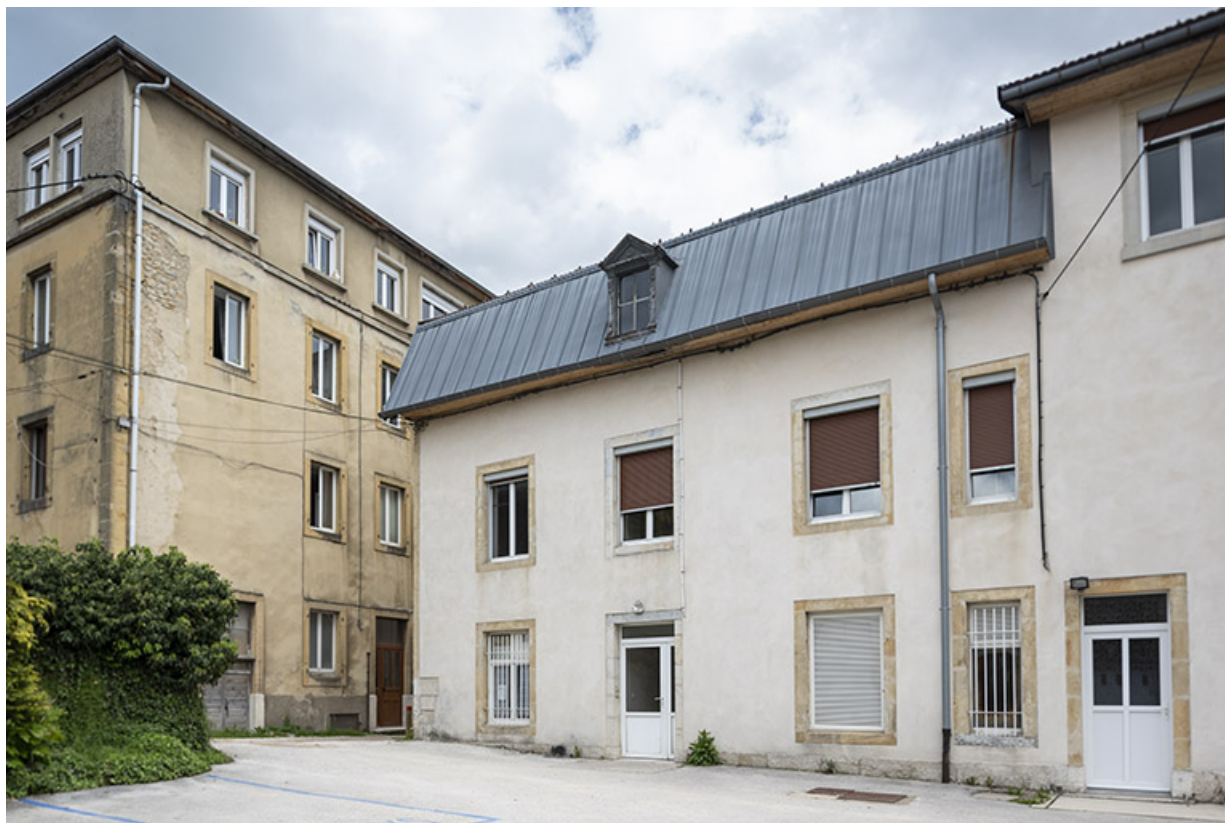
Façade posérieure, de trois quarts droite. 25, Morteau, 13 Grande Rue