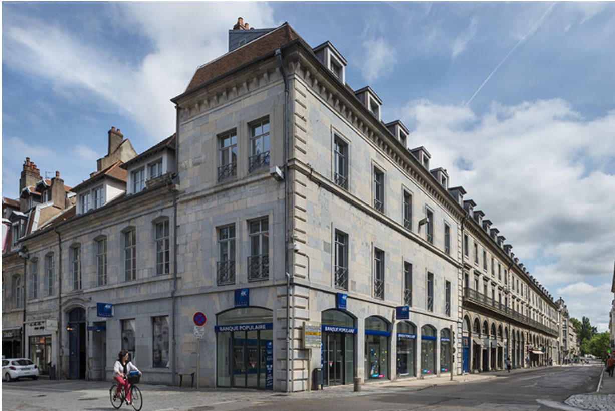
Vue d'ensemble depuis l'intersection des rues des Granges et de la République.