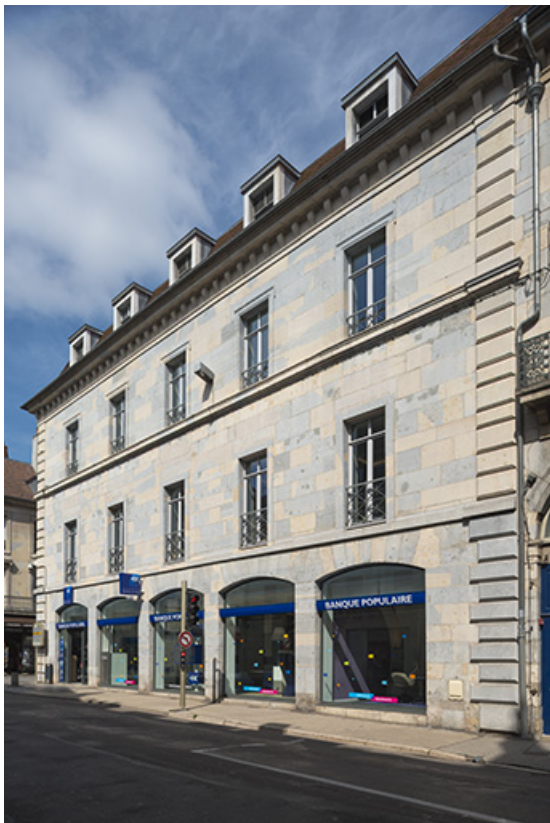
Façade rue de la République, vue de trois quarts droite.