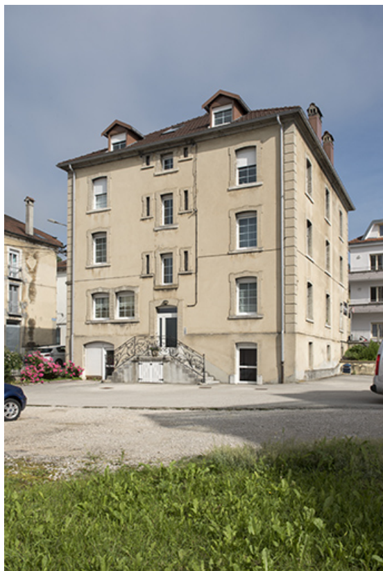
Façades sud (entrée, sur cour) et est. 25, Morteau, 8 rue Gonsalve Pertusier