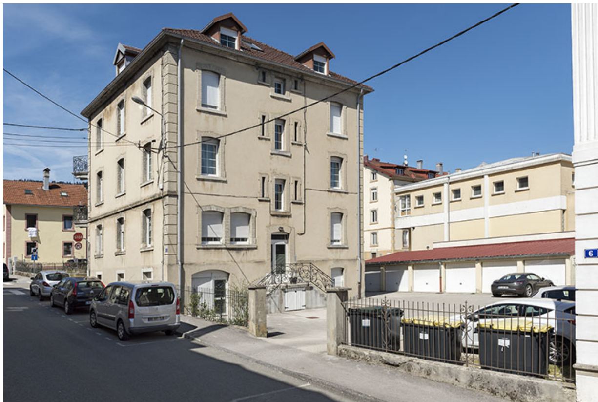
Façades ouest (sur la rue Pertusier) et sud (entrée, sur cour). 25, Morteau, 8 rue Gonsalve Pertusier