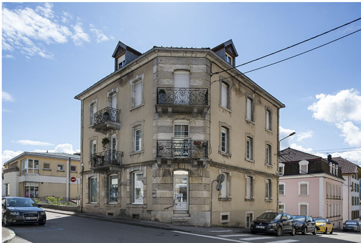
Vue d'ensemble, sur le pan coupé. 25, Morteau