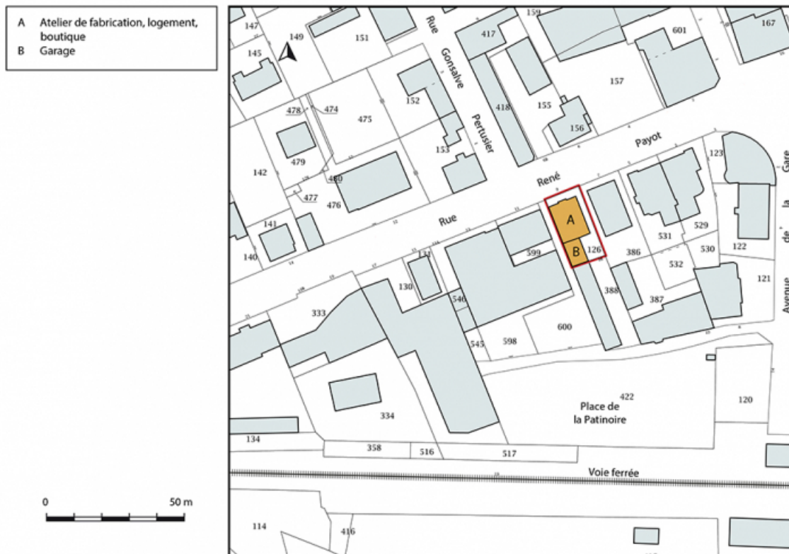
Plan-masse et de situation. Extrait du plan cadastral, 2017, section AA, 1/1 000. 25, Morteau, 9 rue René Payot