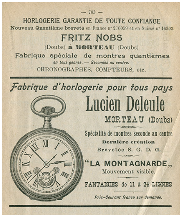
Publicité pour la fabrique d'horlogerie Lucien Deleule, 1902. 25, Morteau, 9 rue René Payot