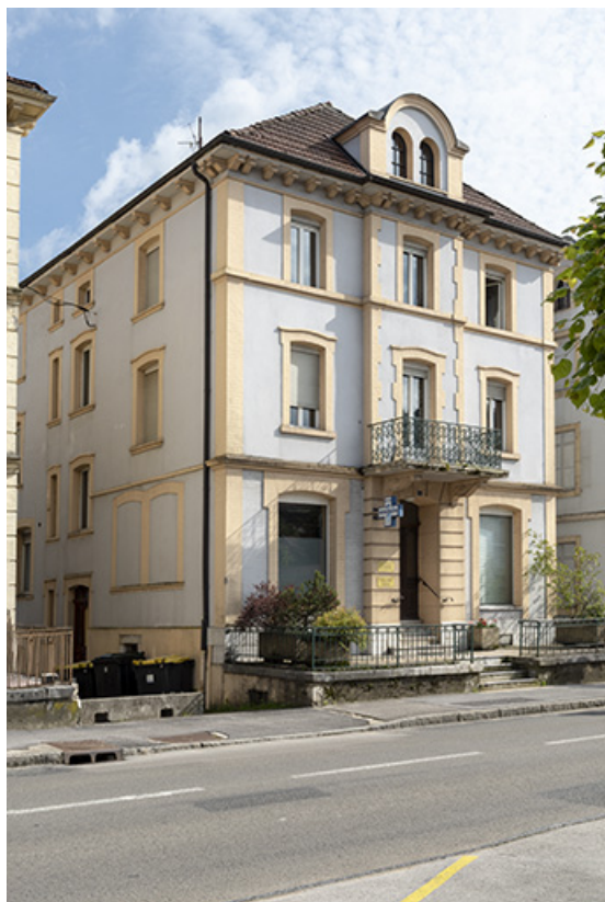
Façade antérieure, de trois quarts gauche. 25, Morteau