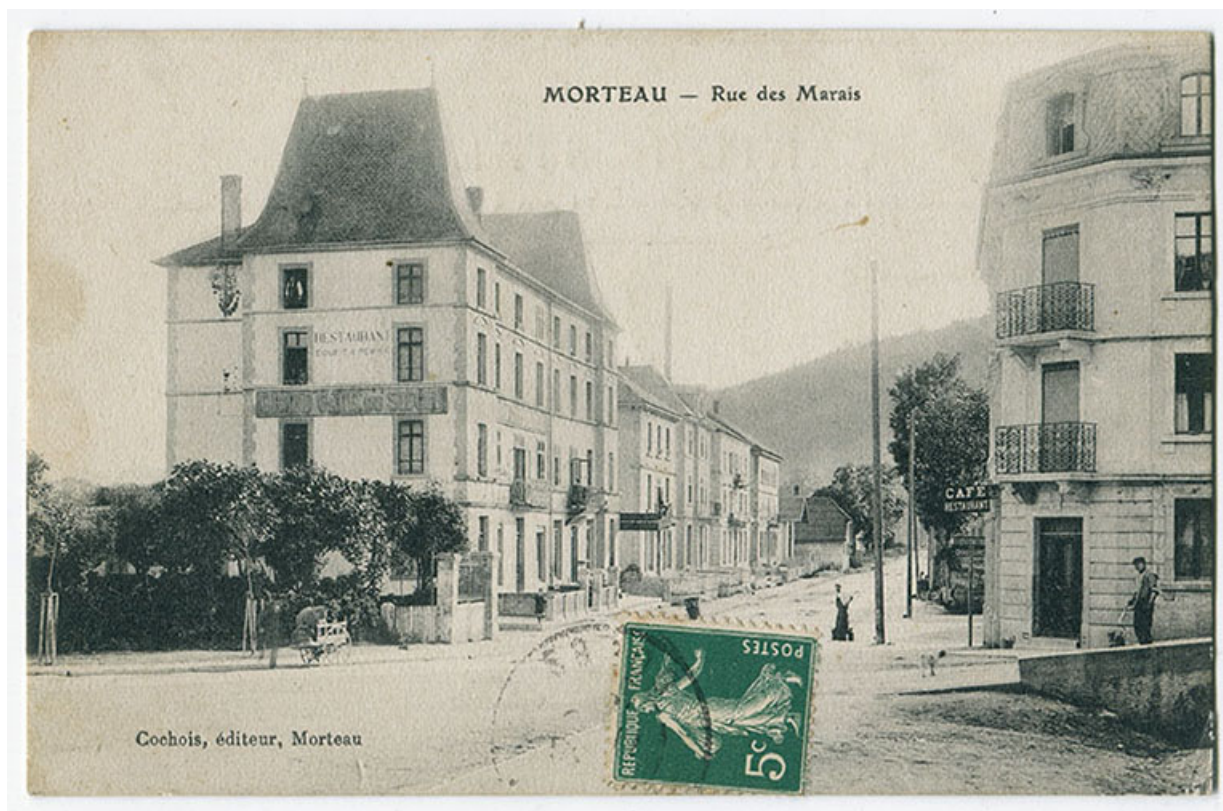
Morteau - Rue des Marais [la rue René Payot vue de l'est], limite 19e siècle 20e siècle [avant 1905]. 25, Morteau, 11-13 rue René Payot