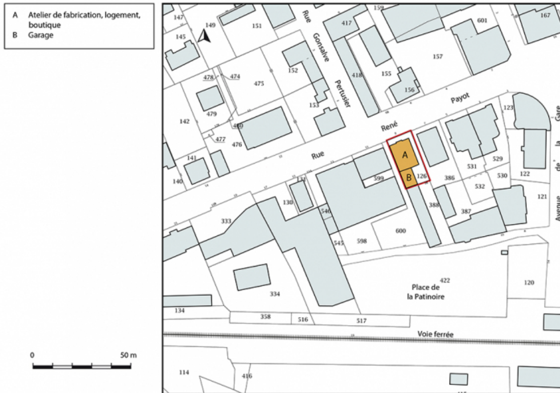
Plan-masse et de situation. Extrait du plan cadastral, 2017, section AA, 1/1 000. 25, Morteau, 9 rue René Payot