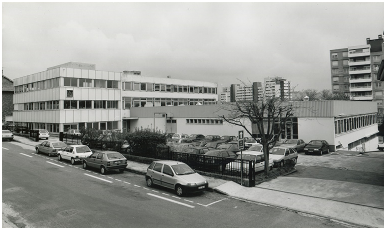
Vue depuis l'ouest, fotogr., s.d. [années 1990].