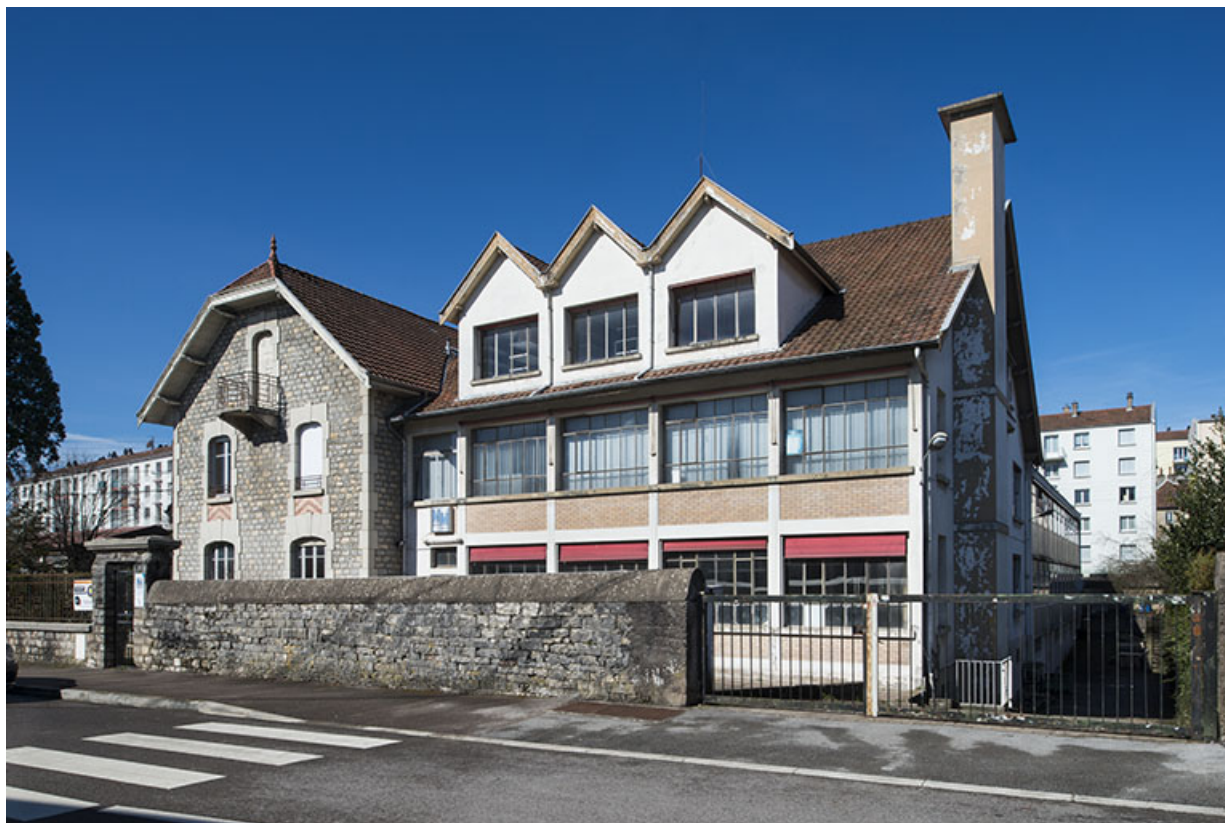
Le logement et l'atelier sur rue, depuis le sud-est.