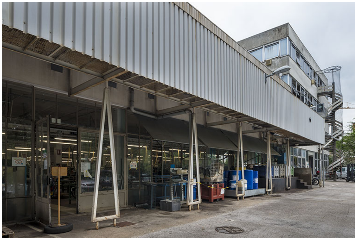
Usine B (12 rue du Tunnel). Façade est. 25, Besançon, 5, 12 rue du Tunnel