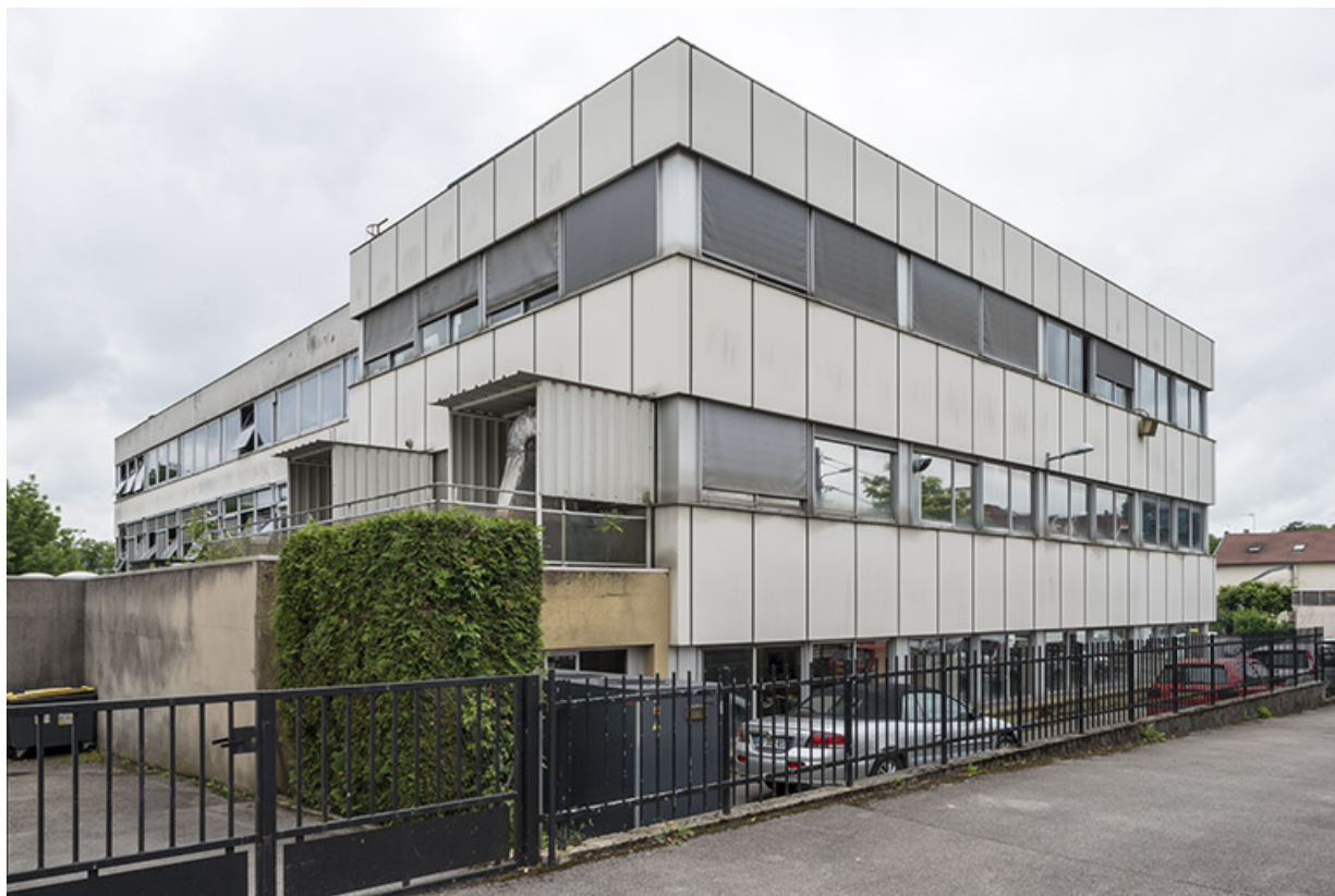
Usine C (14 rue du Tunnel). Vue depuis le nord. 25, Besançon, 5, 12 rue du Tunnel