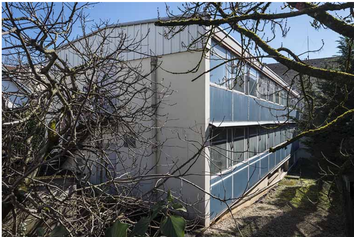
Extension nord, vue de trois quarts.