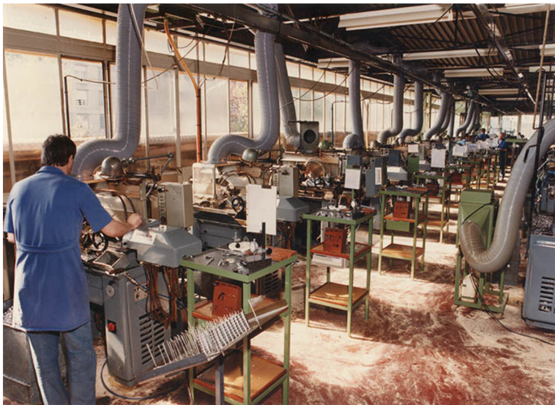
Atelier de fabrication (contre-angles et pièces à main dentaire), vers 1980.