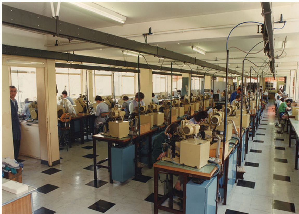
Atelier de fabrication des tire-nerfs dentaires, vers 1975.