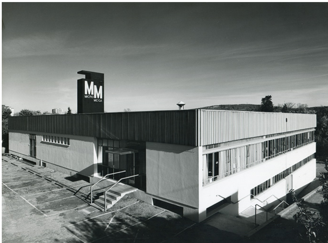
Vue de trois quarts de l'usine B (n°12 rue du Tunnel), fotogr., s.d. [vers 1970]. 25, Besançon, 5, 12 rue du Tunnel