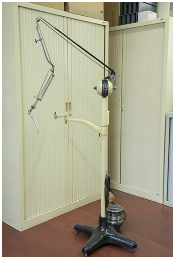
Potence de dentiste Quétin, bras articulé et pièce à main.