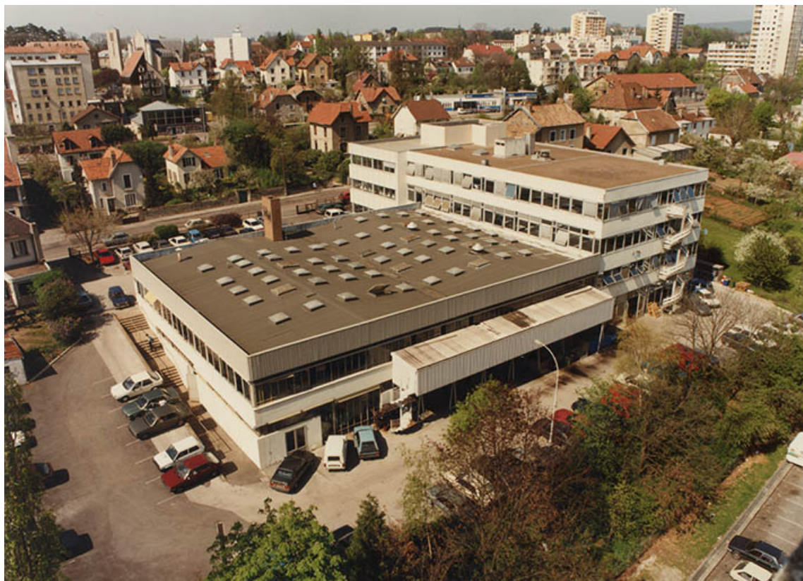
Vue plongeante depuis le sud, fotogr., s.d. [vers 1990]. 25, Besançon, 5, 12 rue du Tunnel