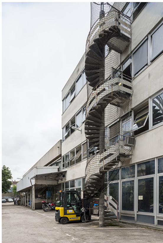
Usine B (12 rue du Tunnel). Elévation de la façade est. 25, Besançon, 5, 12 rue du Tunnel