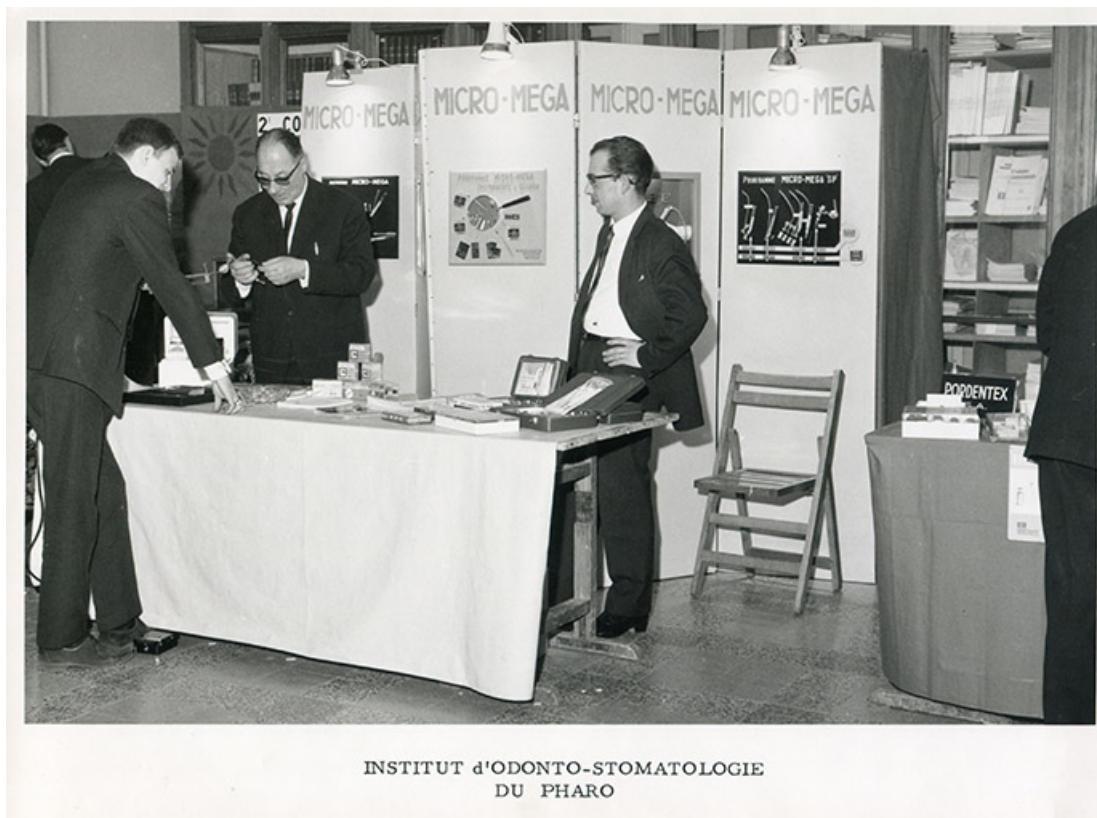
Stand Micro-Mega à l'Institut d'odonto-stomatologie du Pharo, fotogr., 1967. 25, Besançon, 5, 12 rue du Tunnel