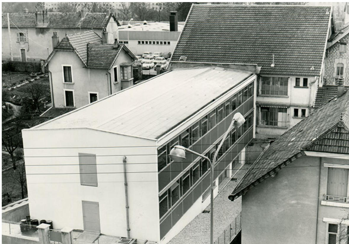
Extension nord de l'usine-mère, fotogr., s.d. [vers 1970].