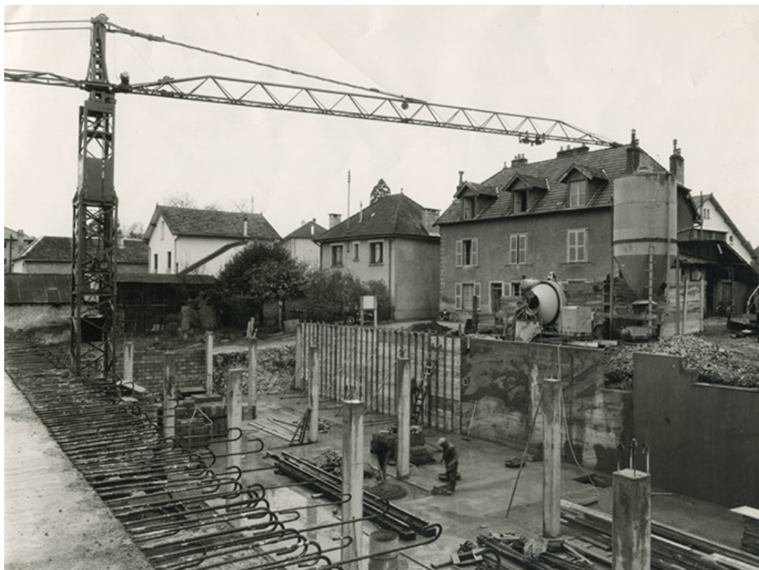
Chantier de construction de l'usine B, fotogr., 1961.