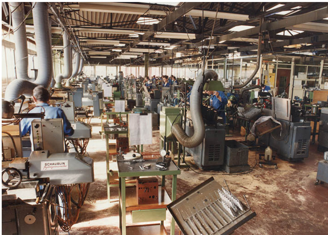
Atelier de fabrication (contre-angles et pièces à main dentaire), vers 1980. 25, Besançon, 5, 12 rue du Tunnel