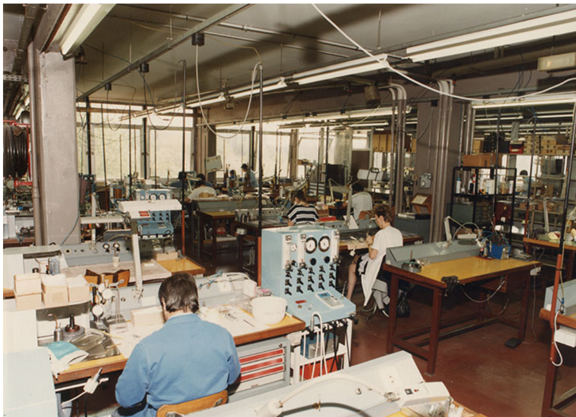
Atelier de montage (contre-angles et pièces à main dentaire), vers 1995. 25, Besançon, 5, 12 rue du Tunnel