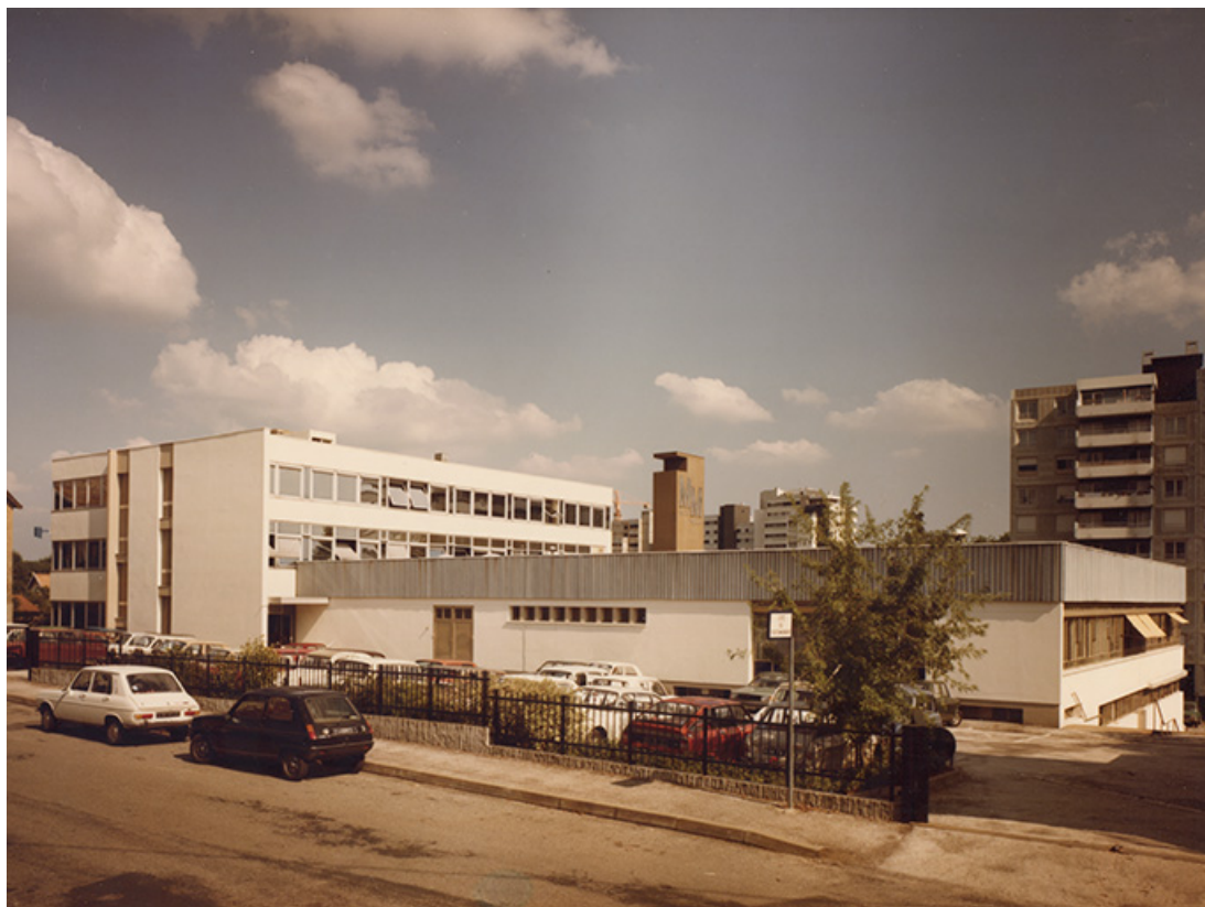
Vue d'ensemble depuis l'ouest, fotogr., s.d. [vers 1980].