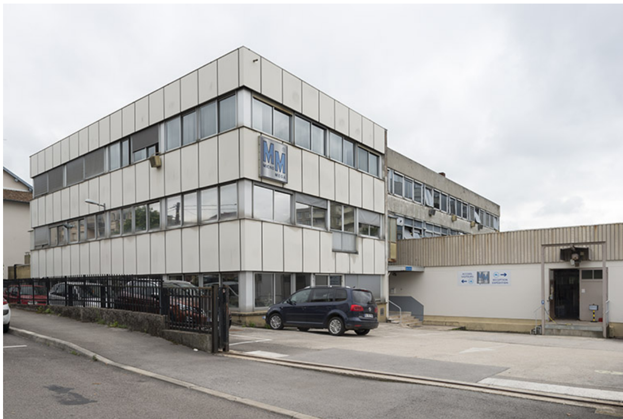
Usine C (14 rue du Tunnel). Vue de trois quarts. 25, Besançon, 5, 12 rue du Tunnel