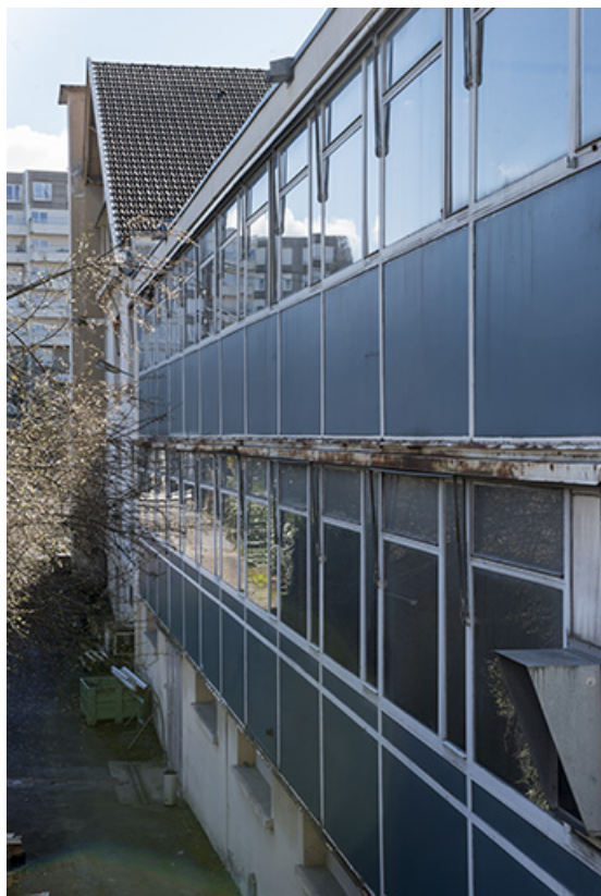
Façade orientale de l'extension nord.