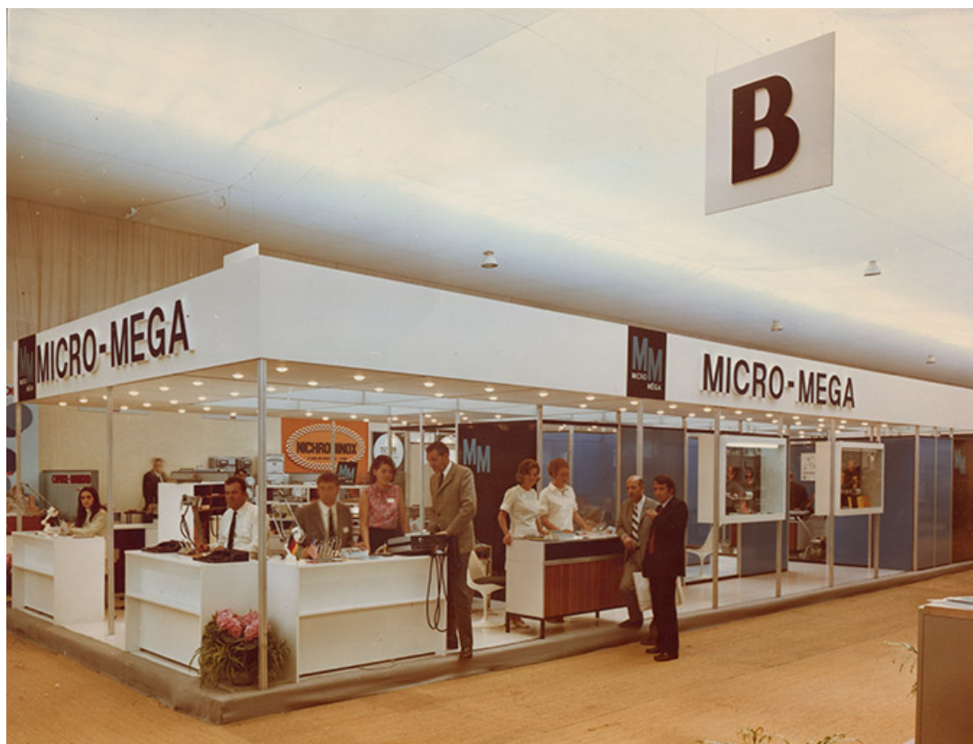
Stand Micro-Mega sur un salon professionnel, s.d. [vers 1980]. 25, Besançon, 5, 12 rue du Tunnel