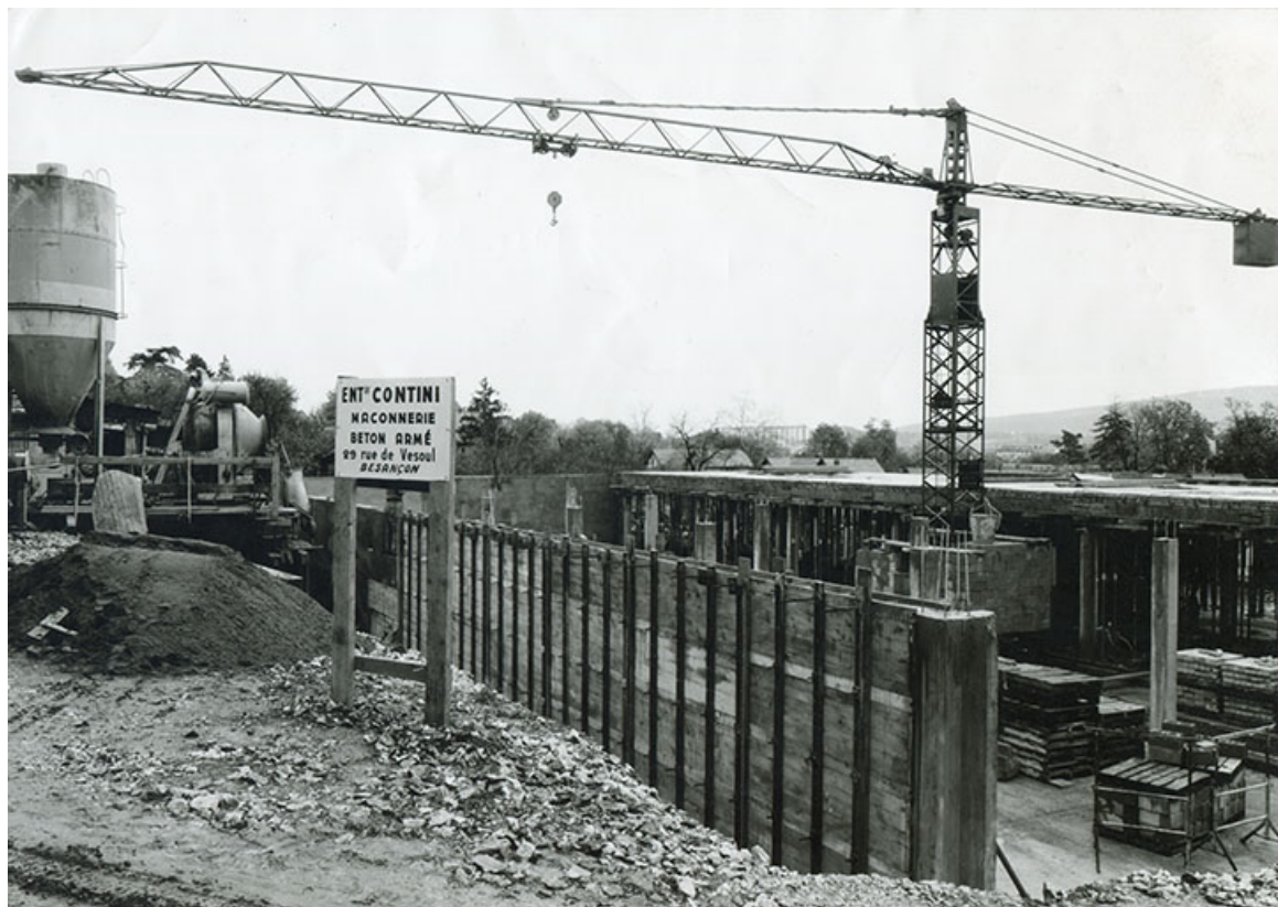
Chantier de construction de l'usine B, fotogr., 1961.