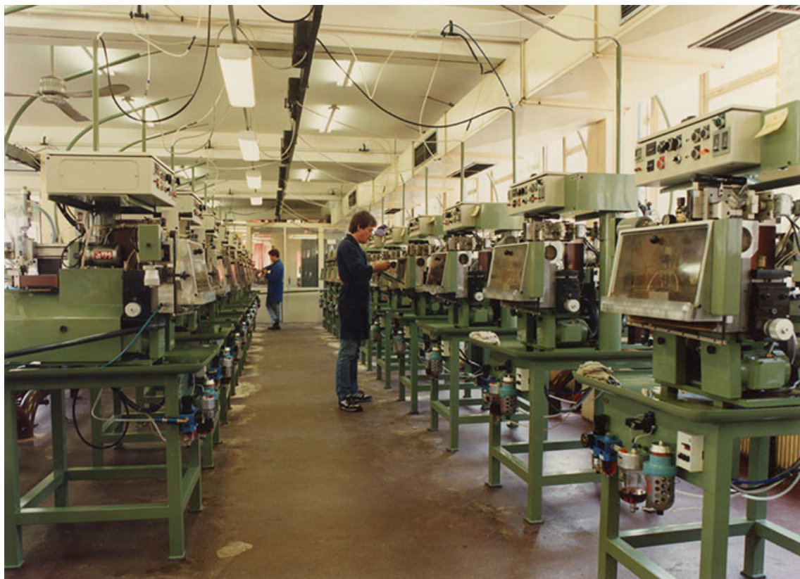
Atelier de décolletage des instruments à canaux, vers 1995. 25, Besançon, 5, 12 rue du Tunnel