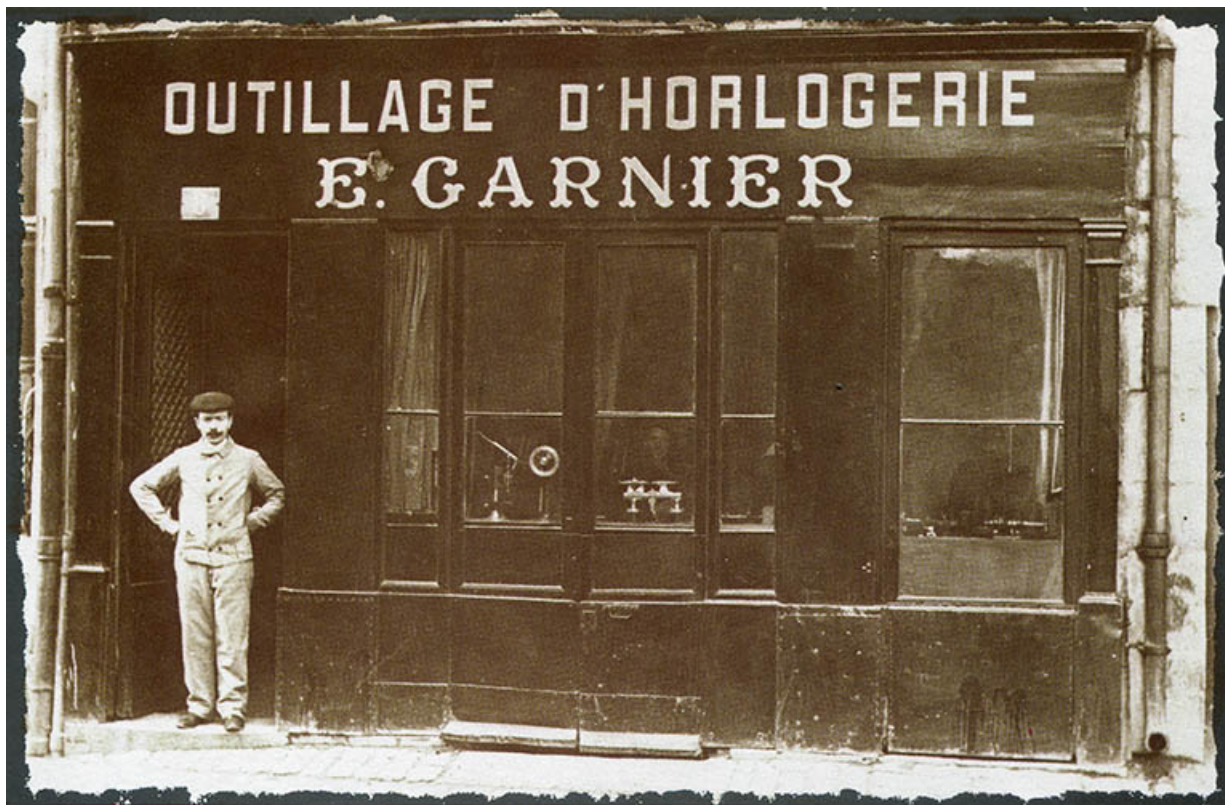
Devanture du magasin d'outillage d'horlogerie Garnier, s.d. [vers 1910].