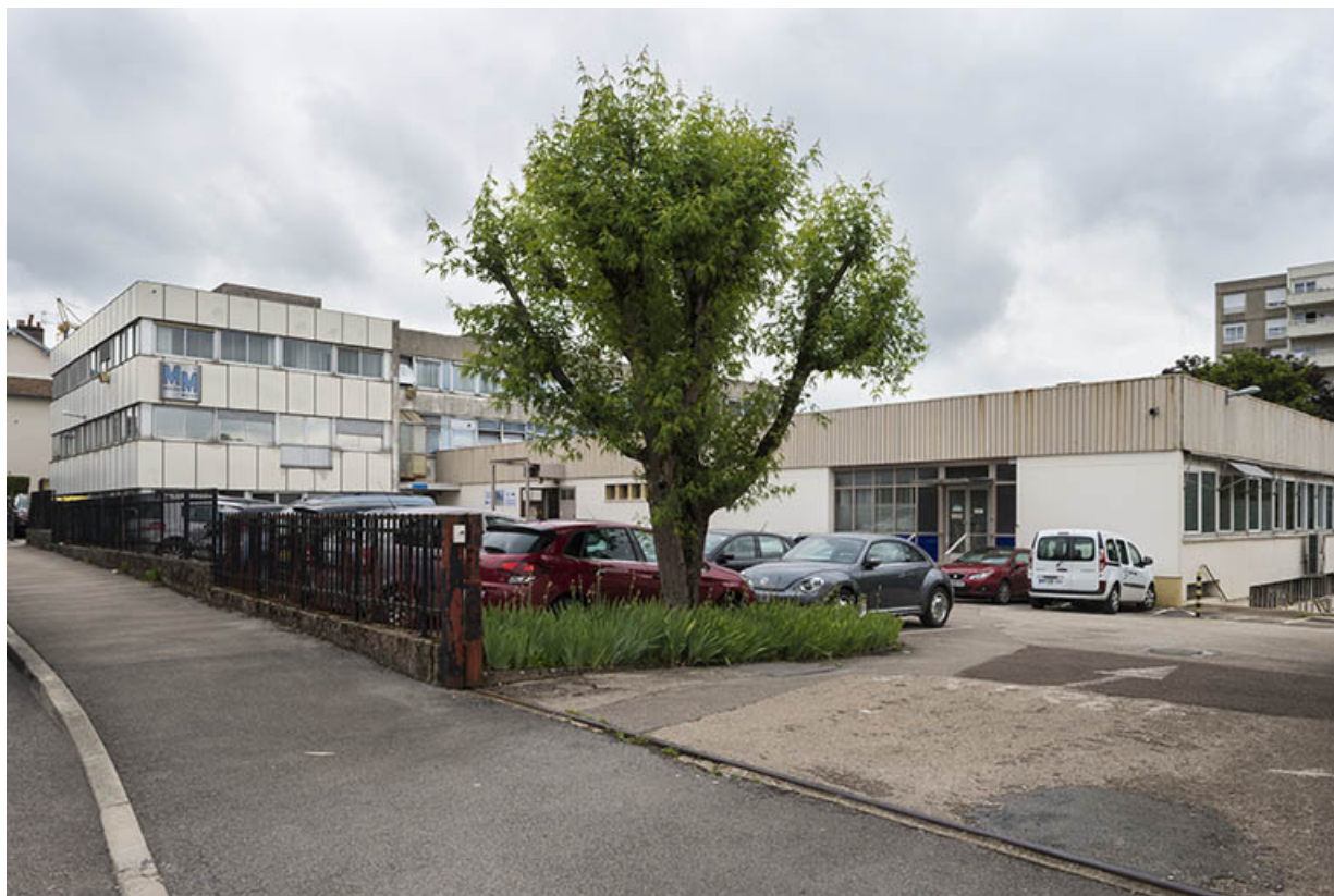
Usine B (12 rue du Tunnel). Vue d'ensemble depuis l'ouest.