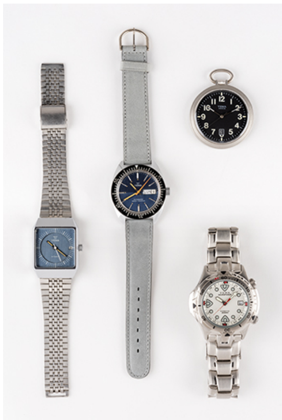
Montres Yema, 3e quart 20e siècle. (Fonds Horloger de Battant et collection musée du Temps, Besançon).