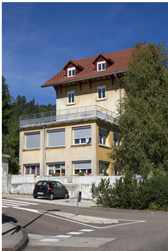
Façade latérale gauche, de trois quarts droite. 25, Morteau, 33 rue de la Louhière