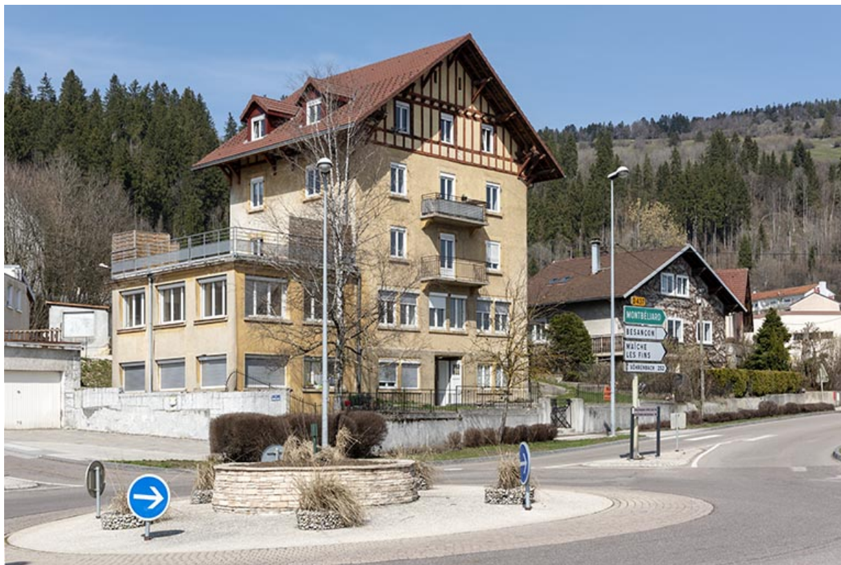
Façades antérieure et latérale gauche, en hiver. 25, Morteau, 33 rue de la Louhière