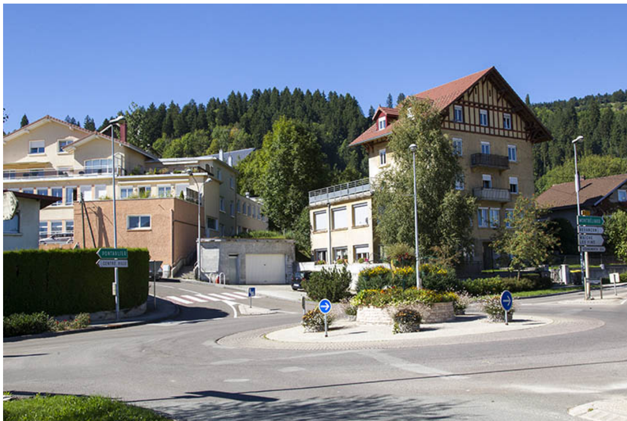
Vue d'ensemble, depuis le sud-est.