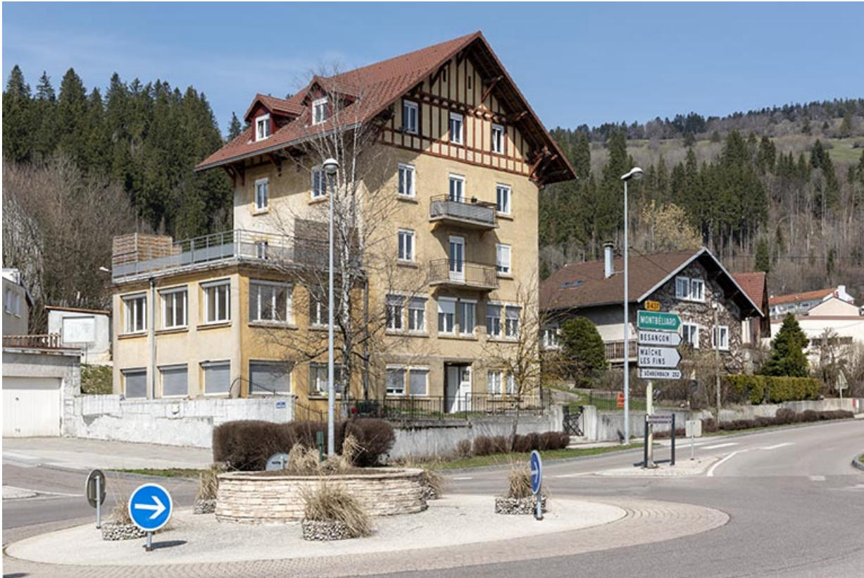
Façades antérieure et latérale gauche, en hiver. 25, Morteau, 33 rue de la Louhière