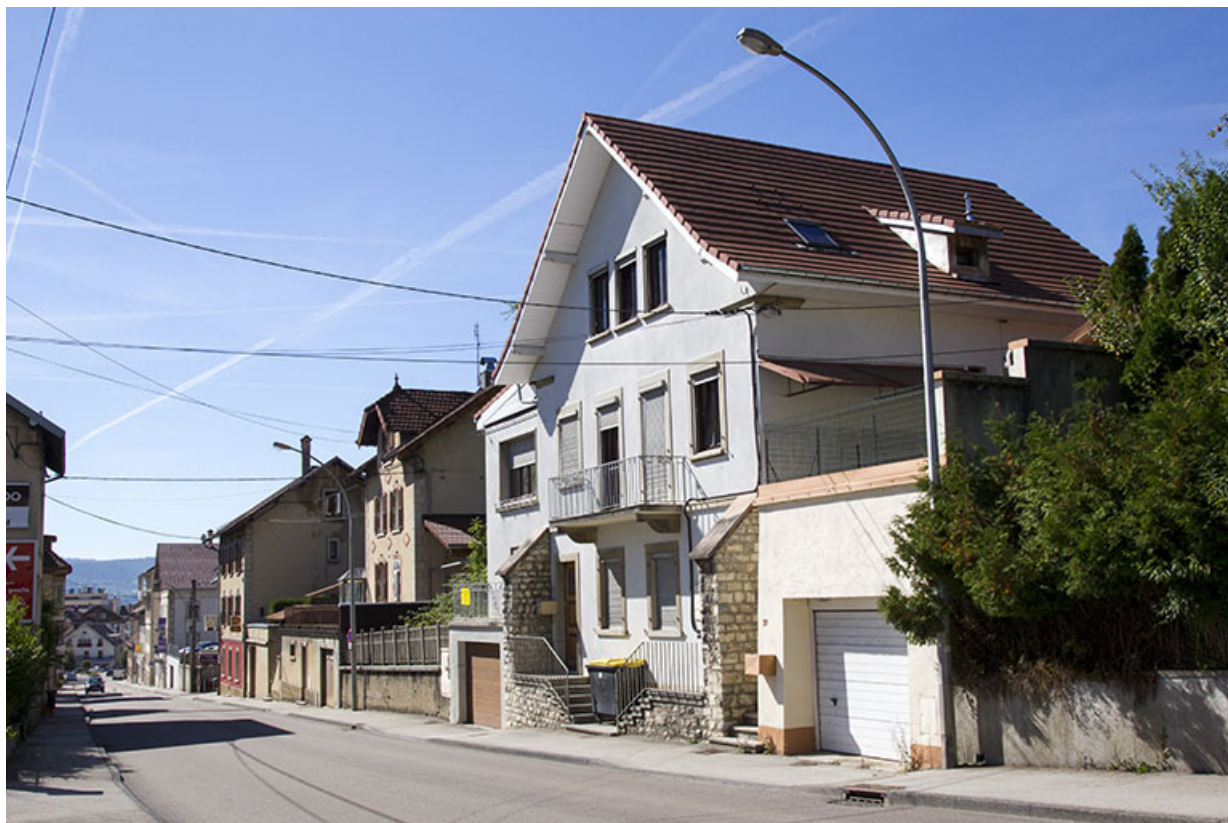
Vue d'ensemble, depuis le nord-est. 25, Morteau, 25-27 rue de la Louhière