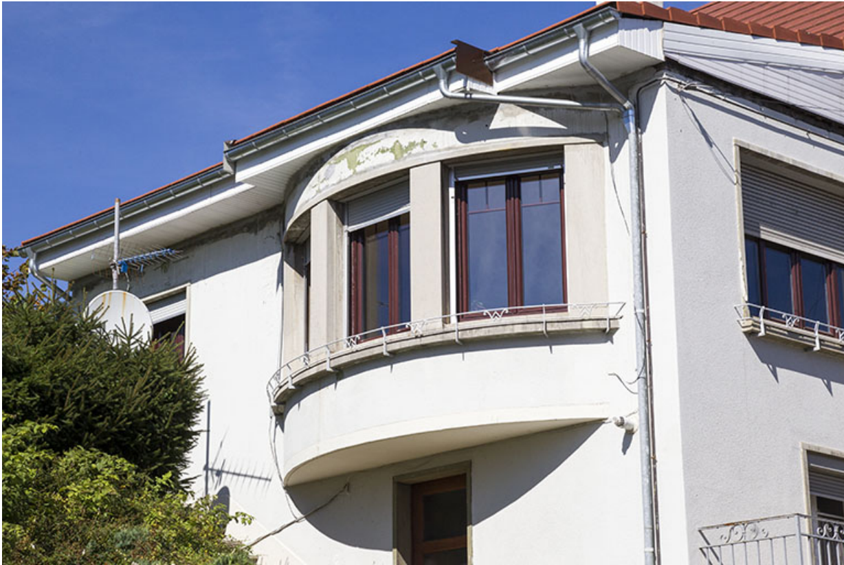
Façade latérale gauche : le bow-window.