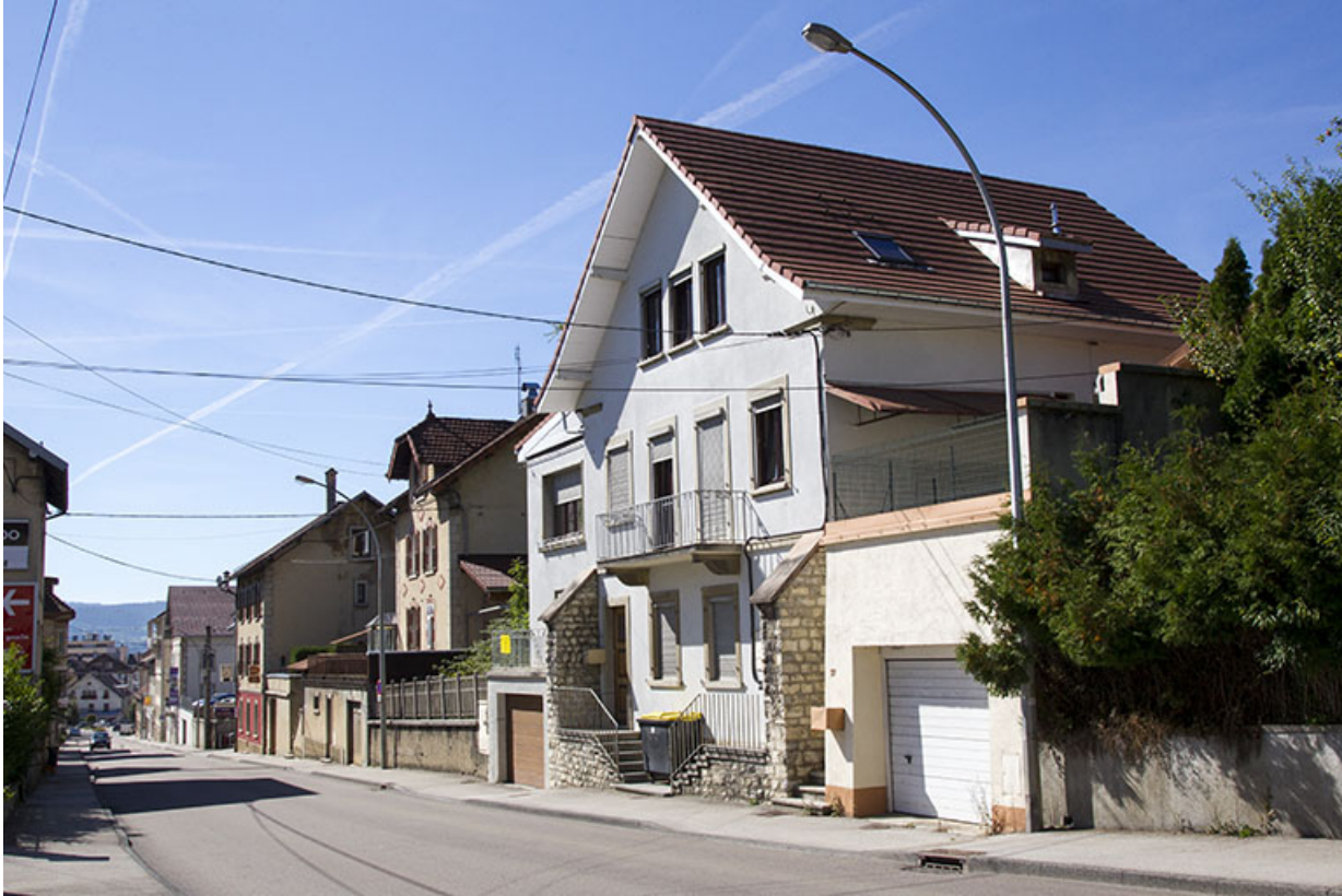
Vue d'ensemble, depuis le nord-est.