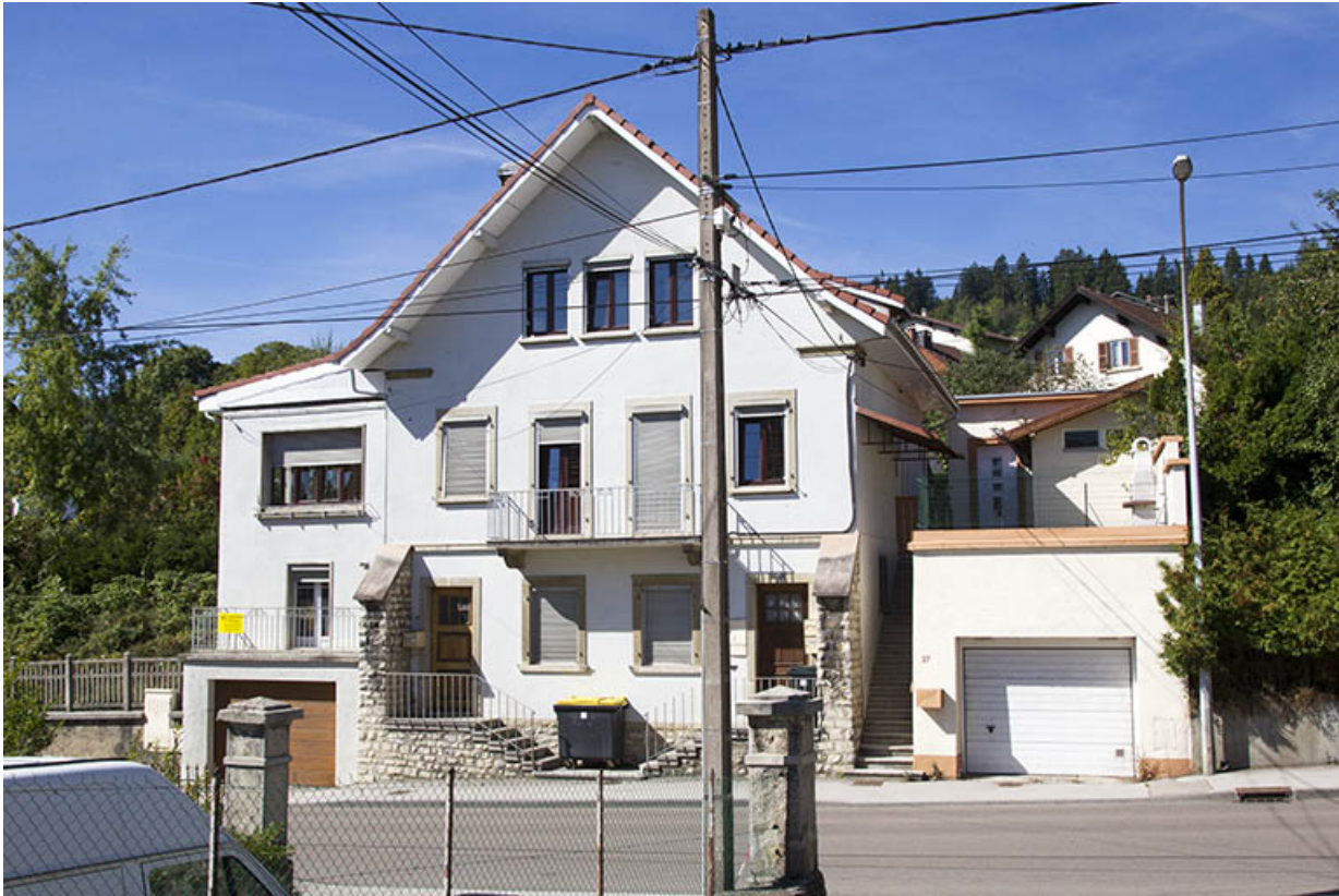
Façade antérieure, de trois quarts droite.