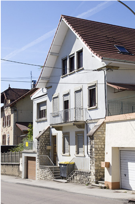
Façade antérieure, vue en enfilade de trois quarts droite.