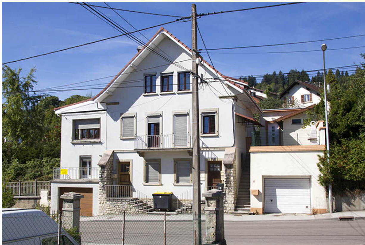
Façade antérieure, de trois quarts droite.