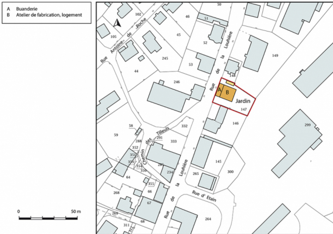
Plan-masse et de situation. Extrait du plan cadastral, 2018, section AE, 1/1 000. 25, Morteau, 22 rue de la Louhière