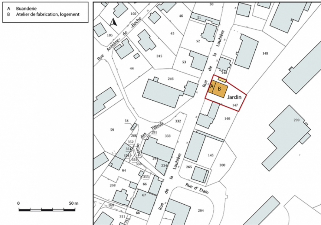
Plan-masse et de situation. Extrait du plan cadastral, 2018, section AE, 1/1 000. 25, Morteau, 22 rue de la Louhière