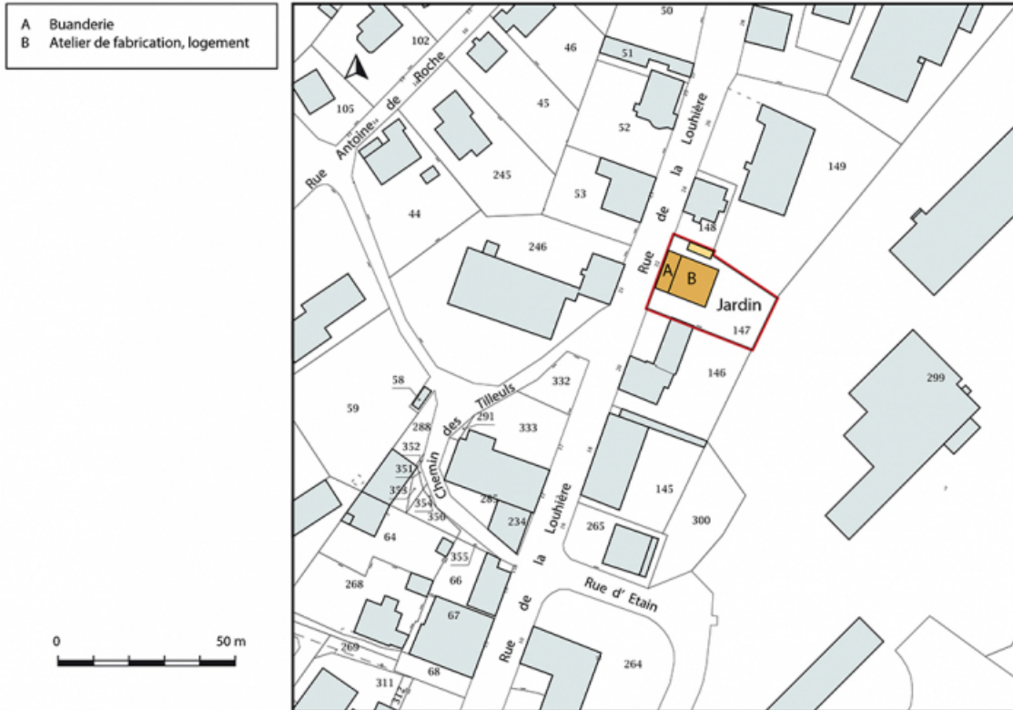
Plan-masse et de situation. Extrait du plan cadastral, 2018, section AE, 1/1 000. 25, Morteau, 22 rue de la Louhière