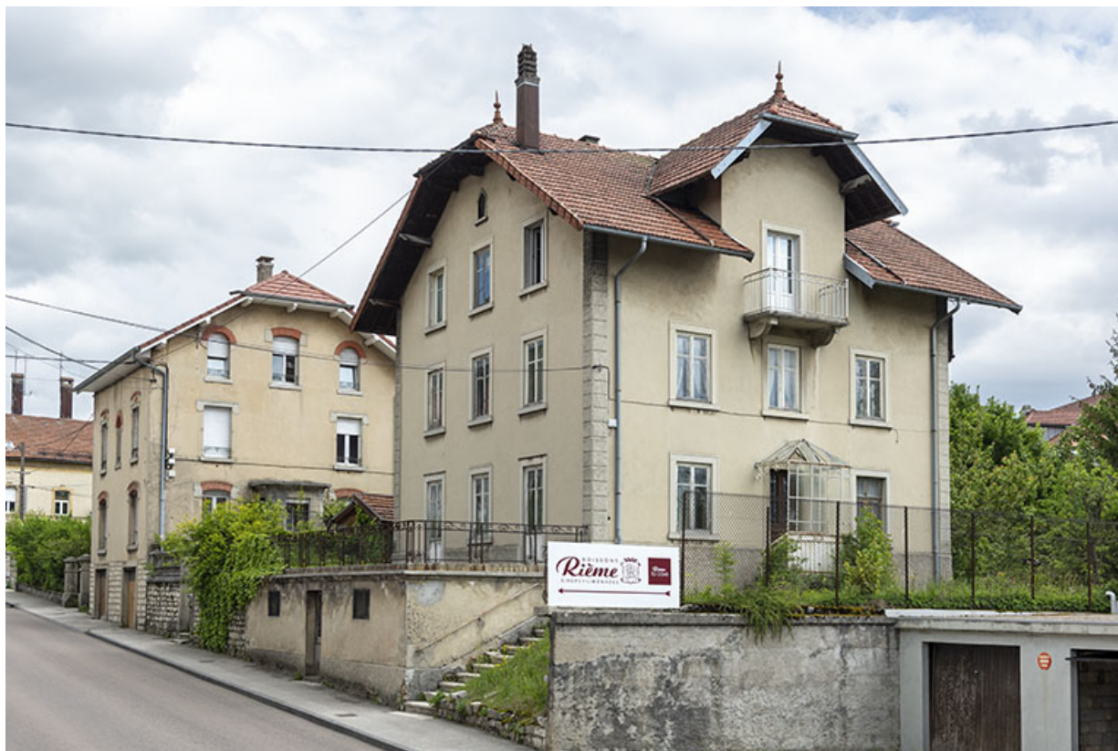
Vue d'ensemble rapprochée, depuis le sud-ouest.