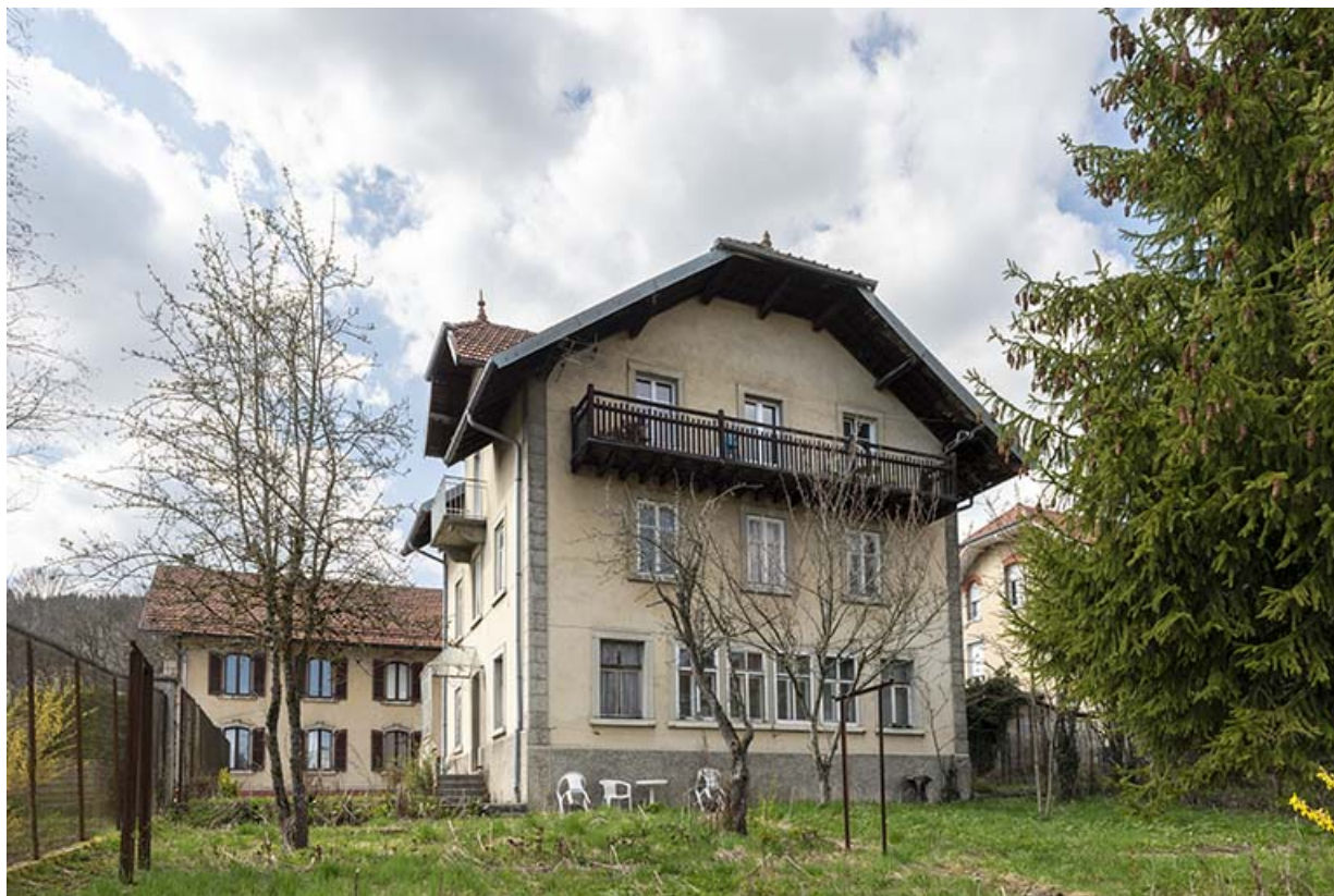
Façade postérieure, de trois quarts gauche.