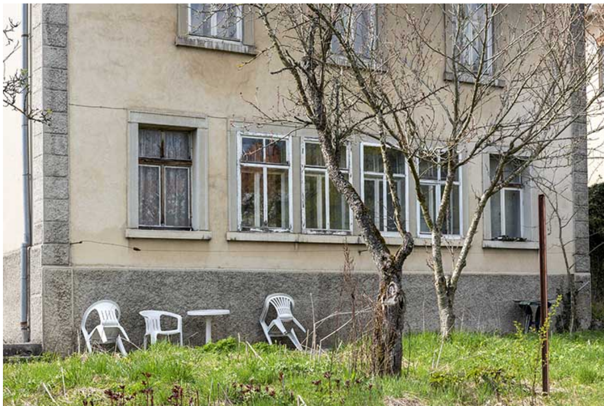
Façade postérieure : fenêtres multiples de l'atelier.