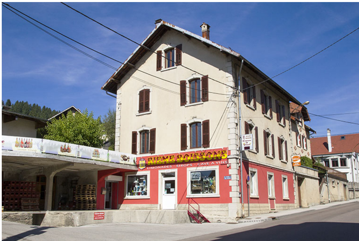
Maison (façades antérieure et latérale gauche) et quais de chargement.