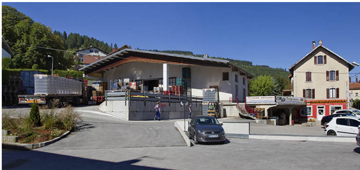
Vue d'ensemble, depuis le sud-ouest.