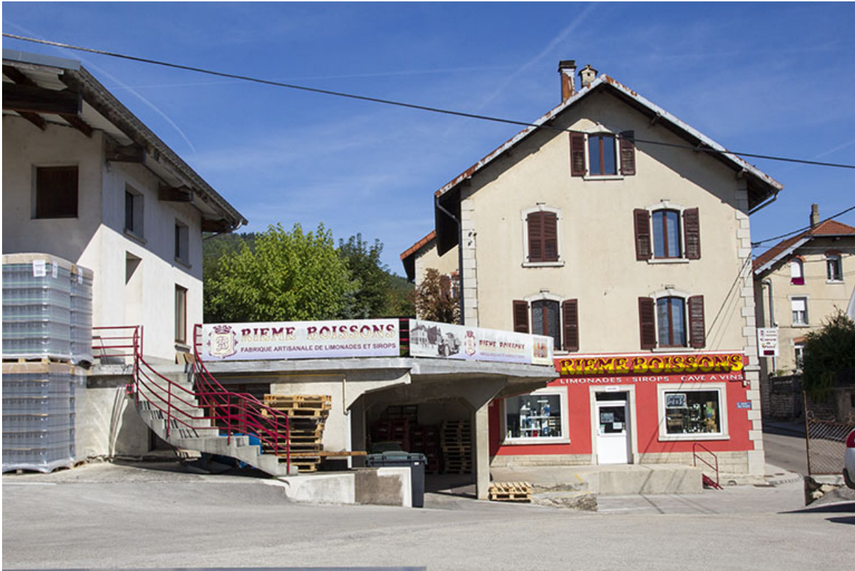
Maison (façade latérale gauche) et quais de chargement. 25, Morteau, 21 rue de la Louhière