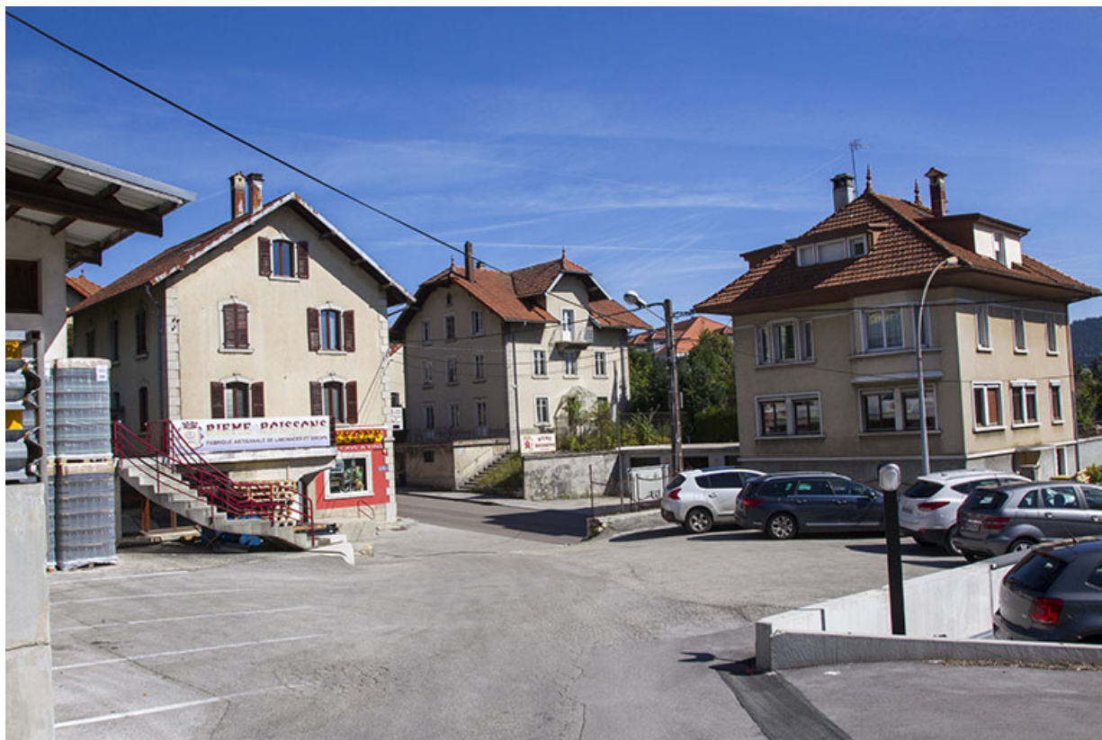
Maison (façade latérale gauche) et rue de la Louhière. 25, Morteau, 21 rue de la Louhière