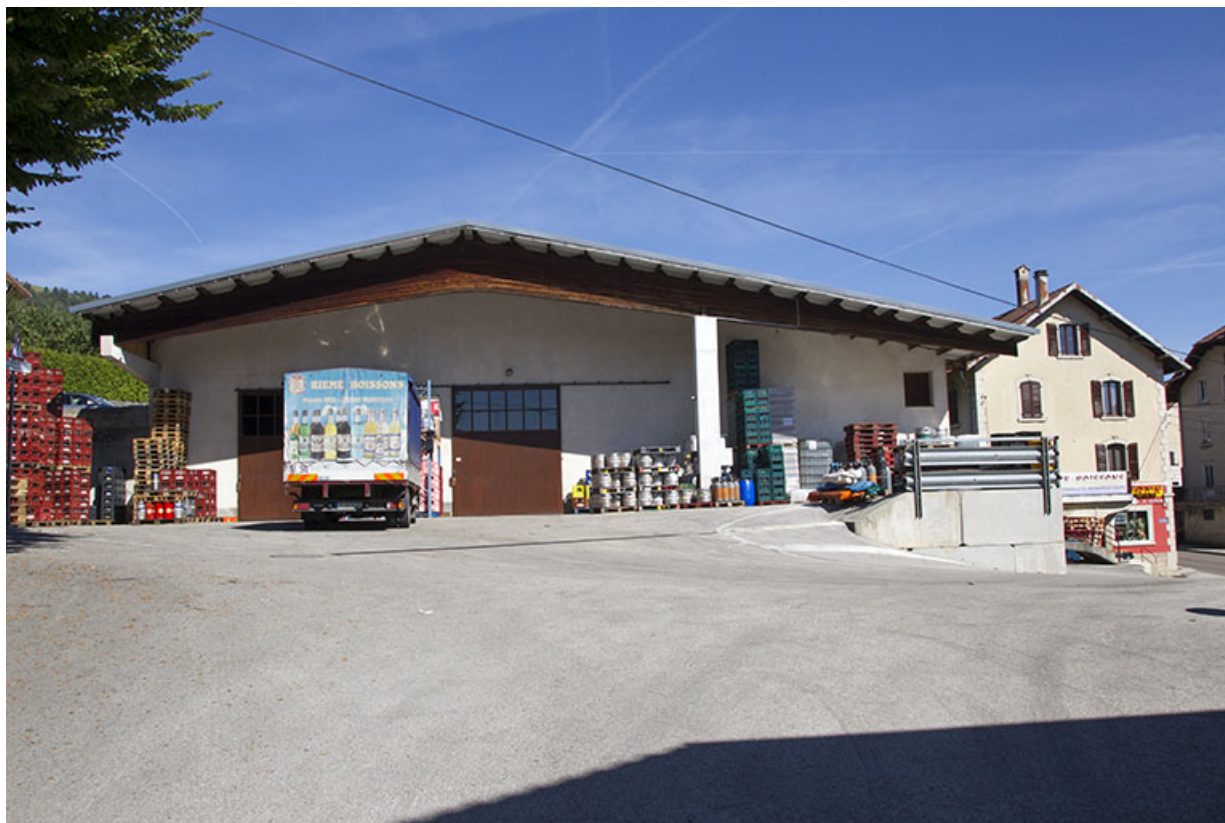
Grand entrepôt, depuis le sud. 25, Morteau, 21 rue de la Louhière