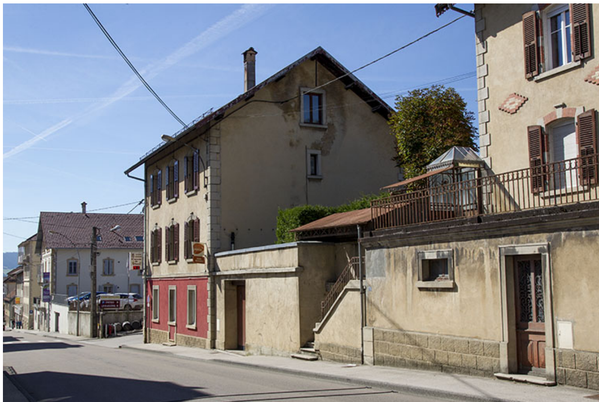
Maison et garage, vus du nord. 25, Morteau, 21 rue de la Louhière