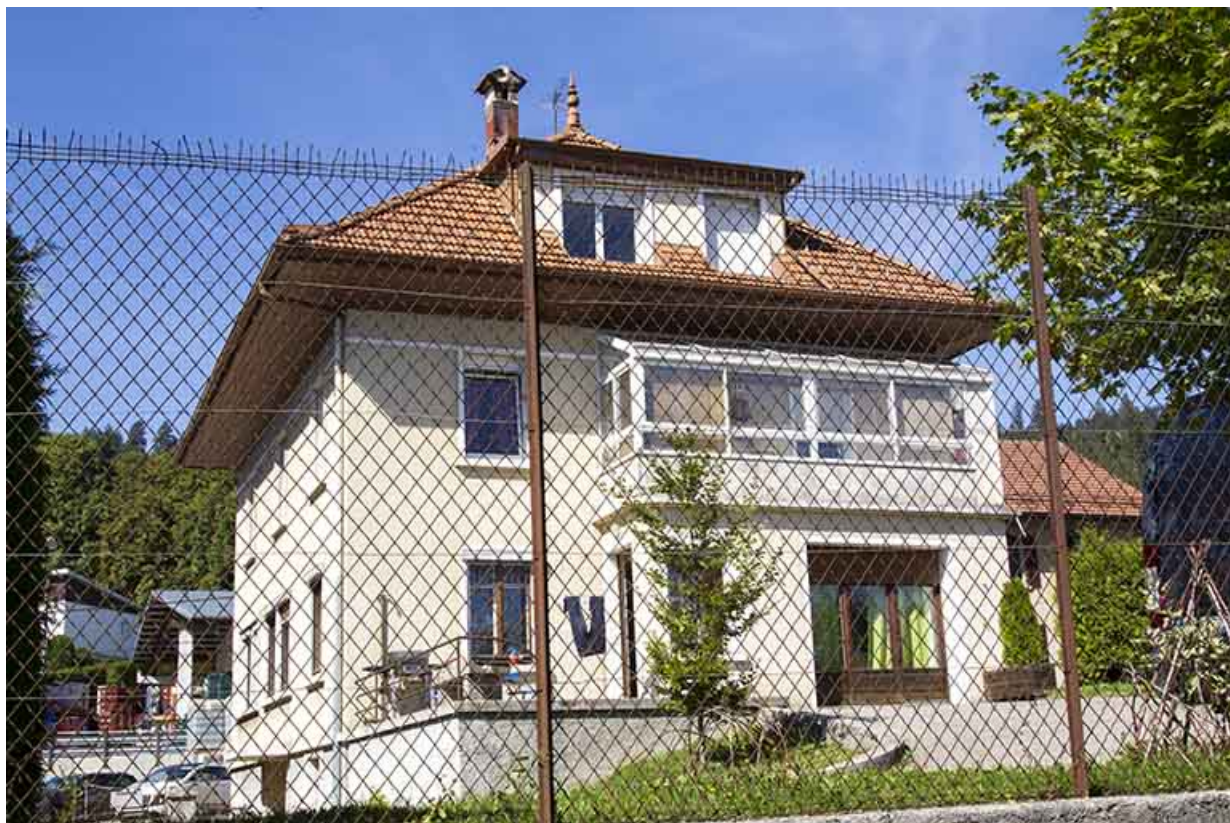
Façade postérieure, de trois quarts gauche. 25, Morteau, 20 rue de la Louhière