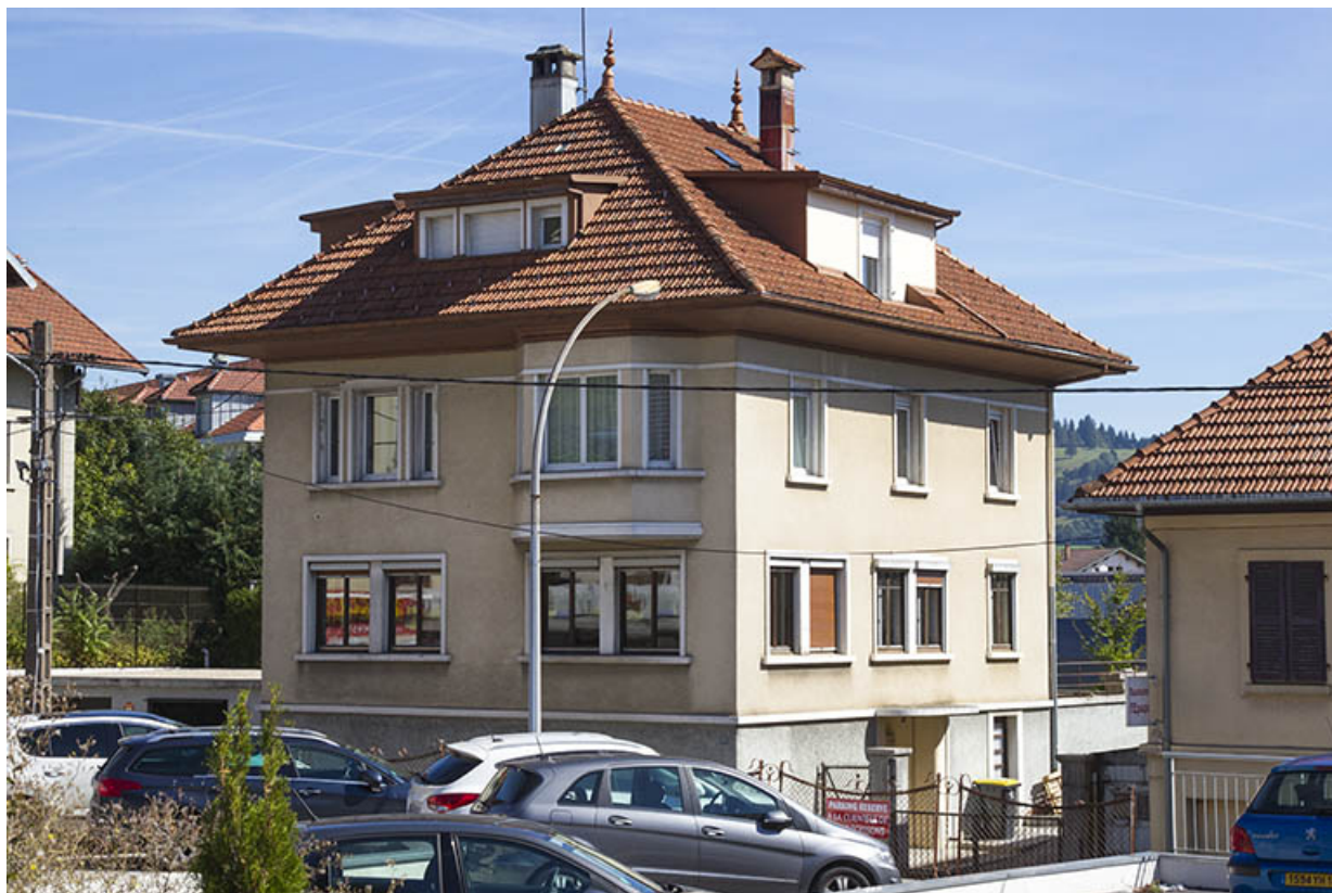
Vue d'ensemble, depuis le sud-ouest.