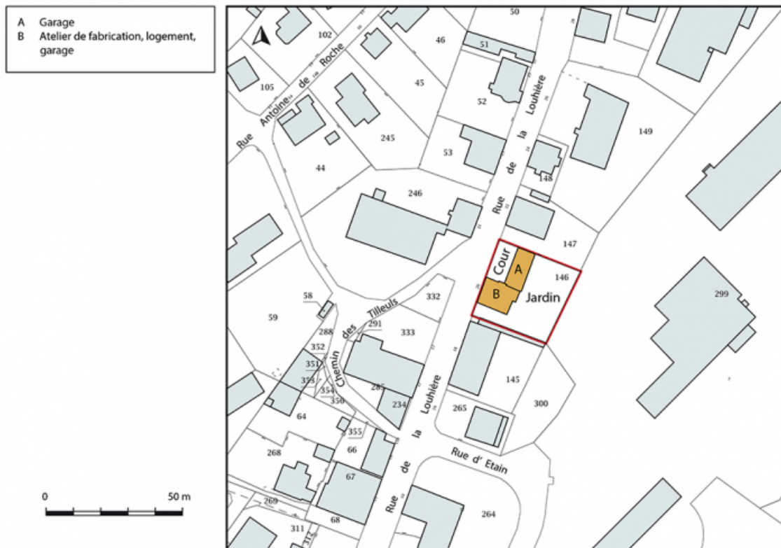
Plan-masse et de situation. Extrait du plan cadastral, 2018, section AE, 1/1 000. 25, Morteau, 20 rue de la Louhière