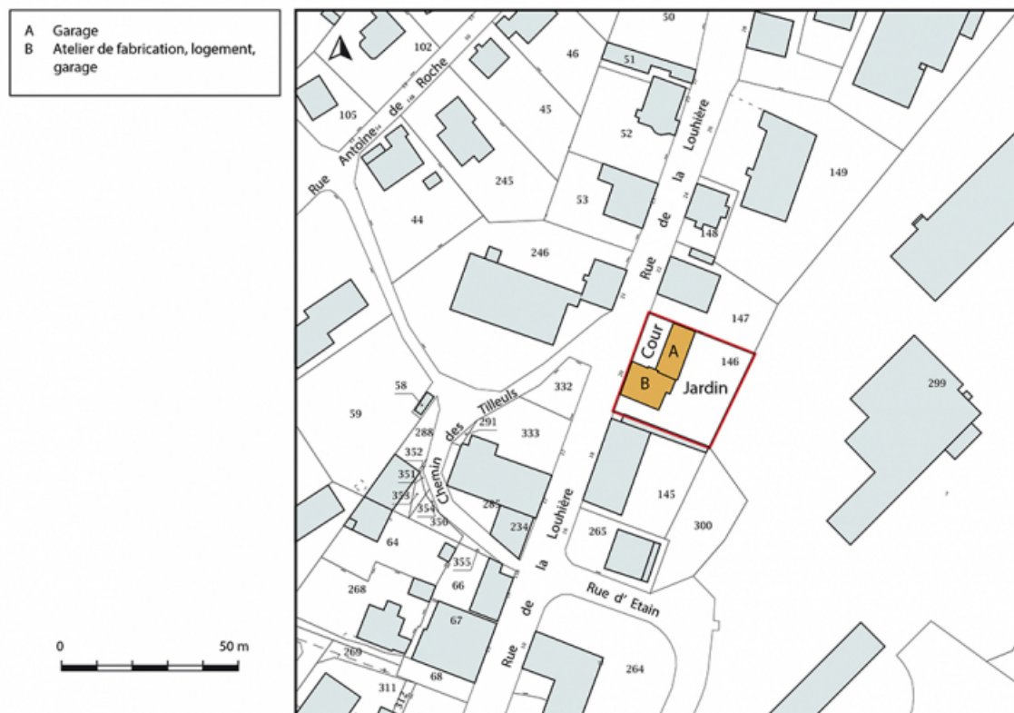
Plan-masse et de situation. Extrait du plan cadastral, 2018, section AE, 1/1 000.