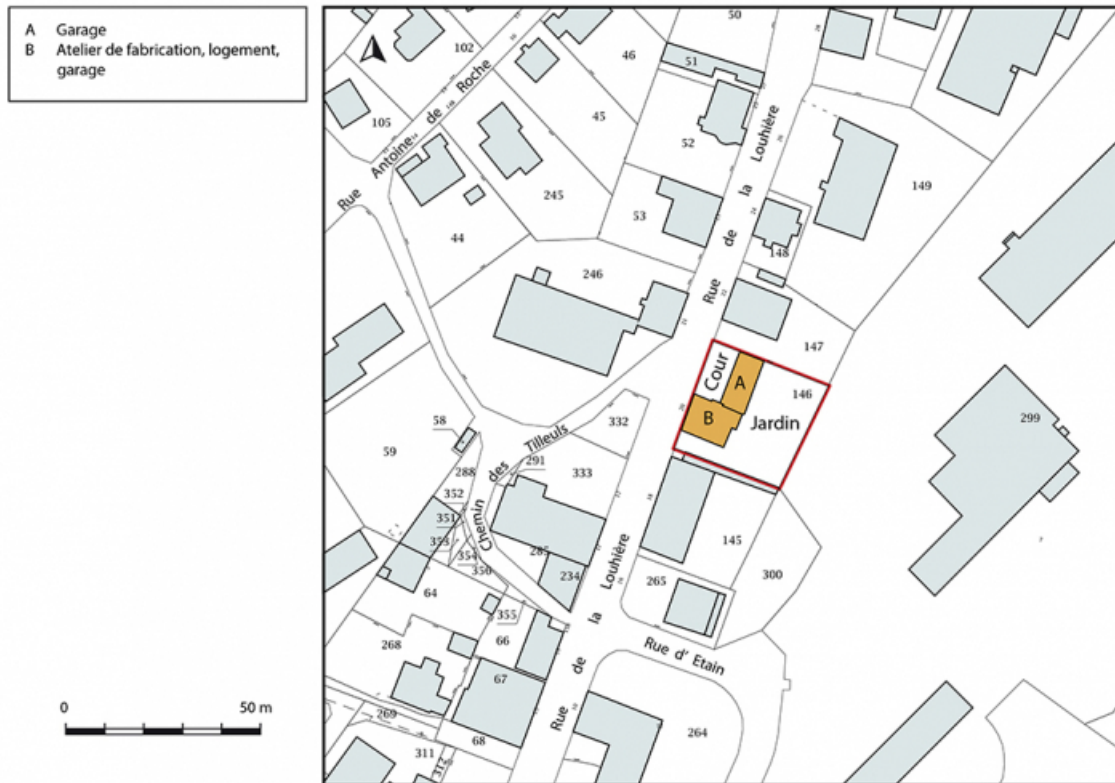
Plan-masse et de situation. Extrait du plan cadastral, 2018, section AE, 1/1 000. 25, Morteau, 20 rue de la Louhière