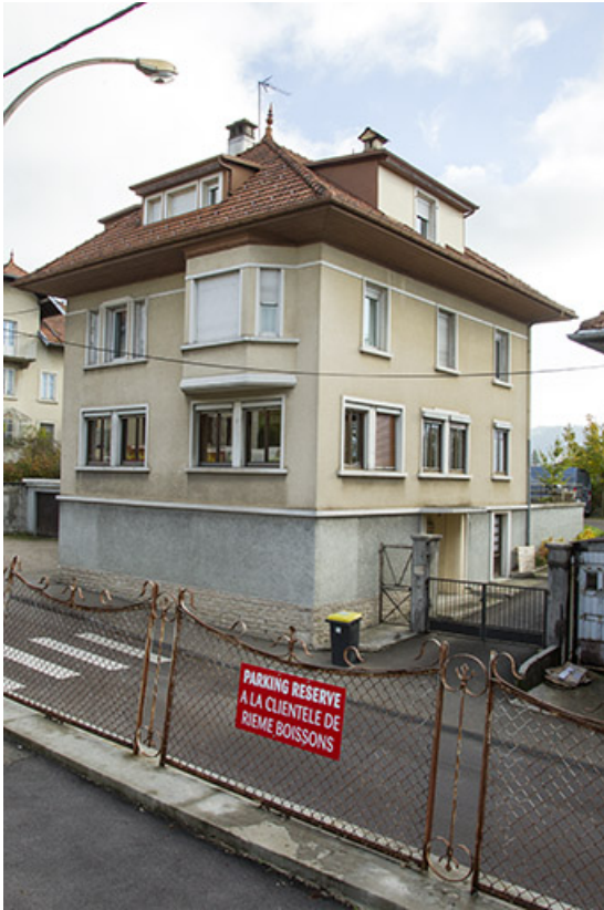
Façades antérieure et latérale droite.