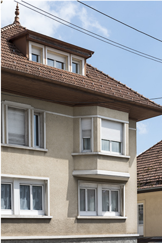
Façade antérieure : baies des étages et oriel. 25, Morteau, 20 rue de la Louhière