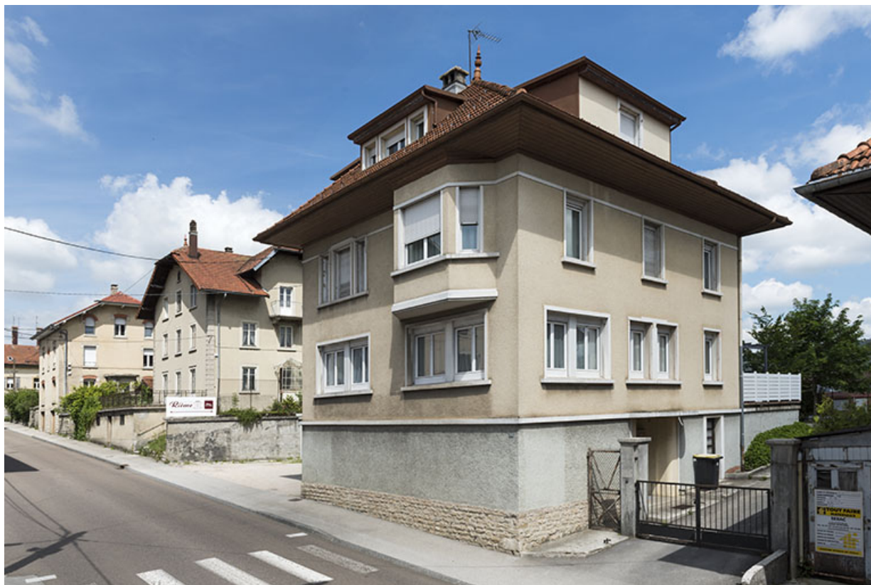
Vue d'ensemble dans la rue depuis le sud-ouest : la maison est visible au 2e plan. 25, Morteau