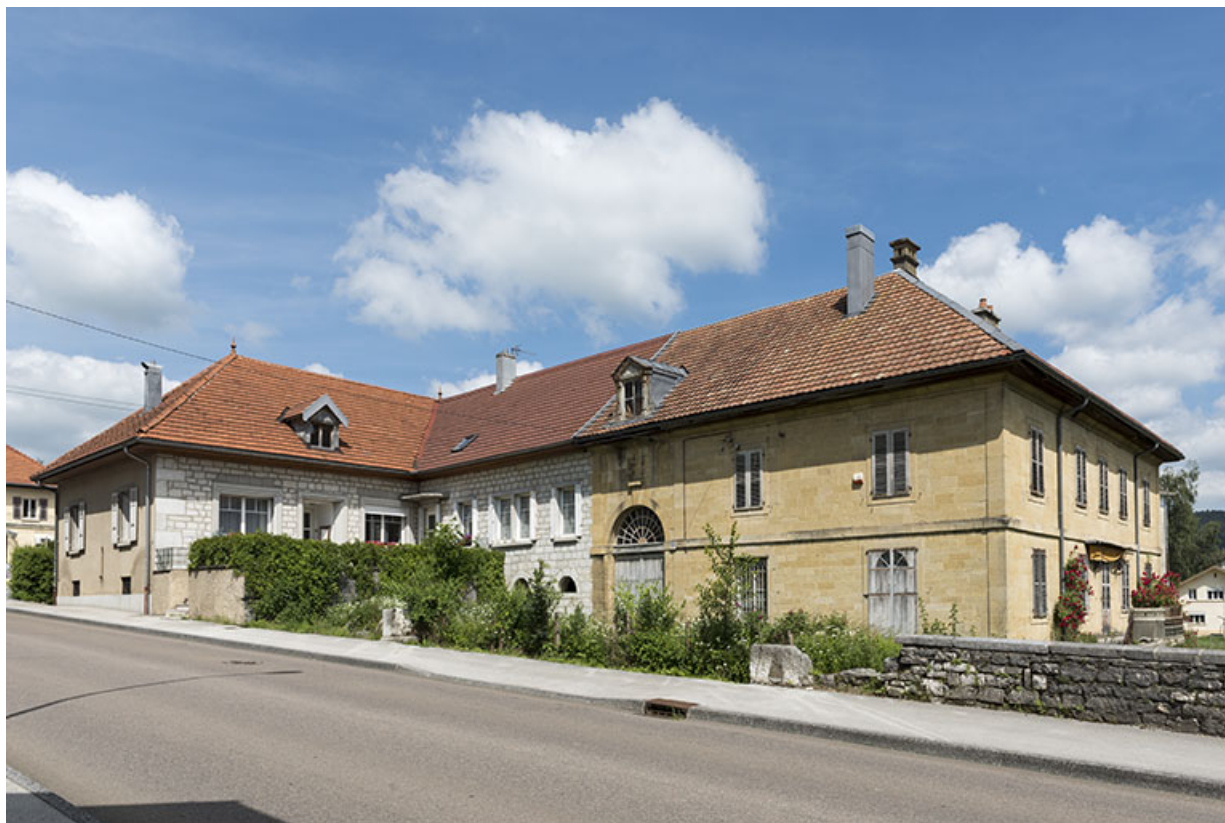
Vue d'ensemble, depuis le sud-ouest.