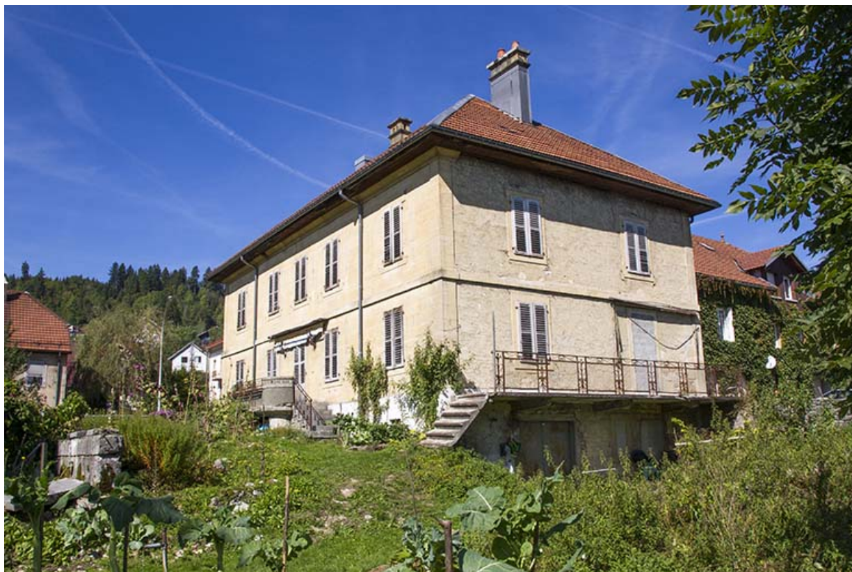
Corps sud : façades postérieure et latérale droite.