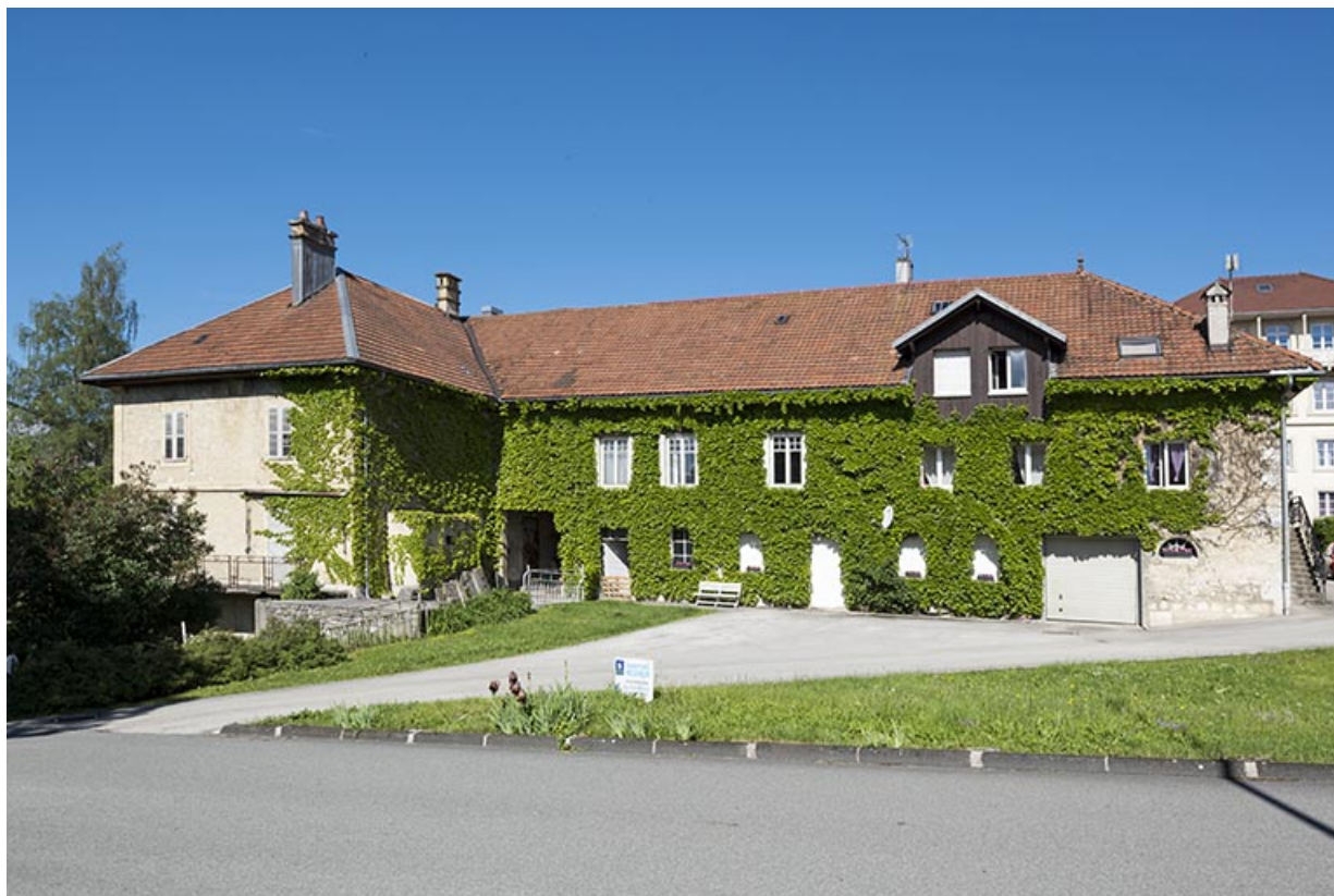
Vue d'ensemble, depuis le nord-est.