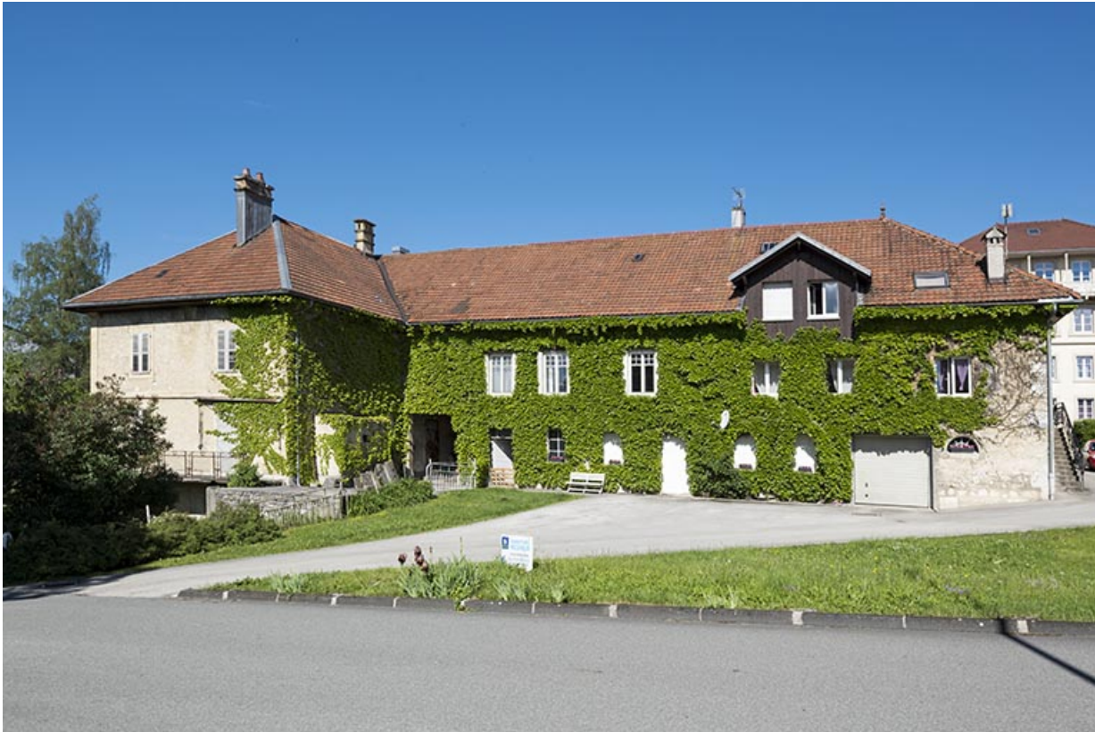
Vue d'ensemble, depuis le nord-est.