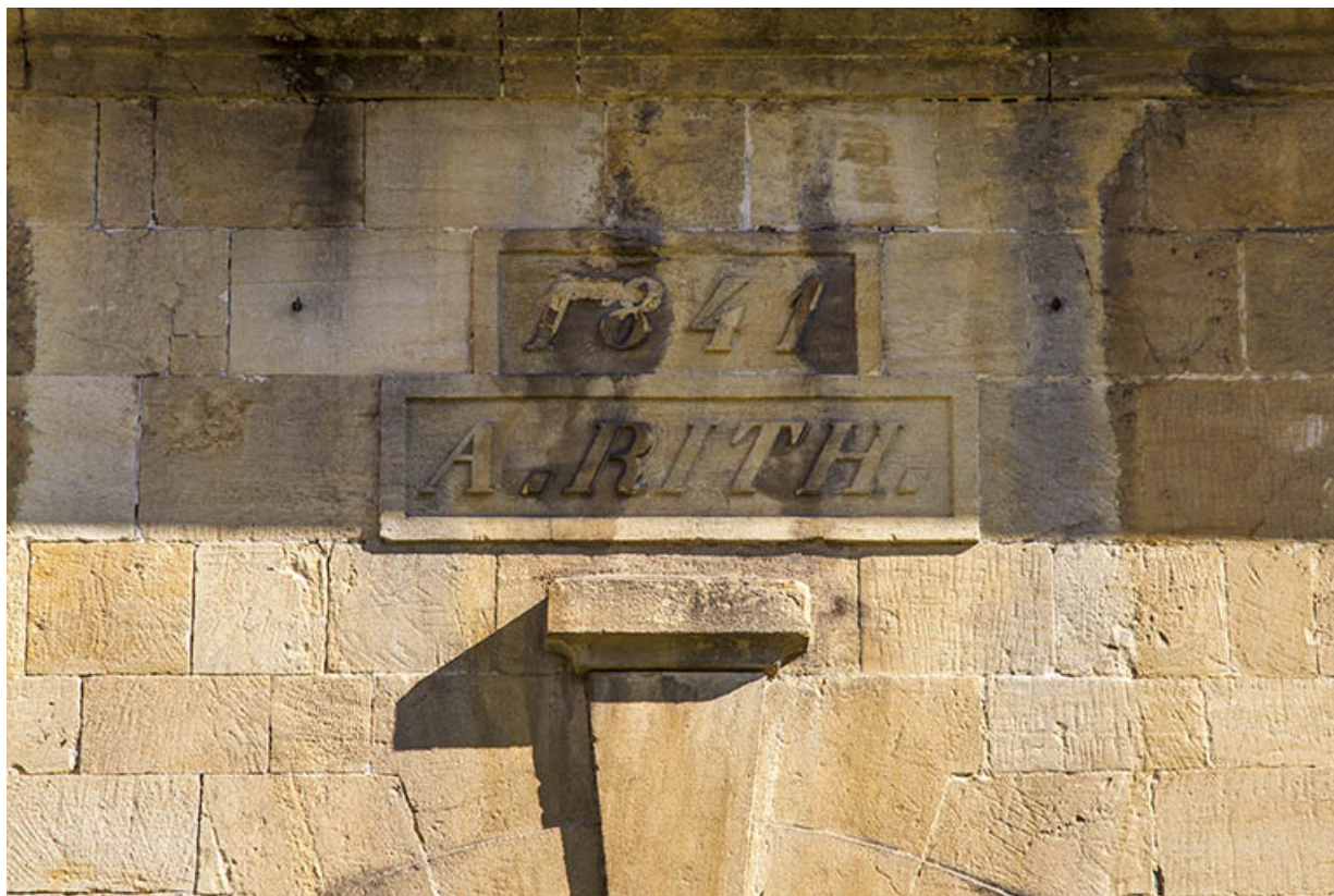
Corps sud, façade antérieure : date et inscription au-dessus de l'entrée de la grange. 25, Morteau, 8-10 rue de la Louhière