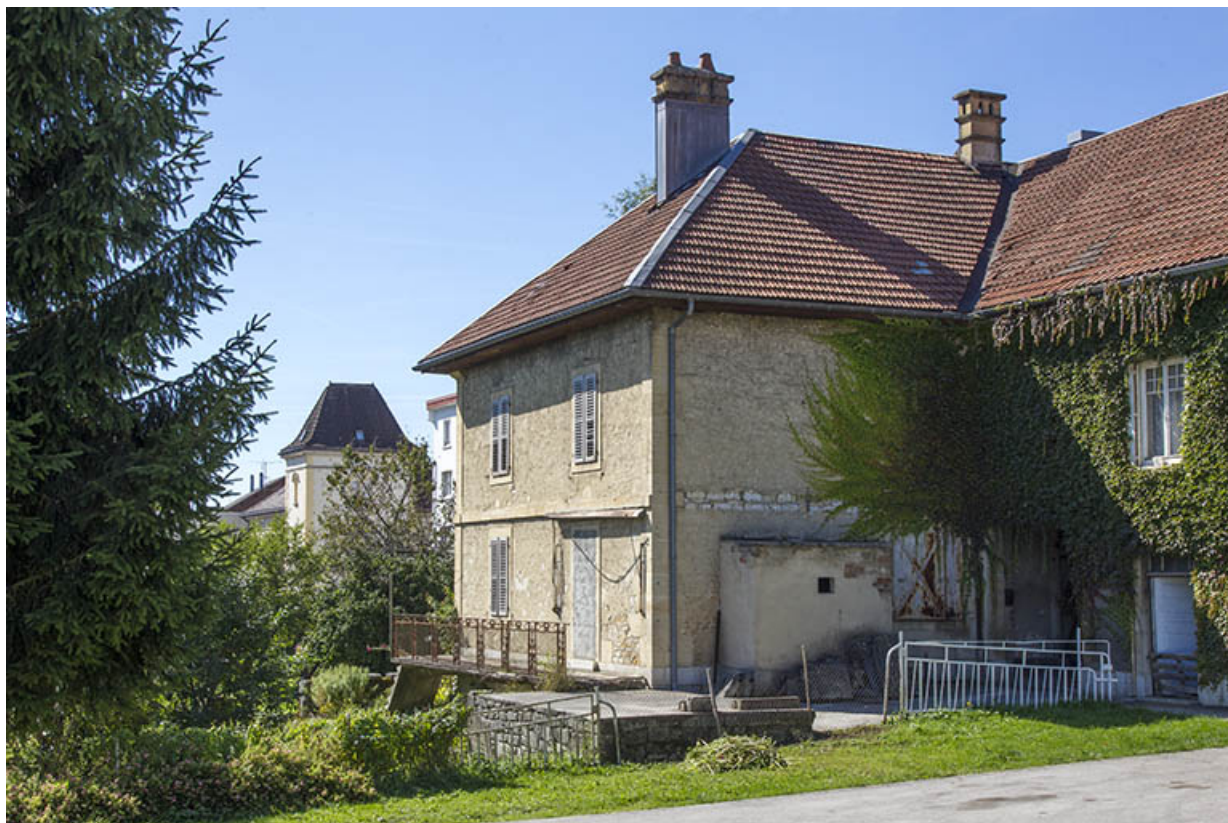
Corps sud : façades postérieure et latérale gauche.