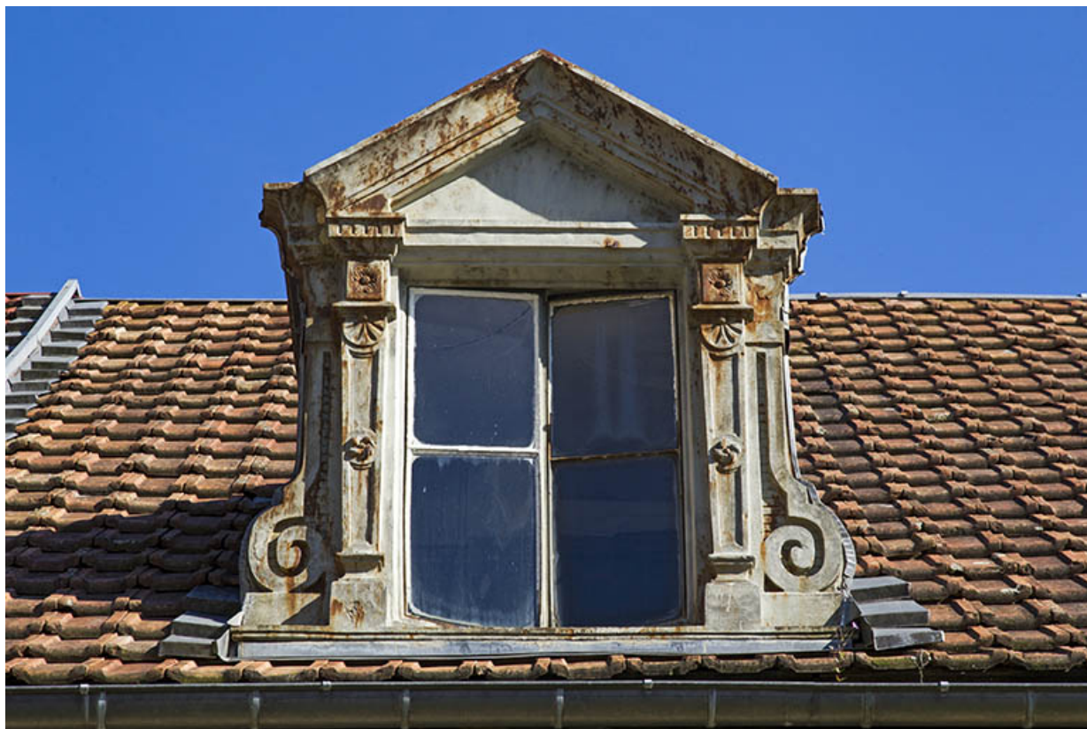
Corps sud, façade antérieure : lucarne.