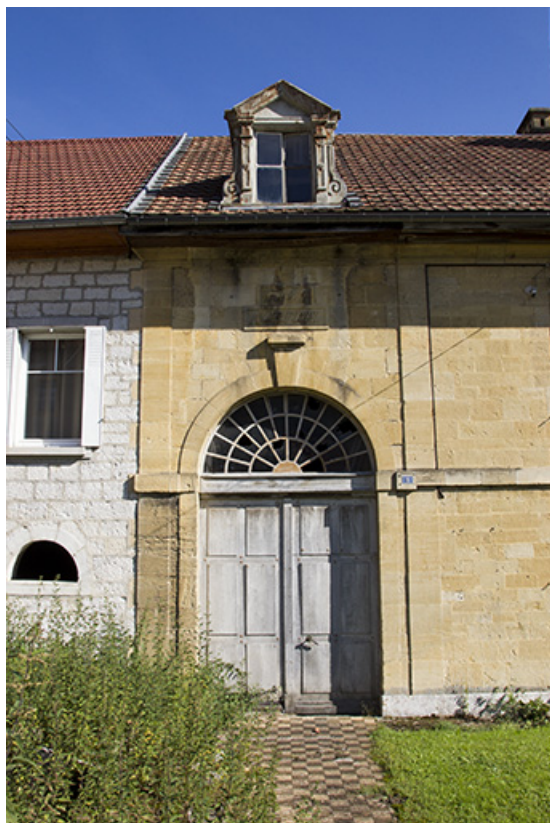
Corps sud, façade antérieure : entrée de la grange. 25, Morteau, 8-10 rue de la Louhière