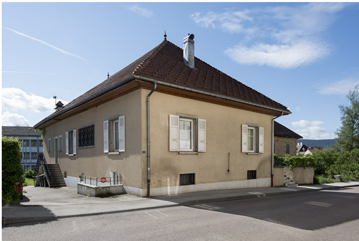
Corps nord : façades antérieure et latérale gauche.