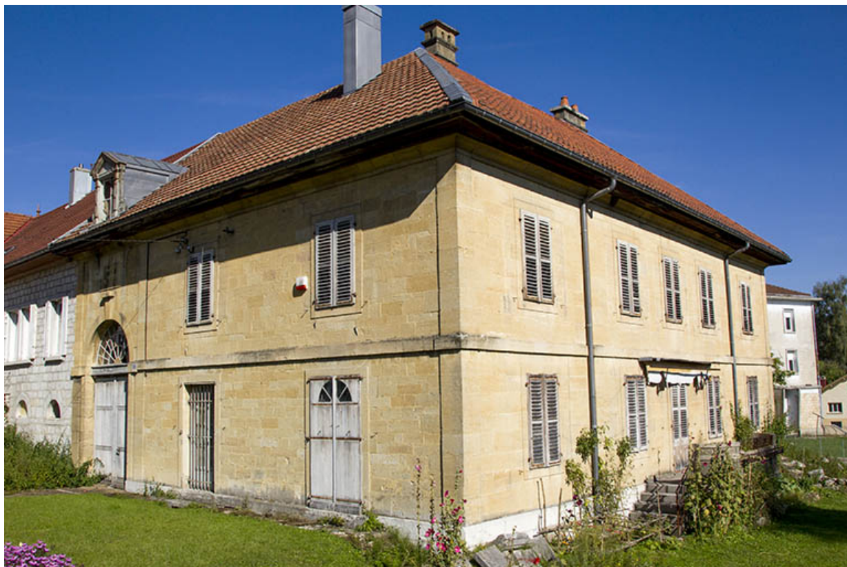
Corps sud : façades antérieure et latérale droite.