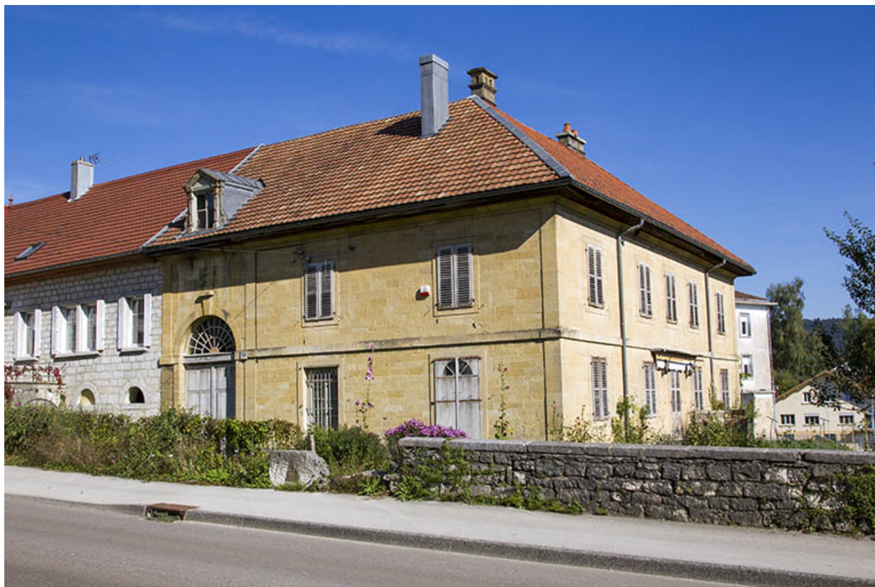
Corps sud : vue d'ensemble, depuis le sud-ouest.