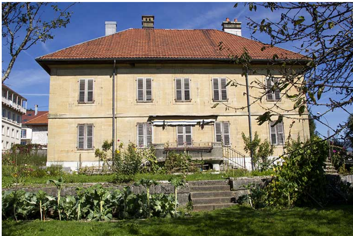
Corps sud : façade latérale droite.