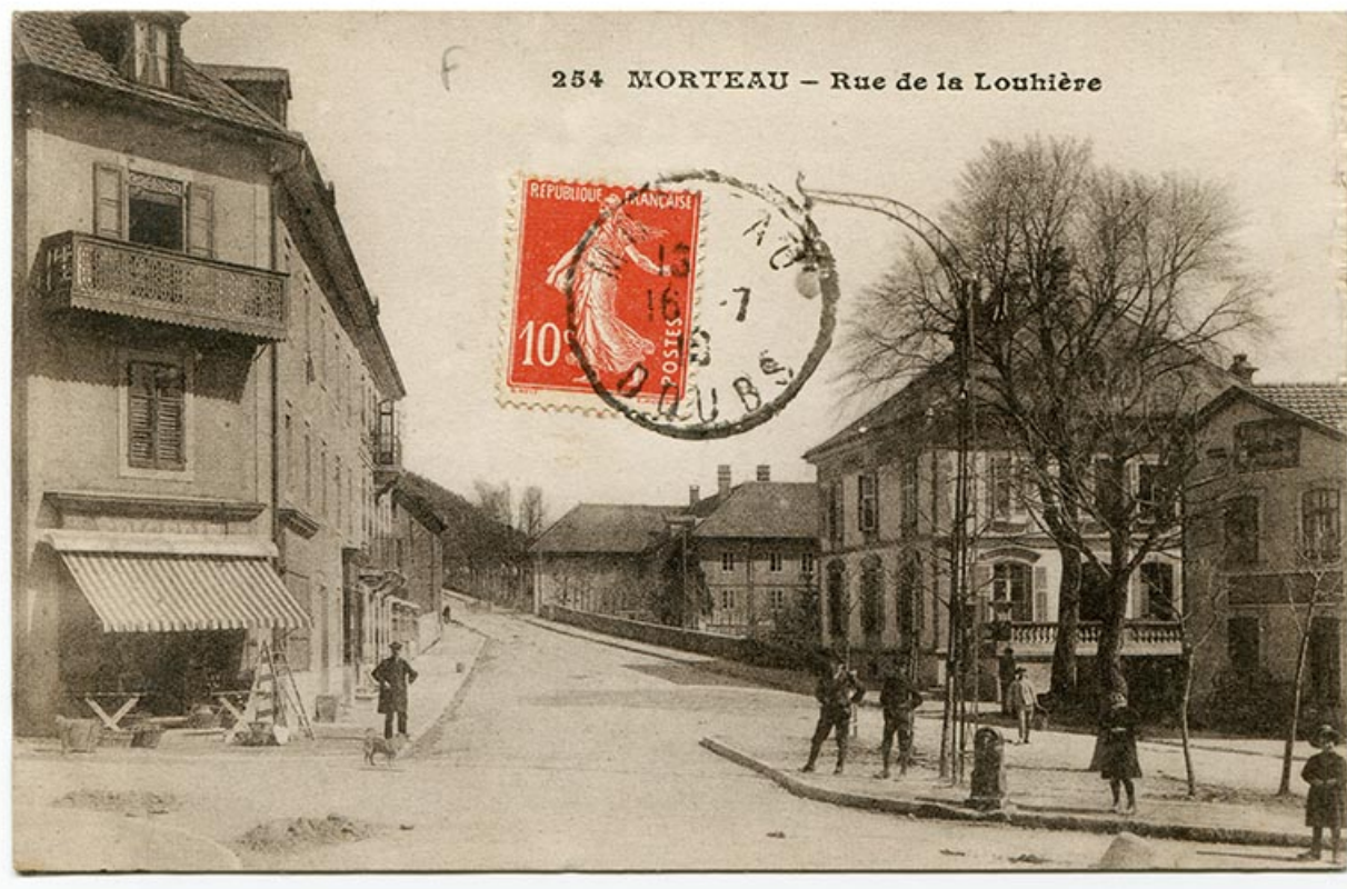
254 Morteau - Rue de la Louhière, 1er quart 20e siècle [avant 1910 ?]. 25, Morteau, 2 rue de la Louhière