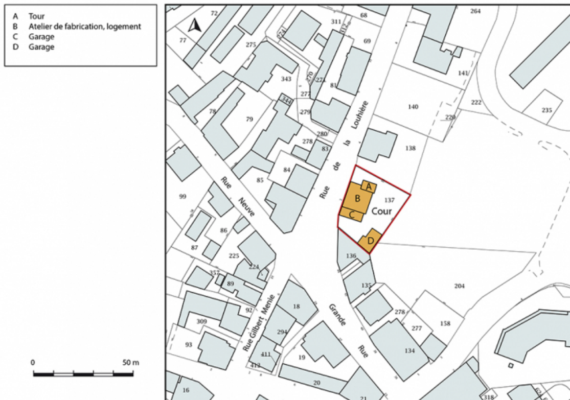
Plan-masse et de situation. Extrait du plan cadastral, 2018, section AE, 1/1 000. 25, Morteau, 2 rue de la Louhière