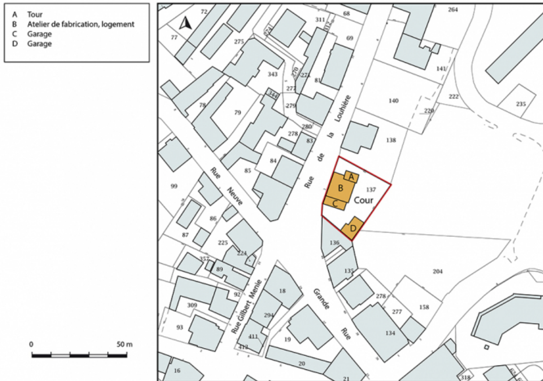
Plan-masse et de situation. Extrait du plan cadastral, 2018, section AE, 1/1 000. 25, Morteau, 2 rue de la Louhière