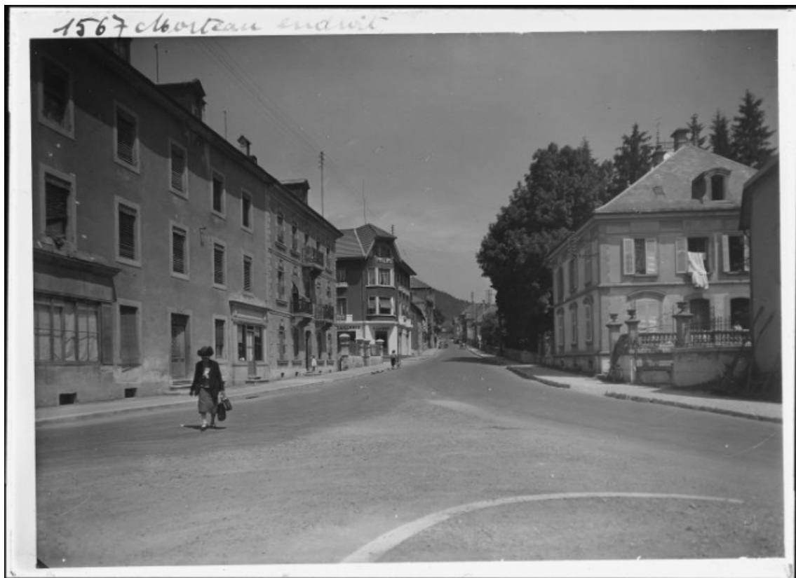
[Le bas de la rue de la Louhière], milieu 20e siècle. 25, Morteau, 2 rue de la Louhière