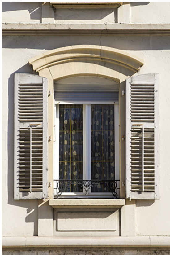
Façade antérieure : fenêtre du rez-de-chaussée. 25, Morteau, 2 rue de la Louhière