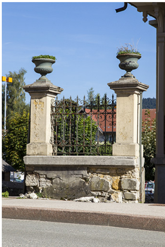
Mur de clôture côté rue de la Louhière.