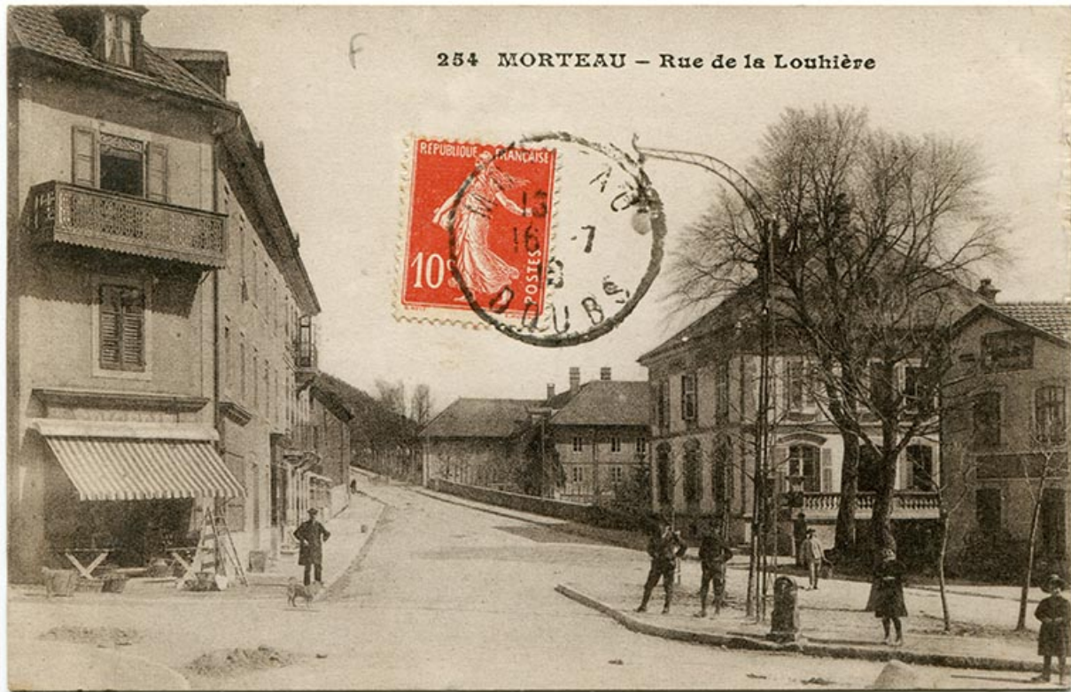
254 Morteau - Rue de la Louhière, 1er quart 20e siècle [avant 1910 ?]. 25, Morteau, 2 rue de la Louhière