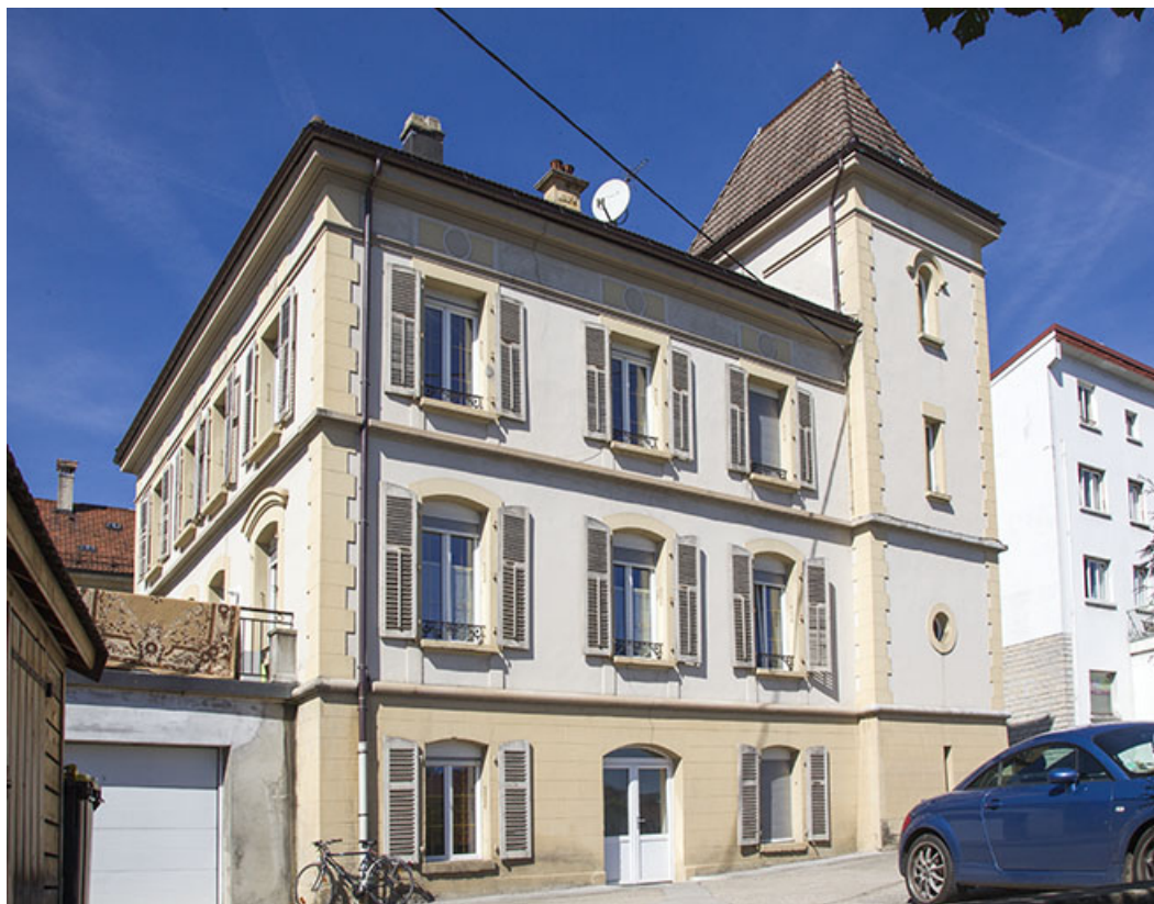
Façades postérieure et latérale droite.