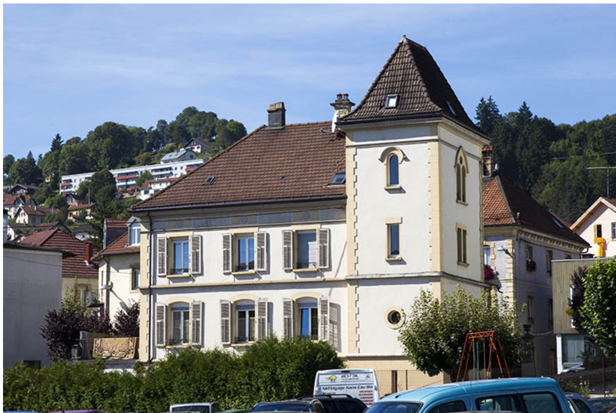
Façade postérieure, de trois quarts droite.