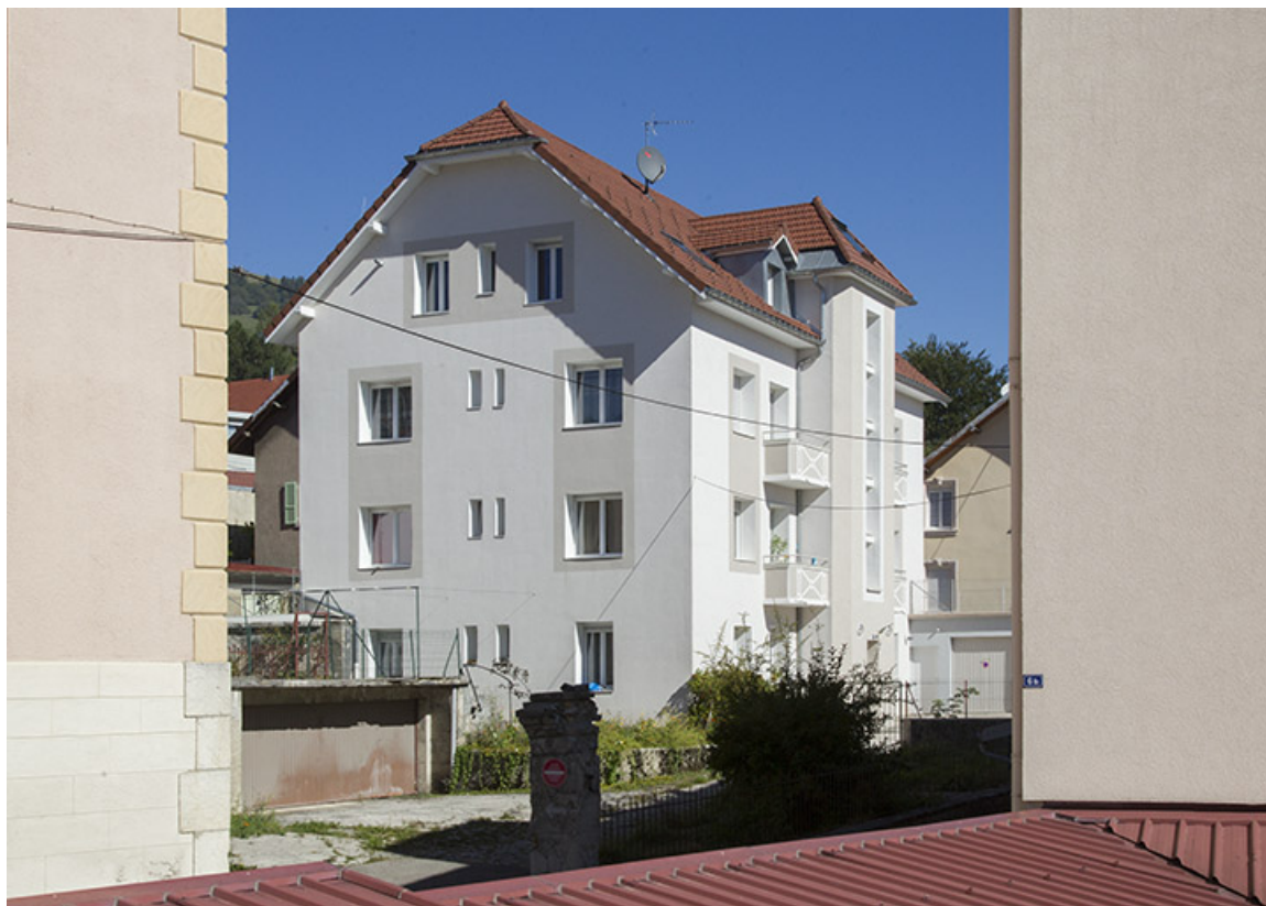
Bâtiment nord : vue d'ensemble, depuis le sud.