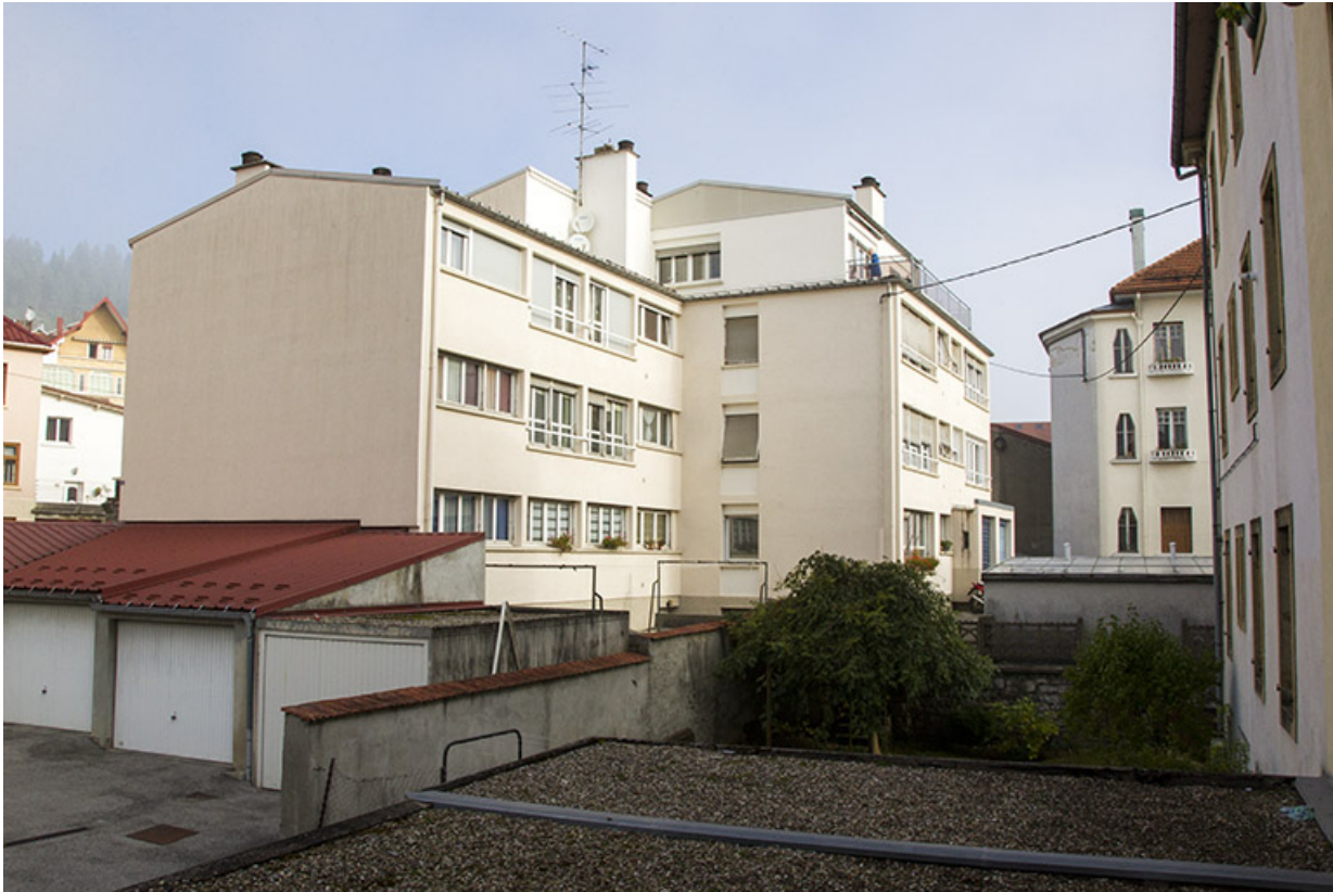
Bâtiment sud : vue d'ensemble, depuis le sud.