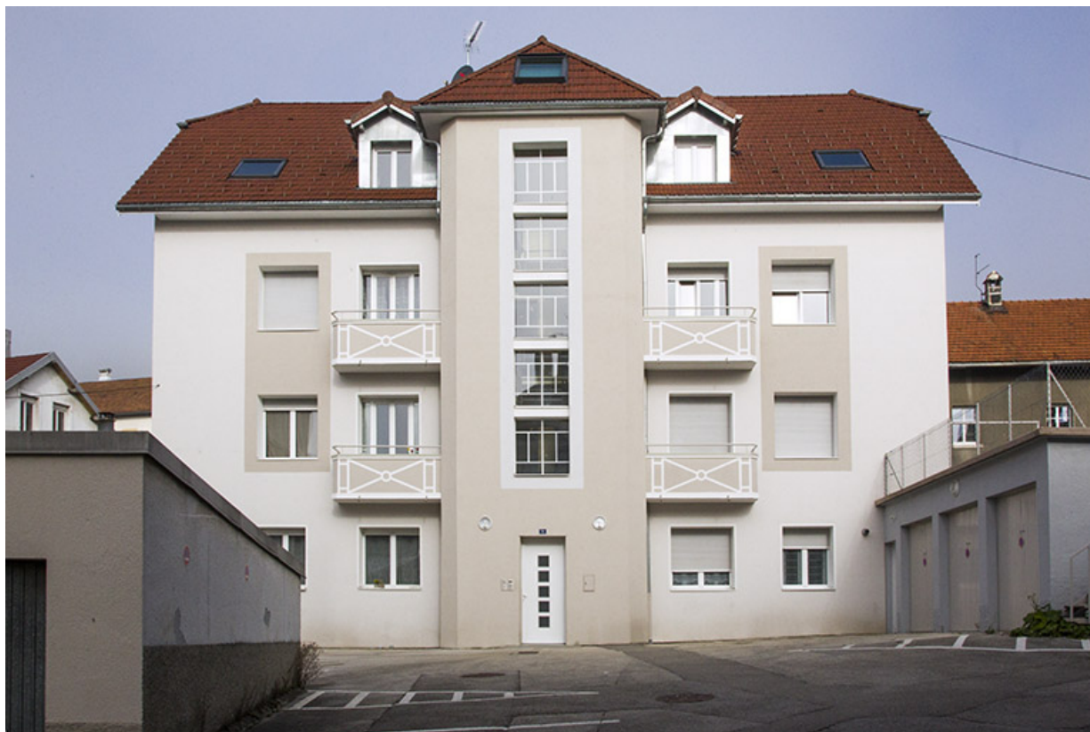
Bâtiment nord : façade antérieure.