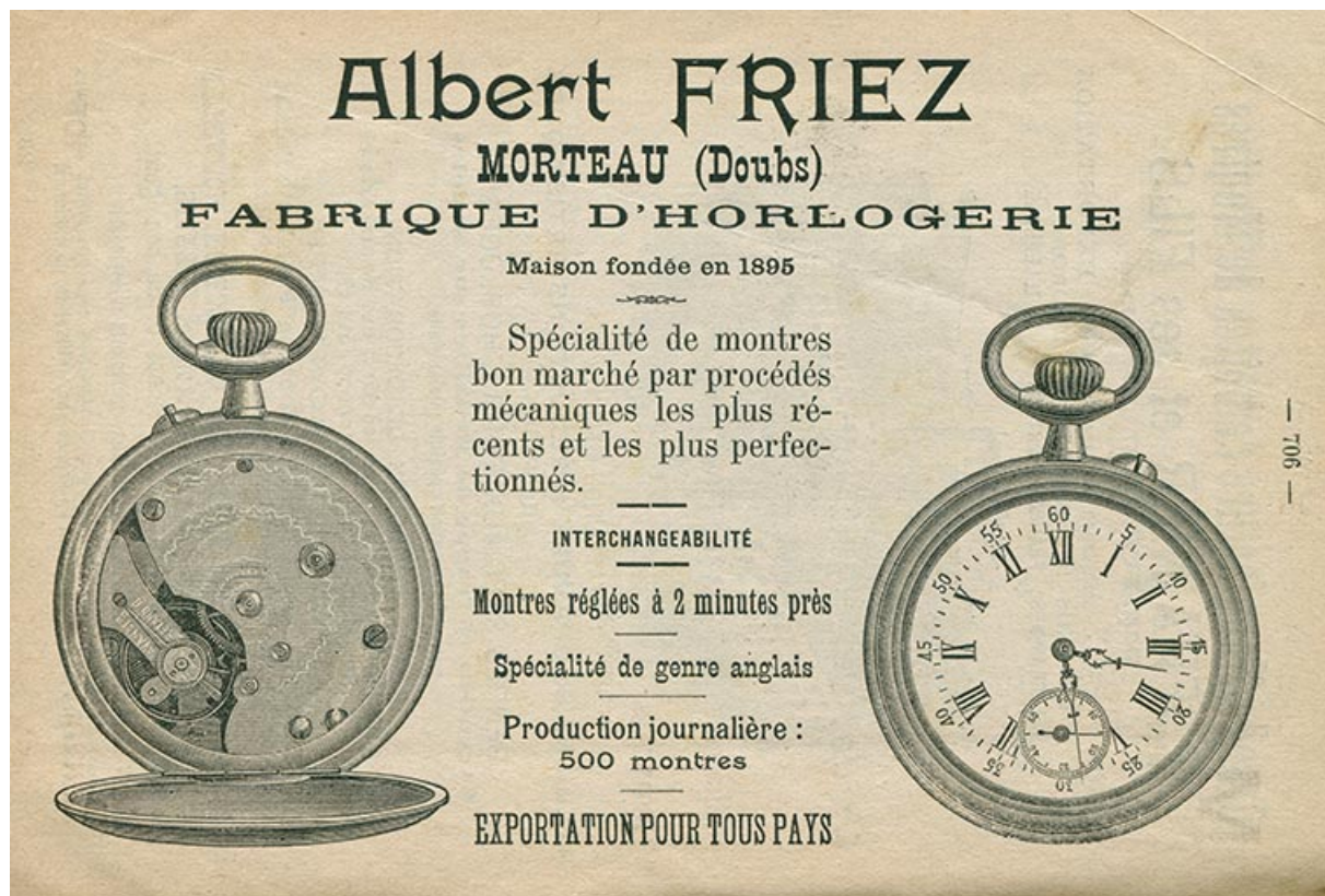
Publicité pour la société Albert Friez, 1902.