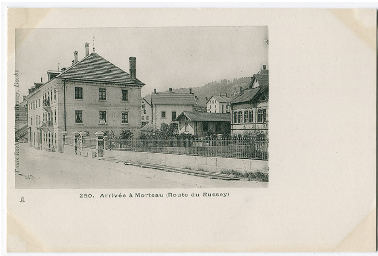
250. Arrivée à Morteau (route du Russey), 4e quart 19e siècle. L'usine Friez est partiellement visible à droite. 25, Morteau, 3-5 chemin des Lilas