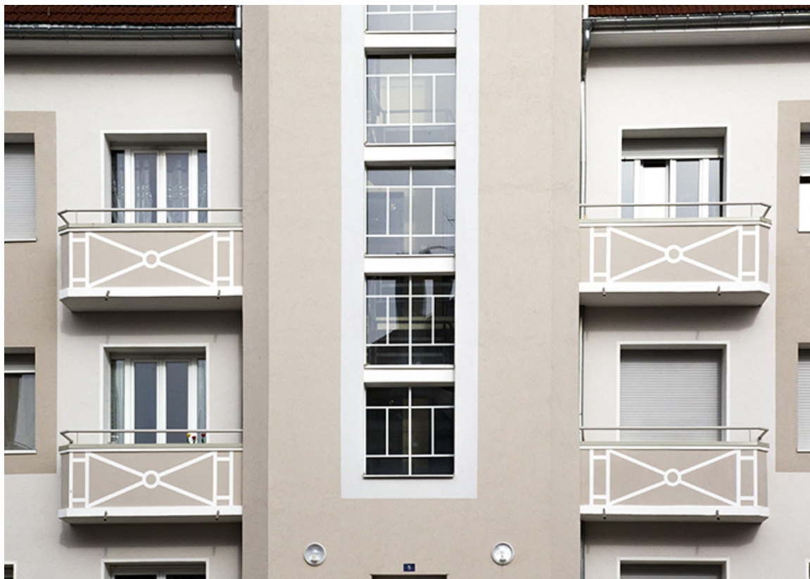
Bâtiment nord : travées centrales de la façade antérieure.