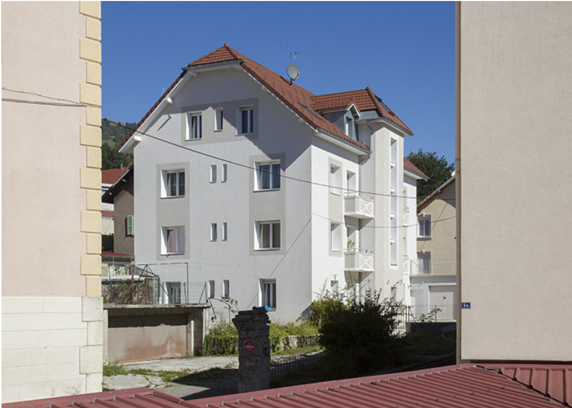
Bâtiment nord : vue d'ensemble, depuis le sud.