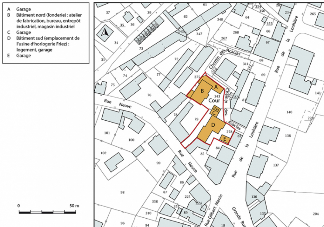
Plan-masse et de situation. Extrait du plan cadastral, 2018, section AC, 1/1 000. 25, Morteau, 3-5 chemin des Lilas