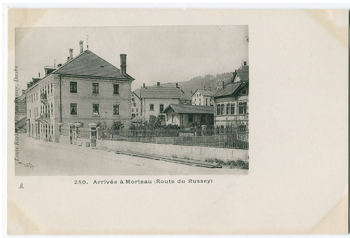
250. Arrivée à Morteau (route du Russey), 4e quart 19e siècle. L'usine Friez est partiellement visible à droite. 25, Morteau, 3-5 chemin des Lilas

250. Arrivée à Morteau (route du Russey), carte postale, s.n., s.d. [4e quart 19e siècle], Louis Rochet éd. au Russey Avant 1903 (dos)