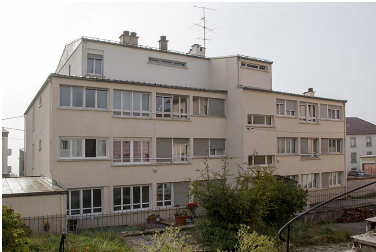
Bâtiment sud : façade postérieure, de trois quarts gauche. 25, Morteau, 3-5 chemin des Lilas