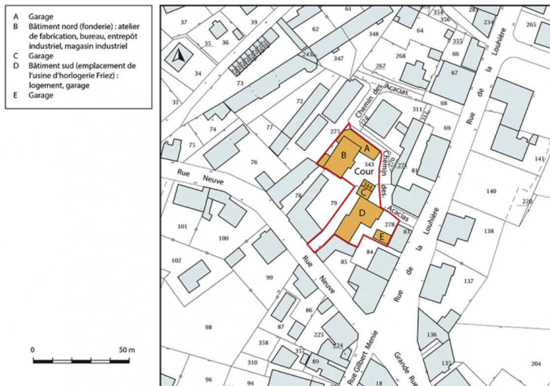
Plan-masse et de situation. Extrait du plan cadastral, 2018, section AC, 1/1 000.