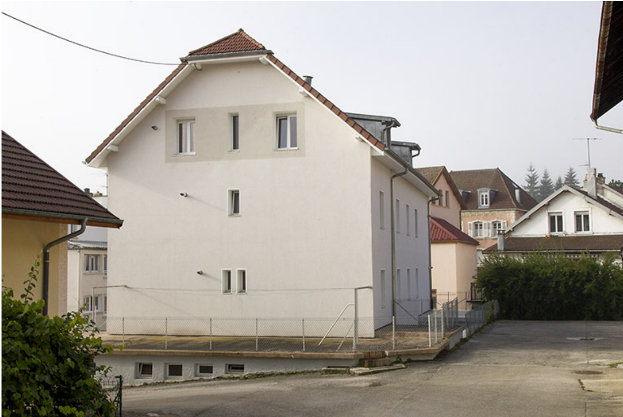
Bâtiment nord : façades latérale droite et postérieure.