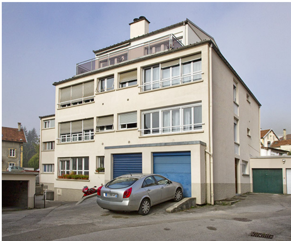
Bâtiment sud : façades antérieure et latérale droite.