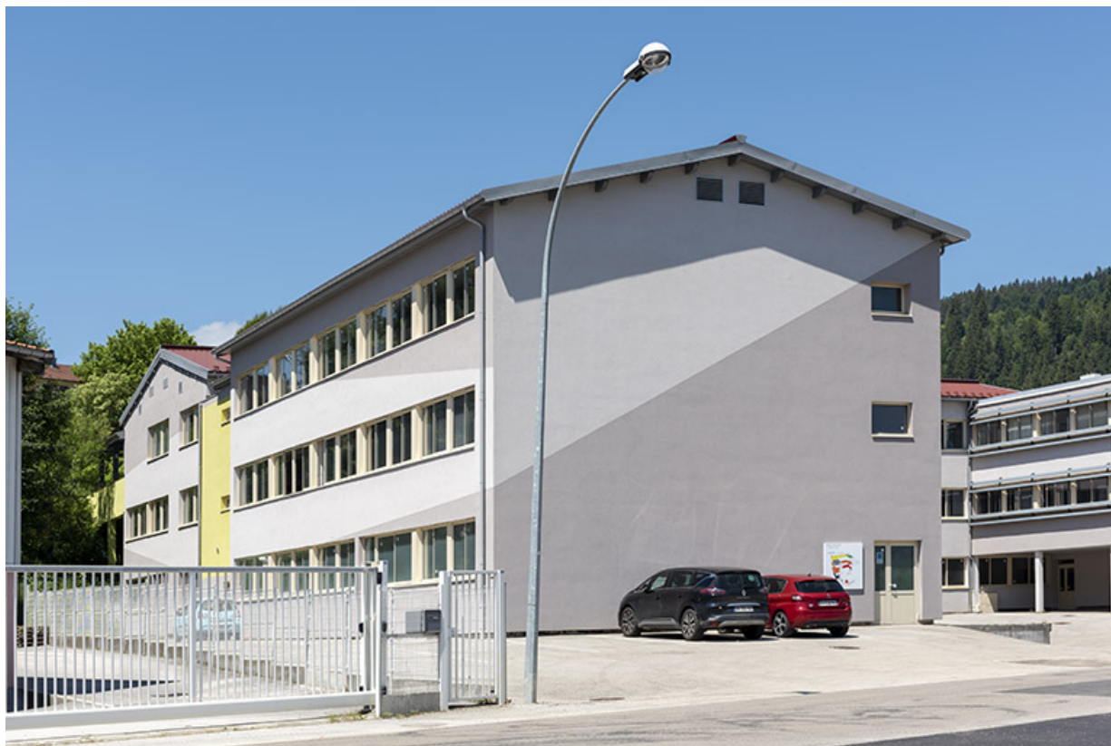
3e bâtiment, vu de l'est. 25, Morteau, 2 rue du Bief