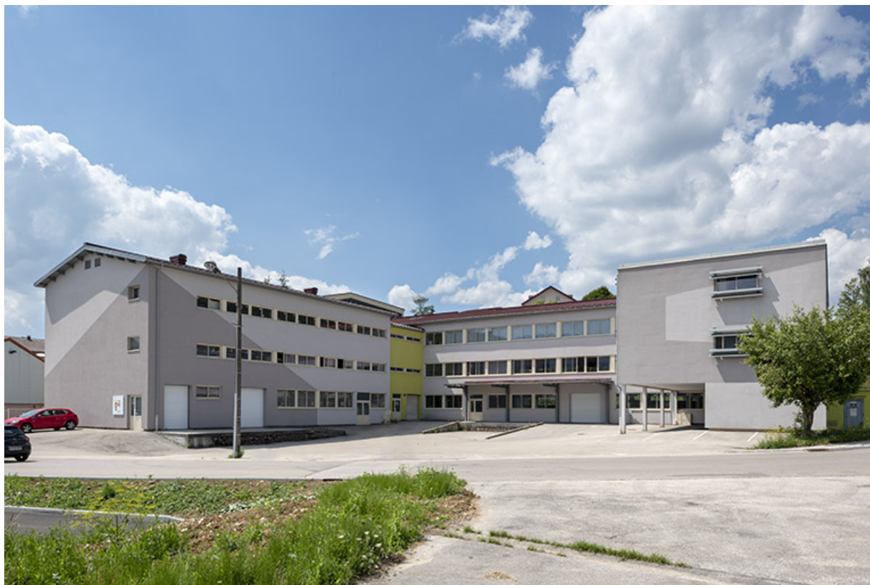
Vue d'ensemble, depuis l'est.