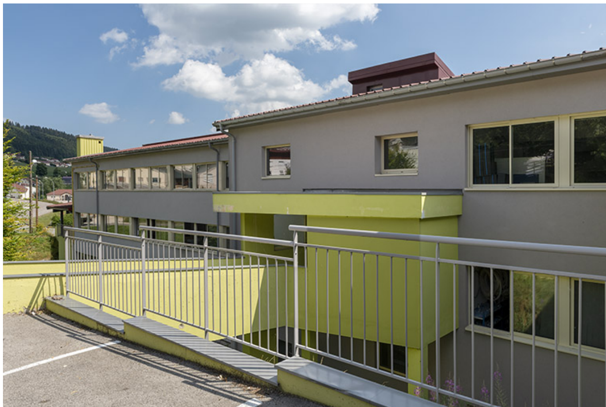
2e bâtiment (vue rapprochée depuis le sud-ouest).