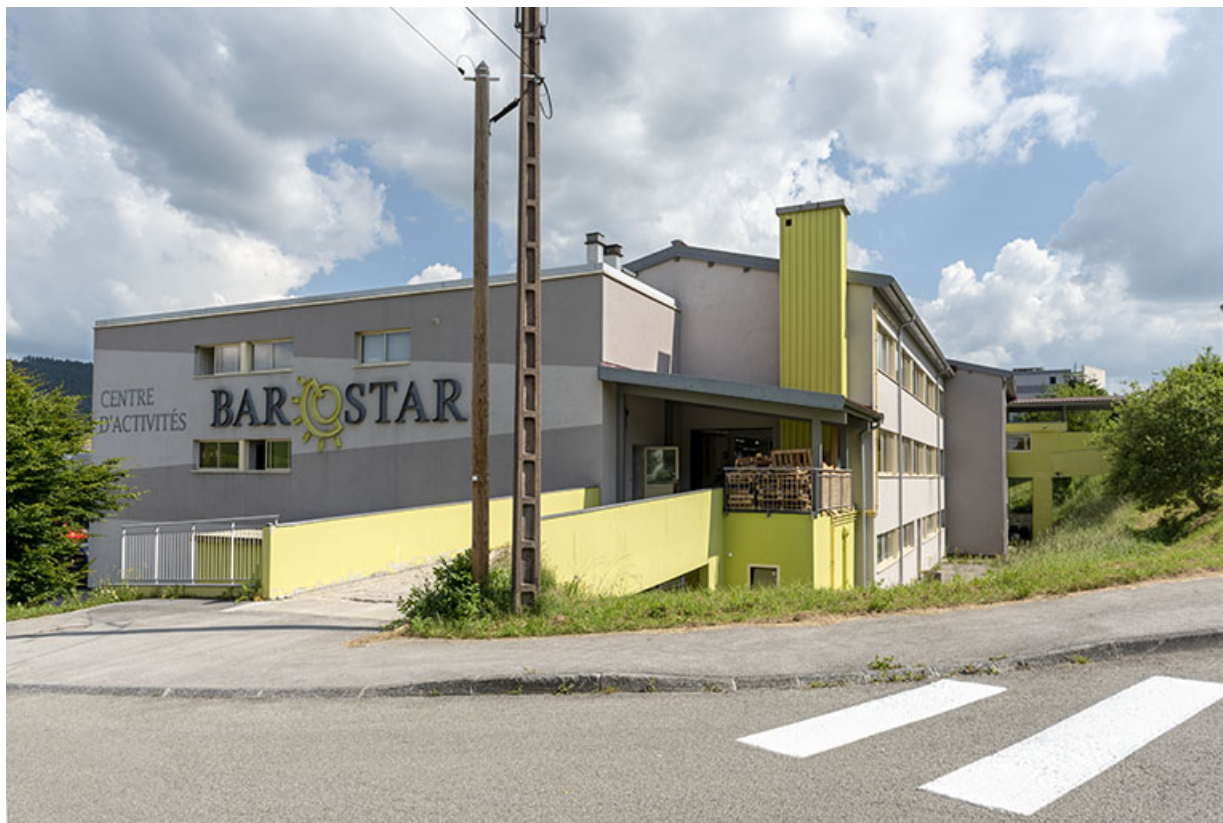
1er bâtiment (à gauche) et 2e (à droite), vus du nord. 25, Morteau, 2 rue du Bief