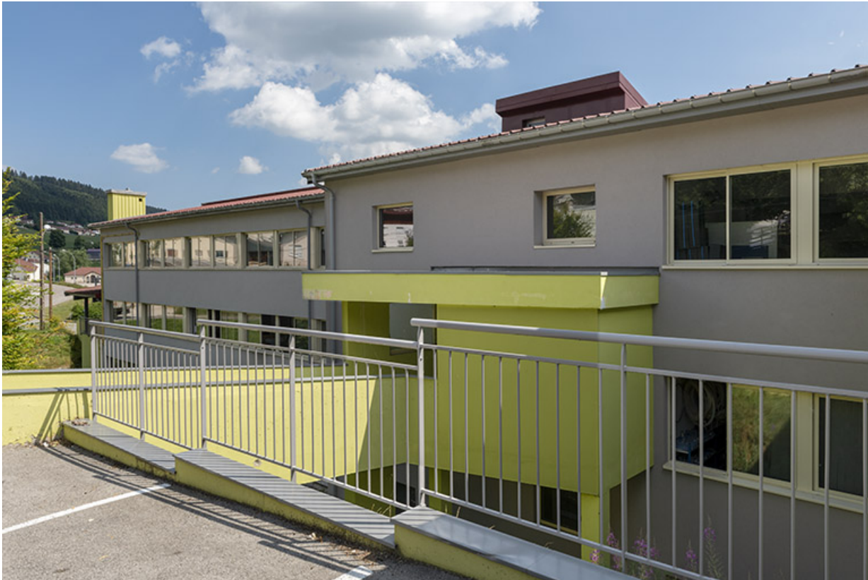
2e bâtiment (vue rapprochée depuis le sud-ouest).