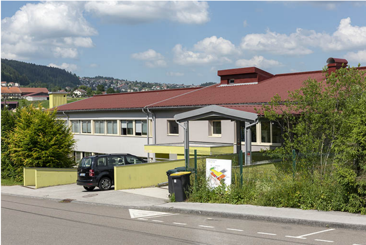
2e bâtiment, vu du sud-ouest.