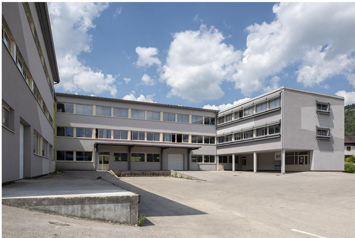
1er bâtiment (à droite) et 2e (à gauche), côté cour. 25, Morteau, 2 rue du Bief