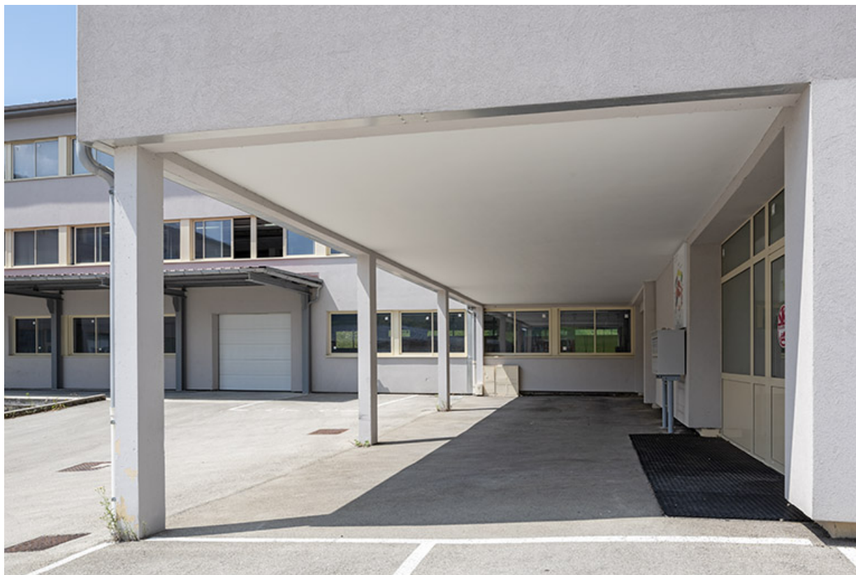
1er bâtiment : galerie ouverte sur la cour.