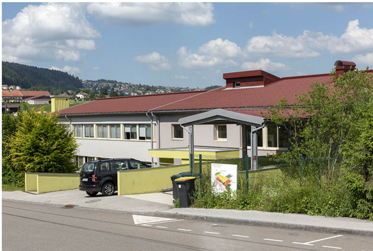
2e bâtiment, vu du sud-ouest.