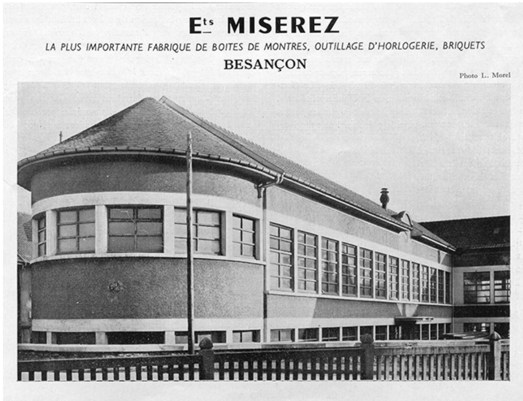
Ets Miserez, photographie, s.d. [1949]. 25, Besançon, 16 rue Suard