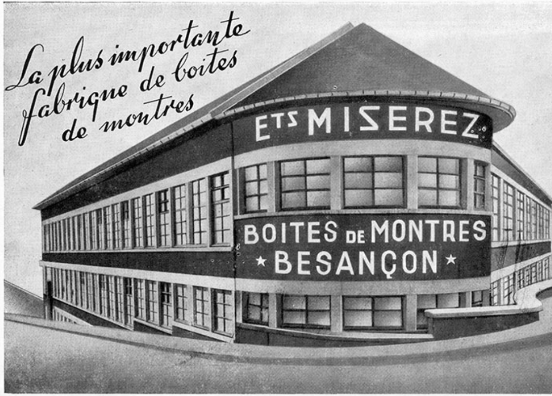
Usine de boîtes de montres Miserez, gravure, s.d. [1951]. 25, Besançon