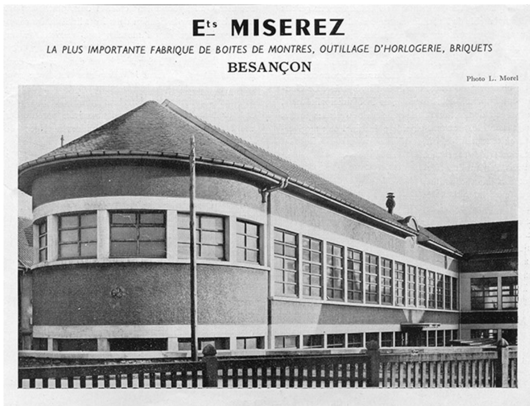
Ets Miserez, photographie, s.d. [1949]. 25, Besançon, 16 rue Suard