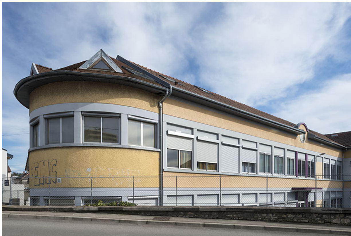
Extrémité nord de l'atelier est, depuis la rue de la Rotonde.