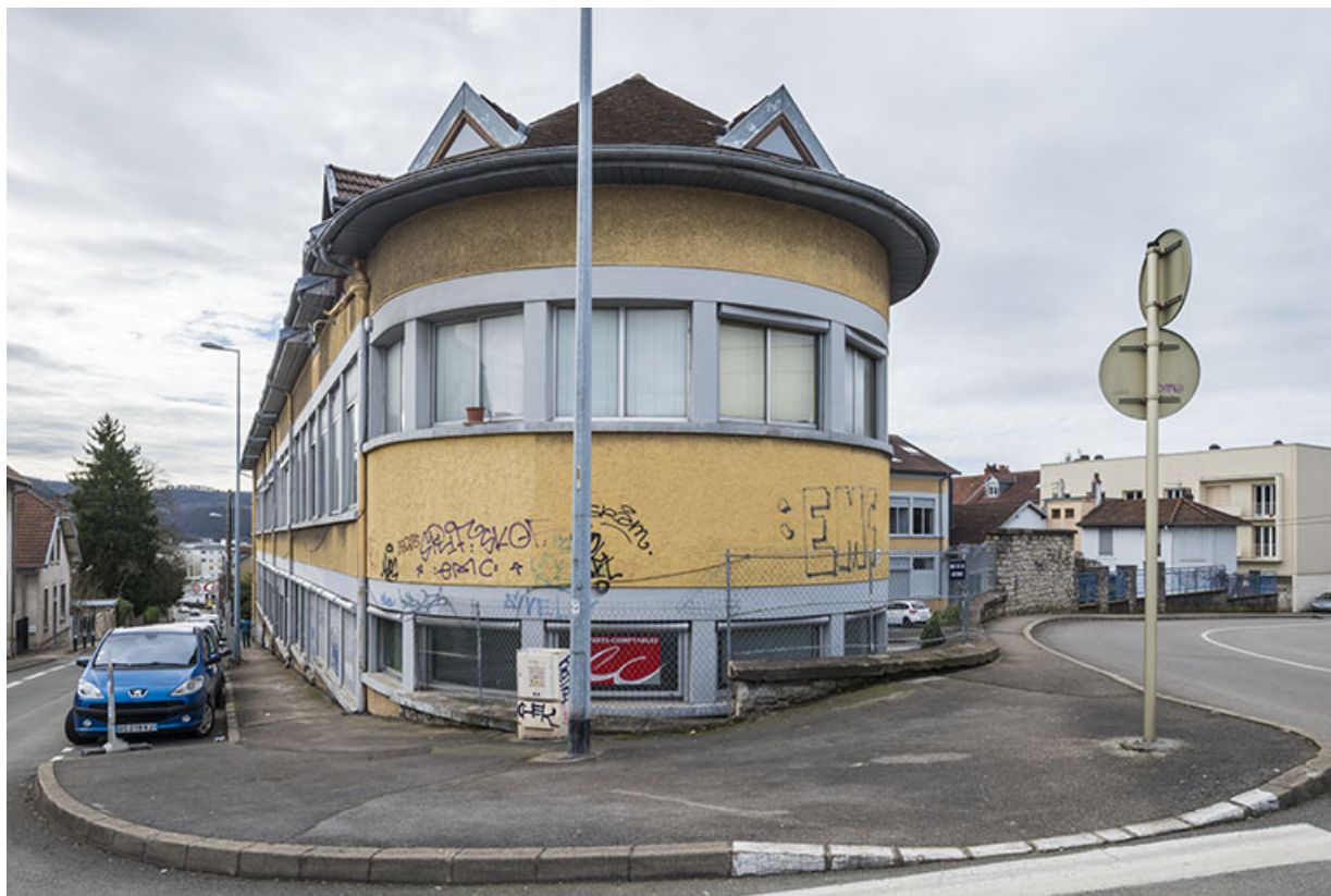
Vue depuis le nord.