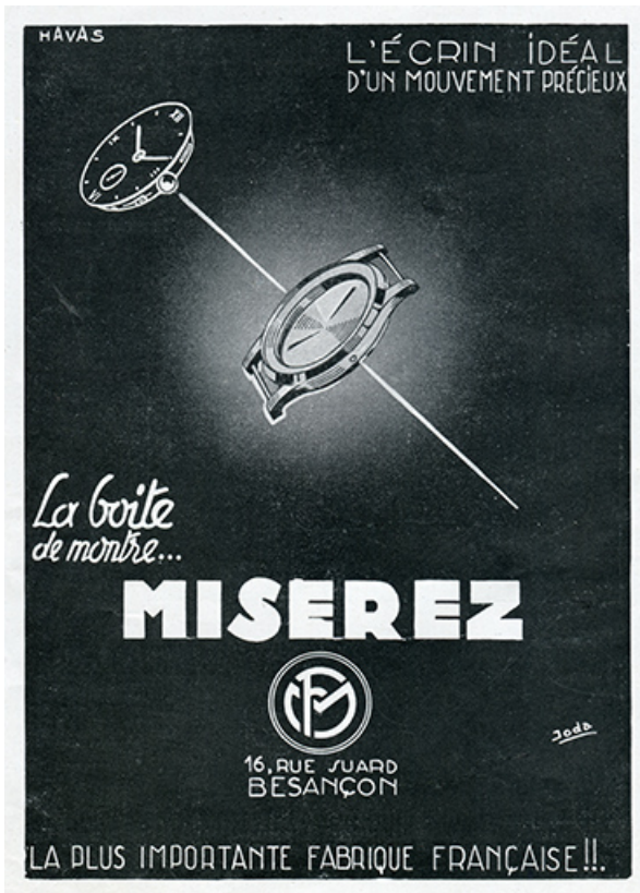
Boîte de montre Miserez, publicité, 1947.