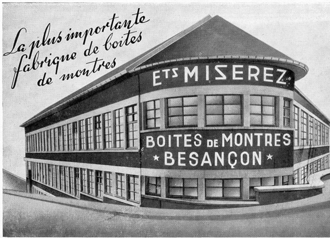
Usine de boîtes de montres Miserez, gravure, s.d. [1951]. 25, Besançon