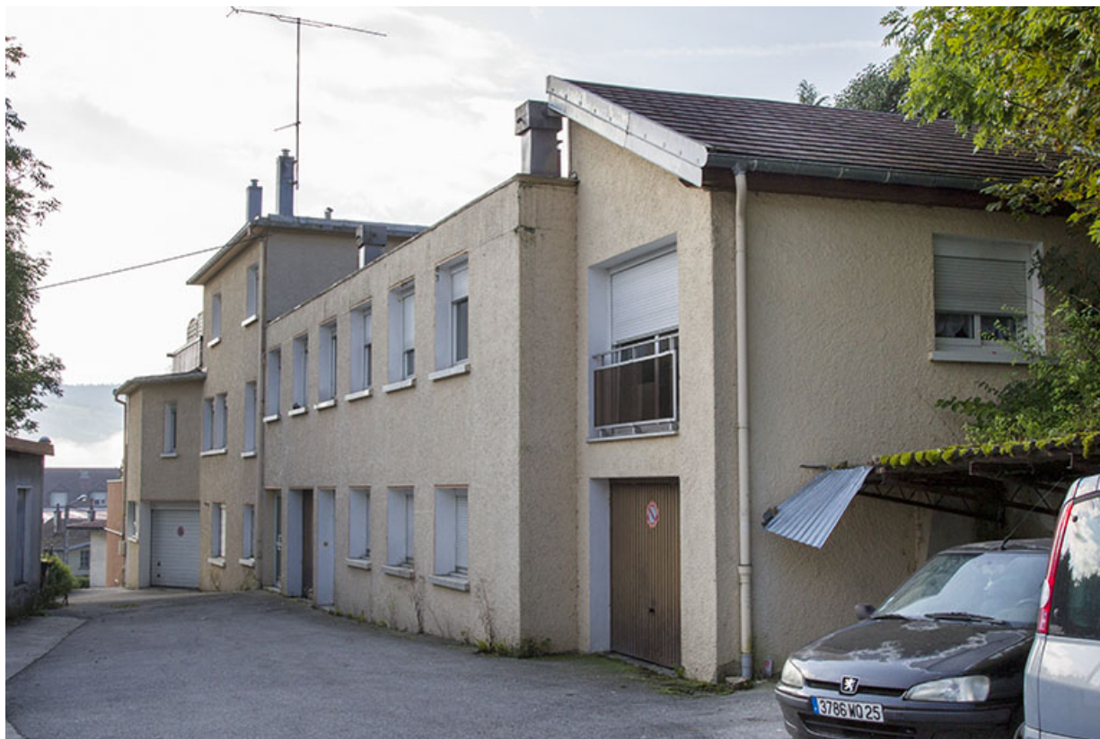
Façade latérale droite, depuis le nord.

25, Morteau, 19 et 19 bis rue Antoine de Roche