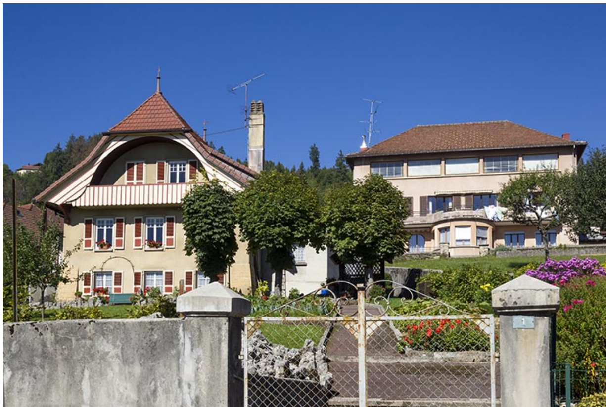
Vue d'ensemble, depuis le sud-est.