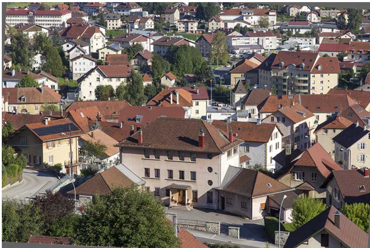
Vue d'ensemble plongeante, depuis le nord-ouest.