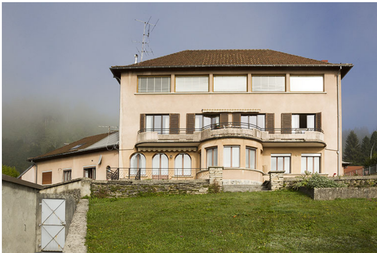
Façade postérieure. 25, Morteau