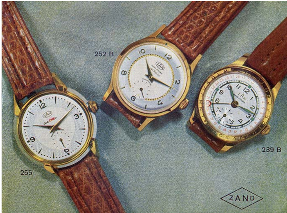
La fabrique de montres de qualité Fernand Zahnd [catalogue], 3e quart 20e siècle. 25, Morteau, 2 rue du Maréchal Leclerc