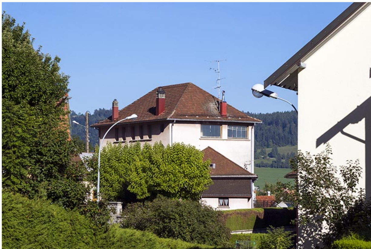
Vue d'ensemble éloignée, depuis l'ouest. Noter les baies d'atelier sous la toiture.