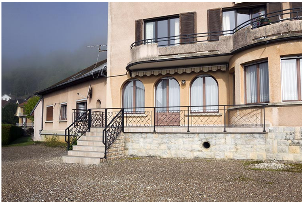
Baies du rez-de-chaussée de la façade postérieure et terrasse.