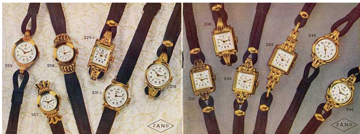
La fabrique de montres de qualité Fernand Zahnd [catalogue : double page centrale], 3e quart 20e siècle. 25, Morteau, 2 rue du Maréchal Leclerc