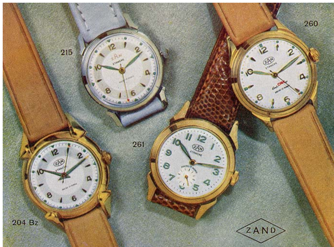
La fabrique de montres de qualité Fernand Zahnd [catalogue], 3e quart 20e siècle. 25, Morteau, 2 rue du Maréchal Leclerc