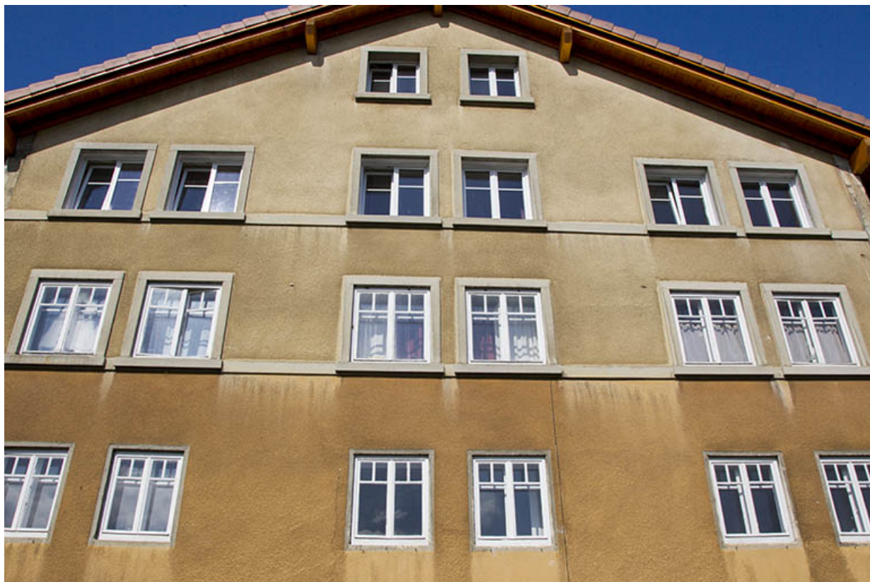
Façade postérieure, vue en contre-plongée.