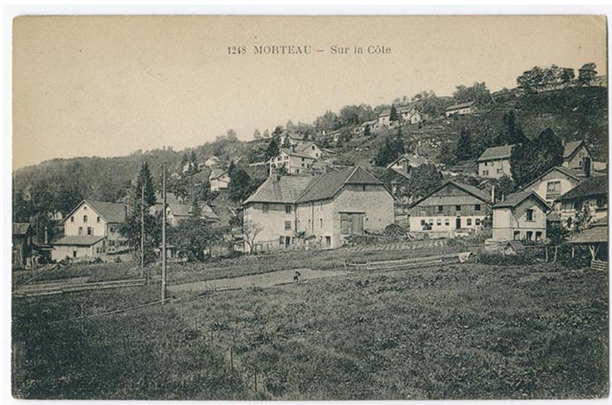
1248 Morteau - Sur la Côte, 1er quart 20e siècle.