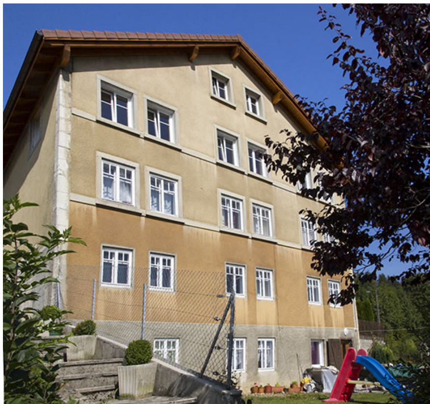
Façade postérieure, de trois quarts gauche. 25, Morteau, 9 rue des Frères Rognon