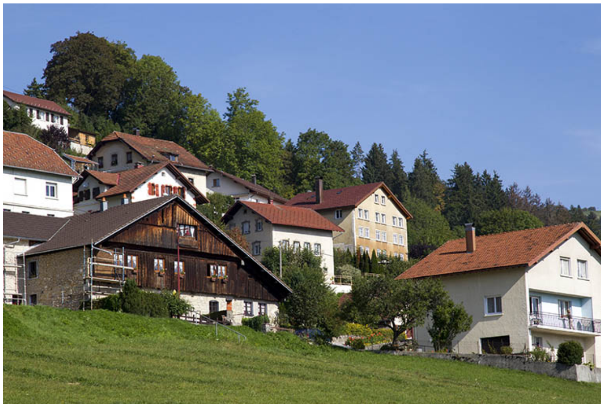
Vue d'ensemble, depuis le sud (dernier bâtiment à droite à l'arrière-plan). 25, Morteau