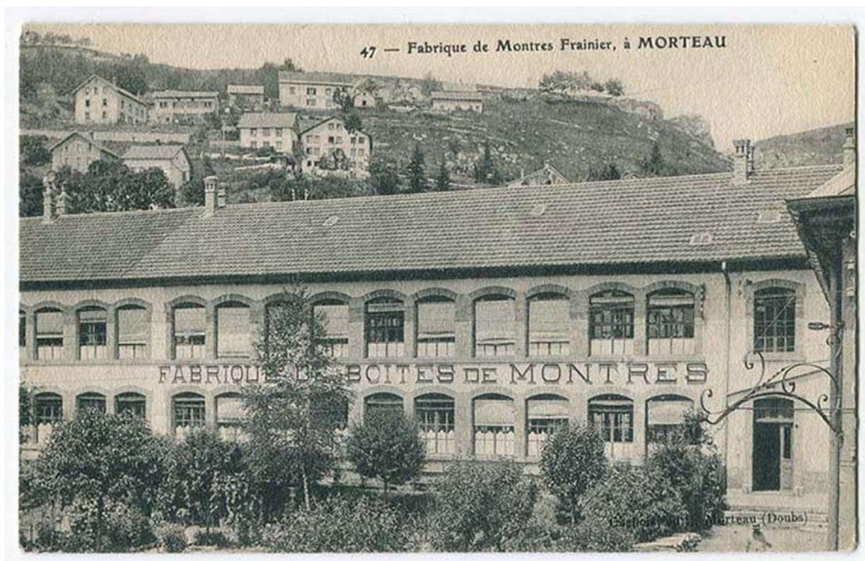
47 - Fabrique de Montres Frainier, à Morteau, limite 19e siècle 20e siècle. 25, Morteau, 30 rue de la Chaussée