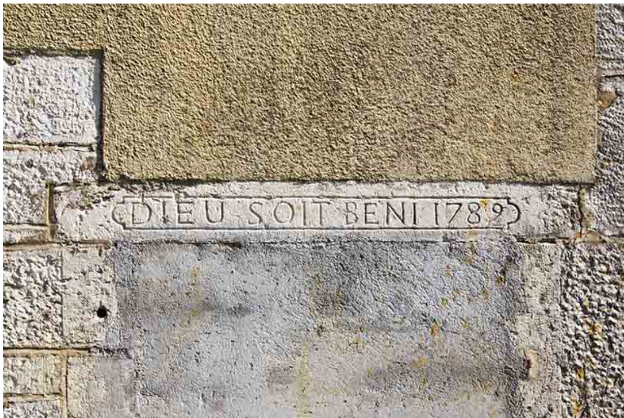
Façade latérale droite : linteau daté 1789.