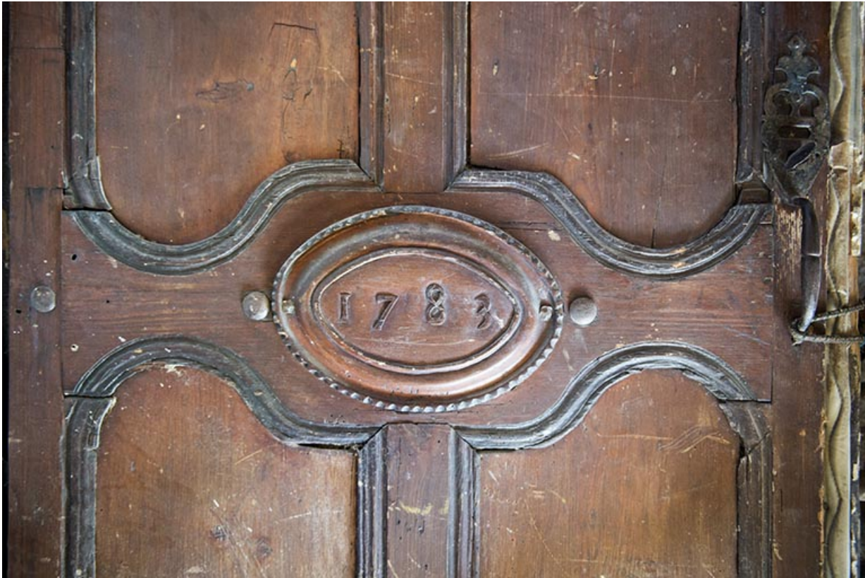
Date 1783 sculptée sur une porte.