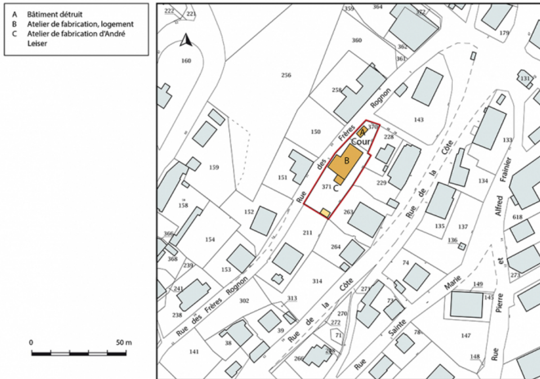
Plan-masse et de situation. Extrait du plan cadastral, 2018, section AC, 1/1 000. 25, Morteau, 3 rue des Frères Rognon