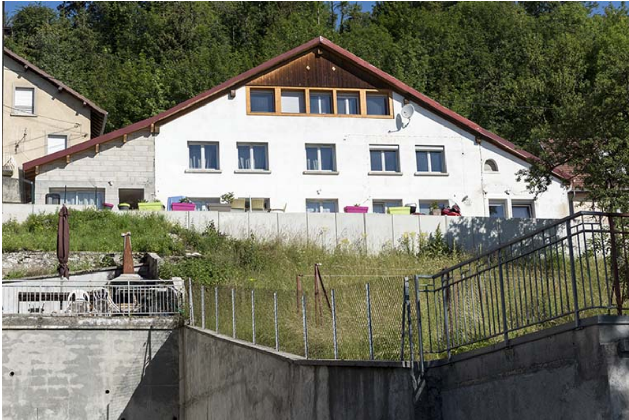
Façade est, vue en contre-plongée.