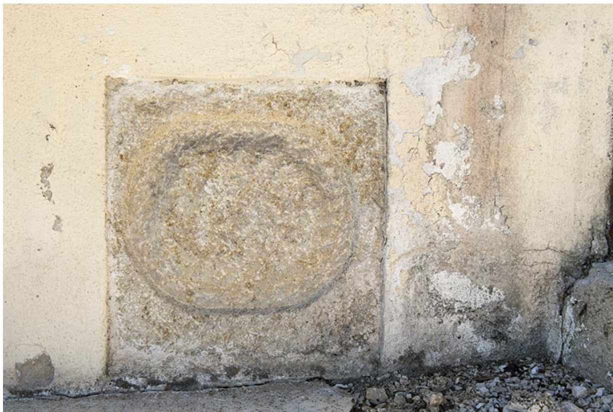
Pierre encastrée dans un angle de la façade nord.