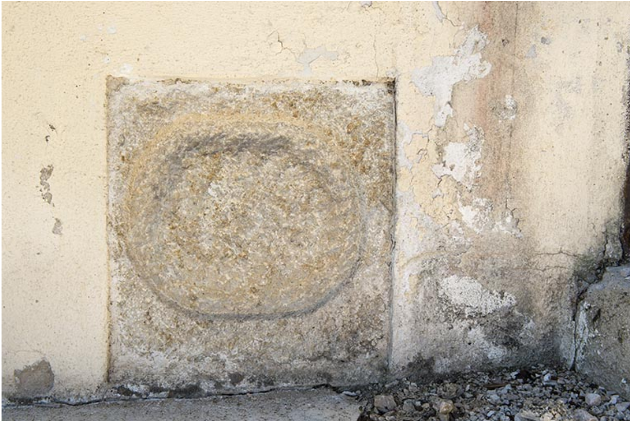
Pierre encastrée dans un angle de la façade nord.