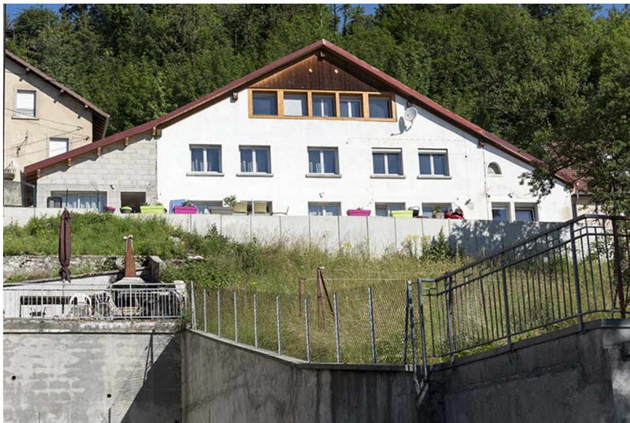
Façade est, vue en contre-plongée.