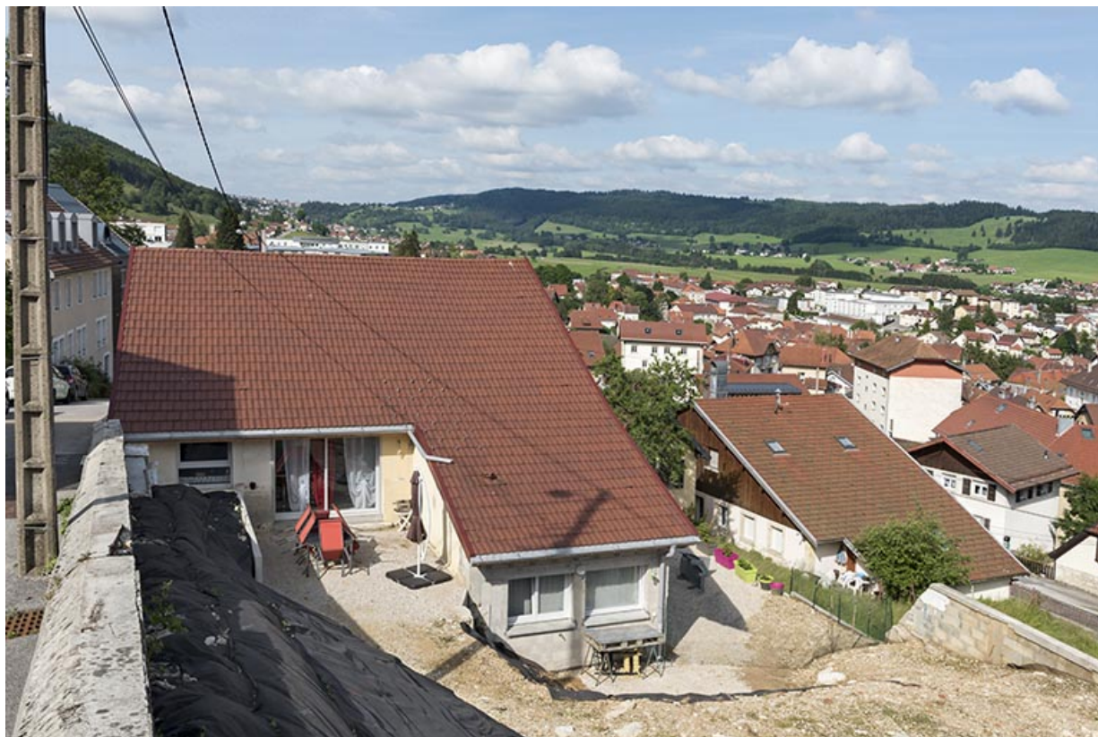
Vue d'ensemble, depuis le sud.