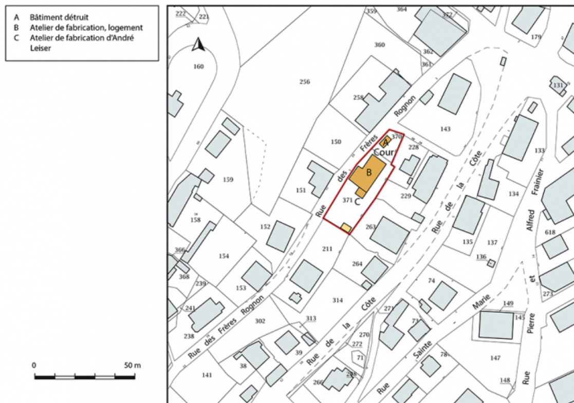
Plan-masse et de situation. Extrait du plan cadastral, 2018, section AC, 1/1 000.