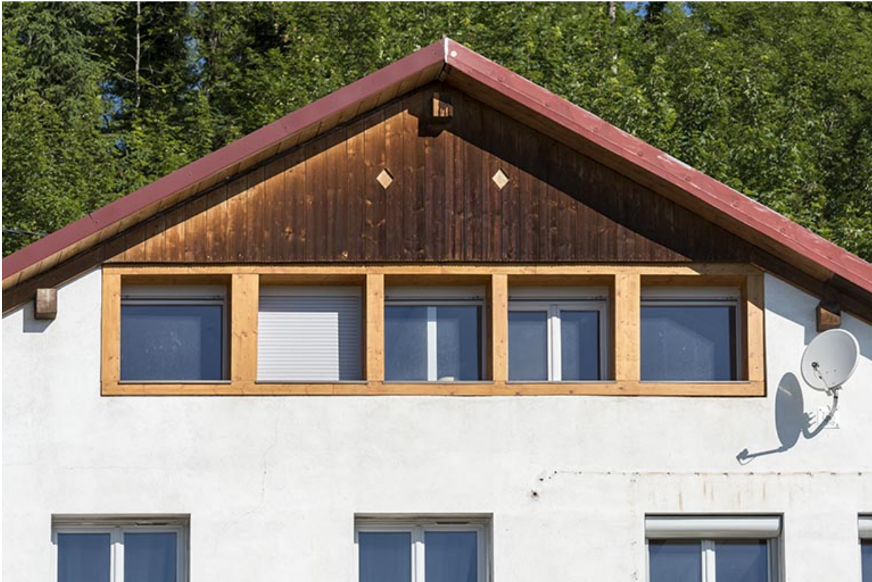
Fenêtres multiples dans le pignon de la façade est.