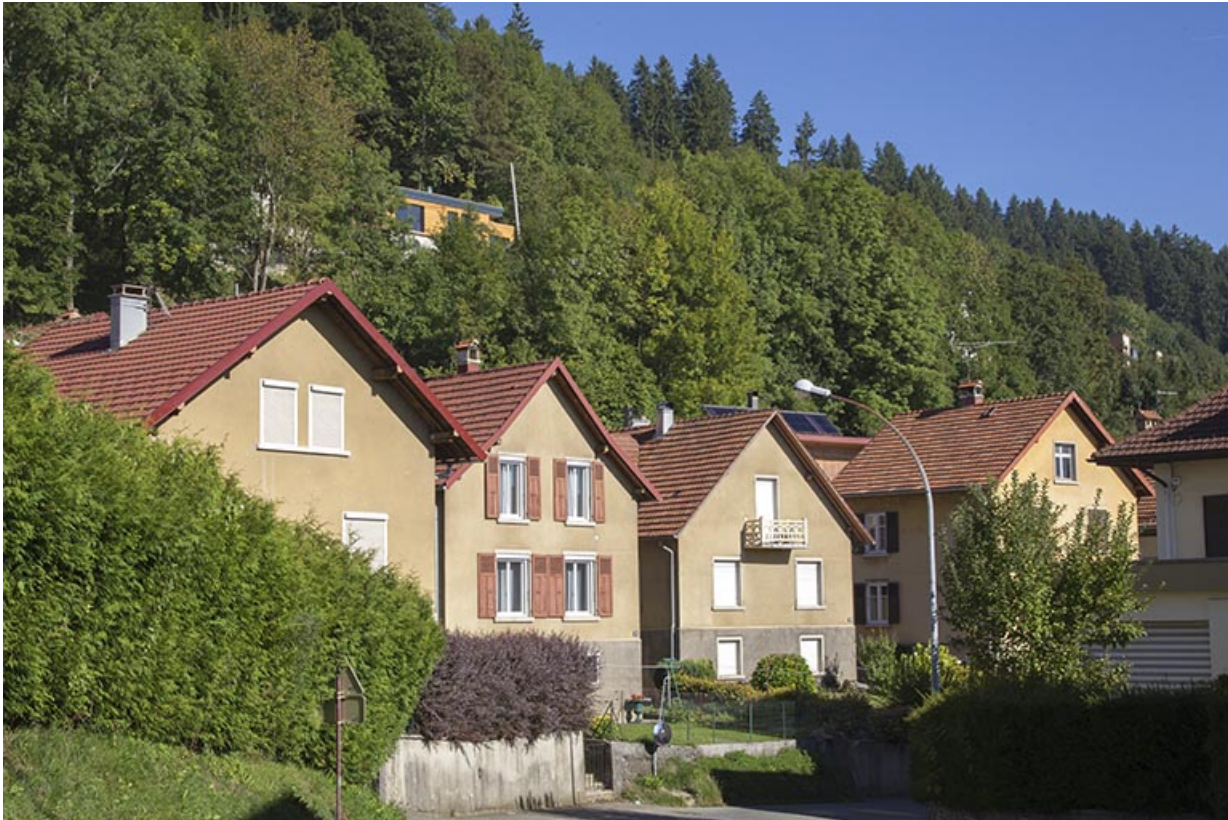
Vue d'ensemble, depuis le sud. La maison, dont on voit la façade postérieure, a des volets en bois. 25, Morteau