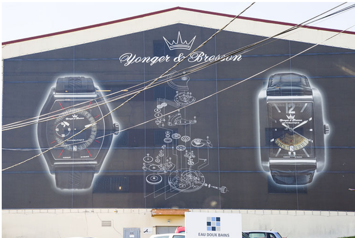
Corps nord : façade latérale droite (masquée par un voile publicitaire). 25, Morteau, 1 et 1A rue Fontaine-l'Epine