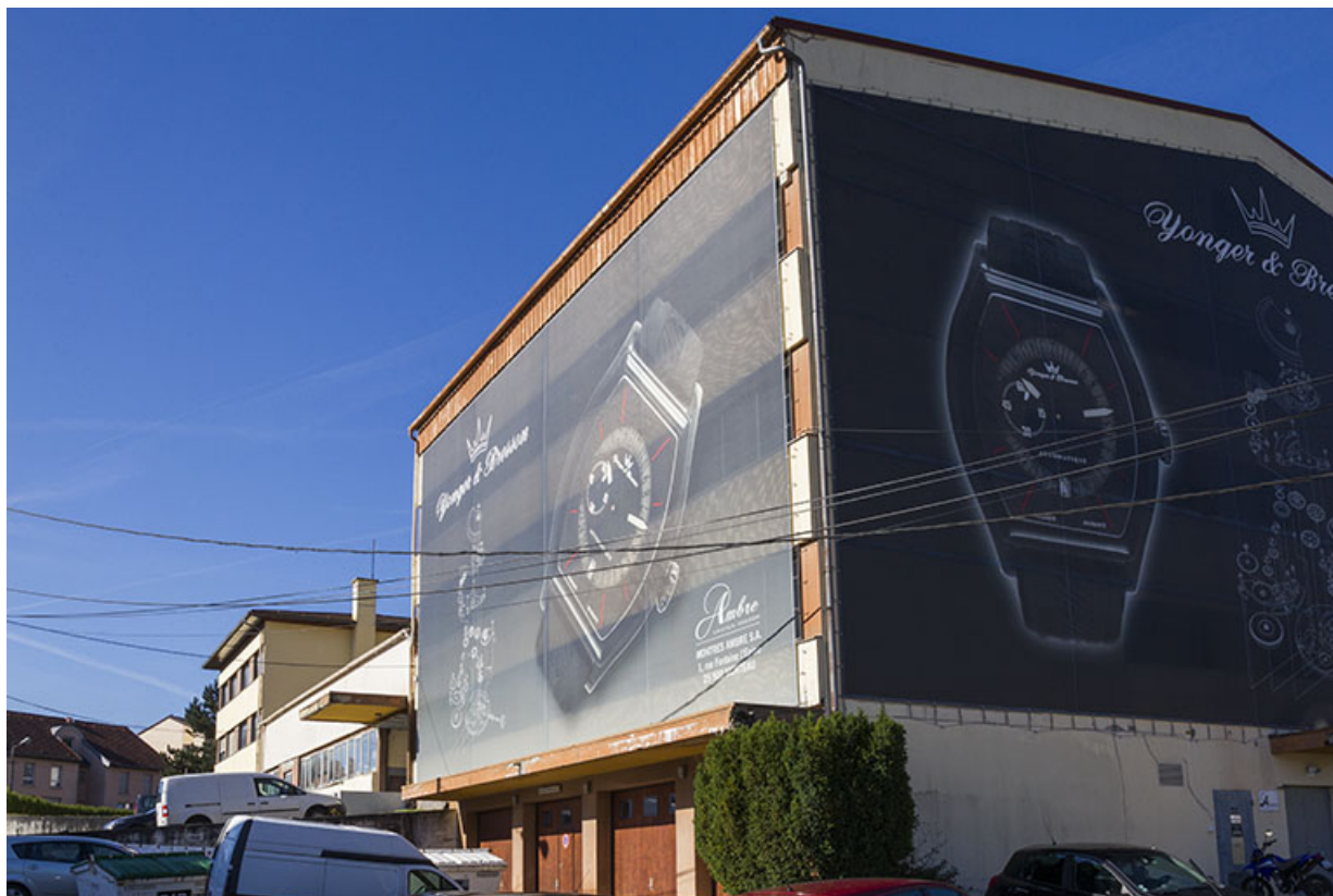
Corps nord : façades antérieure et latérale droite.

25, Morteau, 1 et 1A rue Fontaine-l'Epine