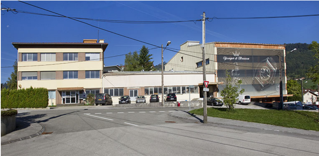
Usine d'horlogerie de la Société mortuacienne d'Horlogerie (Kiplé) puis de la SA Montres Ambre, 1 et 1A rue Fontaine-l'Epine. 25, Morteau