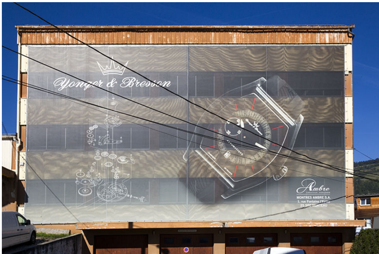
Corps nord : façade antérieure (masquée par un voile publicitaire). 25, Morteau, 1 et 1A rue Fontaine-l'Épine