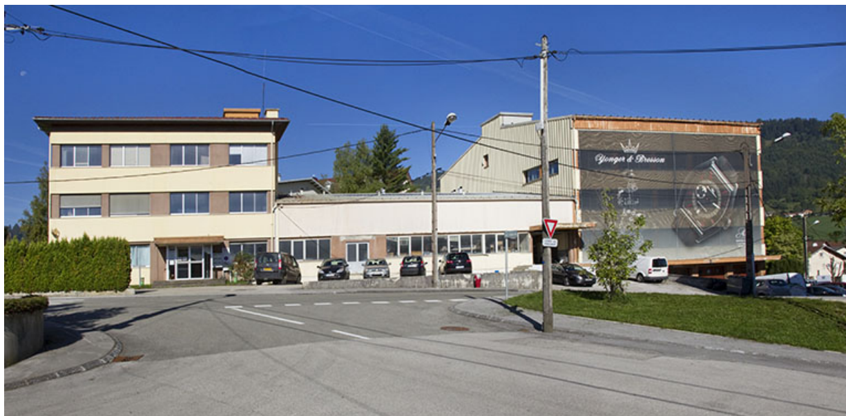
Usine d'horlogerie de la Société mortuacienne d'Horlogerie (Kiplé) puis de la SA Montres Ambre, 1 et 1A rue Fontaine-l'Epine. 25, Morteau