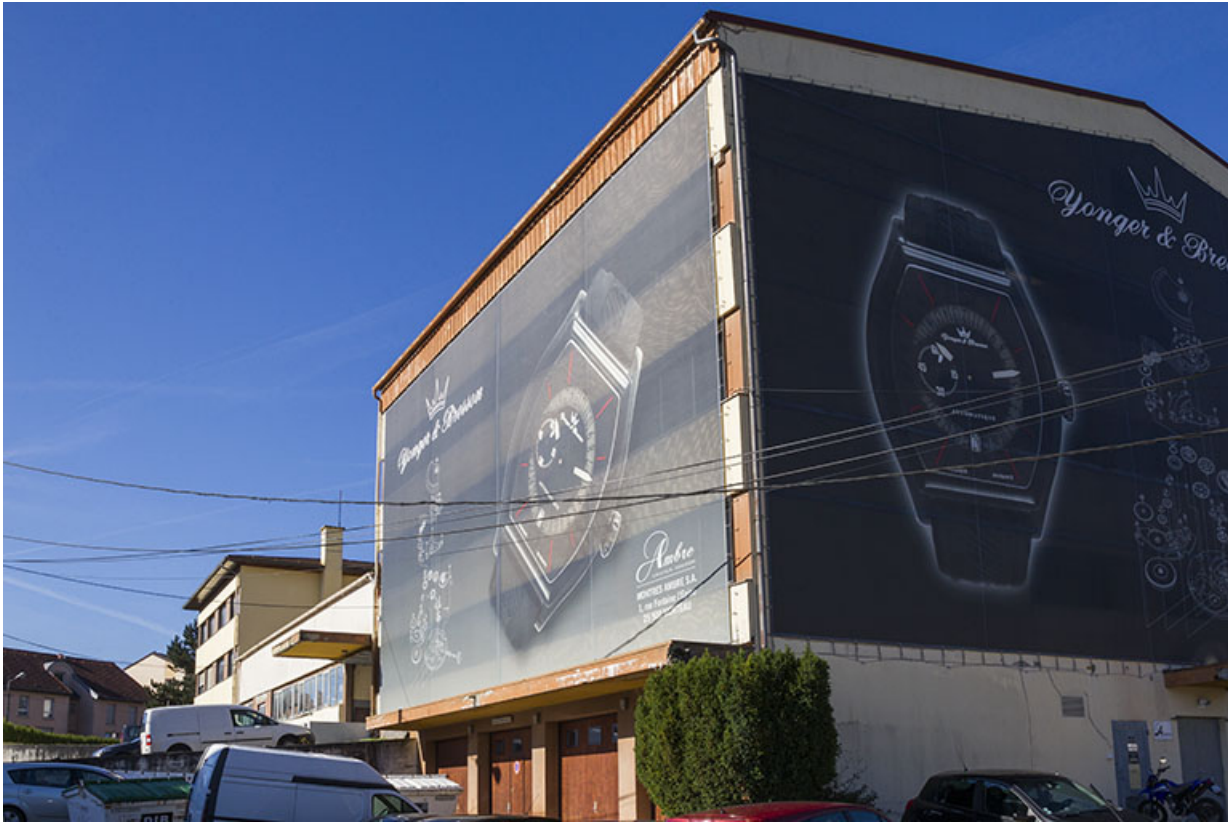
Corps nord : façades antérieure et latérale droite.

25, Morteau, 1 et 1A rue Fontaine-l'Epine