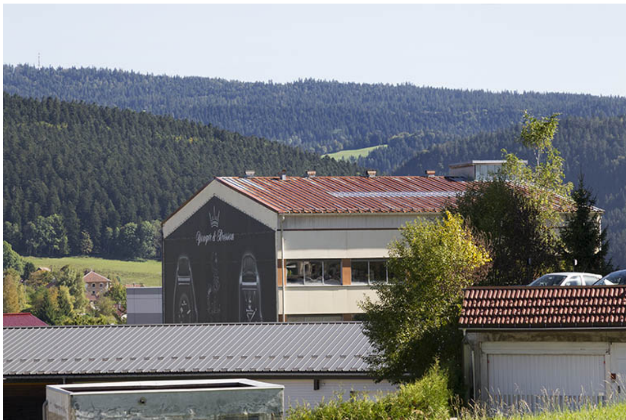
Corps nord : façades postérieure et latérale droite.

25, Morteau, 1 et 1A rue Fontaine-l'Epine