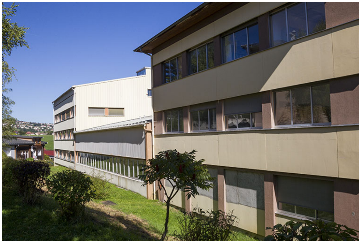
Corps sud et corps central : façade postérieure vue en enfilade.

25, Morteau, 1 et 1A rue Fontaine-l'Epine