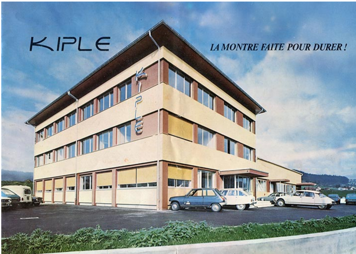
[L'usine vue de trois quarts gauche : 1ère de couverture d'un catalogue], vers 1980. 25, Morteau, 1 et 1A rue Fontaine-l'Epine