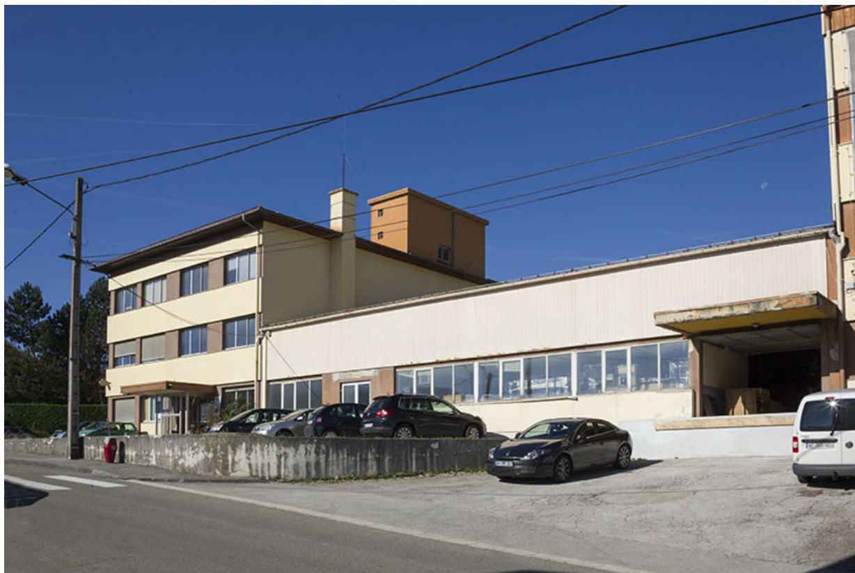
Corps sud et corps central : façade antérieure, de trois quarts droite.

25, Morteau, 1 et 1A rue Fontaine-l'Epine