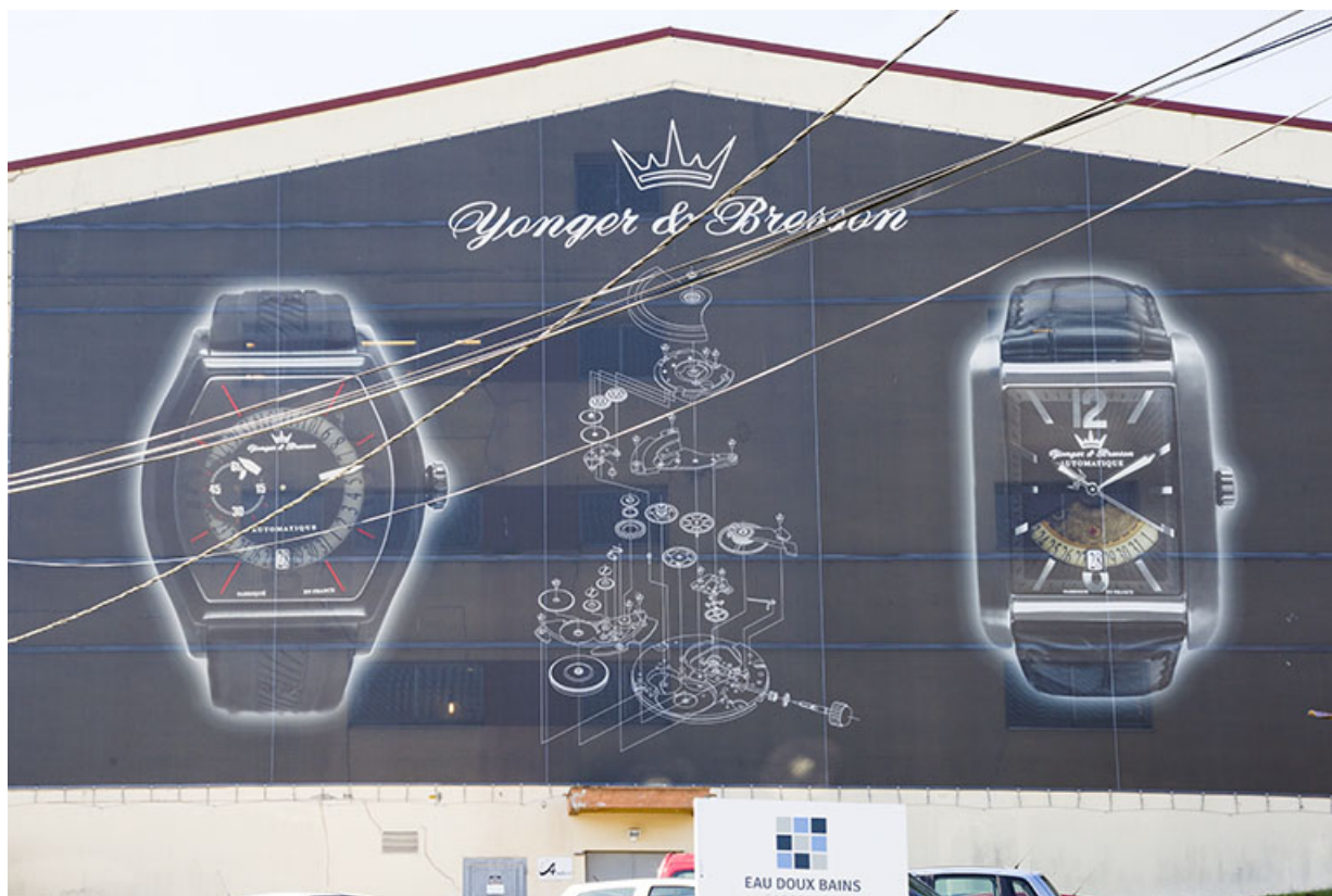
Corps nord : façade latérale droite (masquée par un voile publicitaire). 25, Morteau, 1 et 1A rue Fontaine-l'Epine