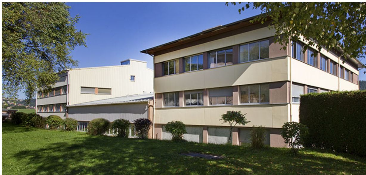
Vue d'ensemble, depuis le sud-ouest (façade postérieure).

25, Morteau, 1 et 1A rue Fontaine-l'Epine