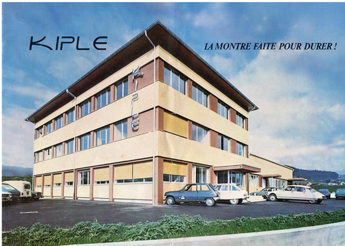
[L'usine vue de trois quarts gauche : 1ère de couverture d'un catalogue], vers 1980. 25, Morteau, 1 et 1A rue Fontaine-l'Epine