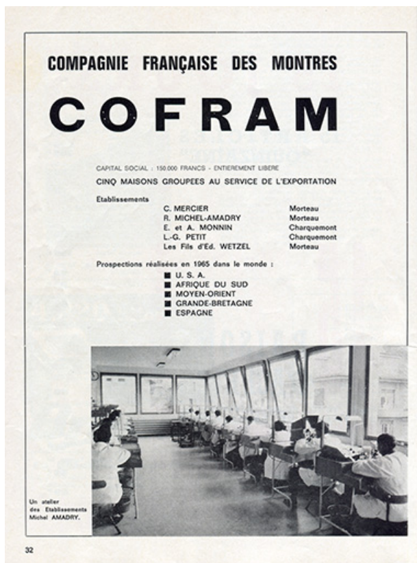
Compagnie française des Montres Cofram, 1966. 25, Morteau, 43-45 rue Neuve