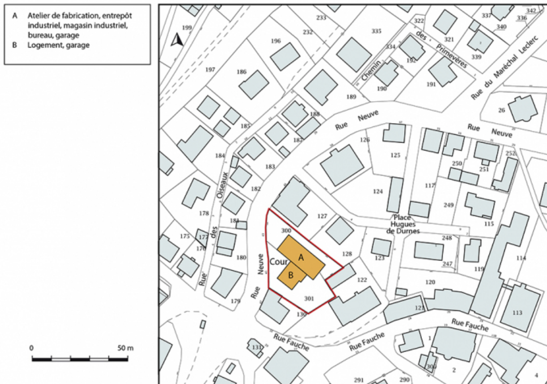
Plan-masse et de situation. Extrait du plan cadastral, 2018, section AC, 1/1 000. 25, Morteau, 43-45 rue Neuve