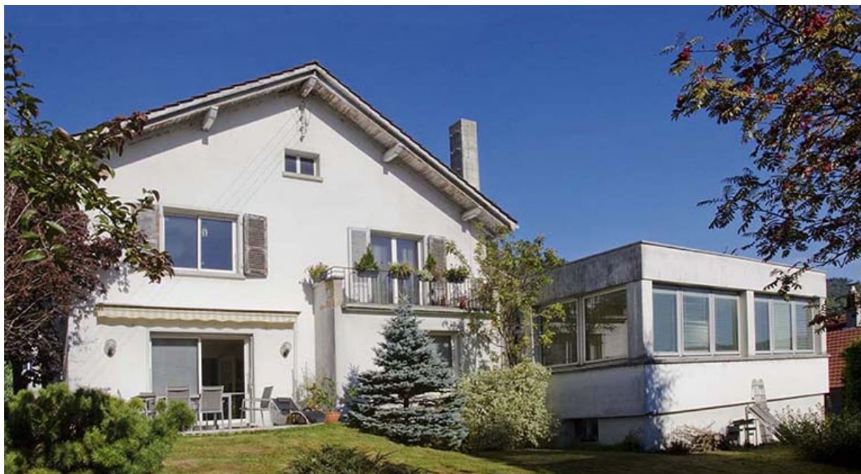
Façade postérieure, de trois quarts gauche.