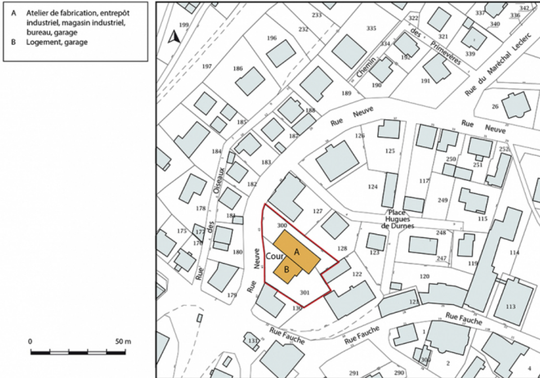
Plan-masse et de situation. Extrait du plan cadastral, 2018, section AC, 1/1 000. 25, Morteau, 43-45 rue Neuve