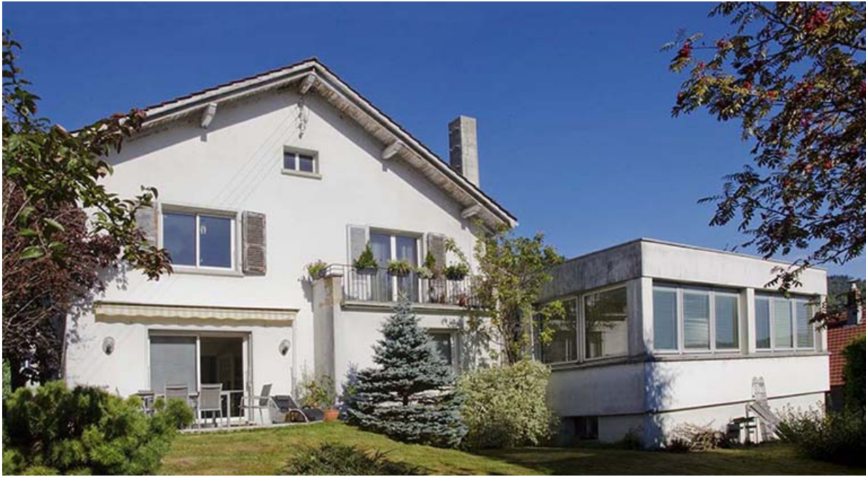
Façade postérieure, de trois quarts gauche.