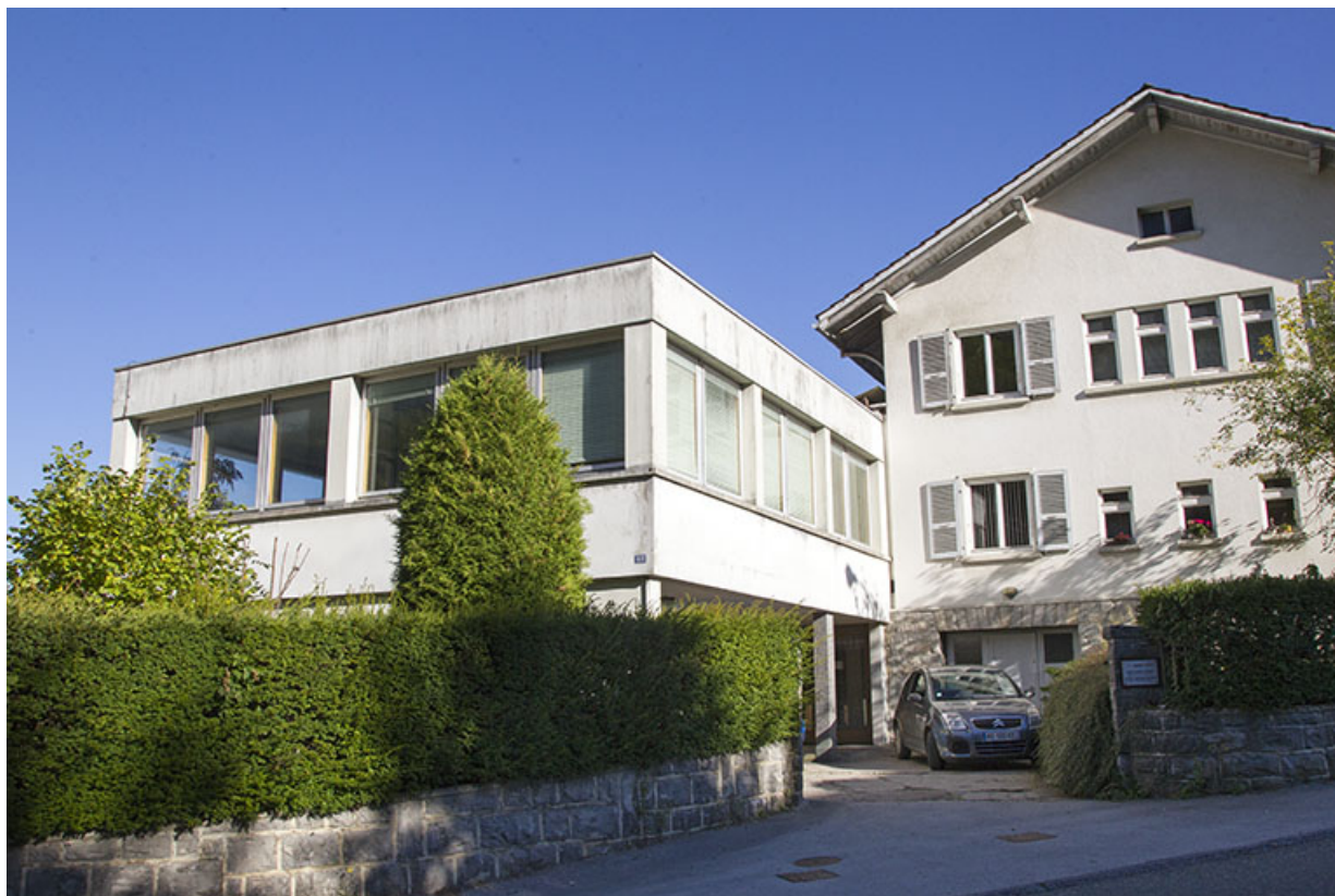
Façade antérieure, de trois quarts droite.