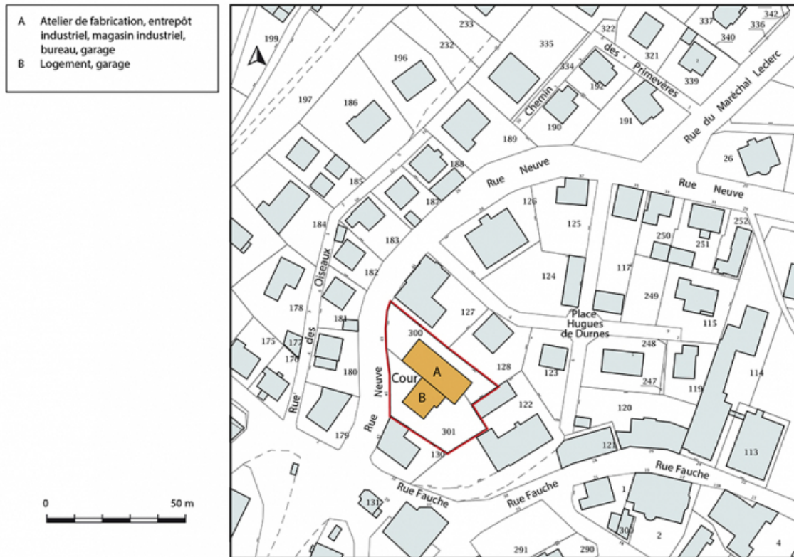
Plan-masse et de situation. Extrait du plan cadastral, 2018, section AC, 1/1 000. 25, Morteau, 43-45 rue Neuve