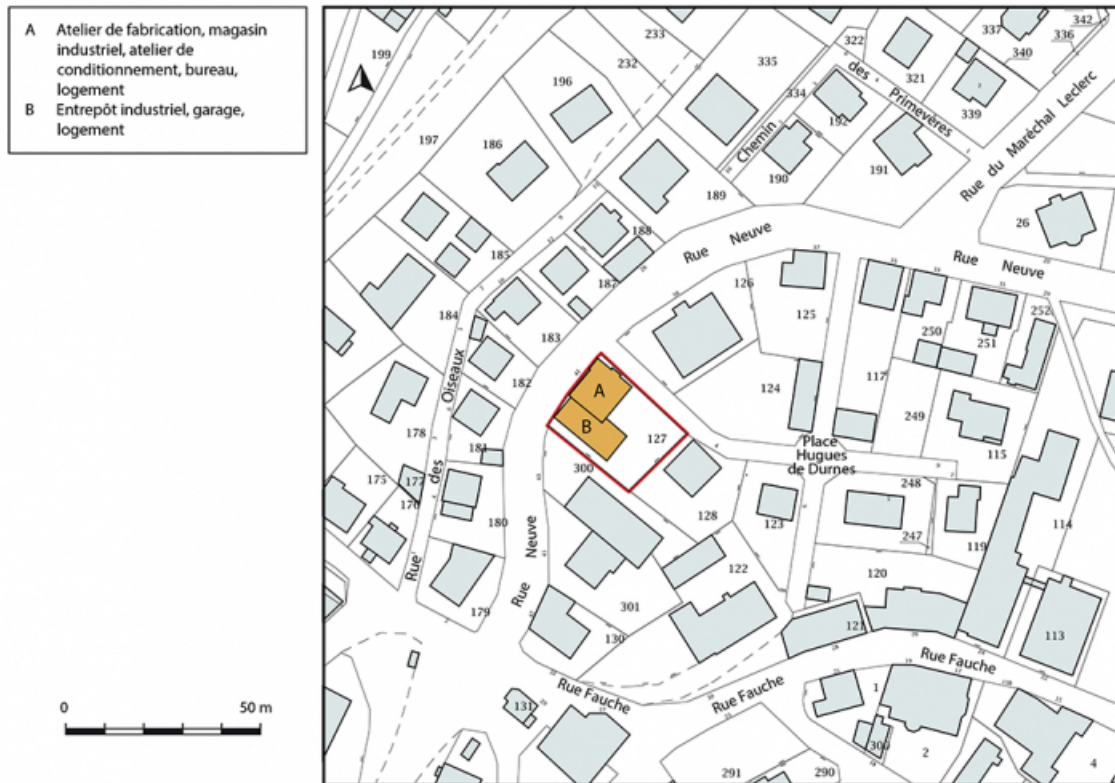
Plan-masse et de situation. Extrait du plan cadastral, 2018, section AC, 1/1 000. 25, Morteau, 41 rue Neuve