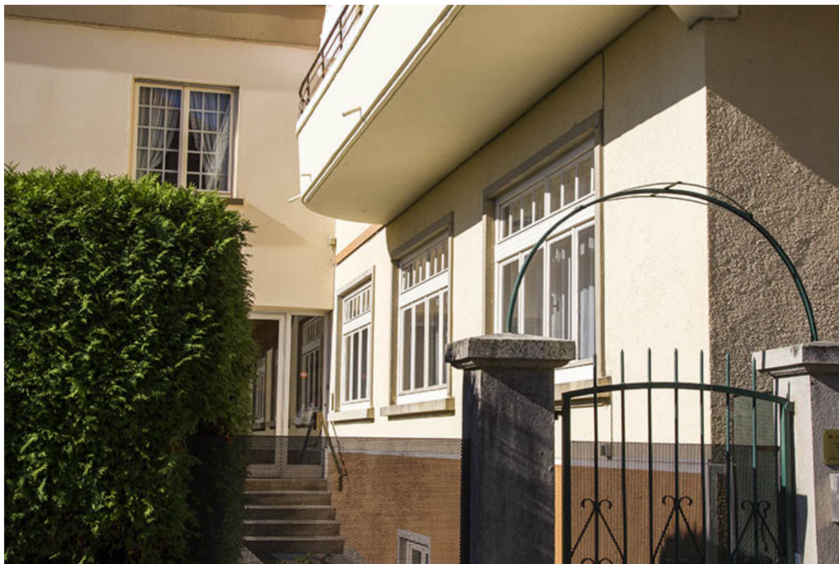
Façade postérieure : baies d'atelier.