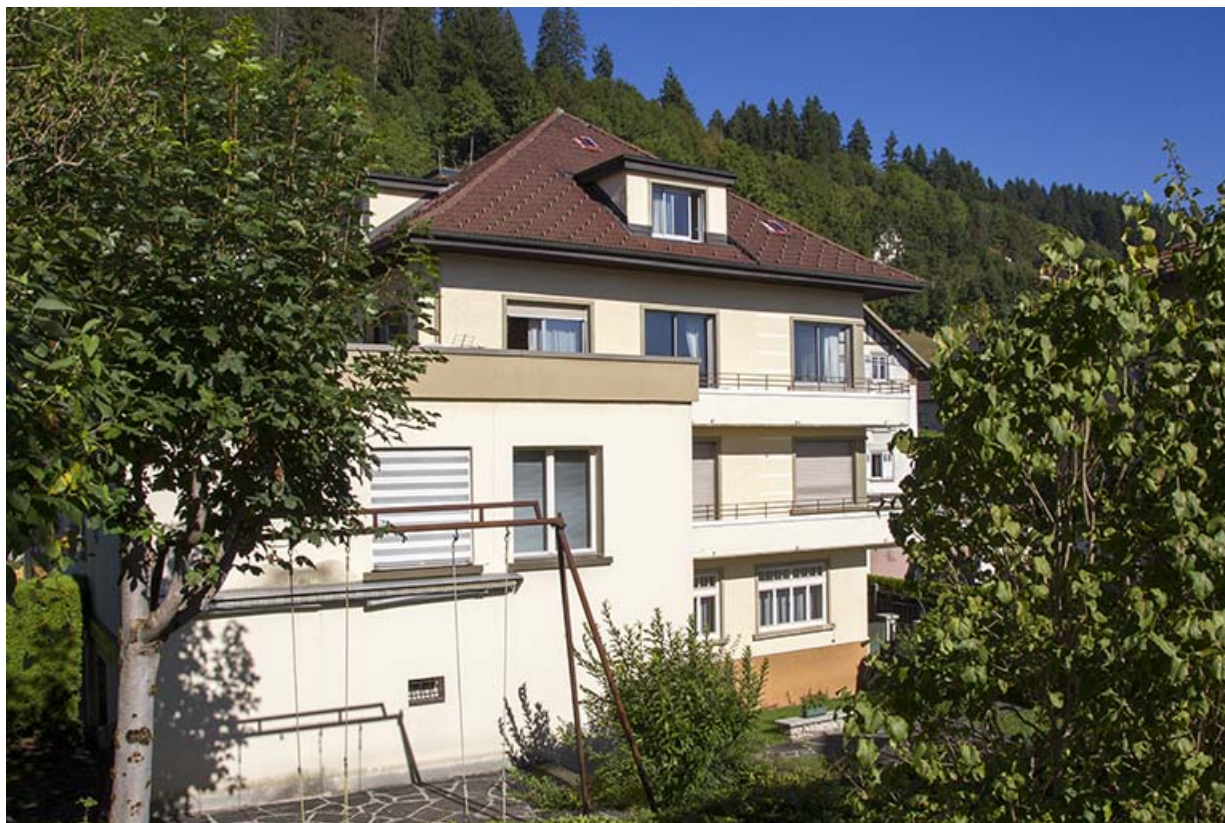
Façade postérieure de l'extension et de la maison, de trois quarts gauche. 25, Morteau, 41 rue Neuve