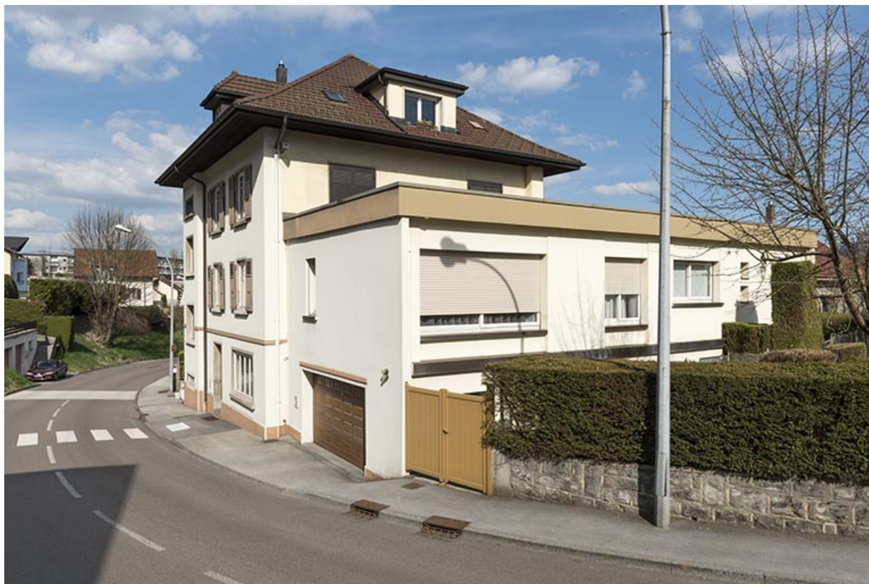
Vue d'ensemble, depuis le sud-ouest (façades antérieure et latérale droite). 25, Morteau, 41 rue Neuve