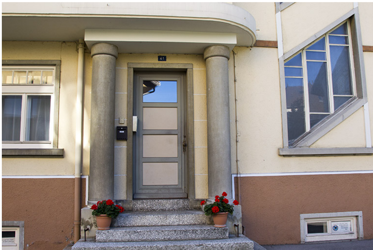
Façade latérale gauche : entrée.