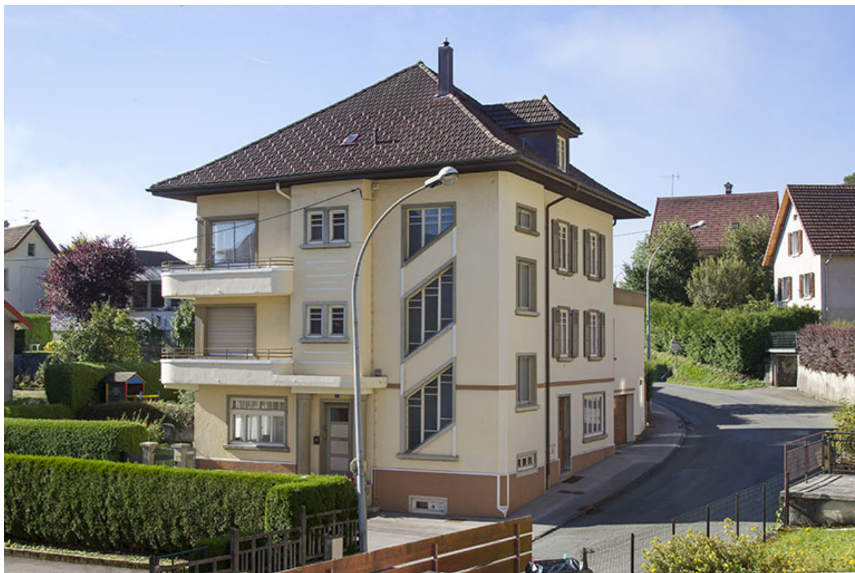
Vue d'ensemble, depuis le nord (façades antérieure et latérale gauche). 25, Morteau, 41 rue Neuve