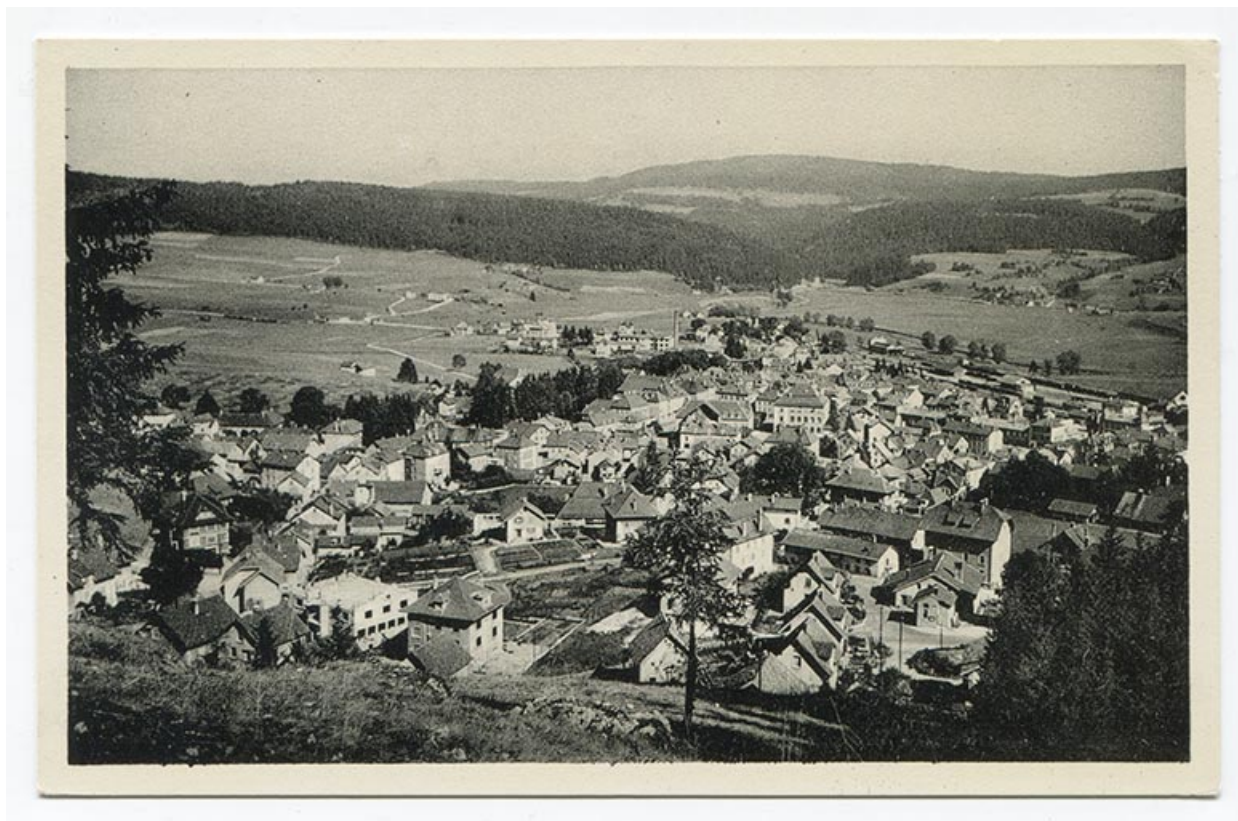
58 Morteau - Vue générale [sur le quartier de la rue Neuve], 1950-1951. La maison est en construction. 25, Morteau, 39 rue Neuve