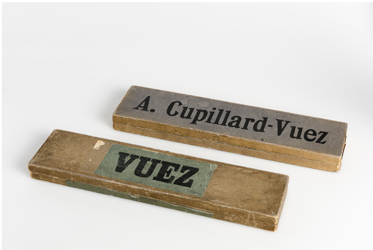
Cartons de montres Vuez et Cupillard-Vuez, fermés (collection particulière : Jean-Claude Vuez, Villers-le-Lac). 25, Morteau, 39 rue Neuve