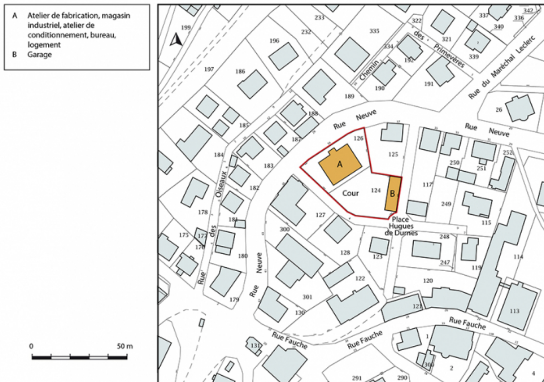
Plan-masse et de situation. Extrait du plan cadastral, 2018, section AC, 1/1 000. 25, Morteau, 39 rue Neuve