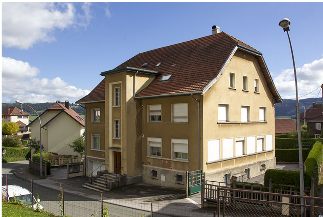
Vue d'ensemble, depuis l'ouest (façades antérieure et latérale droite). 25, Morteau