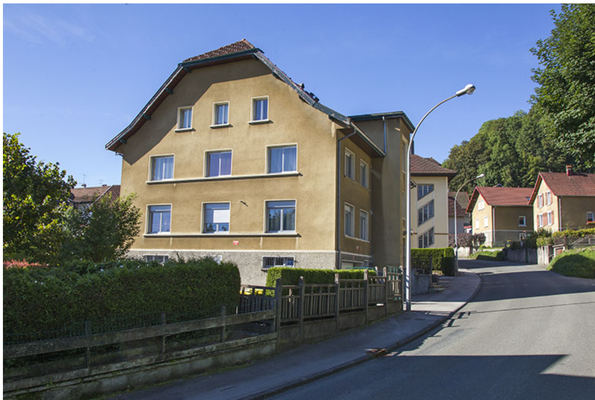
Façade latérale gauche, de trois quarts droite. 25, Morteau, 39 rue Neuve