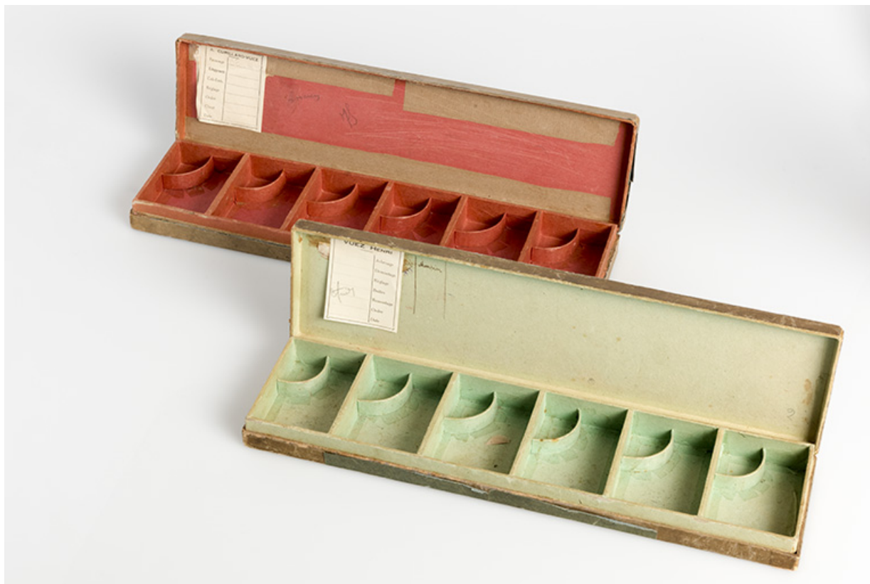
Cartons de montres Vuez et Cupillard-Vuez, ouverts (collection particulière : Jean-Claude Vuez, Villers-le-Lac). 25, Morteau, 39 rue Neuve