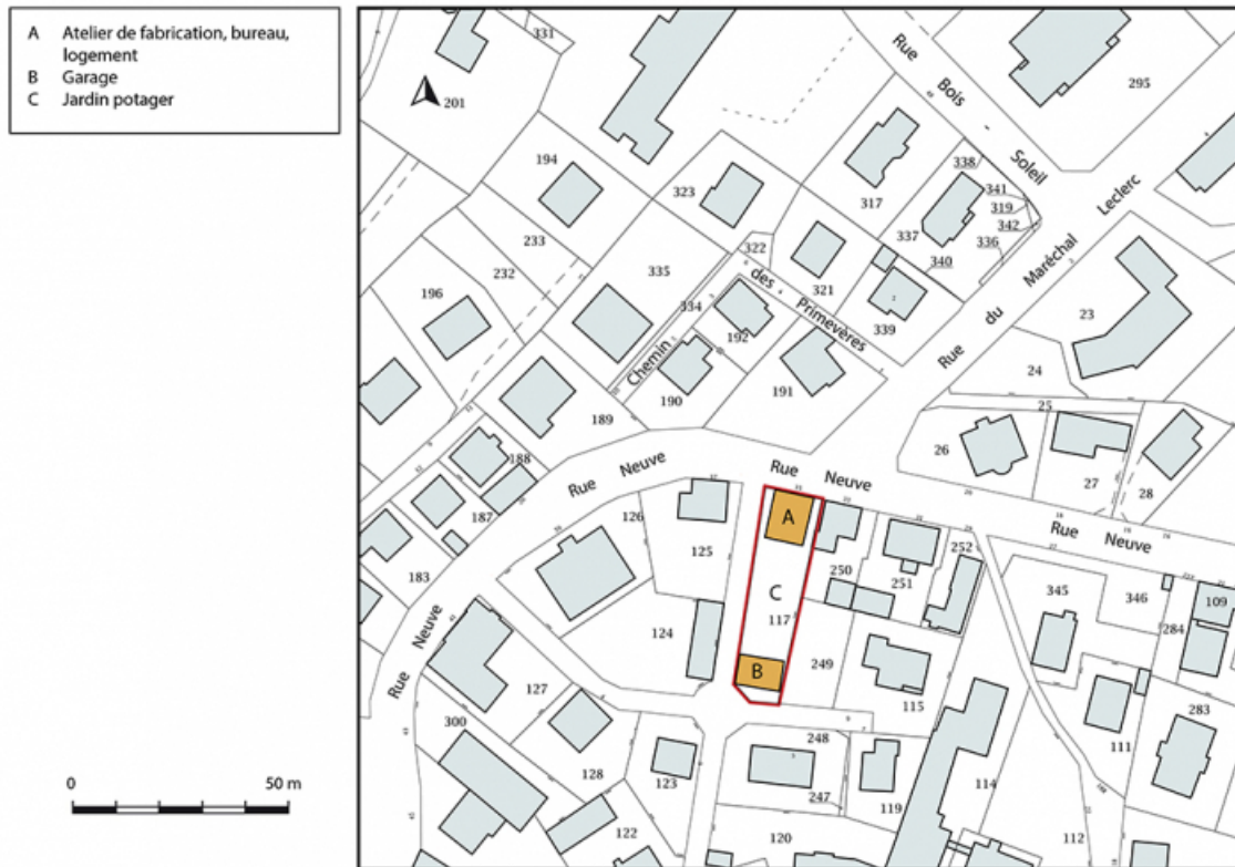
Plan-masse et de situation. Extrait du plan cadastral, 2018, section AC, 1/1 000. 25, Morteau, 35 rue Neuve