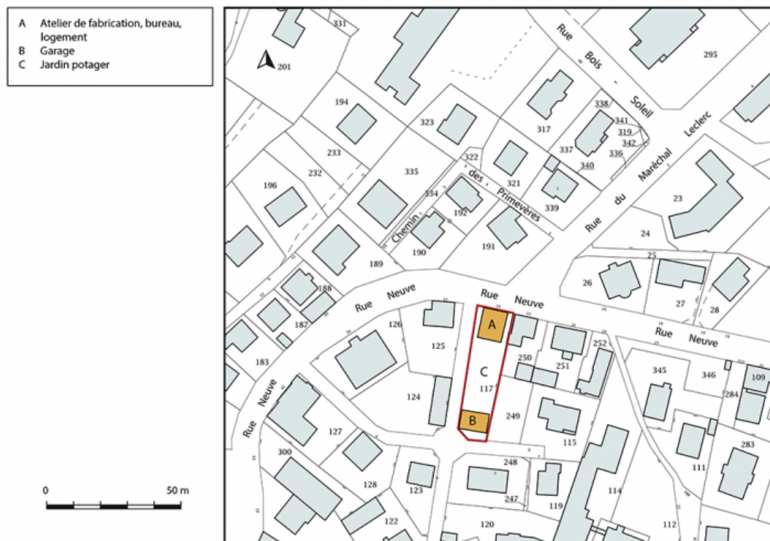
Plan-masse et de situation. Extrait du plan cadastral, 2018, section AC, 1/1 000. 25, Morteau, 35 rue Neuve