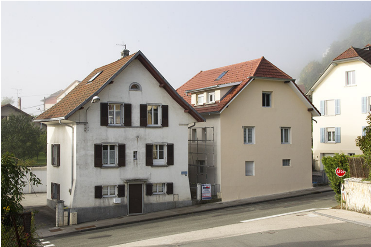
Vue d'ensemble, depuis le nord-est (la maison de gauche est au n° 33 de la rue Neuve). 25, Morteau, 35 rue Neuve