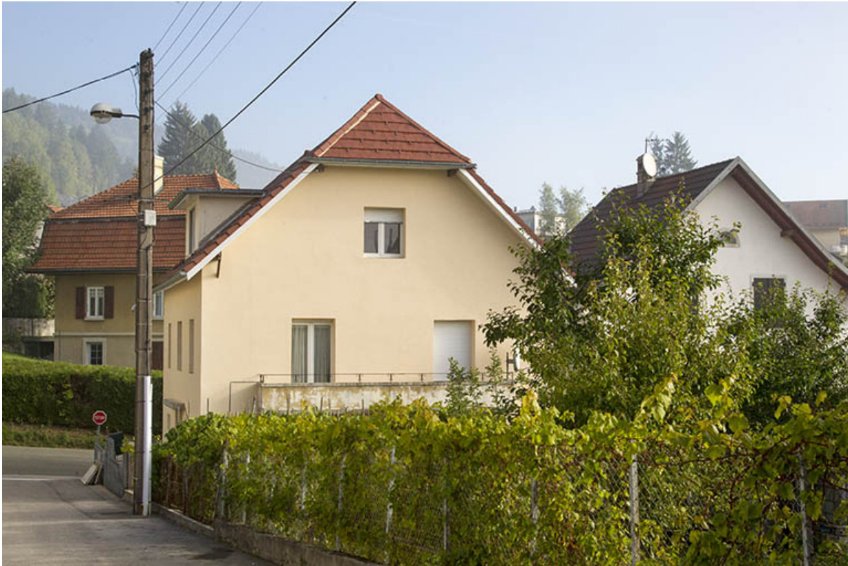
Façade latérale droite.