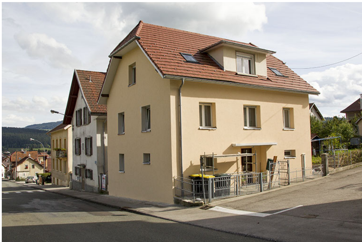
Façades antérieure et latérale gauche.