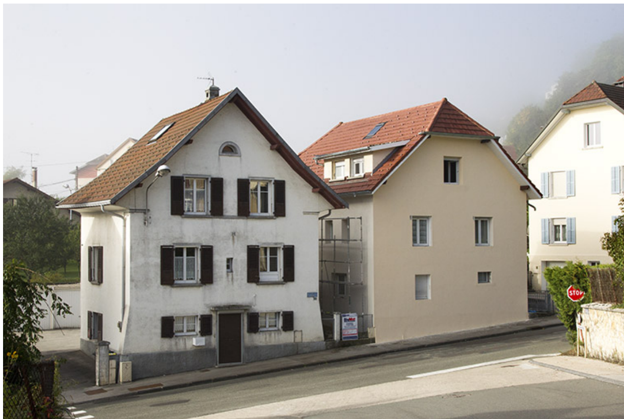
Vue d'ensemble, depuis le nord-est (la maison de gauche est au n° 33 de la rue Neuve). 25, Morteau, 35 rue Neuve