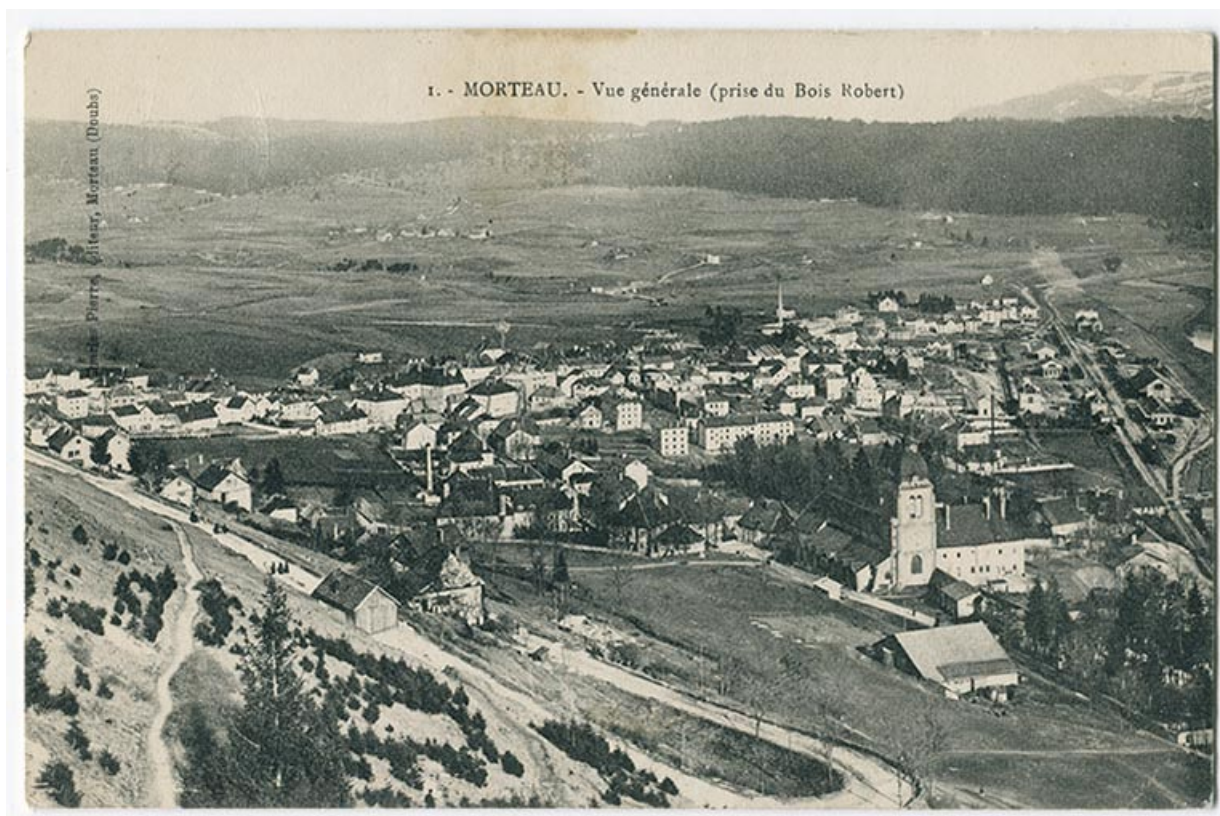
1. - Morteau. - Vue générale (prise du Bois Robert), 1er quart 20e siècle [avant 1911]. L'usine, au centre de l'image, se marque par sa cheminée.