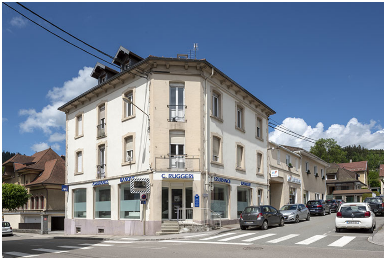
Vue d'ensemble depuis l'est (sur les rues Pasteur et Pertusier).