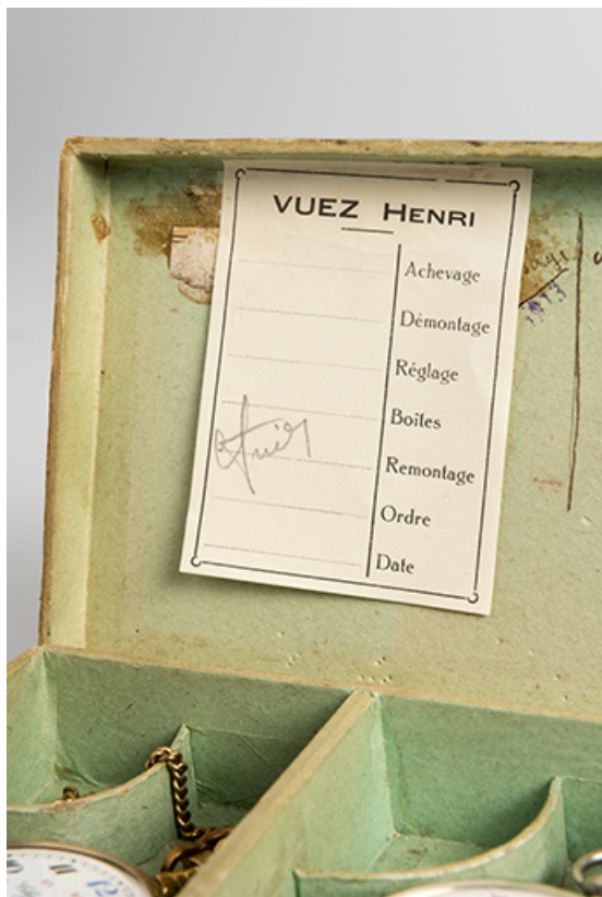
Exemple de cartons de montres : fiche d'opération (collection particulière : Jean-Claude Vuez, Villers-le-Lac). 25, Morteau, 1 place Carnot