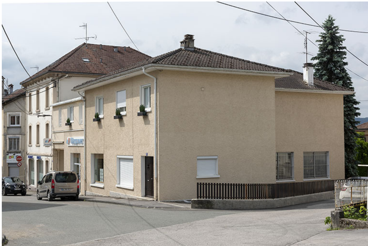
Vue d'ensemble depuis le nord (sur la rue Pertusier).