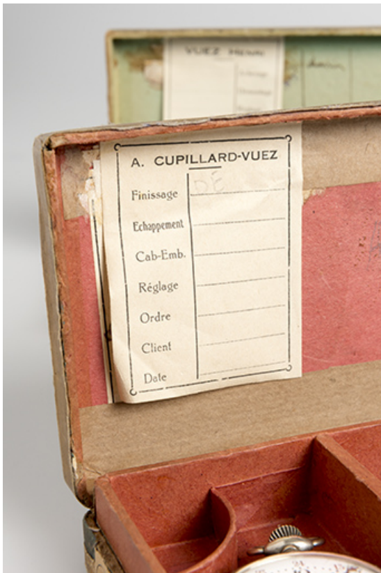
Carton de montres Cupillard-Vuez : fiche d'opération (collection particulière : Jean-Claude Vuez, Villers-le-Lac). 25, Morteau, 39 rue Neuve