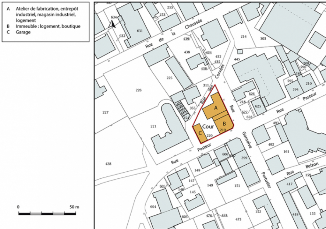
Plan-masse et de situation. Extrait du plan cadastral, 2018, section AA, 1/1 000. 25, Morteau, 20 rue Pasteur