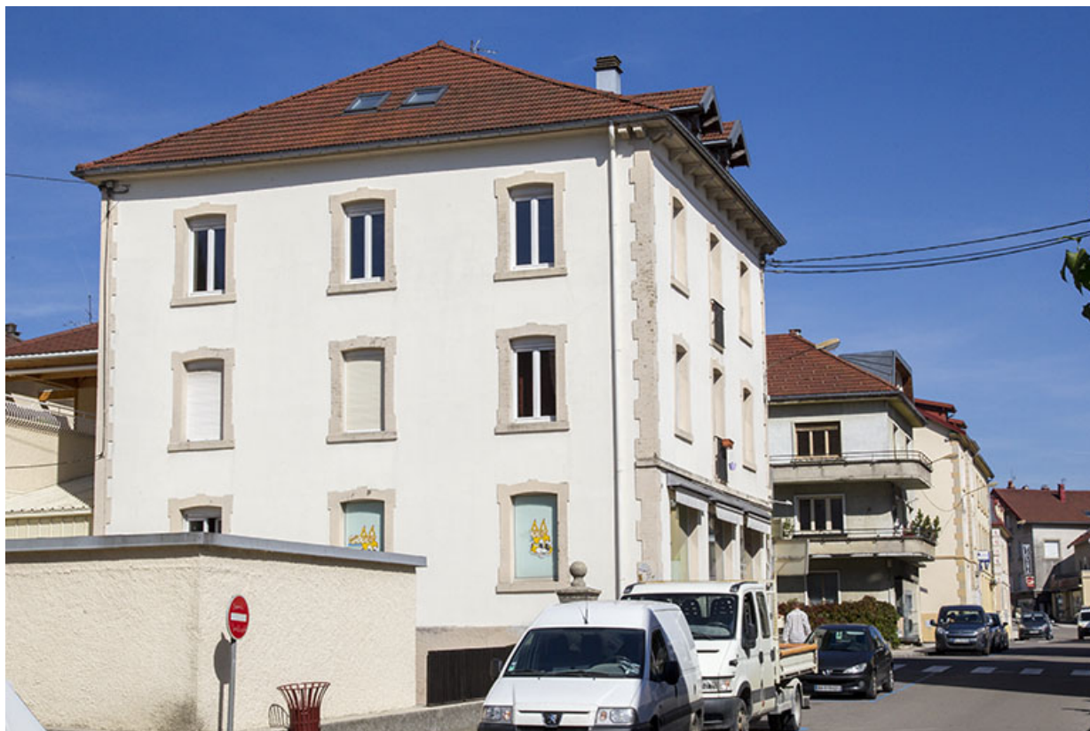
Bâtiment à l'angle des rues Pasteur et Pertusier, en 2013 : façade latérale gauche.