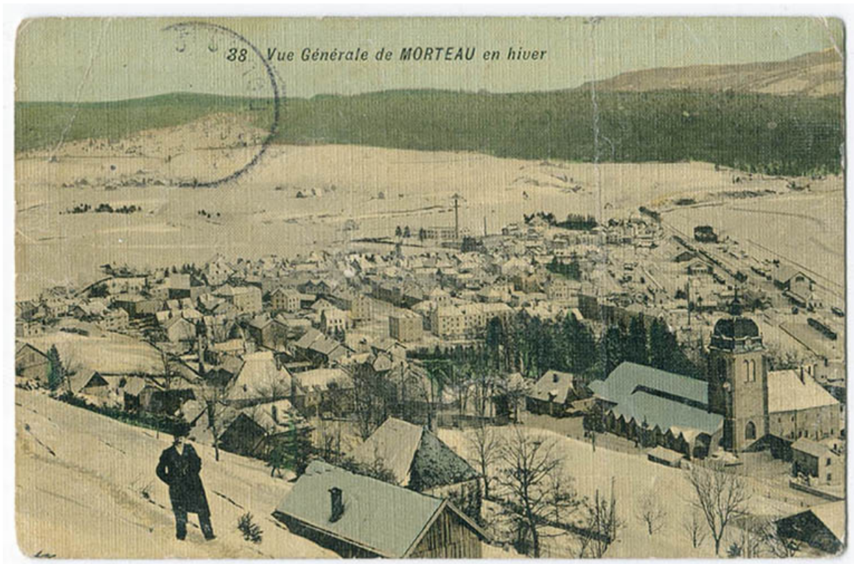
38. Vue générale de Morteau en hiver, 1er quart 20e siècle. 25, Morteau, 20 rue Pasteur

38. Vue générale de Morteau en hiver, carte postale en couleur, s.n., s.d. [1er quart 20e siècle], Farine Frères éd. à Morteau.