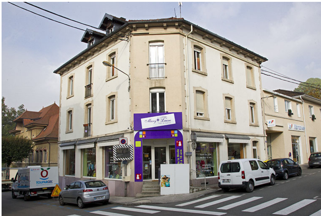
Bâtiment à l'angle des rues Pasteur et Pertusier, en 2013 : façades antérieure et latérale droite. 25, Morteau, 20 rue Pasteur