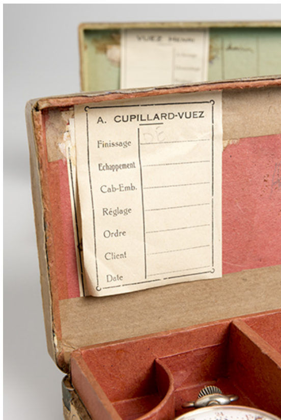
Carton de montres Cupillard-Vuez : fiche d'opération (collection particulière : Jean-Claude Vuez, Villers-le-Lac). 25, Morteau, 39 rue Neuve