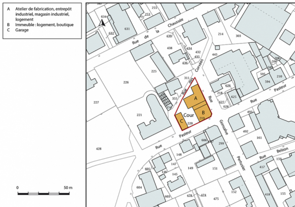
Plan-masse et de situation. Extrait du plan cadastral, 2018, section AA, 1/1 000. 25, Morteau, 20 rue Pasteur