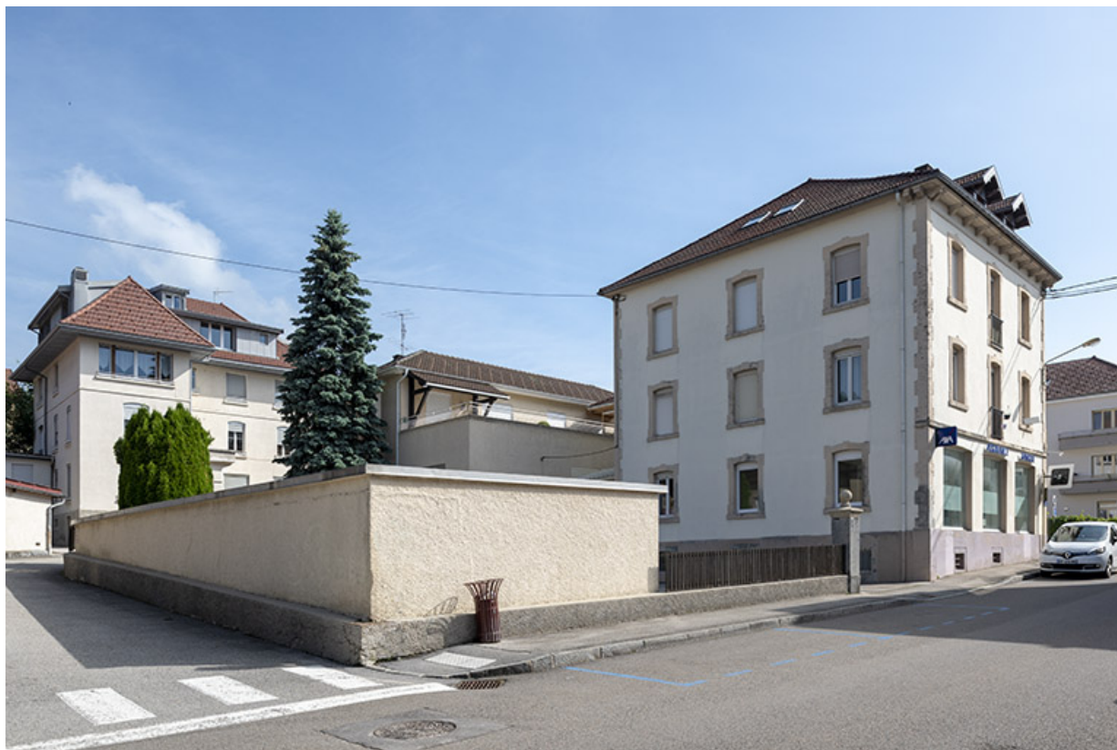
Vue d'ensemble depuis le sud-ouest (sur la rue Pasteur).