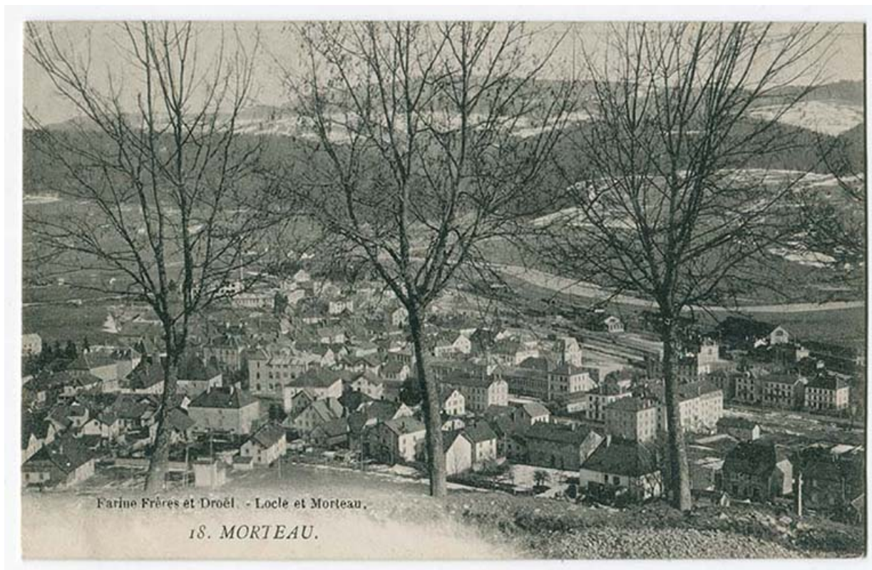
18. Morteau [vue plongeante sur la ville depuis le nord-ouest], 1er quart 20e siècle [avant 1908]. La Grande Fabrique est visible au centre.