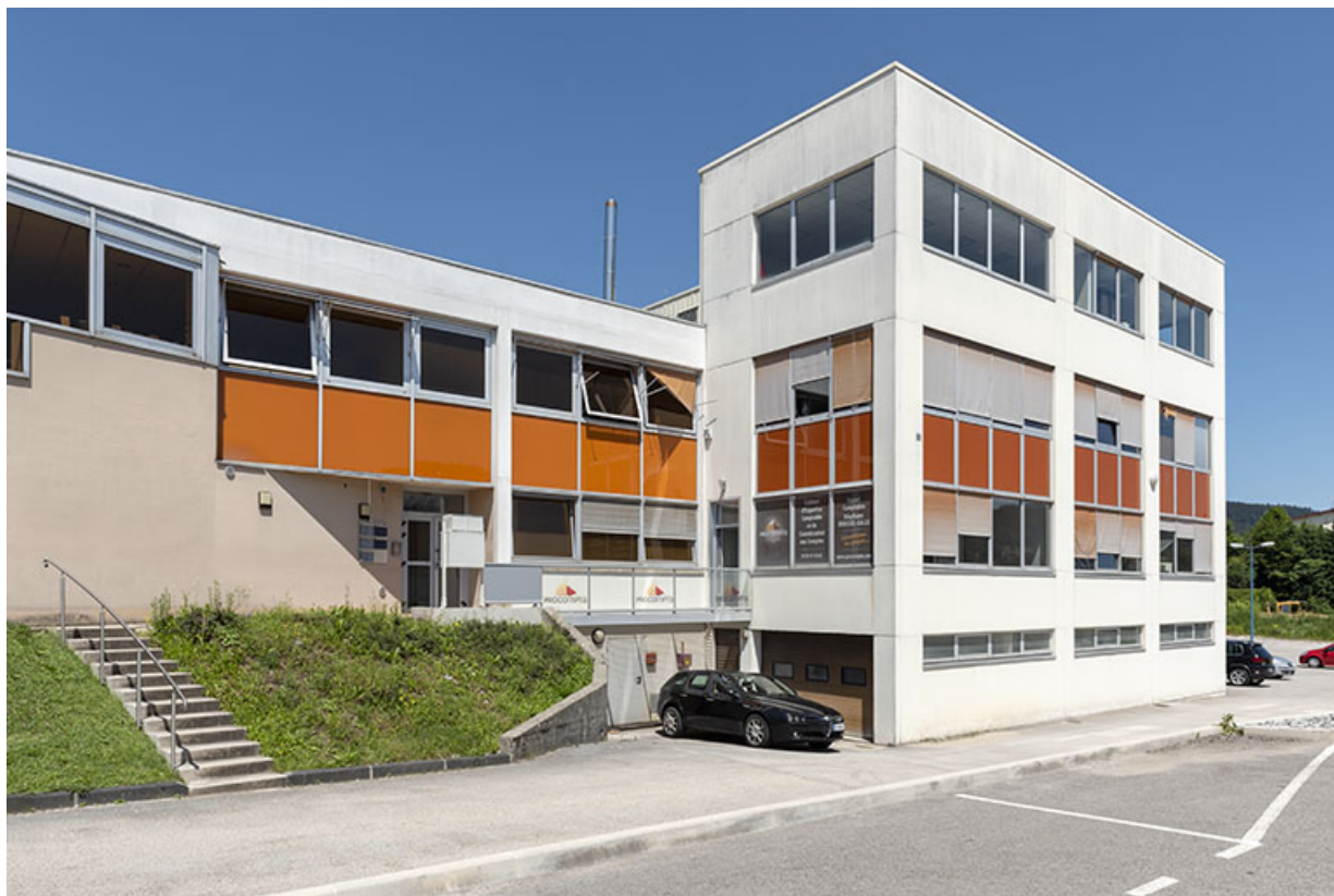
Façade est, de trois quarts gauche.