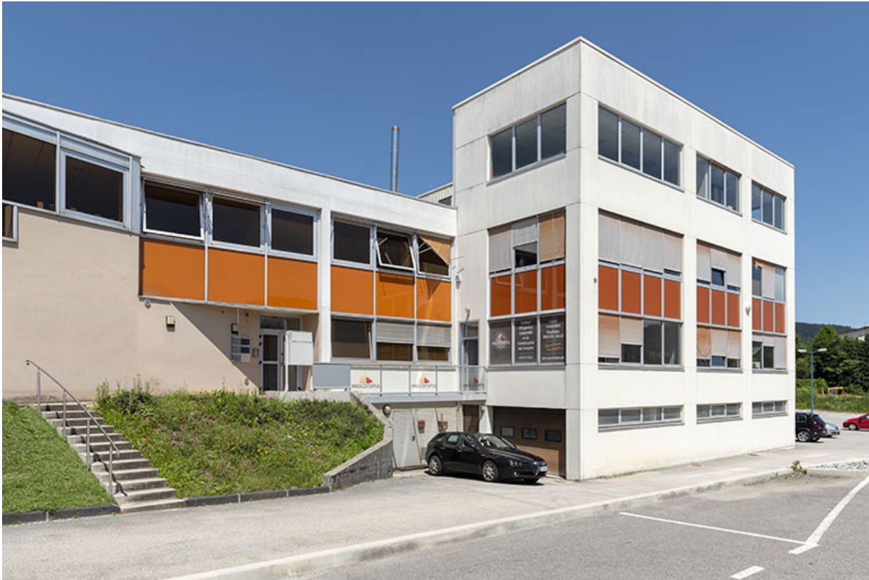
Façade est, de trois quarts gauche.