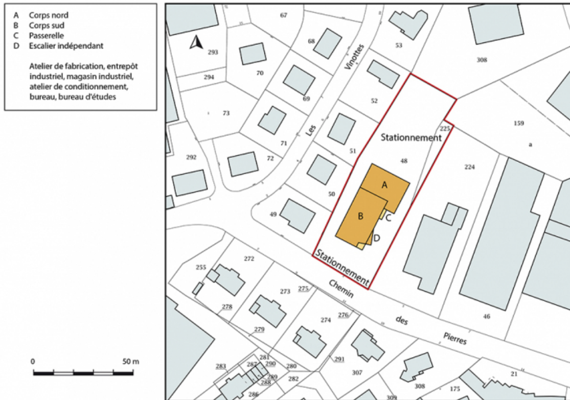
Plan-masse et de situation. Extrait du plan cadastral, 2018, section AE, 1/1 000. 25, Morteau, 3 chemin des Pierres