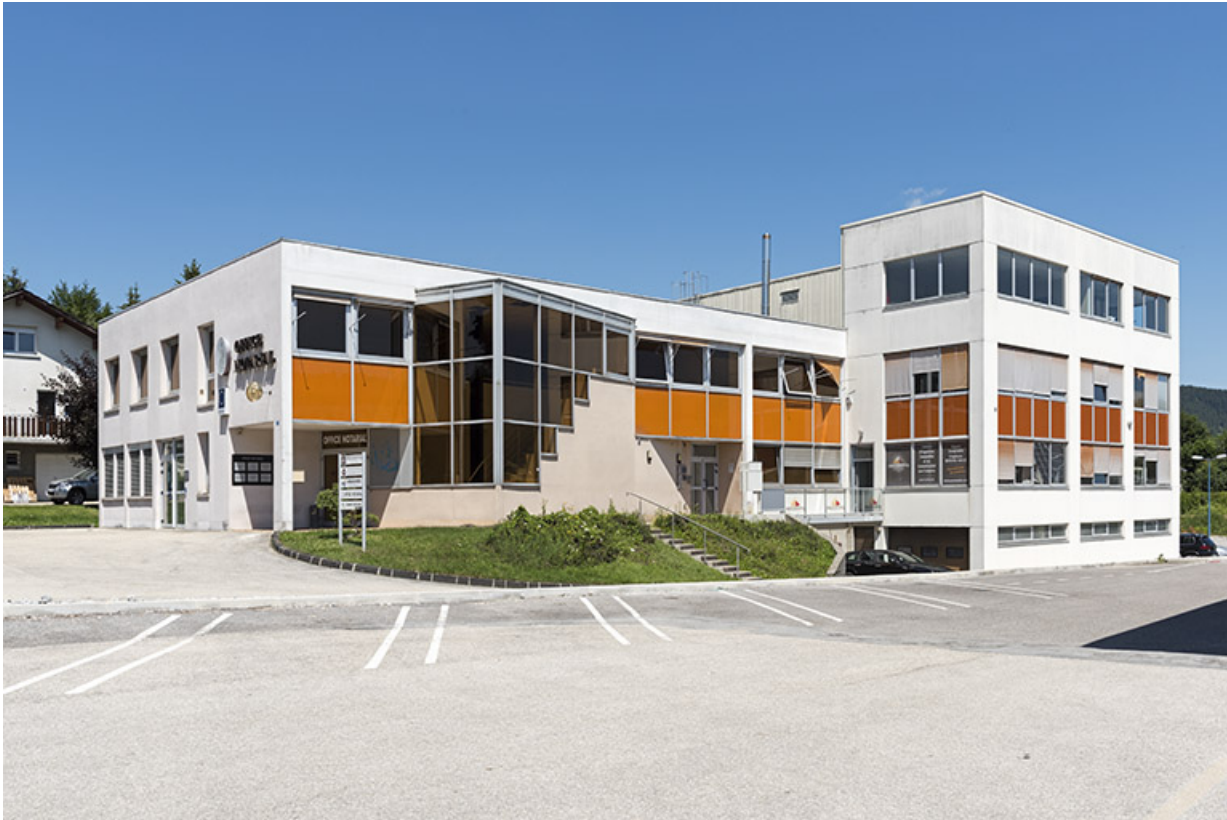
Vue d'ensemble, depuis le sud-est. 25, Morteau