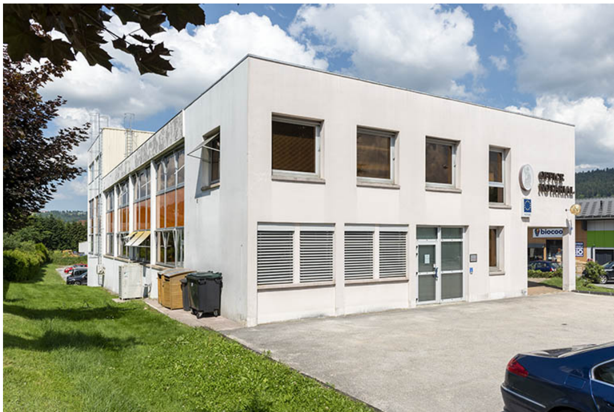
Façade sud, de trois quarts gauche.