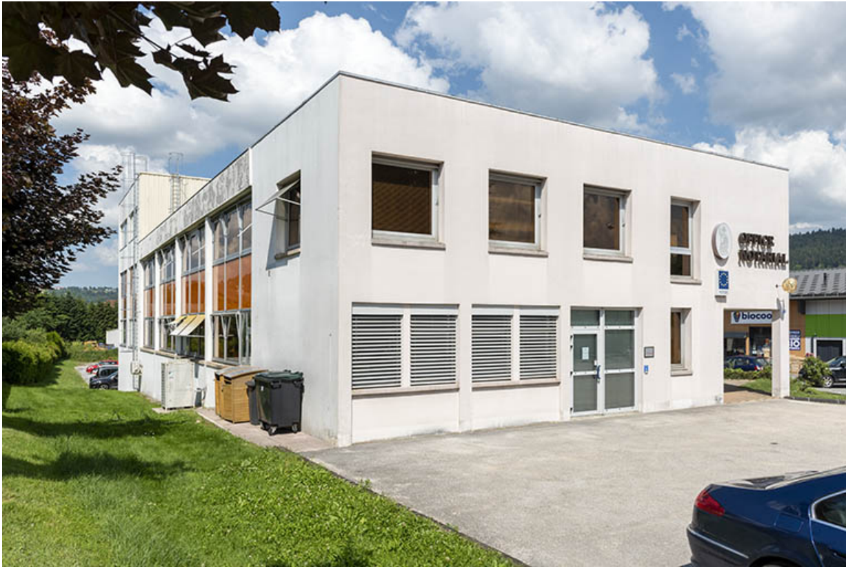
Façade sud, de trois quarts gauche.