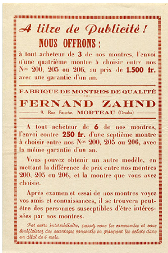
Annonce publicitaire de la société Zahnd, milieu 20e siècle. 25, Morteau, 17-19 rue Fauche