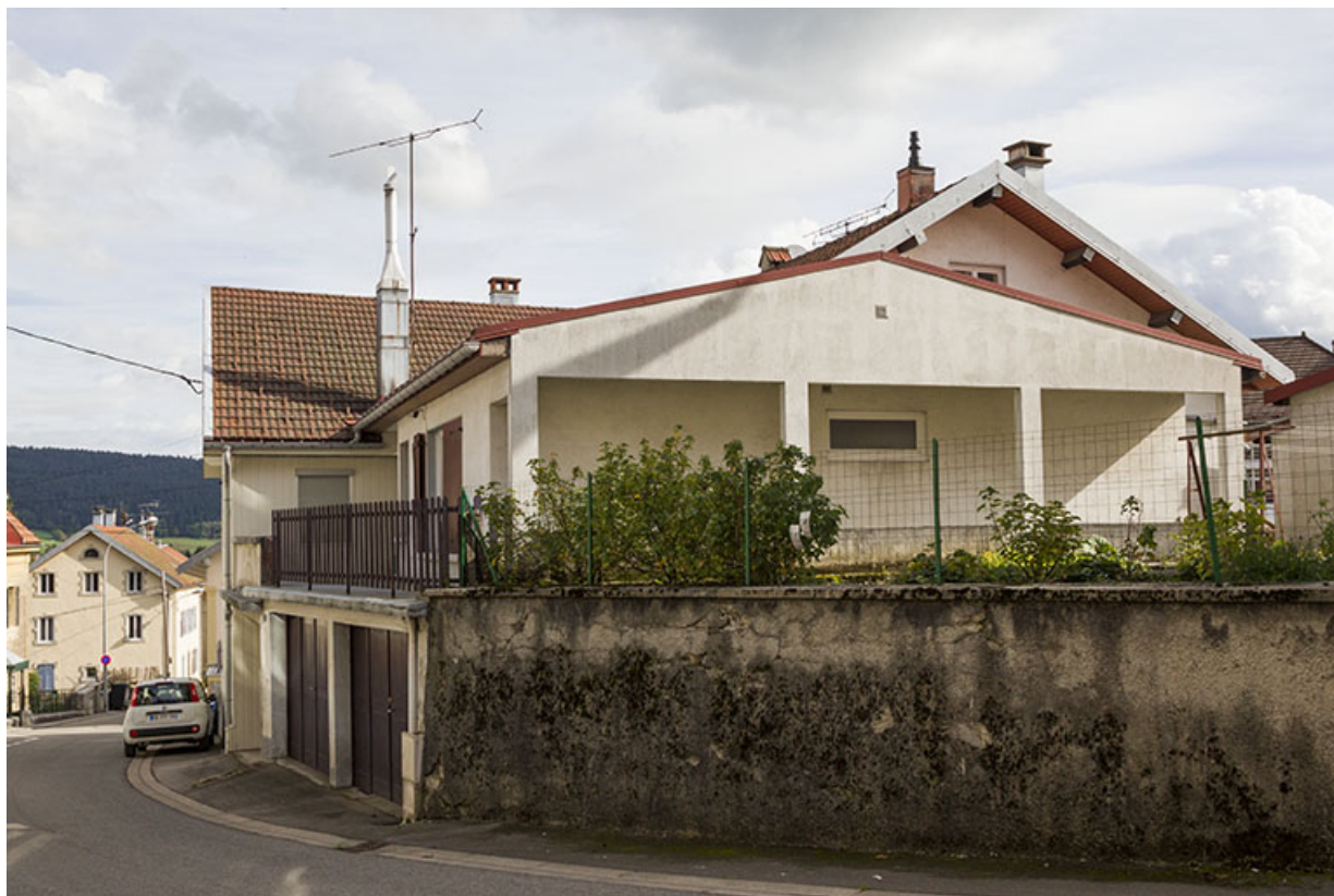
Vue d'ensemble, depuis le nord-ouest.