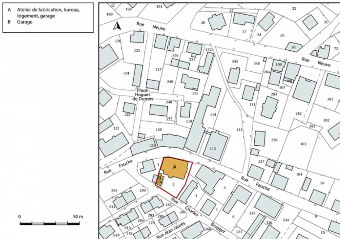
Plan-masse et de situation. Extrait du plan cadastral, 2018, section AA, 1/1 000. 25, Morteau, 17-19 rue Fauche