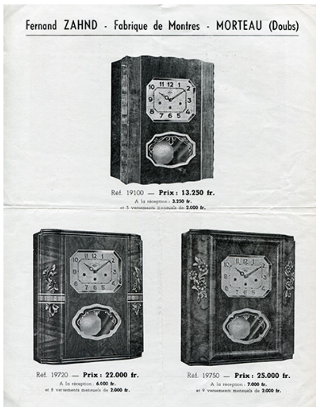
Fernand Zahnd - Fabrique de montres - Morteau (Doubs) [tarif des carillons : recto], 1954. 25, Morteau, 17-19 rue Fauche