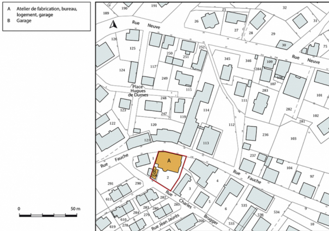
Plan-masse et de situation. Extrait du plan cadastral, 2018, section AA, 1/1 000. 25, Morteau, 17-19 rue Fauche