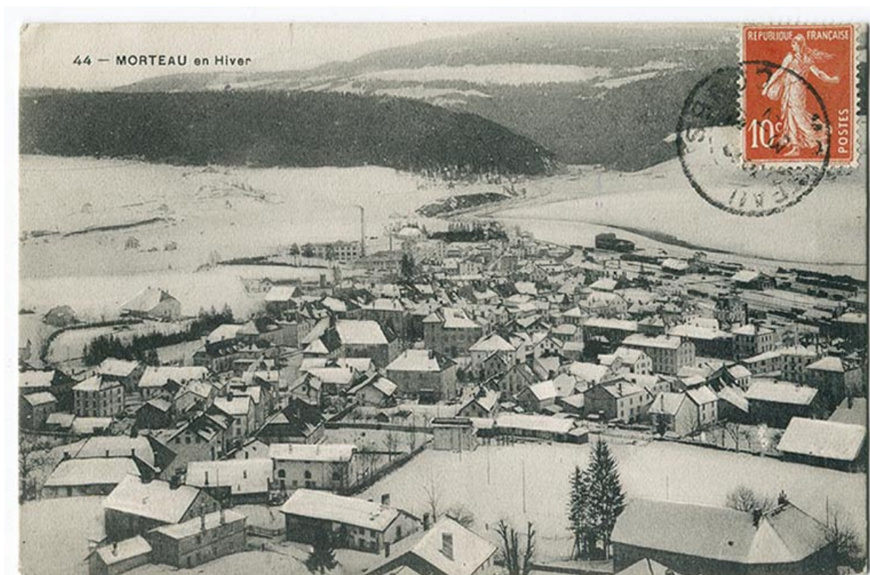
44 - Morteau en hiver, 1er quart 20e siècle [avant 1912]. 25, Morteau