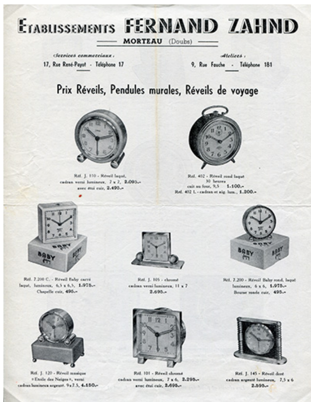
Etablissements Fernand Zahnd. Prix réveils, pendules murales, réveils de voyage [recto], début des années 1950. 25, Morteau, 17-19 rue Fauche