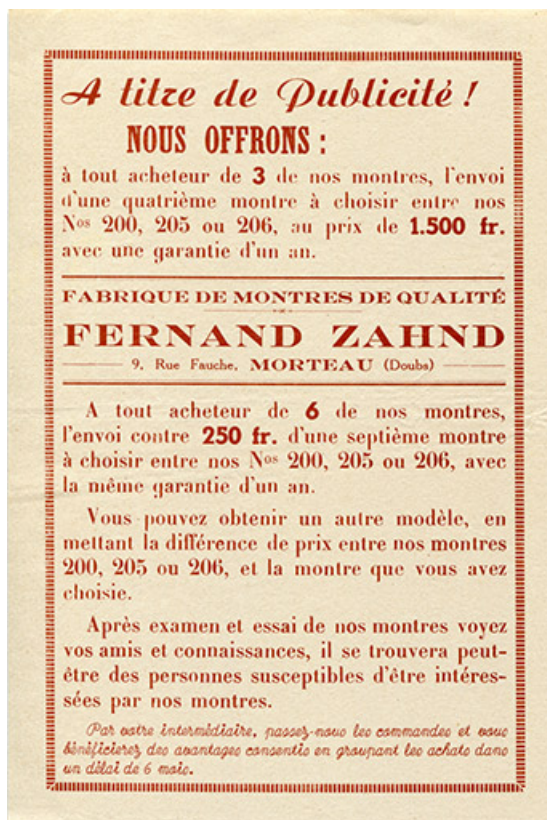
Annonce publicitaire de la société Zahnd, milieu 20e siècle. 25, Morteau, 17-19 rue Fauche