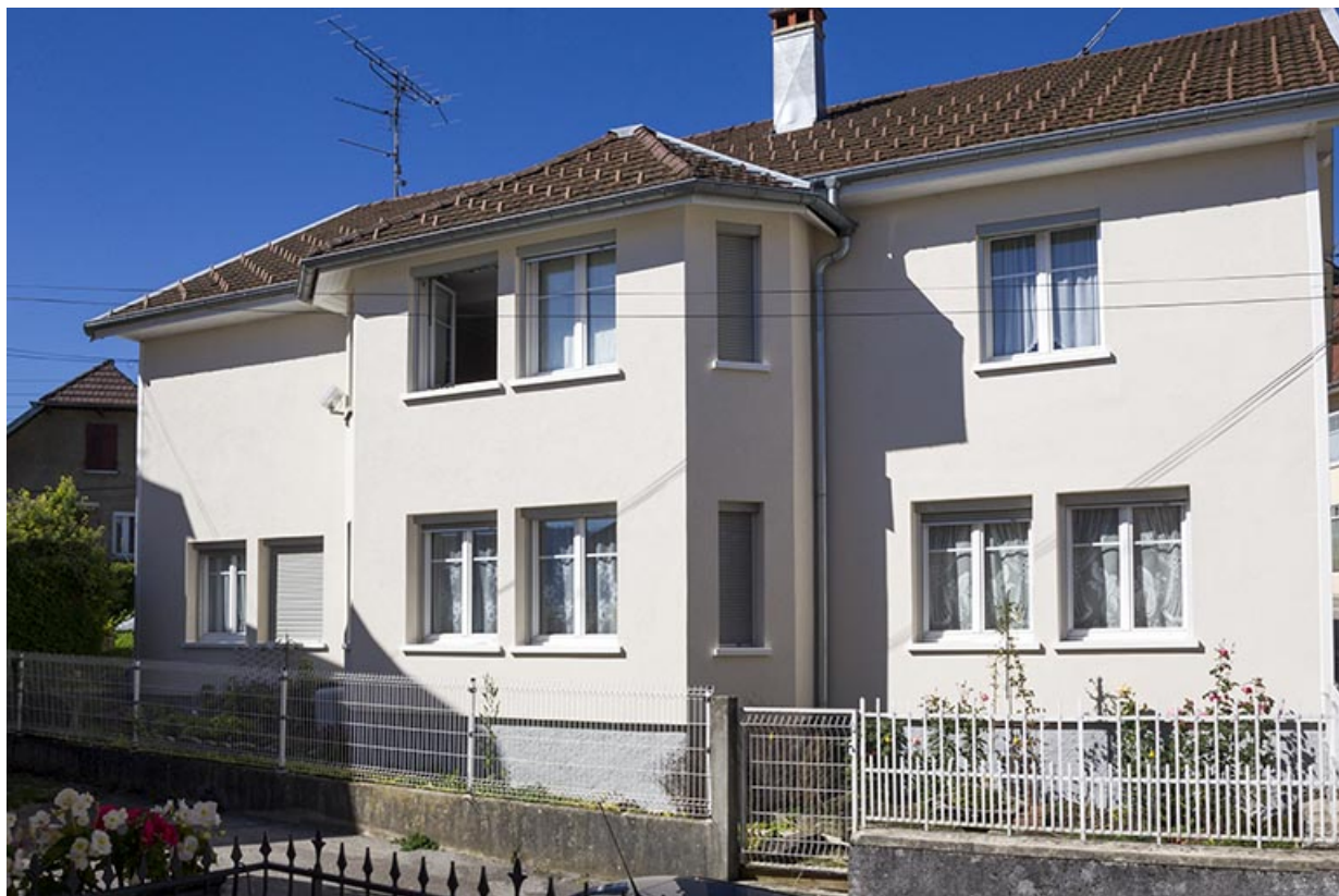
Façade latérale gauche.