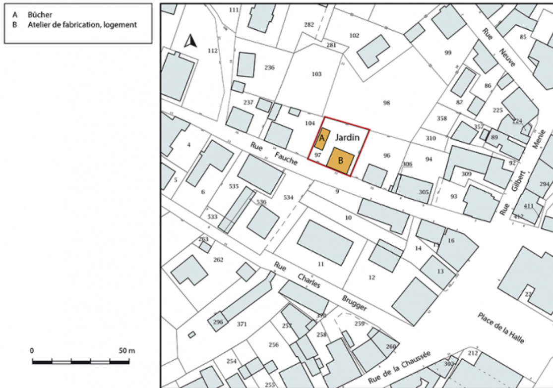
Plan-masse et de situation. Extrait du plan cadastral, 2018, section AC, 1/1 000. 25, Morteau, 12 rue Fauche