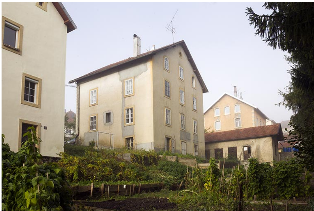
Façades postérieure et latérale droite.