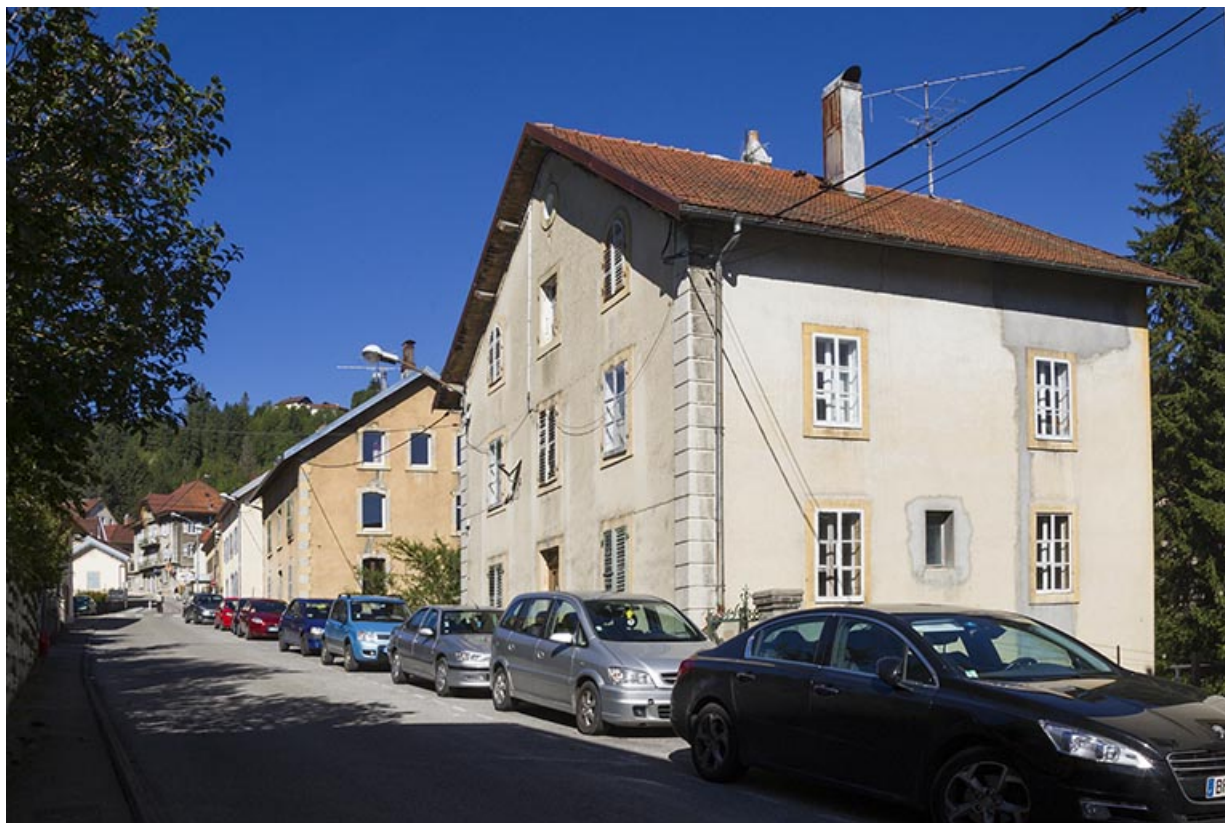
Vue d'ensemble, depuis l'est (façades antérieure et latérale droite). 25, Morteau