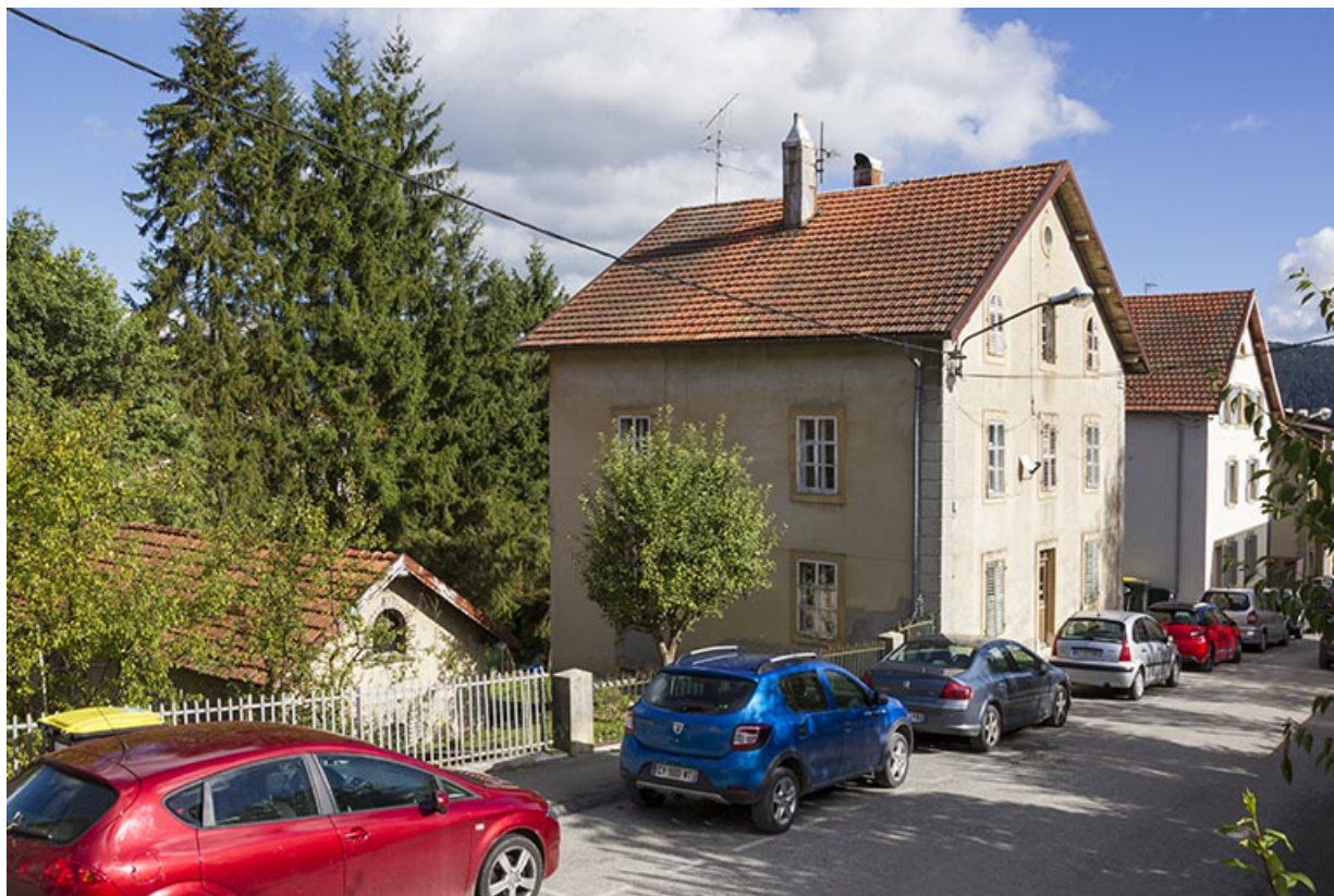
Vue d'ensemble, depuis l'ouest (façades antérieure et latérale gauche). 25, Morteau, 12 rue Fauche