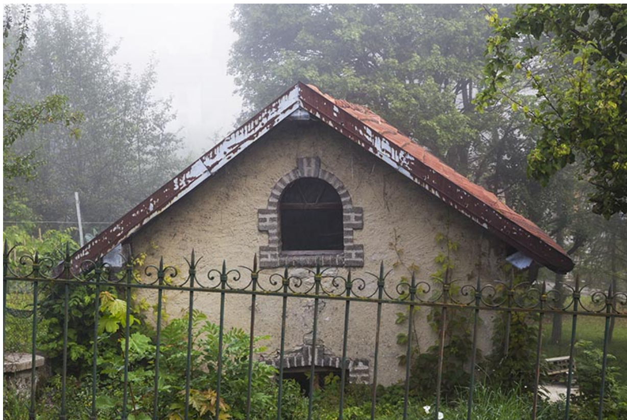
Bûcher : pignon sud.