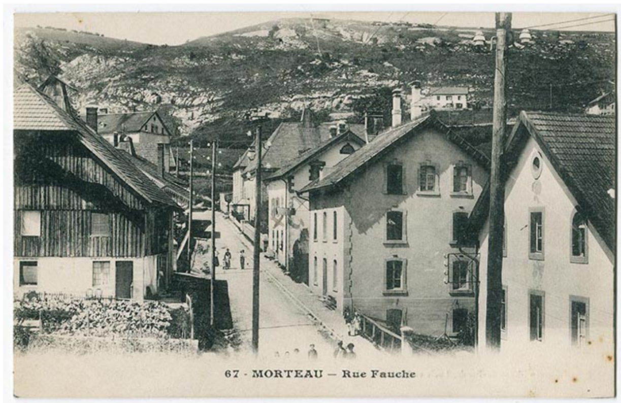
67 - Morteau - Rue Fauche, 1er quart 20e siècle. Le pignon de la maison est visible au premier plan à droite. 25, Morteau