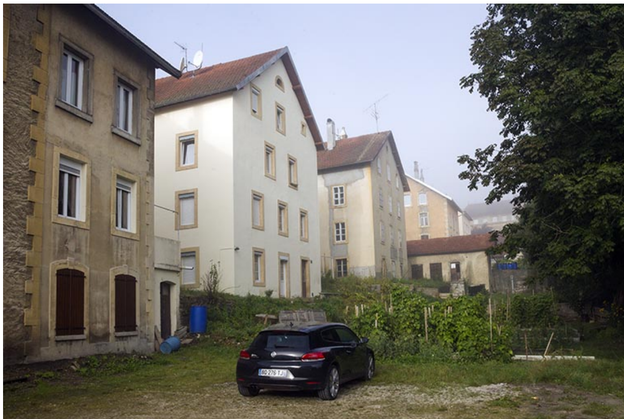
Vue d'ensemble, depuis le nord-est (façades postérieure et latérale droite). 25, Morteau, 12 rue Fauche