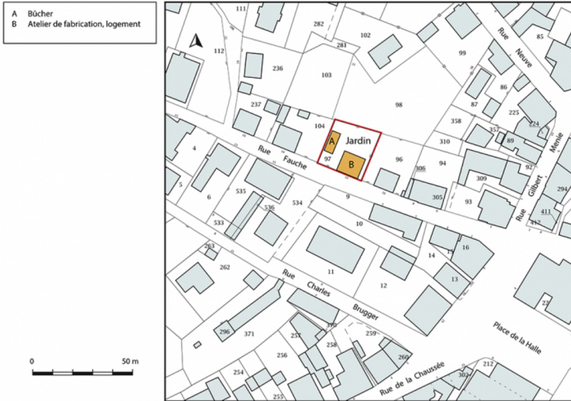
Plan-masse et de situation. Extrait du plan cadastral, 2018, section AC, 1/1 000. 25, Morteau, 12 rue Fauche