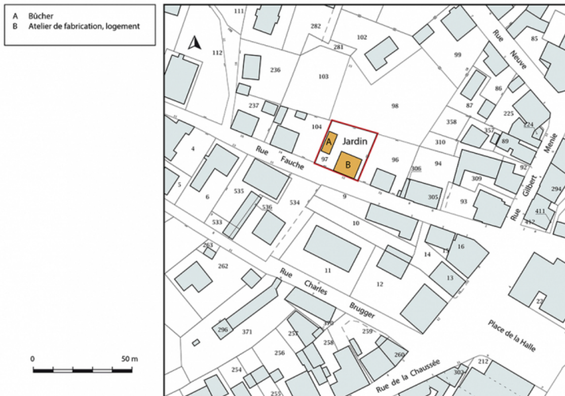
Plan-masse et de situation. Extrait du plan cadastral, 2018, section AC, 1/1 000. 25, Morteau, 12 rue Fauche