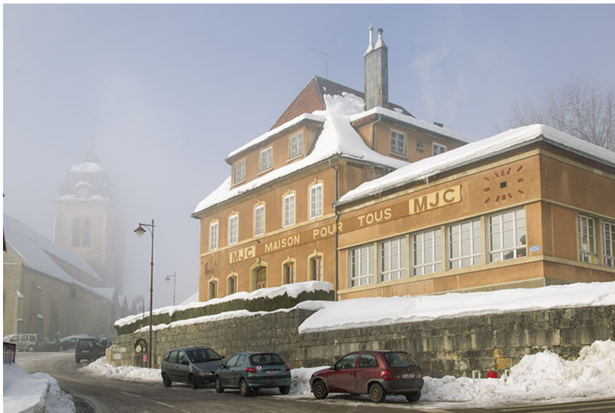
Vue d'ensemble, depuis l'est, en hiver.