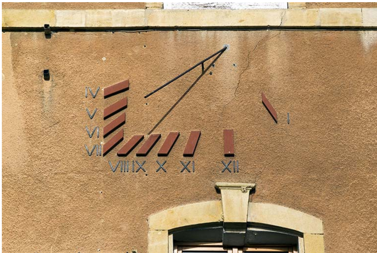
Cadran solaire (façade antérieure).