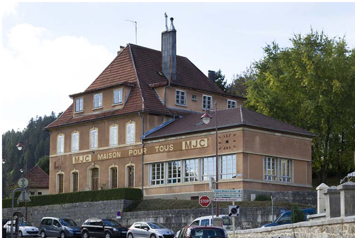
Presbytère puis bureau de la garantie puis école d'horlogerie, 2 place de l'Eglise. 25, Morteau