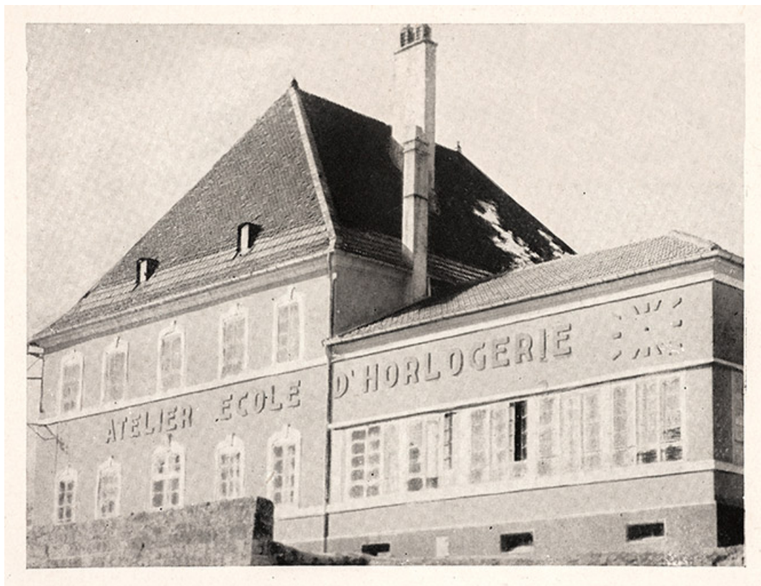
Atelier Ecole d'Horlogerie, 1949. 25, Morteau, 2 place de l' Eglise