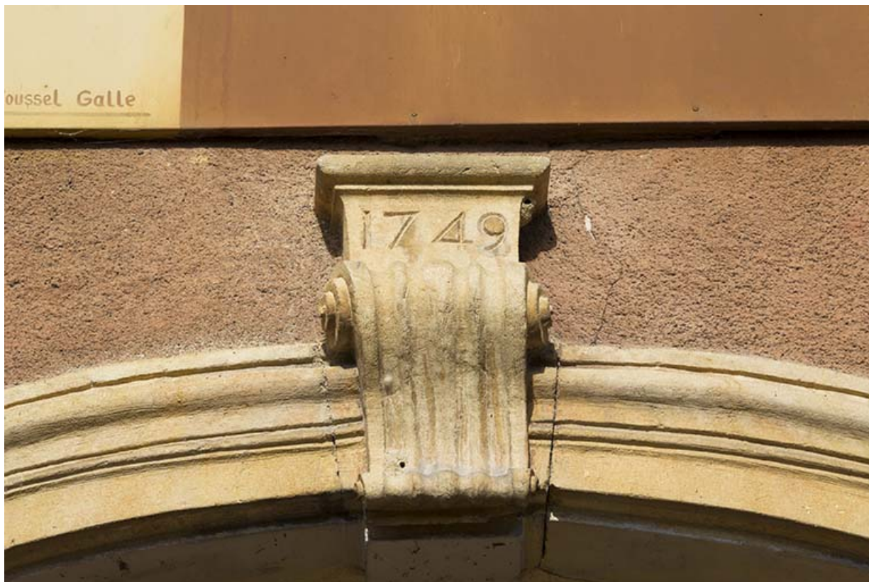
Date 1749 sur la clé de la porte principale (façade antérieure).