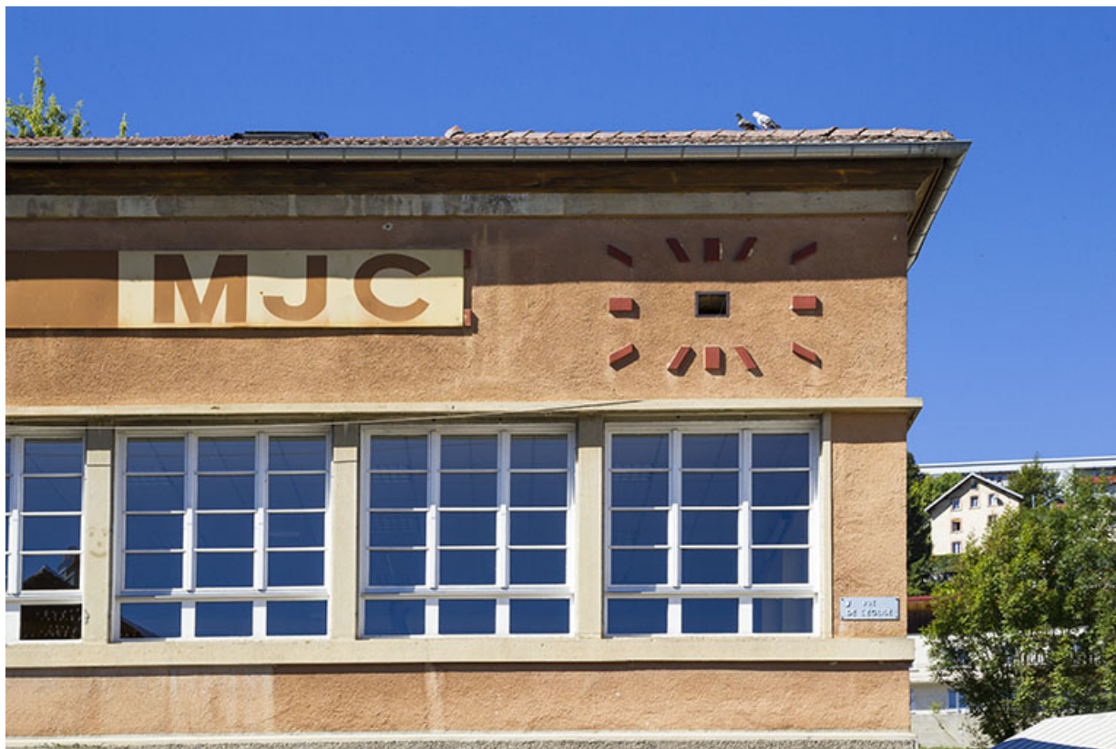
Inscription MJC et cadran de l'ancienne horloge monumentale (façade antérieure de l'atelier). 25, Morteau, 2 place de l' Eglise