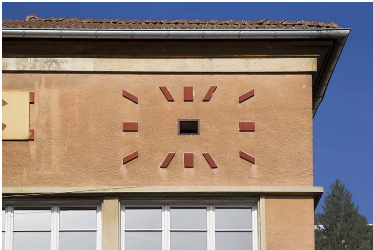
Cadran de l'ancienne horloge monumentale (façade antérieure de l'atelier). 25, Morteau, 2 place de l' Eglise