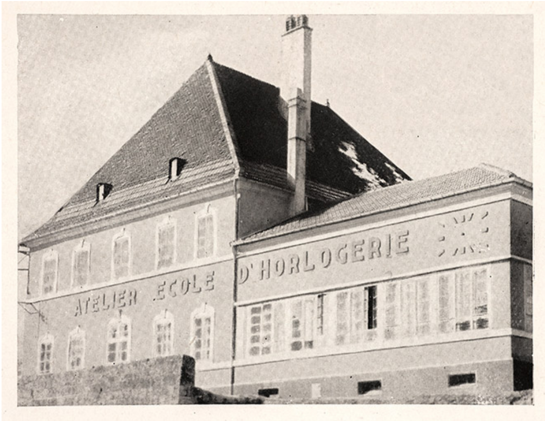
Atelier Ecole d'Horlogerie, 1949. 25, Morteau, 2 place de l' Eglise