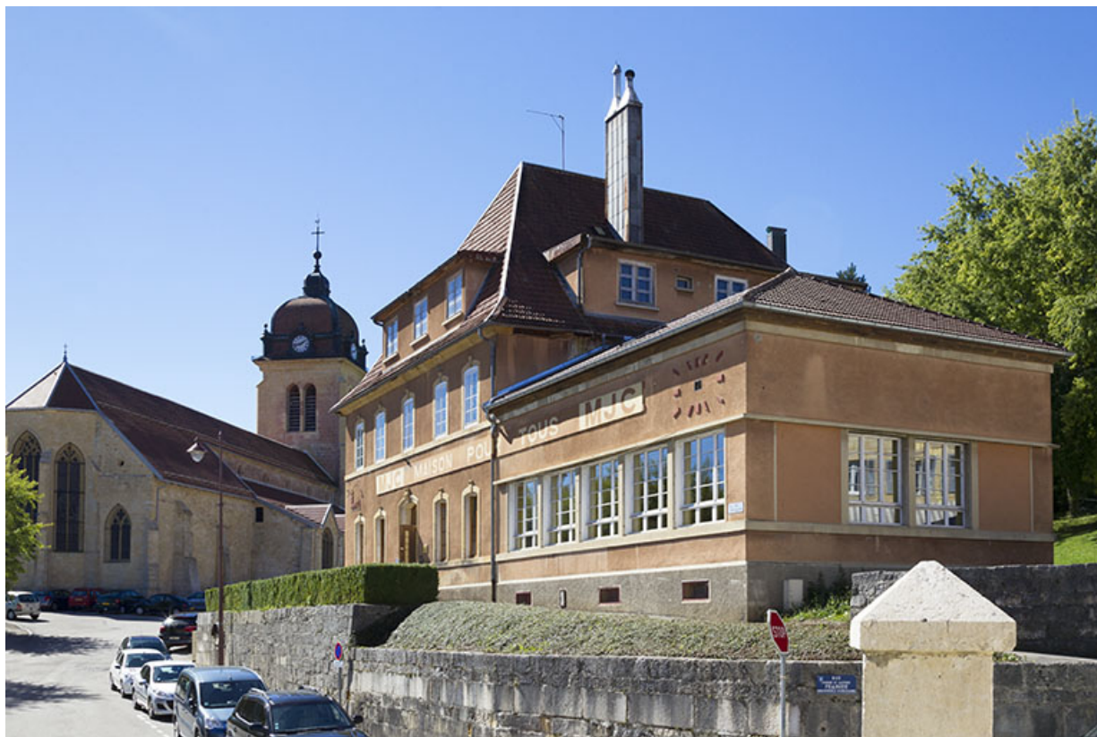
Vue d'ensemble, depuis l'est.