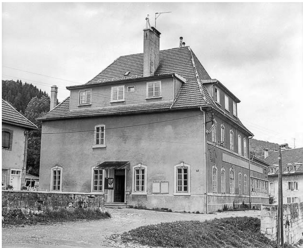
Morteau, rue de l'Eglise (actuelle maison des jeunes) : vue d'ensemble.