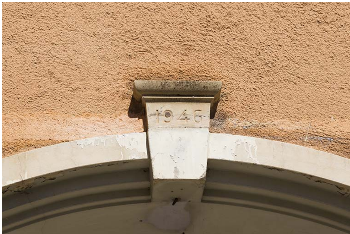
Date 1946 sur la clé d'une porte secondaire (façade latérale gauche). 25, Morteau, 2 place de l' Eglise