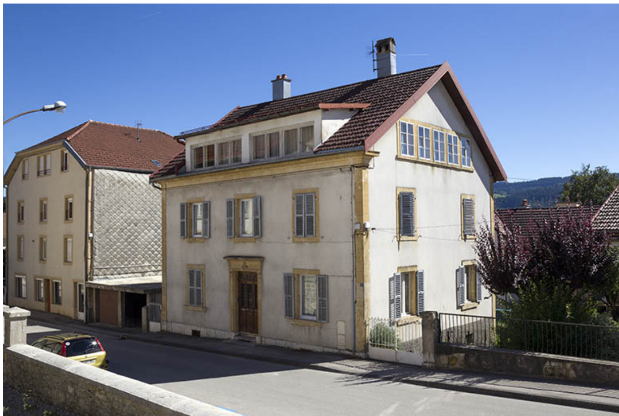
Façades antérieure et latérale droite. 25, Morteau