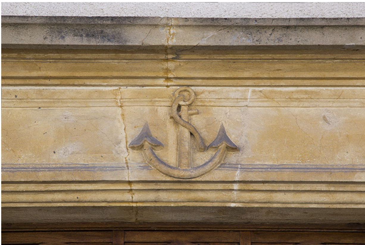
Ancre sculptée sur le linteau de l'entrée.