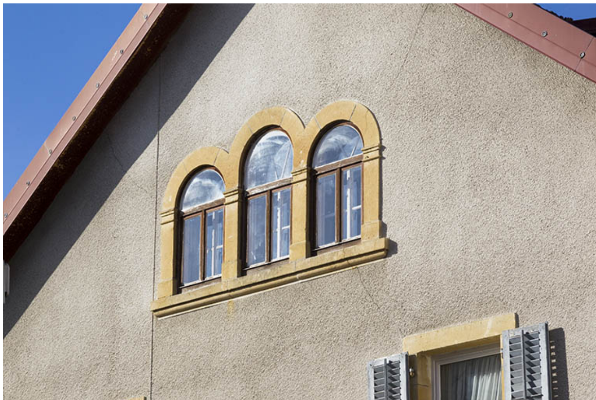
Pignon oriental : fenêtres en plein cintre.