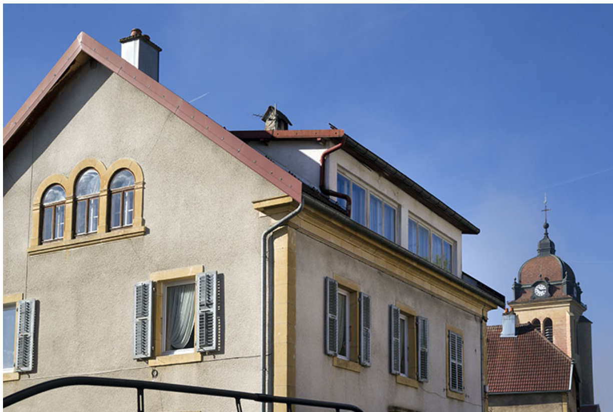
Étage et étage en surcroît (côté est). 25, Morteau, 27 rue de la Chaussée