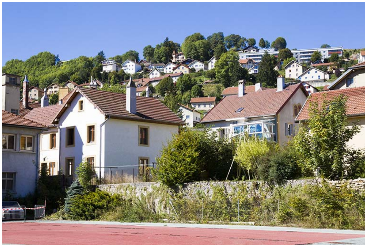
Façade postérieure. A gauche, ancien atelier du site de Camille Mauvais. 25, Morteau, 3, 5 rue de la Glapiney