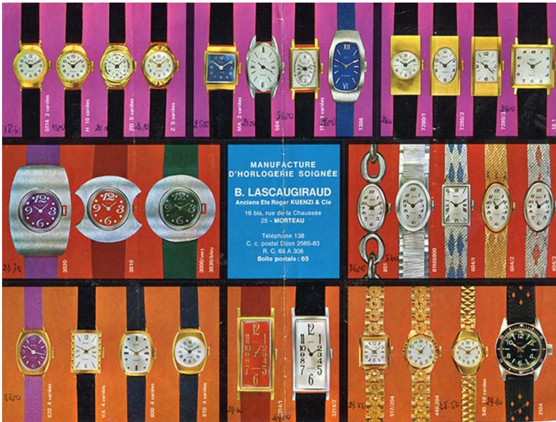
Manufacture d'Horlogerie soignée B. Lascaugiraud [dépliant : verso], 3e quart 20e siècle. 25, Morteau