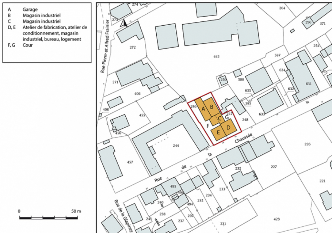
Plan-masse et de situation. Extrait du plan cadastral, 2018, section AA, 1/1 000. 25, Morteau, 26-28 rue de la Chaussée