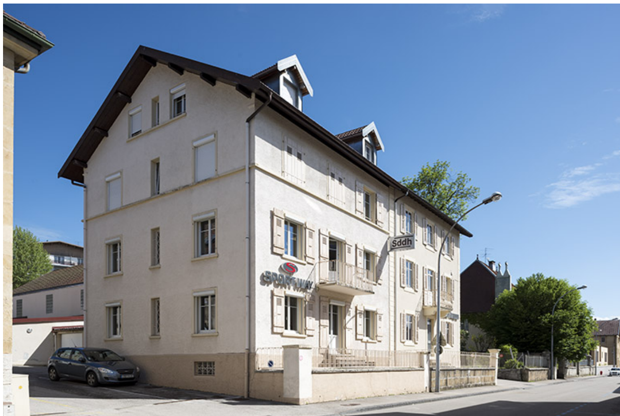
Façades antérieure et latérale gauche. 25, Morteau