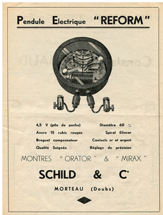
Pendule électrique "Reform" [publicité], 1947. 25, Morteau, 26-28 rue de la Chaussée