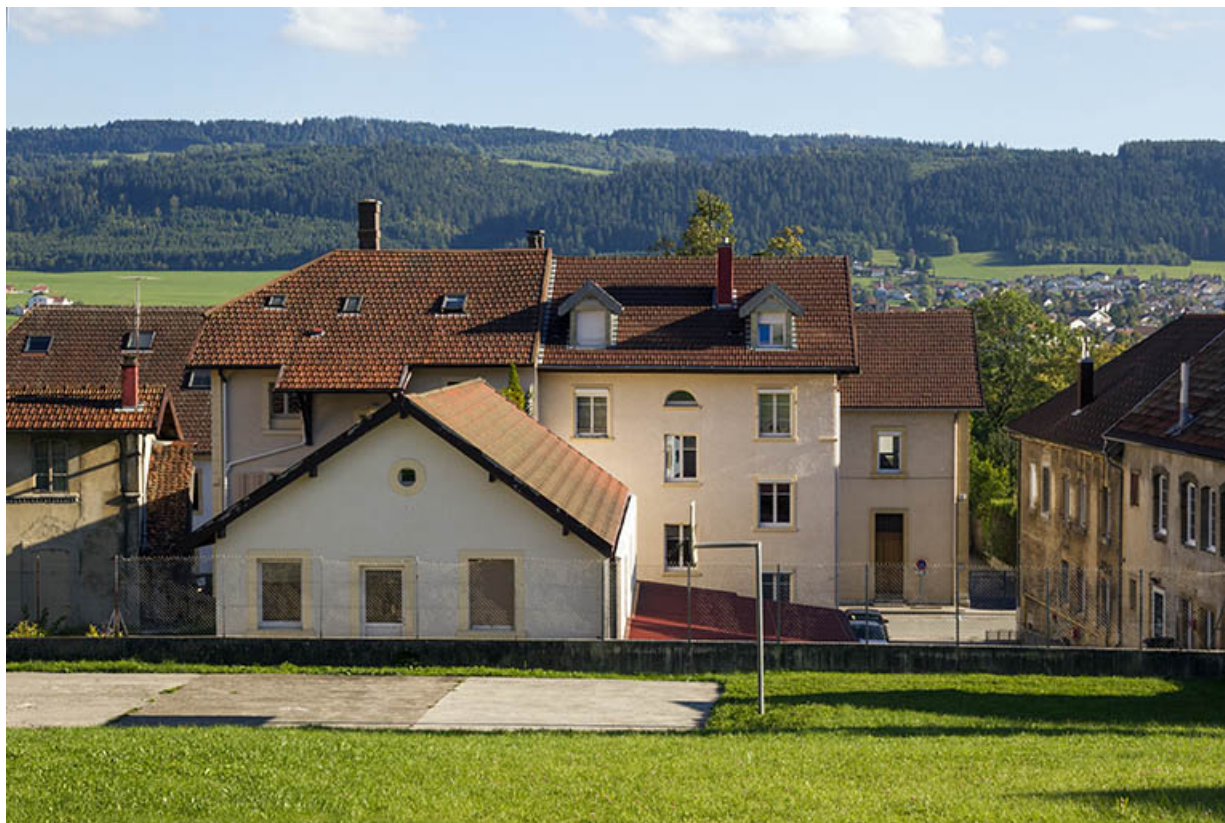
Magasin au nord et façade postérieure (à gauche avec, à droite, le bâtiment au n° 28). 25, Morteau, 26-28 rue de la Chaussée