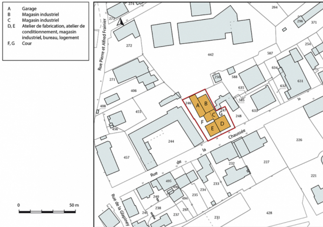
Plan-masse et de situation. Extrait du plan cadastral, 2018, section AA, 1/1 000. 25, Morteau, 26-28 rue de la Chaussée