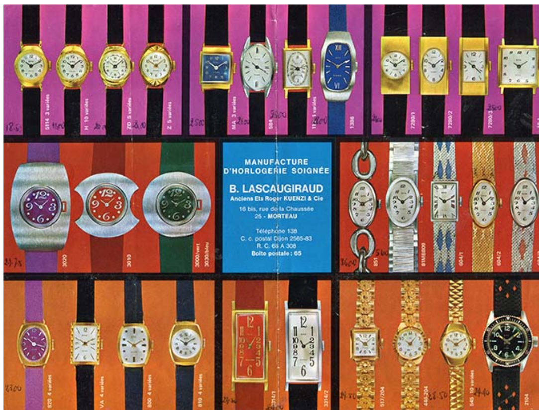
Manufacture d'Horlogerie soignée B. Lascaugiraud [dépliant : verso], 3e quart 20e siècle. 25, Morteau