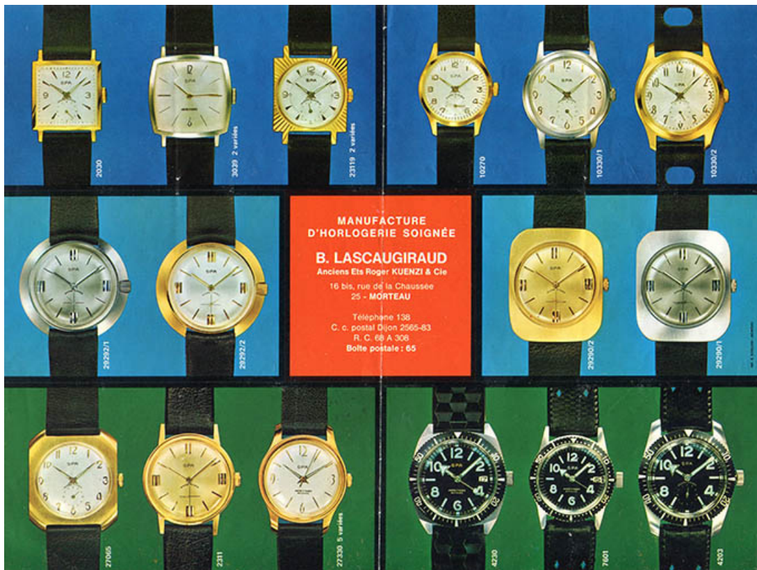
Manufacture d'Horlogerie soignée B. Lascaugiraud [dépliant : recto], 3e quart 20e siècle. 25, Morteau, 26-28 rue de la Chaussée