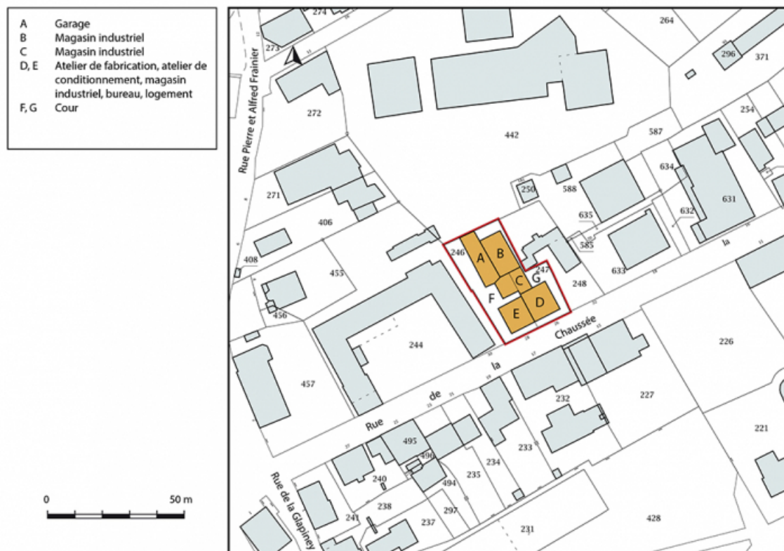
Plan-masse et de situation. Extrait du plan cadastral, 2018, section AA, 1/1 000. 25, Morteau, 26-28 rue de la Chaussée