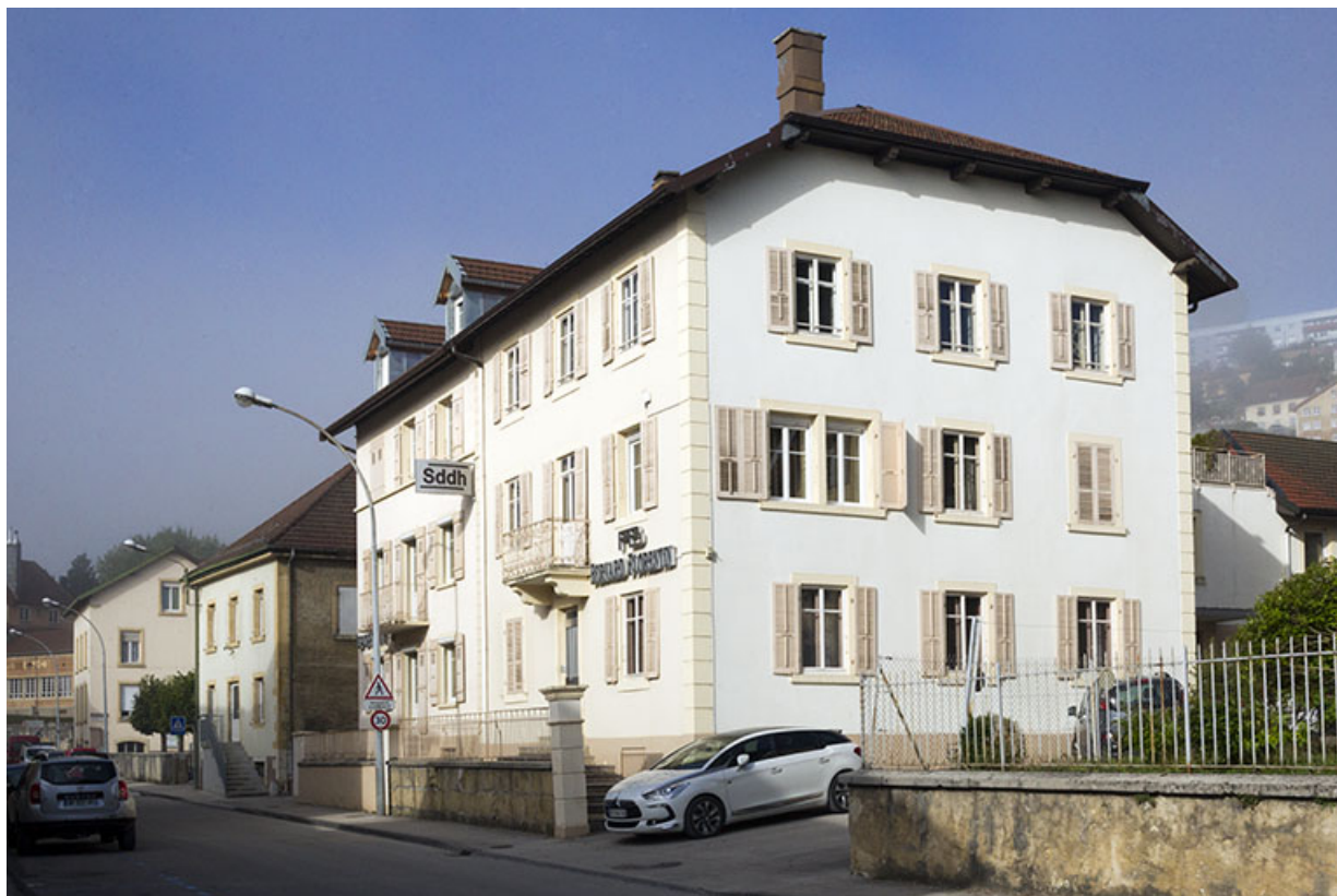
Façades antérieure et latérale droite. 25, Morteau, 26-28 rue de la Chaussée