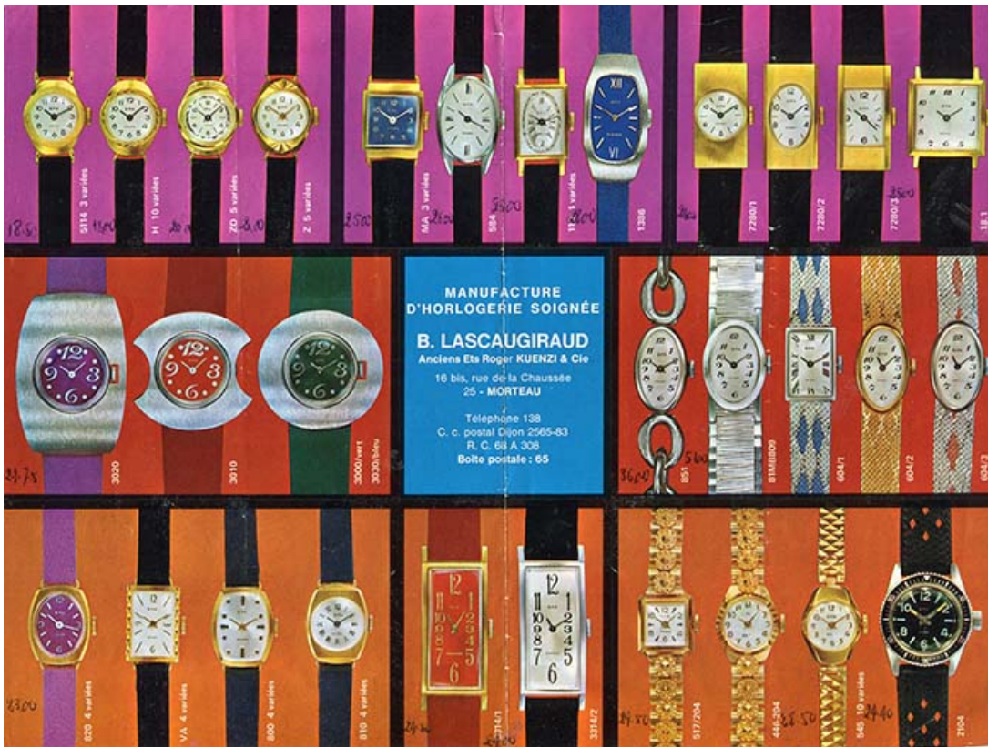
Manufacture d'Horlogerie soignée B. Lascaugiraud [dépliant : verso], 3e quart 20e siècle. 25, Morteau