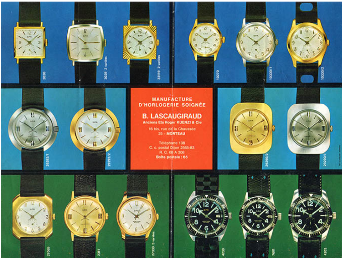
Manufacture d'Horlogerie soignée B. Lascaugiraud [dépliant : recto], 3e quart 20e siècle. 25, Morteau, 26-28 rue de la Chaussée