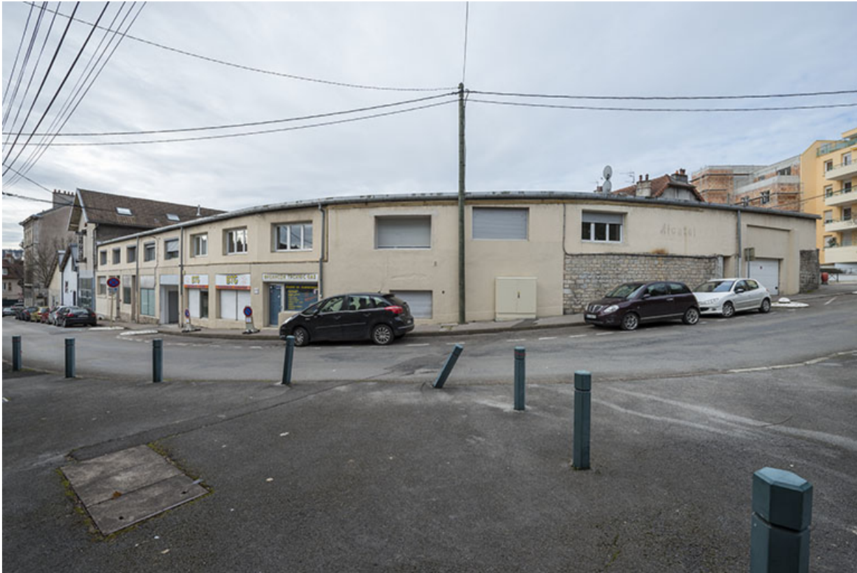
Partie nord des ateliers, dans le haut de la rue.