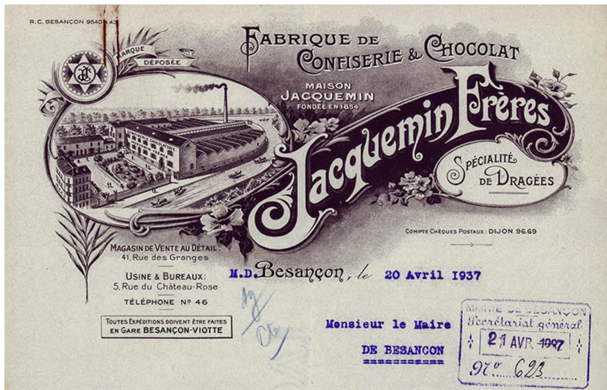
Fabrique de confiserie et chocolat Jacquemin Frères, papier à en-tête, 1937.