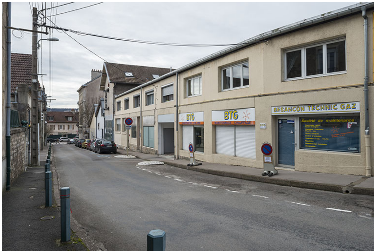
Vue d'ensemble depuis le haut de la rue. 25, Besançon, 5-7 rue du Château-Rose