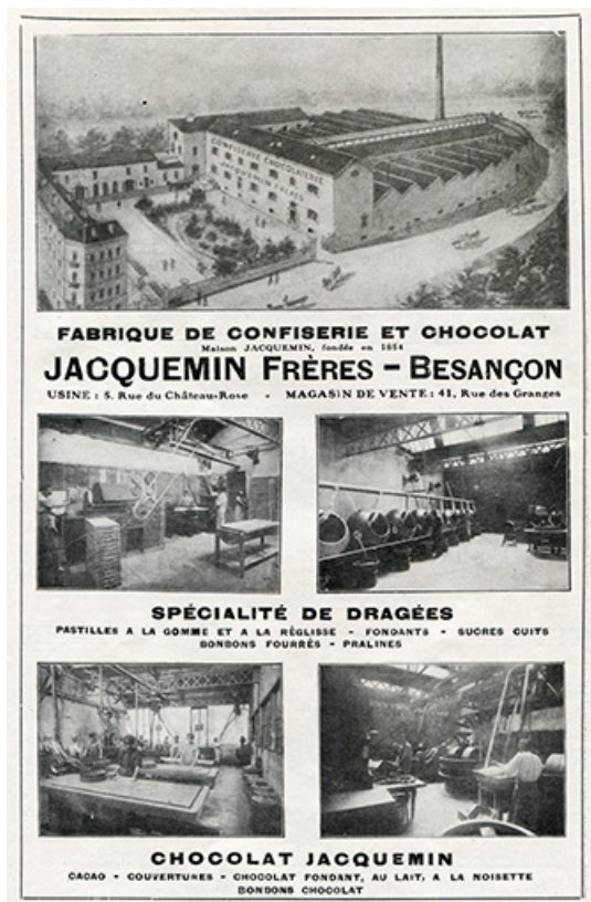
Jacquemin Frères, page publicitaire, s.d. [1923]. 25, Besançon, 5-7 rue du Château-Rose