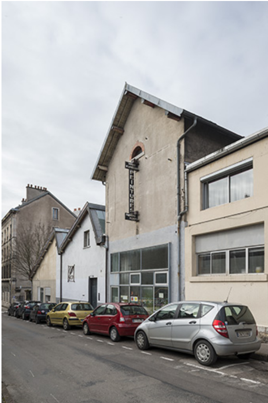
Pignons-est des bâtiments sur la rue.