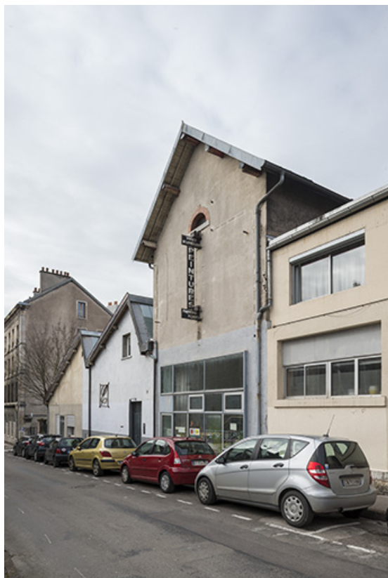
Pignons-est des bâtiments sur la rue. 25, Besançon, 5-7 rue du Château-Rose