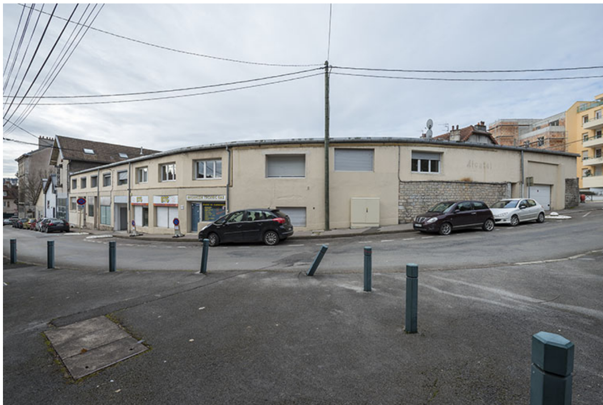
Partie nord des ateliers, dans le haut de la rue. 25, Besançon, 5-7 rue du Château-Rose