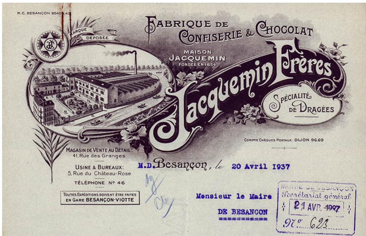
Fabrique de confiserie et chocolat Jacquemin Frères, papier à en-tête, 1937.