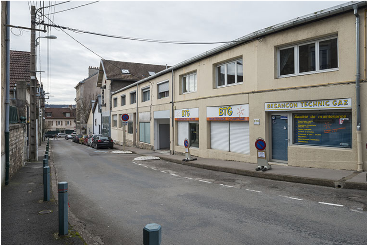
Vue d'ensemble depuis le haut de la rue.