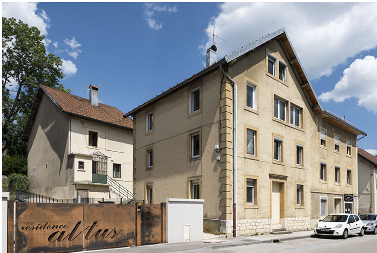
immeubles, usine d'horlogerie Jacquot-Louvet et atelier d'horlogerie Jean Guillemin, 12-14 rue de la Chaussée. 25, Morteau