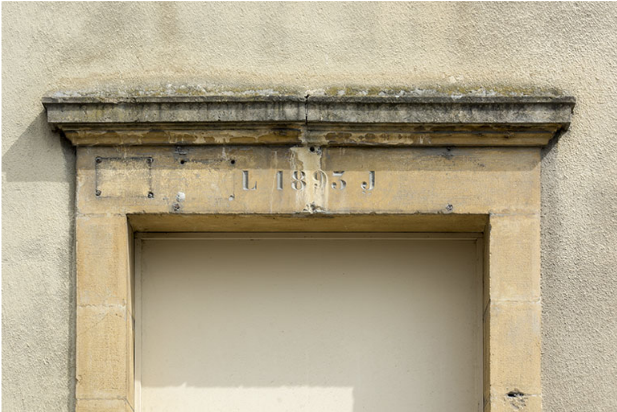
Bâtiment sur rue : linteau daté 1893.