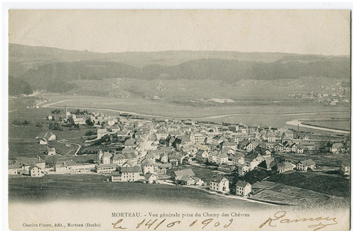
Morteau. - Vue générale prise du Champ des Chèvres [au nord-ouest], 1er quart 20e siècle [entre 1900 et 1903]. La maison est la dernière entièrement visible à droite au deuxième plan.