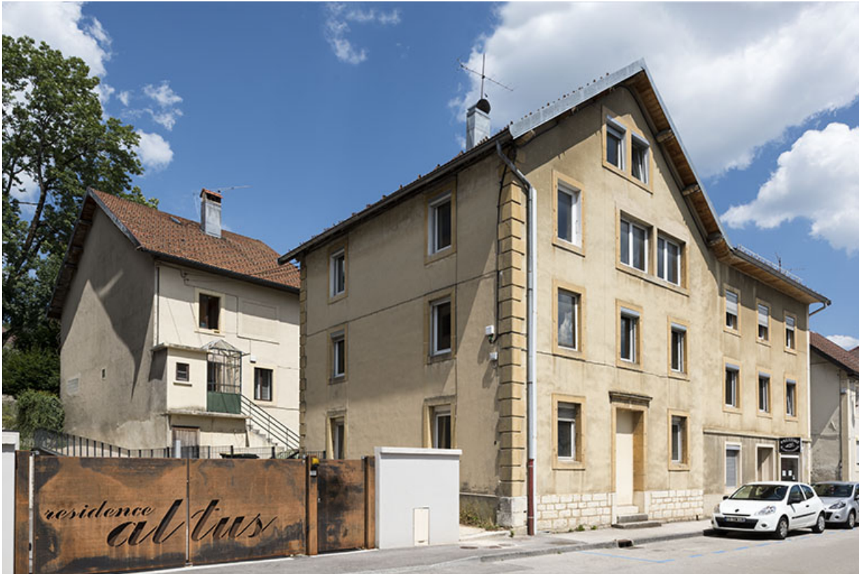
immeubles, usine d'horlogerie Jacquot-Louvet et atelier d'horlogerie Jean Guillemin, 12-14 rue de la Chaussée. 25, Morteau