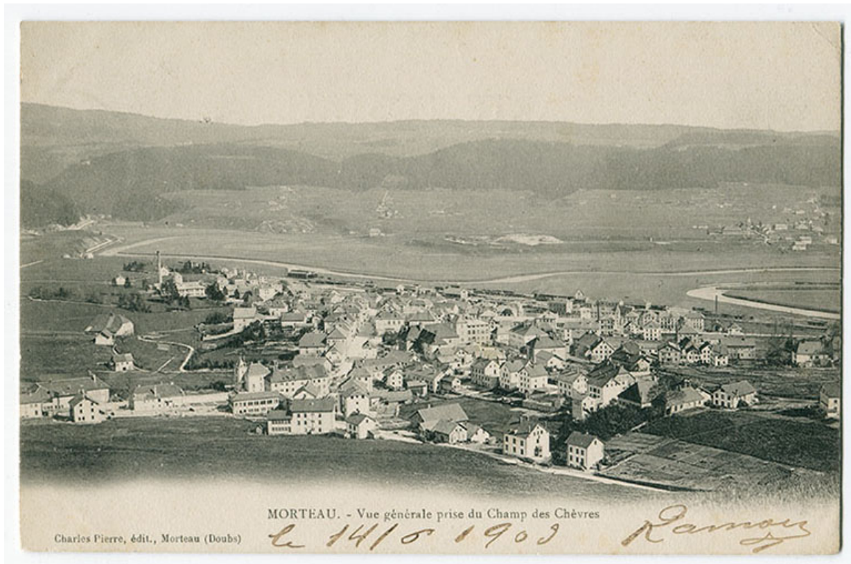
Morteau. - Vue générale prise du Champ des Chèvres [au nord-ouest], 1er quart 20e siècle [entre 1900 et 1903]. La maison est la dernière entièrement visible à droite au deuxième plan.