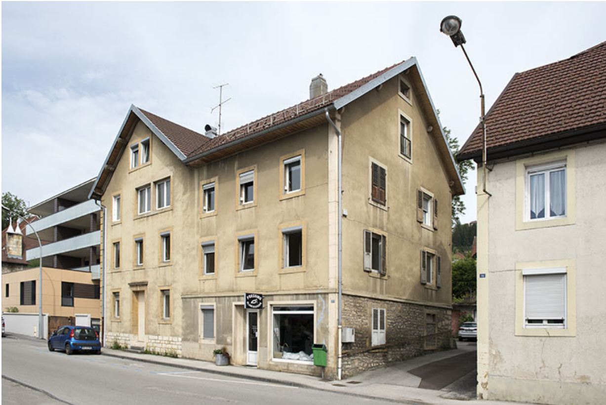
Bâtiment sur rue : façades antérieure et latérale droite.