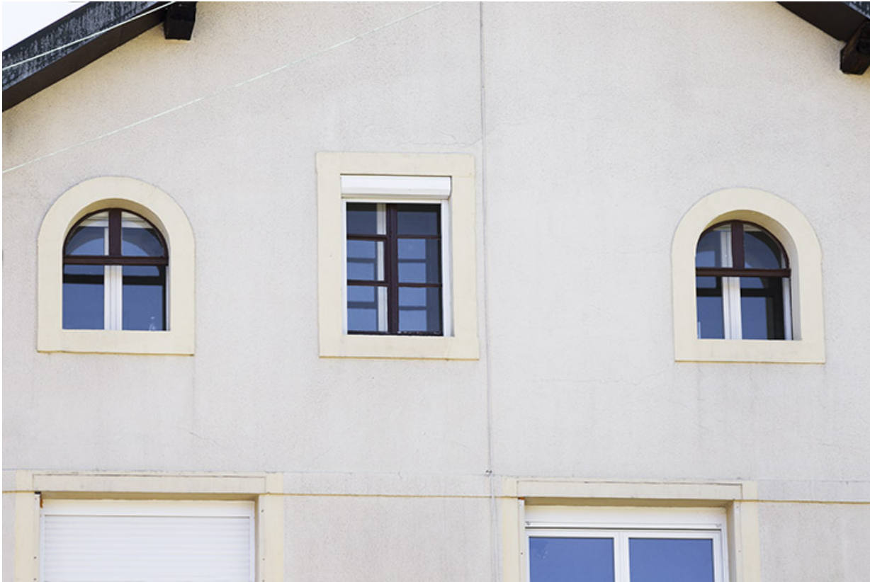
Bâtiment sur cour : baies de l'étage en surcroît.