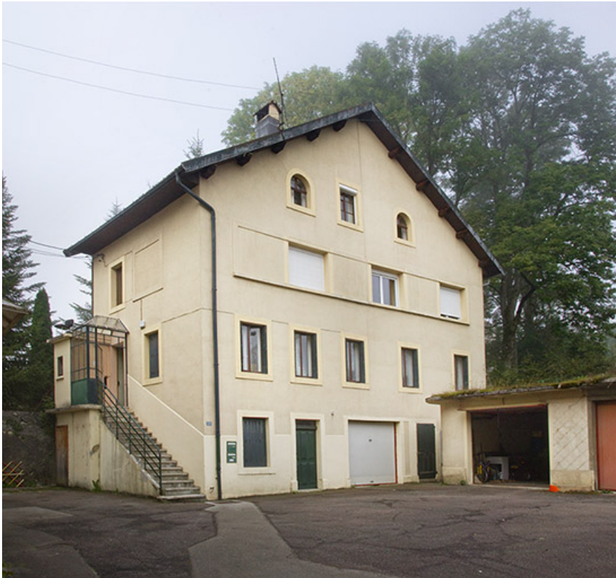
Bâtiment sur cour : façades antérieure et latérale gauche.