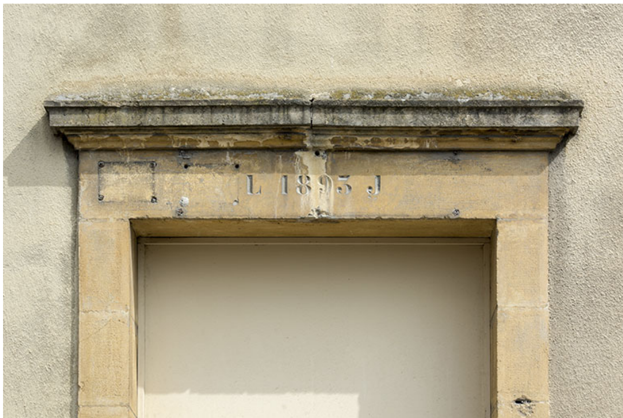
Bâtiment sur rue : linteau daté 1893.