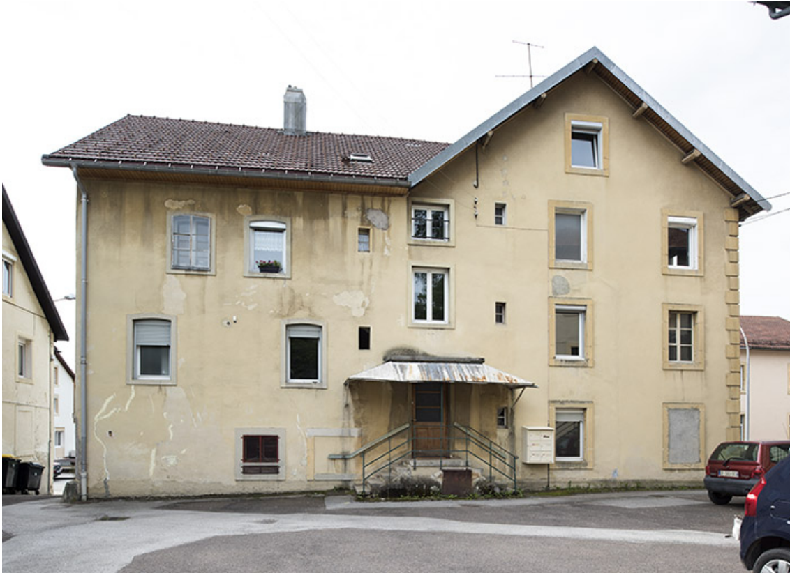
Bâtiment sur rue : façade postérieure.